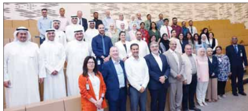
صورة جماعية على هامش المحاضرة

أفكارهم وآرائهم في بيئة العمل، وأخذ زمام المبادرة والقيادة، واستعرض الرومي بعض الاستراتيجيات لتحقيق النمو الشخصي والمهني بما يتوافق مع قيادة "المركز" على مدى 50 عام، نحو تعزيز مهارات التأثير الإيجابي لفرق العمل في الشركة ومع عملائنا وشركائنا، والتي لم تعد مهارات مفيدة فحسب، بل ضرورة حتمية لتعزيز الحضور الموسسي. وشدد الرومي على أهمية أن يرى كل فرد نفسه كقائد قادر على تحفيز التعاون والابتكار. وأوضح أيضاً كيف يمكن أن يودي التأثير الشخصي إلى التميز في الأداء والمساهمة في تحقيق نتائج أفضل للشركة. وتأتي هذه المحاضرة تأكيداً على أحد أهم الركائز الاستراتيجية التي يتبناها "المركز" المتمثلة في الاستثمار في العنصر البشري. ويجدير بالذكر أن المدرب عبد العزيز الرومي يتمتع بروية ثابتة في مجال القيادة والموارد البشرية، وهو مؤلف لأحد أكثر الكتب مبيعاً، وحصد الرومي الاعتراف من قبل مجلس المدريين المرموق في فوربس والمجلس الاستشاري لتقييم الأعمال بجامعة هارفارد.