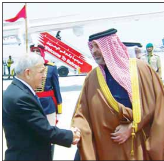
الرئيس المصري عبدالفتاح السيسي والعاهل الأردني الملك عبدالله الثاني والرئيس العراقي فؤاد حسين والشهيد العراقي محمد ولد الشيخ الغزواني أول الواملين إلى المنامة أمس للمشاركة في القمة العربية