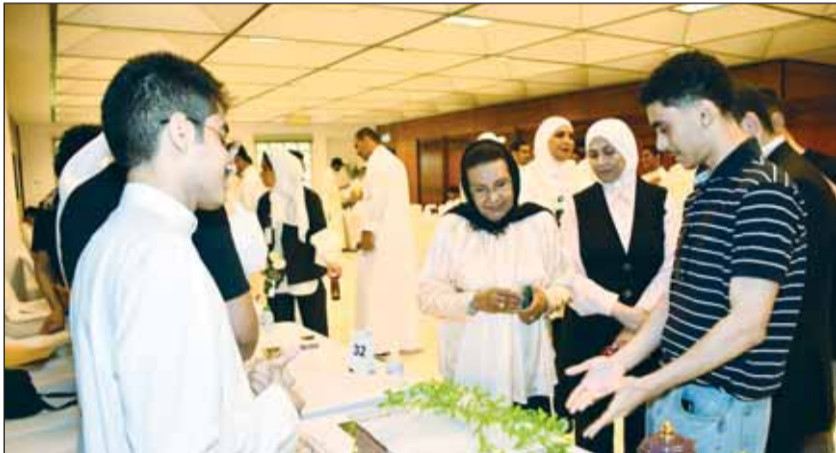
... وتستمع لشرح من أحد الطلاب عن فكرة مشروعه