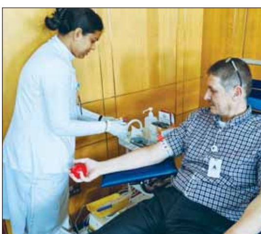
جانب من حملة التبرع بالدم

منفعة وأثر إيجابي للمجتمع، بالإضافة إلى حرص الشركة على تعزيز مخزون الدم الاستراتيجي لدى بنك الدم الكويتي والمساهمة في توفير وحدات الدم لتكون جاهزة للمرضى والمستشفيات. وتوجهت "الكويتية للاستثمار" بالشكر لجميع موظفيها الذين توافدوا للتبرع بالدم وبادروا بالمشاركة بهذا العمل الإنساني النبيل، الأمر الذي ساهم في إنجاح هذه الحملة. وفي ختام الحملة توجهت إدارة الشركة الكويتية للاستثمار بالشكر الجزيل إلى مسؤولي بنك الدم المركزي الذين بادروا بإرسال الفرق التبرعية الطبية وإظهار التعاون والمهنية العالية في الإجراءات والفحوصات الخاصة بعملية التبرع بالدم في مقر الشركة وكفاءتهم العالية في تنظيم هذه العملية مما ساهم بشكل كبير في إنجاح الحملة داخل مقر الشركة الكويتية للاستثمار.