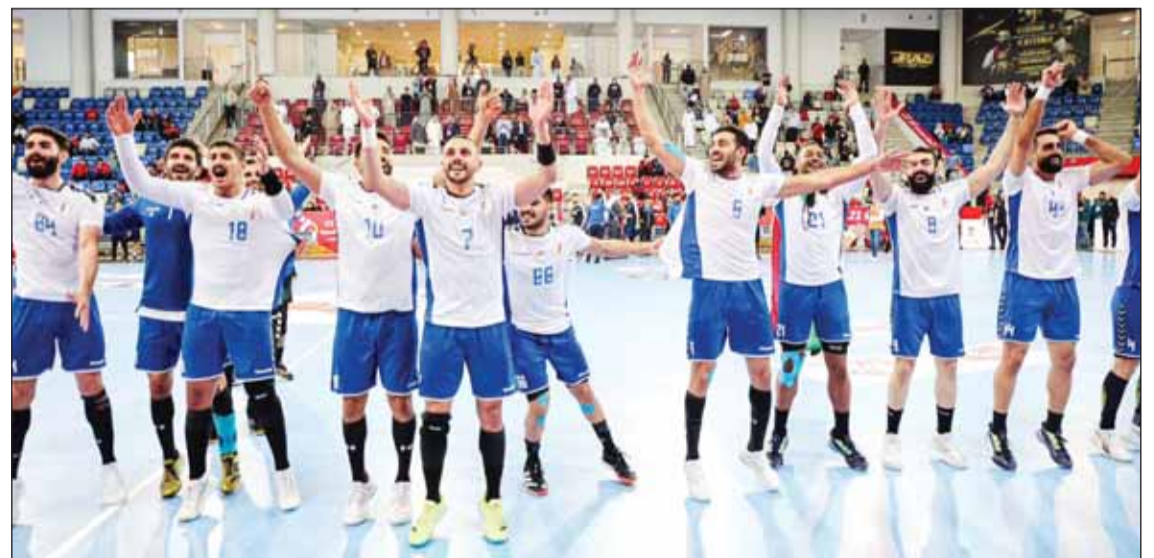
فردة لاعبي اليد بالتأهل للمونديال

ويملك سيتي بقيادة بيب غوارديولا 88 نقطة مقابل 86 لآرسنال وسيضمن كتابة التاريخ بالفوز بالمسابقة 4 مرات متتالية إذا فاز على وست هام يونايتد على أرضه يوم الأحد، بينما يستضيف آرسنال إيفرتون. وأصبح دي بروين ثاني أكثر لاعب صناعة للأهداف في تاريخ "البريمير ليغ" برصيد 112 هدفا من 259 مباراة بعد نجم مانشستر يونايتد ريان غيغز 162 هدفا من 632 مباراة.