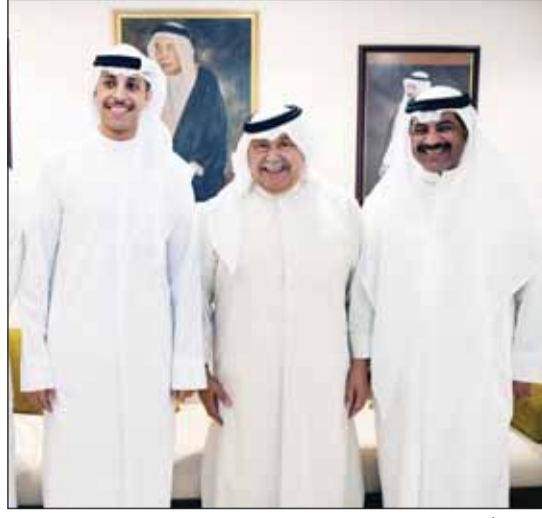
الفريق أول م. سليمان الفهد قدم التهاني