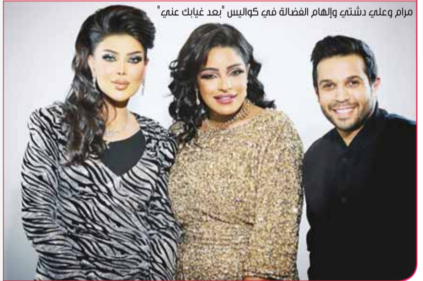
مرام وعلمية دشنتهم وإلهام الفضالة فمع كواليس "بعد غيابك عني"

وفيما يتعلق بالتشابه بين الشخصيات التي قدمتها، خصوصاً "فتحية" في "ملفات منسية" وشخصية "نوال" في مسلسل "بعد غيابك عني"، أوضحت أن الفرق كبير بين الشخصيتين ليس في "الكراتر"