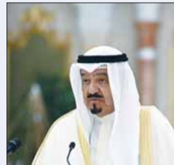
سمو الشيخ أحمد عبدالله