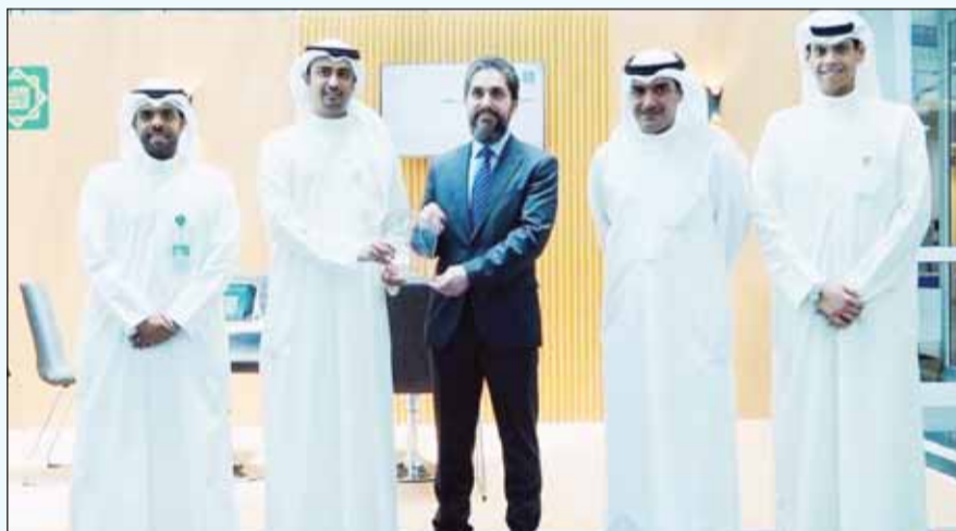
خلال تكريم بيتك للمشاركة في المعرض

اختتم بيت التمويل الكويتي "بيتك" مشاركته في معرض الفرص الوظيفية الـ 25 في جامعة الخليج للعلوم والتكنولوجيا (GUST) الذي أقيم على مدار ثلاثة أيام تحت رعاية وزير التربية وزير التعليم العالي والبحث العلمي الدكتور عادل العوداني. ومثل البنك فريق من قطاع الموارد البشرية من خلال جناح خاص بـ "بيتك" حيث تم استقبال العديد من طلبات التوظيف، كما تم الرد على جميع استفسارات الطلبة والطالبات الحاليين والخريجين، وحتى الطلبة الحاليين المهتمين بوظائف الدوام الجزئي.