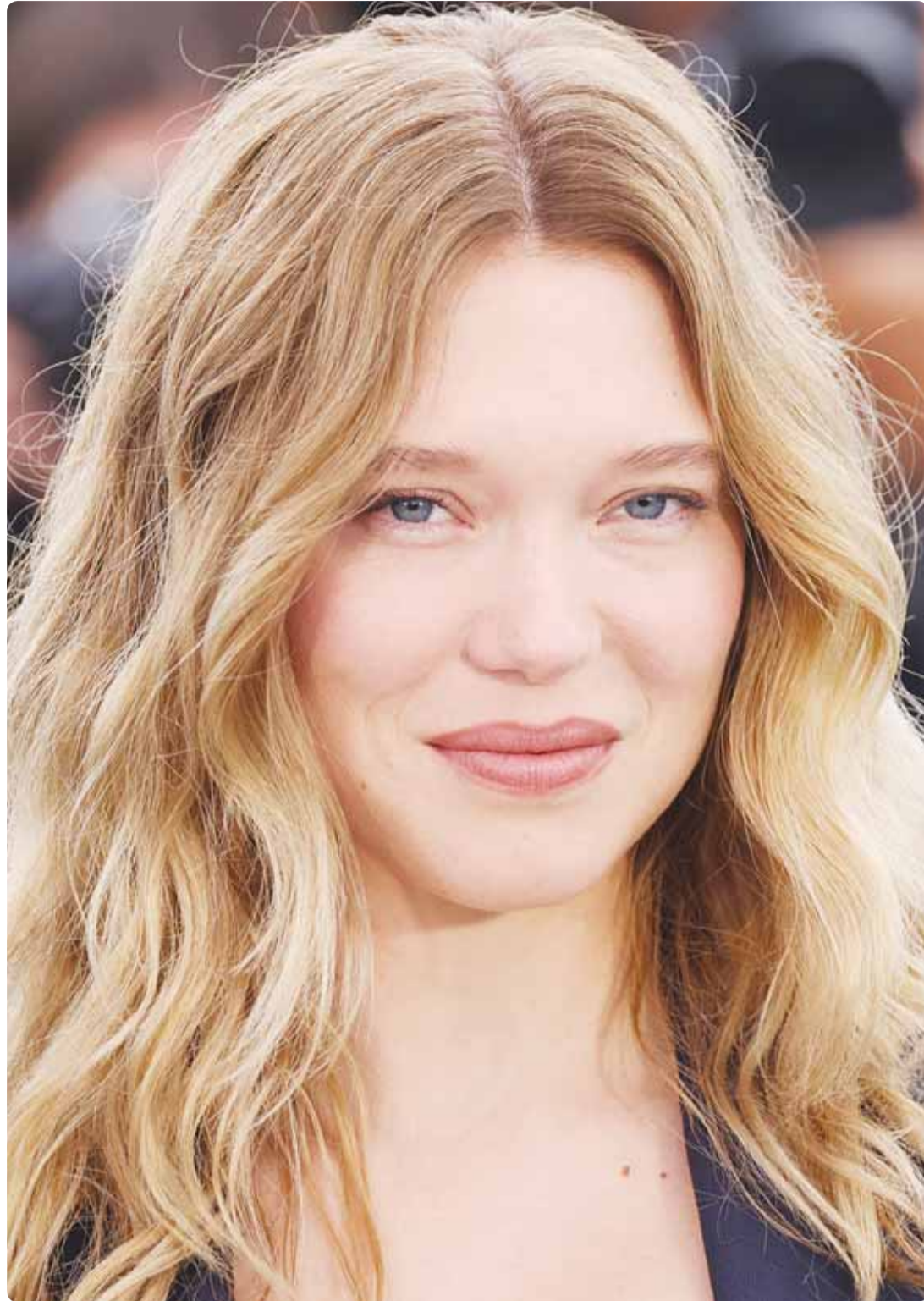
الممثلة الفرنسية لينا سيدو خلال حضورها افتتاح مهرجان كان السينمائي "ب.ا"

ومن الأمور التي يريدها مشاهدتها على أرض الواقع، إصلاح الطرق، وبأعلى المواصفات العالمية، وإصلاح التعليم من مناهج وطرق التدريس، والمرافق الصحية، وفرض هيبته