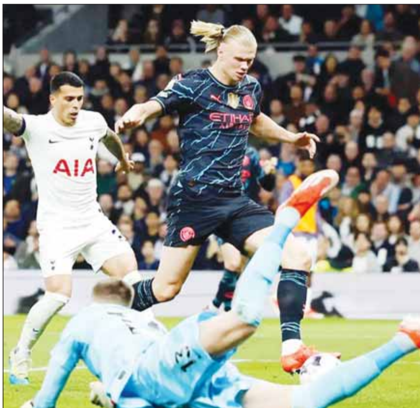
هالاند قاد السيتي لصدارة الدوري

وضعت ثنائية إيرلنغ هالاند فريقه مانشستر سيتي على مقربة من الفوز بالدوري الإنكليزي الممتاز للمرة الرابعة على التوالي وذلك بعد فوزه على مضيفه توتنهام 0-2 أول من أمس. وسجل المهاجم النرويجي الهدف الأول لفريقه في بداية الشوط الثاني وهدأت أعصاب سيتي في الوقت المحتسب بدل الضائع عندما سجل هدفه الثاني من ركلة جزاء رافعا رصيده إلى 27 هدفا. وفشل سيتي في الحصول على أي نقطة أو تسجيل أي هدف في أول أربع زيارات له في الدوري للملعب توتنهام الجديد لكنه أنهى هذا النقص في الوقت المناسب لإسعاد جماهيره.