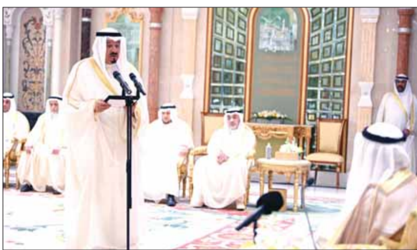
سمو الشيخ أحمد العبدالله يلقي كلمة أمام سمو الأمير

الضورية لتحقيق المصلحة العليا للبلاد وأهل الكويت الأوفياء؛ فلننا نعاهد سموكم على أن نعمل جاهدين لتنفيذها، وتكون منهاجاً لعملنا الوزاري، لتحقيق مزيد من التقدم والرفعة والاستقرار والأمن والأمان لوطننا.