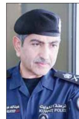
اللواء عبدالله الرجيب

■ أمال النائب الأول لرئيس مجلس الوزراء وزير الدفاع وزير الداخلية الشيخ فهد اليوسف اللواء عبدالله الرجيب إلى التقاعد اعتباراً من يوم أمس.