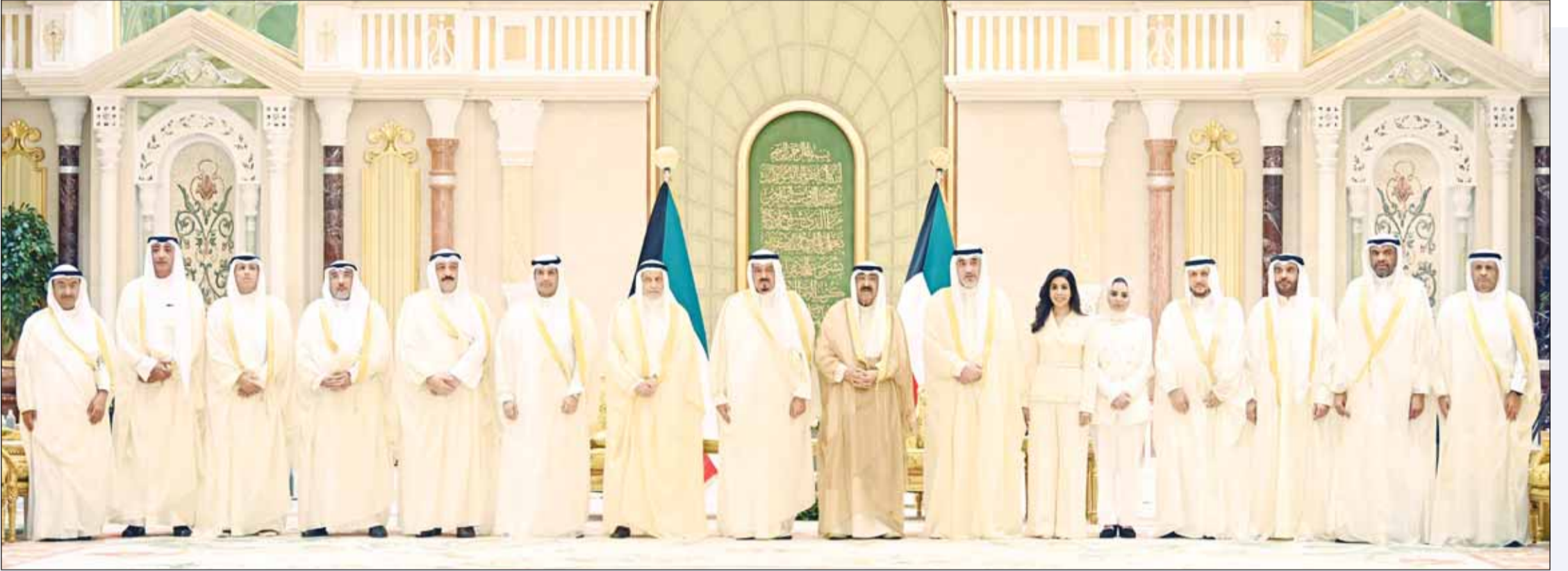
سمو الأمير الشيخ مشعل الأحمد متوسماً سمو الشيخ أحمد العبدالله رئيس مجلس الوزراء وأعضاء الحكومة عقب أداء القسم