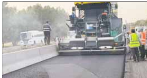
بدء الاستعانة بالمصنع المتنقل

مشيرا إلى أن استخدامه يضمن توافر أعلى المعايير العالمية في أعمال فرش الأسفلت. موضعا أن الهيئة ستلتزم جميع مقاوليها باستخدام تلك المعدة مستقبلا.