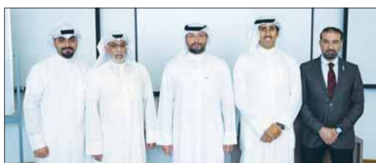
صورة جماعية على هامش ورشة العمل

العوامل التي يمكن أن تؤثر، بشكل مباشر أو غير مباشر، على قيمة العقارات، موضحاً أن هناك عوامل طبيعية وتنظيمية، وعوامل اقتصادية واجتماعية أيضاً.