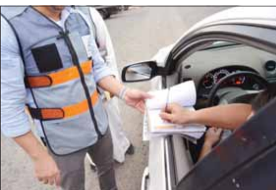
جانب من عملية التوزيع