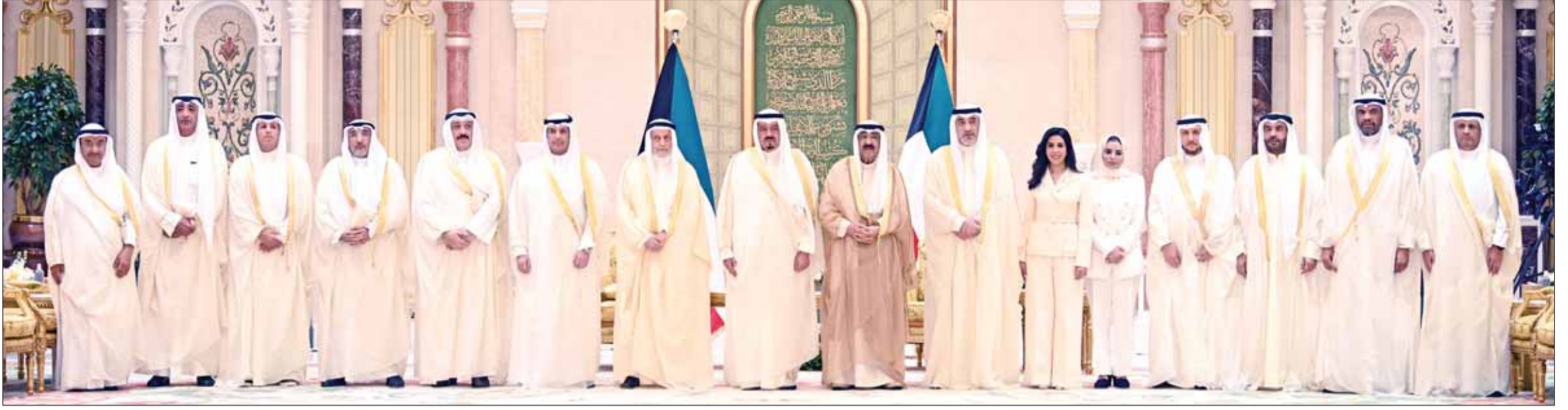
سمو الأمير الشيخ مشعل الأحمد وسمو الشيخ أحمد عبدالله بن طوسان أعضاء مجلس الوزراء