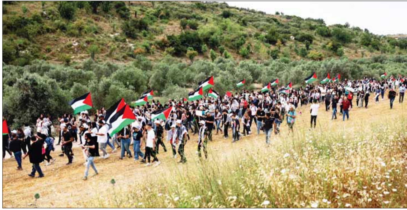
فلسطينيون من عرب إسرائيل خلال مسيرة العودة السنوية لإحياء الذكرى السادسة والسبعين للنكبة بالقرب من حيفا