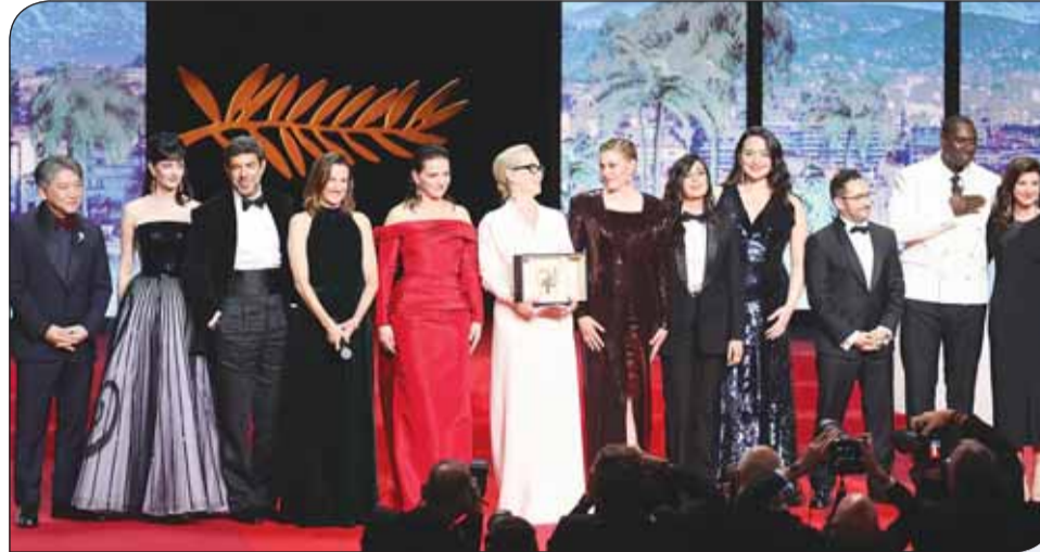
لجنة تحكيم المسابقة الرسمية