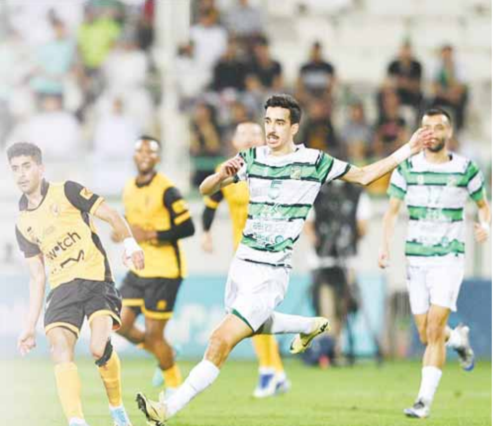
العربي والقادسية لنكسر "التعادل" ففي الدوري