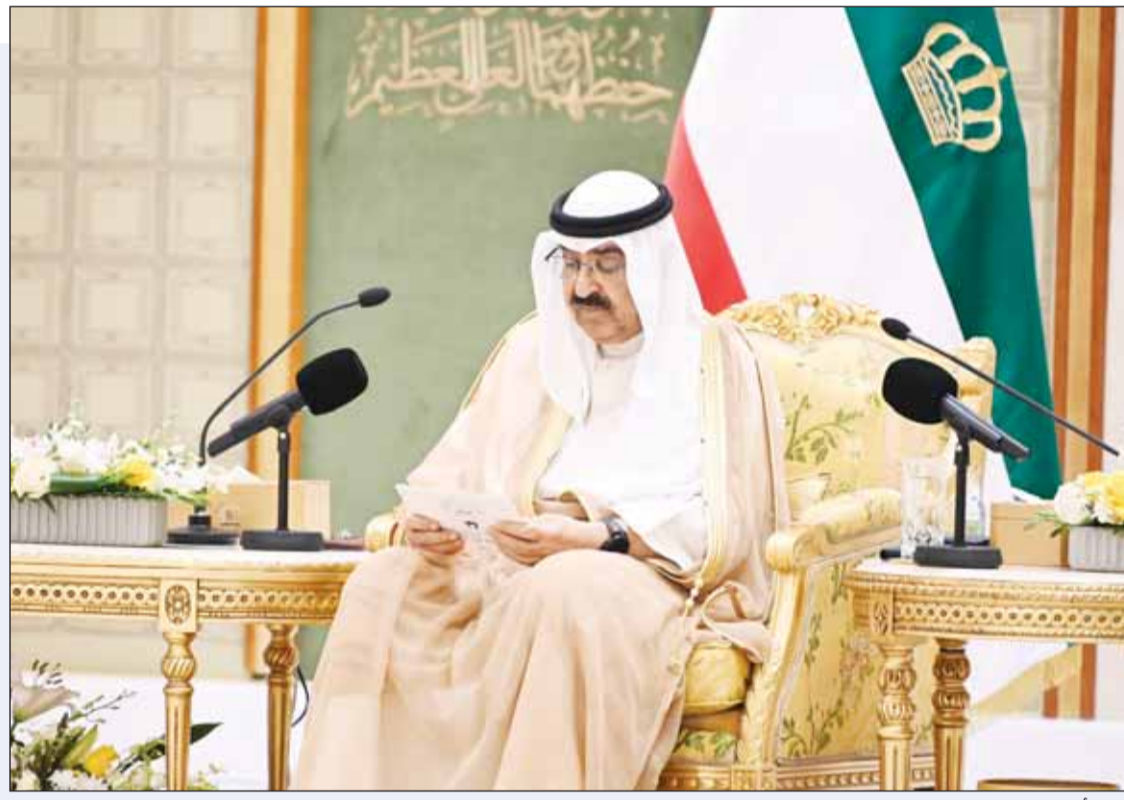
سمو أمير البلاد يلقي كلمته

ركزوا على متابعة الميدان بجولات تفقدية وأسرعوا في تنفيذ مشاريع تنموية