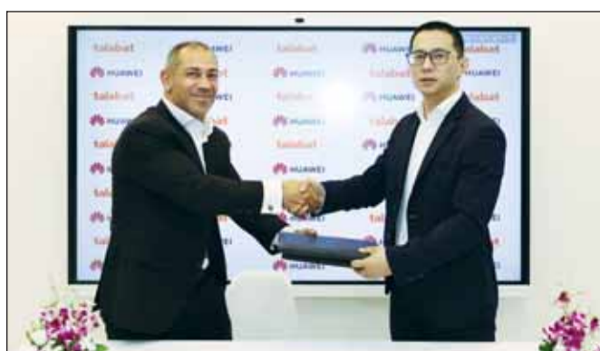
خلال تبادل عقود الشراكة

أجهزة هواوي، وهي مبادرة تُعد الأولى من نوعها لطلبات. تشكل الشراكة مع طلبات، المنصة