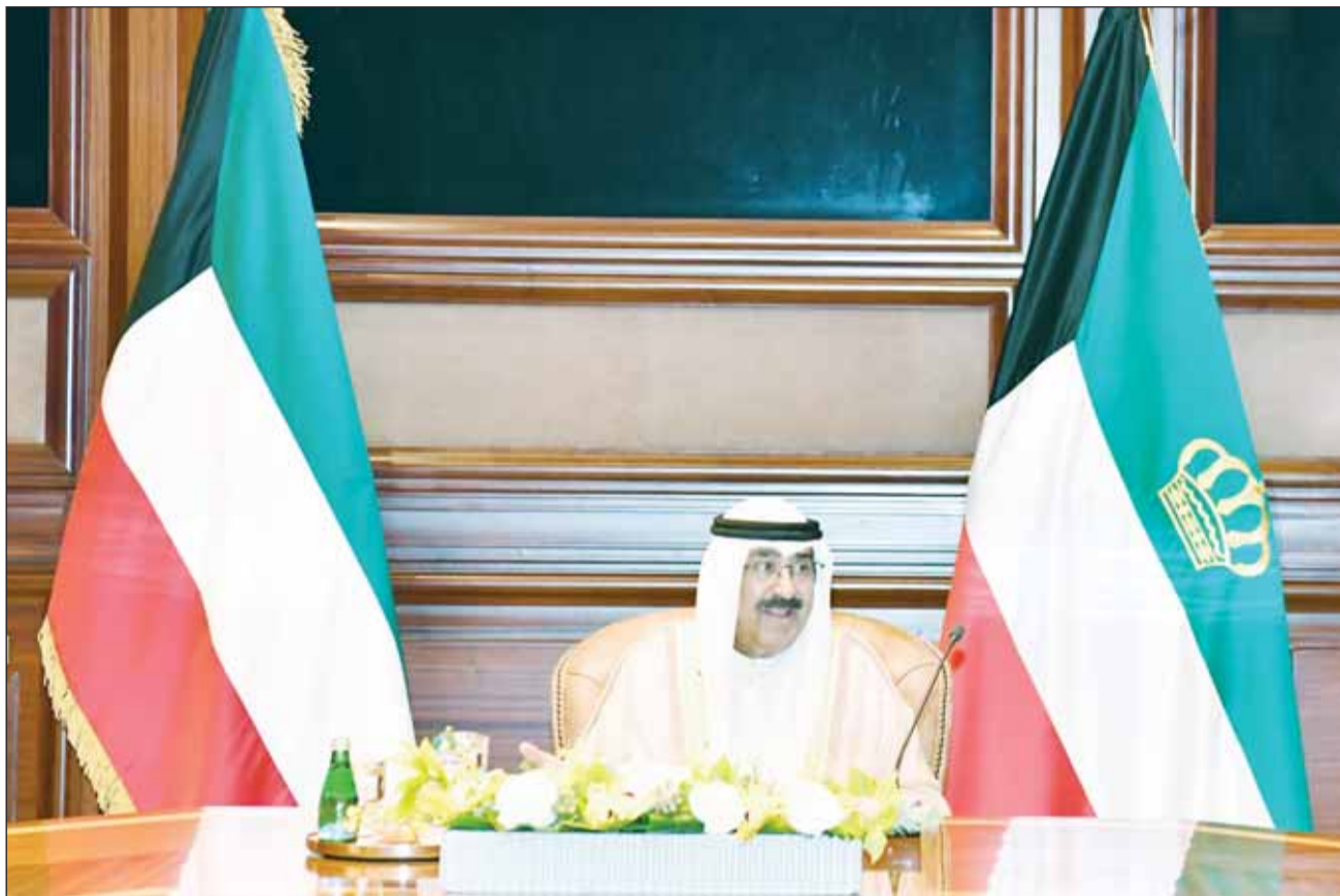
سمو الأمير الشيخ مشعل الأحمد مترأساً الاجتماع الاستثنائي لمجلس الوزراء

ترأس سمو أمير البلاد الشيخ مشعل الأحمد ظهر، أمس، اجتماعاً استثنائياً لمجلس الوزراء في قصر بيان بحضور سمو الشيخ أحمد العبدالله رئيس مجلس الوزراء والوزراء بعد أدائهم اليمين الدستورية أمام سمو الأمير. وقد أعرب سمو الأمير عن بالغ الشكر والتقدير لأخيه سمو الشيخ أحمد العبدالله رئيس مجلس الوزراء والوزراء بقبول تحملهم للمسؤولية وهنأهم على نيل الثقة. وشدد سموه على البدء في مرحلة جديدة من مراحل العمل الجاد والمسؤول والبقاء المستمر الا محدود لوطن له حقوق ومواطنين أقسمنا على الدود عن حرياتهم ومصالحهم وأموالهم. كما أكد سموه على ضرورة متابعة الحكومة في تنفيذ أعمالها ومشاريعها ومحاسبة من يقصر في أداء عمله والتوجيه إلى ما يلي: