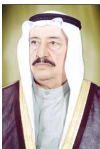
سمو الشيخ سالم العلي

والعطاء الصادق لتحقيق آمال وطموحات أبناء الكويت المخلصين. ودعا المولى عز وجل أن يتمتع بموفق الصحة وتتمام العافية وأن يحفظ الكويت العزيزة ويديم عليها وعلى شعبها نعم الأمن والأمان والاستقرار والتقدم والازدهار في ظل القيادة الحكيمة ذخراً للبلاد.