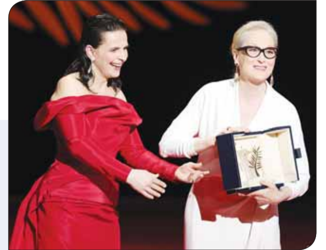
ميريل ستريب وجولييت بينوش