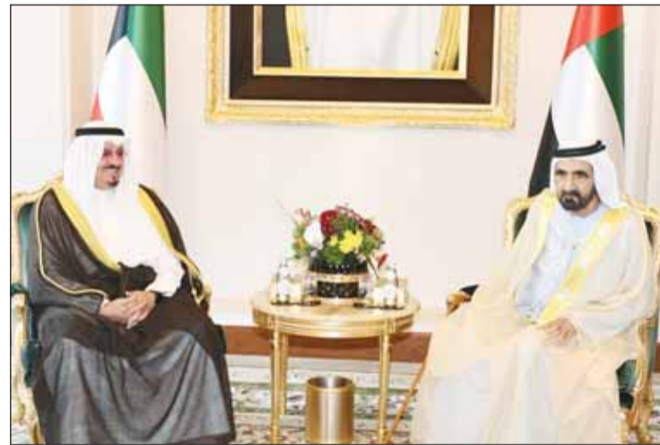
سمو الشيخ أحمد العبدالله خلال لقائه الشيخ محمد بن راشد

المنامة - "كونا". التقى ممثل سمو أمير البلاد الشيخ مشعل الأحمد سمو رئيس مجلس الوزراء الشيخ أحمد العبدالله، ولي العهد السعودي في المملكة العربية السعودية الشقيقة الأمير محمد بن سلمان بن عبدالعزيز آل سعود، وذلك على هامش مؤتمر مجلس جامعة الدول العربية الدورة العادية الثالثة والثلاثين على مستوى القمة العربية في العاصمة البحرينية "المنامة".