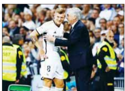
أنشيلوتي وكروس بقاء سابق

يُفكر كارلو أنشيلوتي مدرب ريال مدريد بالفعل في نهائي دوري أبطال أوروبا لكرة القدم أمام يوروسيا دورتموند وقال إن الفوز الكبير 5-0 صفر على الأفيس، في دوري الدرجة الأولى الإسباني كان تجربة قوية قبل النهائي الأوروبي في ويمبلي. ويعتقد أنشيلوتي أن فريقه، الذي فاز بالفعل بلقب الدوري الإسباني للمرة 36 ووصل إلى نهائي دوري أبطال أوروبا بعد تغلبه على بايرن ميونخ، في أفضل حالاته.