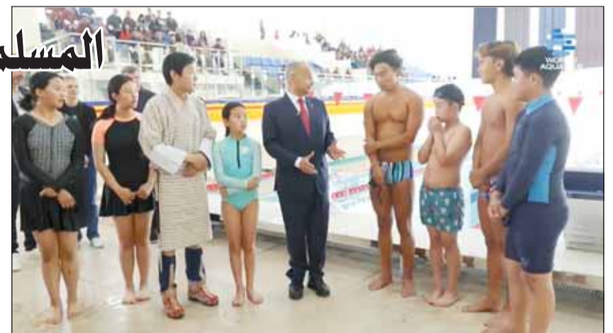
المسلم مفتحاً مركز الألعاب المائية

افتتح رئيس الاتحاد الدولي للسباحة حسين المسلم، مركز الألعاب المائية في مملكة بوتان، وذلك ضمن الخطة التي وضعتها الاتحاد الدولي لتطوير رياضة السباحة في قارة آسيا. ويعتبر مركز الألعاب المائية في مملكة بوتان، أول موض سباحة في العالم على ارتفاع 8400 قدم فوق سطح البحر بجبال الهملايا. كما أنه أول موض سباحة في مملكة بوتان المليئة بالأنهار والبحيرات والتي تسجل سنوياً نسبة كبيرة من حوادث الفرق. ويخدم موض مركز الألعاب المائية في بوتان لتعليم برنامج محو الأمية