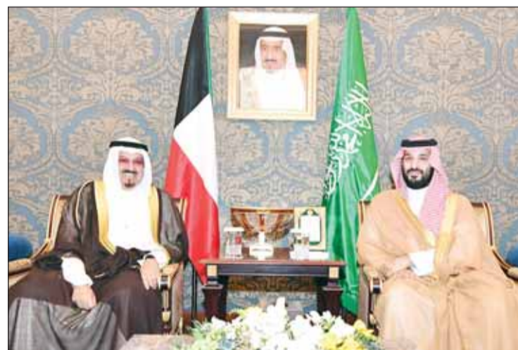
سمو الشيخ أحمد العبدالله خلال لقائه ولي العهد السعودي الأمير محمد بن سلمان