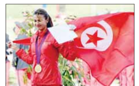
عودة تونس للمشاركة الخارجية

رفعت الوكالة الدولية لمكافحة المنشطات "وادا" العقوبات التي فرضتها على تونس قبل أسبوعين وأدت إلى اضطرابات في البلاد. وقالت "وادا" التي تتخذ من مونتريال الكندية مقراً لها إنها "تلقت تأكيداً بأن مرسومها حكومياً مطلوباً قد دخل حيز التنفيذ" وأن الوكالة التونسية لمكافحة المنشطات "نجحت في تحقيق التزاماتها لاستعادة الامتثال" من خلال توافرها قواعد الوطنية مع مدونة مكافحة المنشطات العالمية. وأزيلت الوكالة التونسية من لائحة غير الممتثلين للوكالة الدولية بمفعول فوري بعد التصويت من قبل اللجنة التنفيذية.