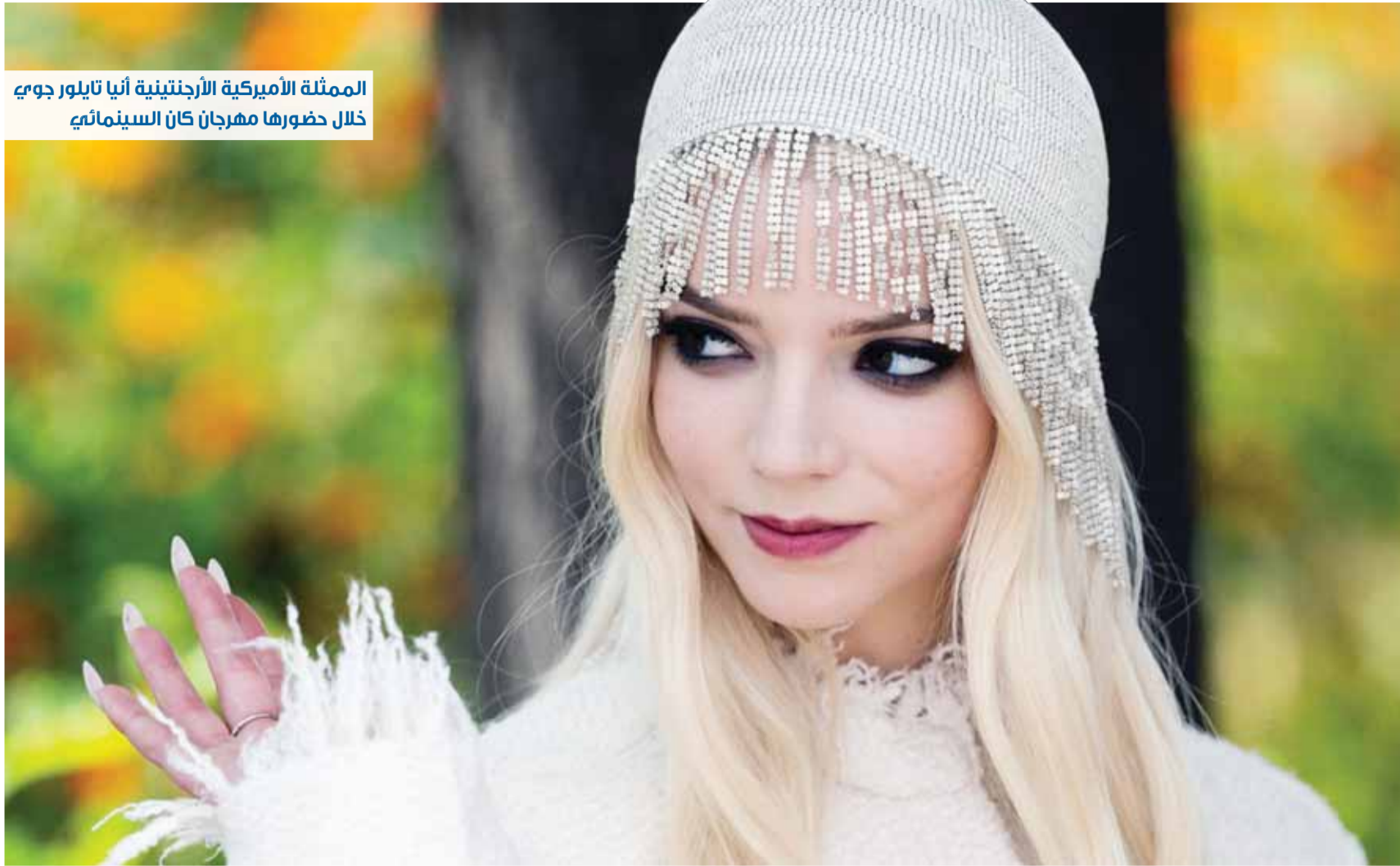
الممثلة الأميركية الأرجنتينية أنيا تايلور جوي خلال حضورها مهرجان كان السينمائي