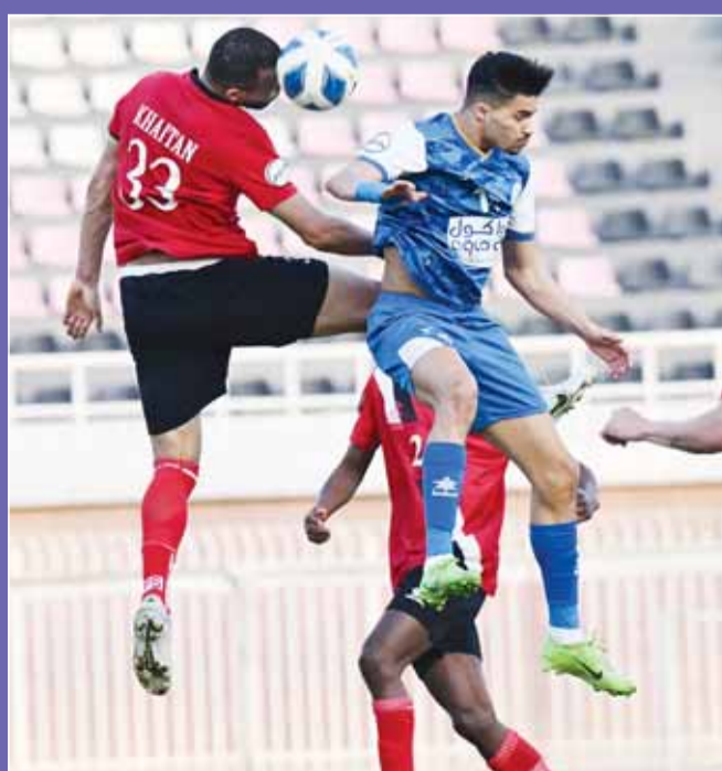
خيطان والشباب يتصارعان على بطاقة البقاء

لكنه يريد كسر عقده في النهائيات في موسمه الحالي الاستثنائي والذي عكرته خسارته الكبيرة أمام الوحدة 4-1.