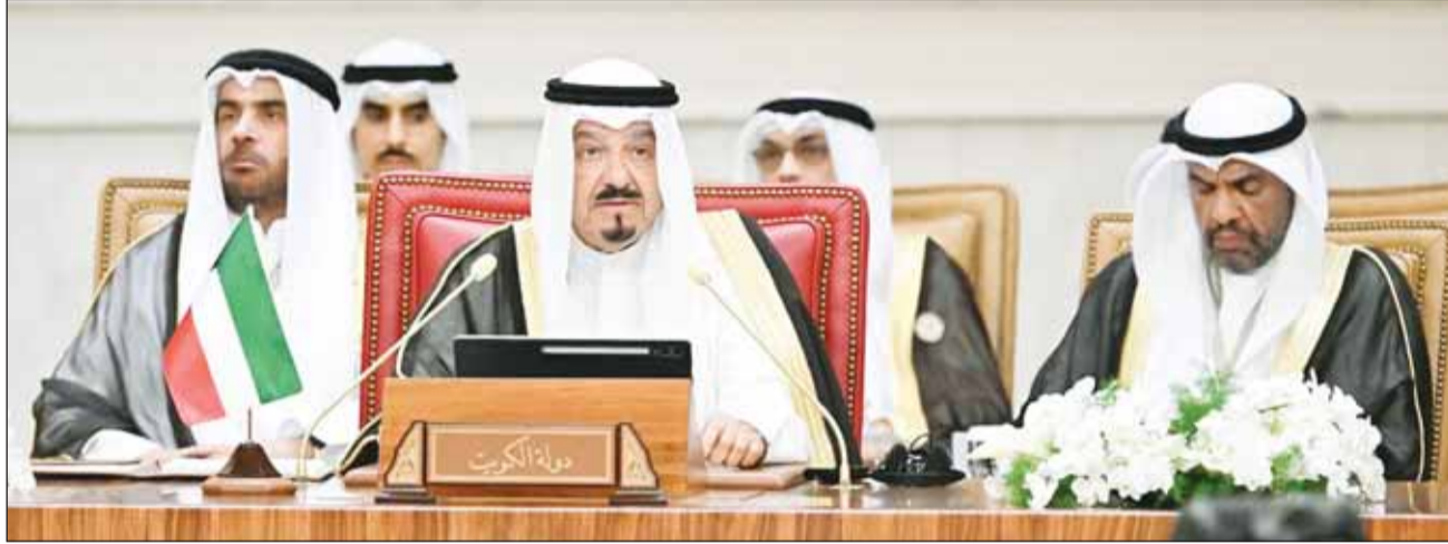
ممثل سمو الأمير الشيخ مشعل الأحمد سمو الشيخ أحمد العبدالله رئيس مجلس الوزراء متحدثاً في القمة العربية