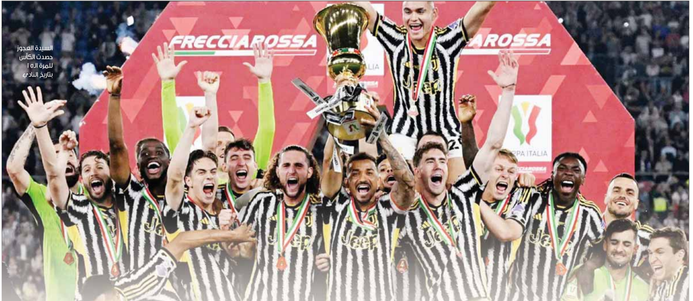
السيدة العجوز حصدت الكأس للمرة الواحدة بتاريخ النادي

أعلن الاتحاد البرازيلي لكرة القدم تأجيل منافسات الجولتين المقبلتين من الدوري البرازيلي بسبب الفيضانات التي اجتاحت جنوبي البلاد، والتي أسفرت حتى الآن عن وفاة 150 شخصاً وسقوط أكثر من 800 مصاب ونزوح ما يزيد عن 600 ألف آخرين، بينما لا يزال 108 أشخاص في عداد المفقودين. وأوضح الاتحاد البرازيلي في بيان أنه قرر تعليق منافسات البطولة المحلية مؤقتاً بعد التشاور مع الأندية الـ20 التي تتنافس في دوري الدرجة الأولى، وتلقي طلب من 15 منها لإيقاف البطولة حتى 27 مايو على الأقل. وكانت أندية جريميو وإنترناسيونال وجوفنتودي الواقعة في غراندي دو سول، الولاية الأكثر تضرراً من