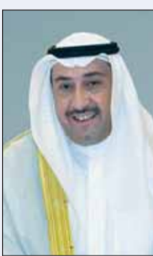
الشيخ فيصل الحمود

علمنا حفاقا بين الأمم والشعوب في مختلف الميادين سواء المحلية أو العالمية، مشددا على حرصه الدائم على متابعة كافة الشباب من الجنسين وتحفيزهم وتشجيعهم لمواصلة الانجازات من خلال استقبالهم وتكريمهم حيث إن ألوبنا مفتوحة أمام الجميع. وأكد الحمود أن المرأة هي إحدى ركائز المجتمع، لاسيما أنها شريك فاعل في جميع الميادين وبمختلف التخصصات، لافتا إلى أن المرأة الكويتية تحولات أرفع المناصب وأثبتت كفاءة عالية في مختلف المواقع، وكانت ومازالت مبادرة ومقدمة. ولفت إلى أن دولة الكويت تولي اهتماما كبيرا وفضا بتعزيز وتفصيل دور المرأة، من خلال توفير سبل التعليم والثقافة والمعرفة، فضلا عن منحها جميع الحقوق السياسية والاقتصادية والاجتماعية.