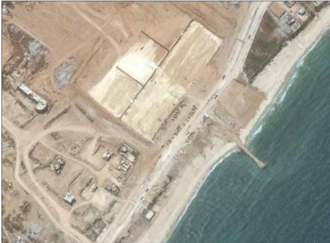
الرصيف البحري لإيصال المساعدات إلى قطاع غزة والذي أعلنت الولايات المتحدة الأميركية جهوزيته أمس

ضد نعتياها، قائلا "يجب القيام بالشيء الصحيح من أجل البلاد بأي ثمن"، قال نعتياها في أول رد على غالات، "لست مستعداً لاستبدال حكم حماسستان بقمحستان، معتبرا القضاء على "حماس" دون أي ذرائع الشرط الأول بشأن اليوم التالي، ولن تدخل أي جهة للإدارة المدنية لشؤون غزة وبالتأكيد ليس السلطة الفلسطينية، بينما قال وزير المالية الإسرائيلي المتطرف يتسلييل سموتريتش، "غالات يريد إدخال السلطة الفلسطينية لغزة على حساب دماء جنودنا، في إطار مصالحه بين منظمة التحرير وحماس"، مطالبا نعتياها أن يخبر غالات بين تنفيذ سياسة الحكومة أو الاستقالة، مشيرا إلى أن غالات أعلن فعليا دعمه لإقامة دولة فلسطينية كمكافأة للإرهاب و"حماس".