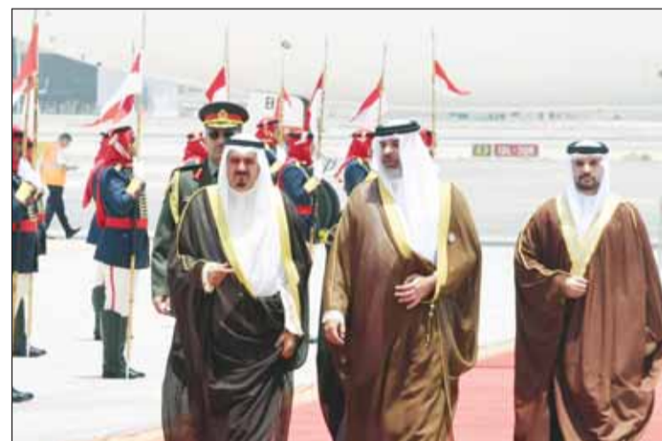
ممثل سمو الأمير لدى وصوله البحرين وشمع استقباله الممثل الشخصي للعاهل البحريني

حضر اللقاءات أعضاء الوفد الرسمي المرافق لممثل سموه.