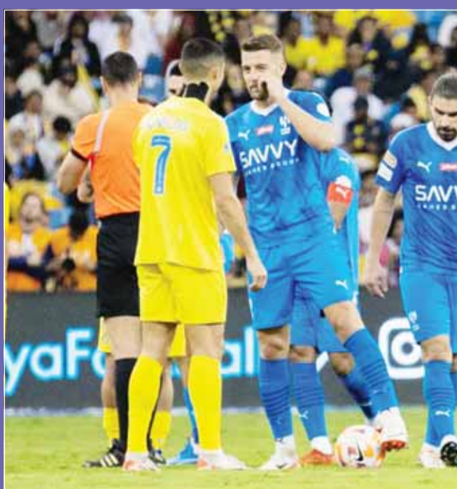
اللقاء يتجدد بين رونالدو وسافيتش

ويحتضن ملعب الأول بارك، الجمعة، مباراة "الديربي" التي يسعى من خلالها النصر لتحقيق فوز يمنحه الثقة قبل موقعة الكأس، بالإضافة إلى إلحاق أول هزيمة محلية هذا الموسم بالهلال الساعي في المقابل لمواصلة انتصاراته من أجل إنهاء الدوري بلا هزيمة. كما يلغتي اليوم ضحك مع الفيفا، ويستقبل الاتفاق ضيفه الأندلس. وتستكمل الجولة غداً، بمواجهات الاهلي مع أبها، والتعاون مع الشباب، والحزم مع الرياض. واعان الهلال مشاركة قائده في التدريبات قبل مباراة النصر المرتقبة في الدوري السعودي للمحترفين. وذكر الهلال في بيان رسمي اليوم الأربعاء أن سلمان الفرج، لاعب وسط الفريق، عاد للتدريبات الجماعية التي خاضها الفريق، ما يشير إلى جاهزيته للديربي.