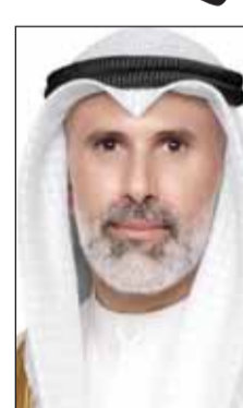
الشيخ جراح الجابر

يتمثل فرصة لإظهار الجهود الوافعية التي تبذلها المرأة الكويتية. ولفت إلى أن "المرأة الكويتية تميزت في العديد من المجالات الاجتماعية والسياسية والفكرية والثقافية وكانت رائدة فيها في الوزارة والمديرة والطبيبة والمهندسة و الديبلوماسية وذلك على سبيل المثال لا الحصر وهذا مبعث فخر لنا جميعا".