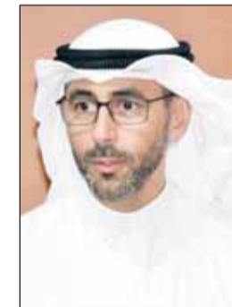
الشيخ نواف الصباح

أكد الرئيس التنفيذي لمؤسسة البترول الشيخ نواف سعود الخالص الصباح امس الخميس مضي القطاع النفطي قدماً في تمكين المرأة باعتبارها نموذجاً يحتذى في التفاني والمثابرة والابداع.