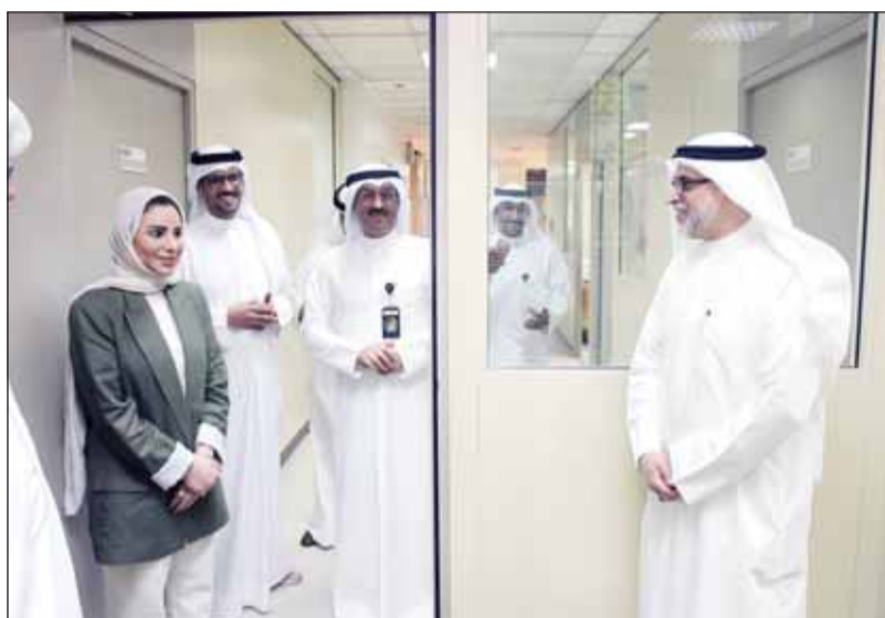
وزيرة الشؤون د. أمثال الحويلة خلال تفقدها قطاعات الوزارة

وهو تحقيق مصلحة البلاد والعباد وتحقيق التنمية الشاملة التي تستحقها الكويت تحت قيادة سمو أمير البلاد الشيخ مشعل الأحمد. وتمنت وزيرة زيارة الشيخ فراس المالك،