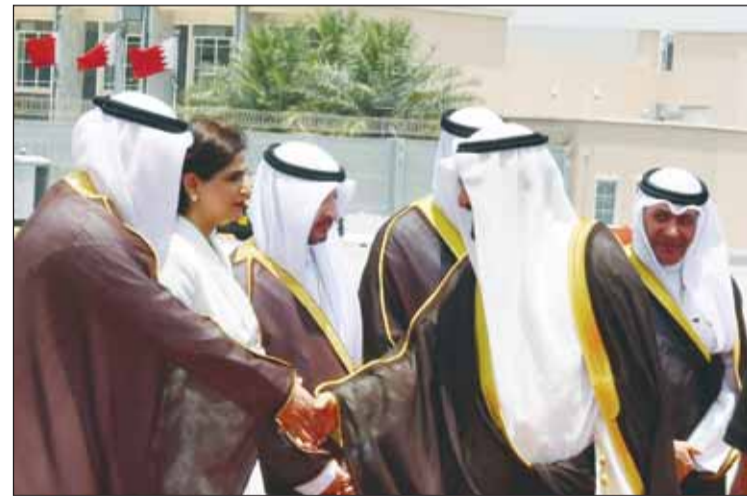
سمو الشيخ أحمد العبدالله مصافحاً مستقبلياً

الرسمي المرافق وصل صباح أمس، إلى مملكة البحرين، وكان في استقبال ممثل سموه على أرض المطار رئيس مجلس الوزراء بالإتانة وزير الدفاع ووزير الداخلية الشيخ فهد اليوسف ونائب رئيس المجلس الوطني الشيخ فيصل النواف ووزير شؤون الديوان الأميري الشيخ محمد العبدالله ونائب رئيس مجلس الوزراء ووزير الدولة لشؤون مجلس الوزراء شريدة المعشري ونائب رئيس مجلس الوزراء ووزير النفط الدكتور عماد العتيقي وكبار المسؤولين في الدولة.