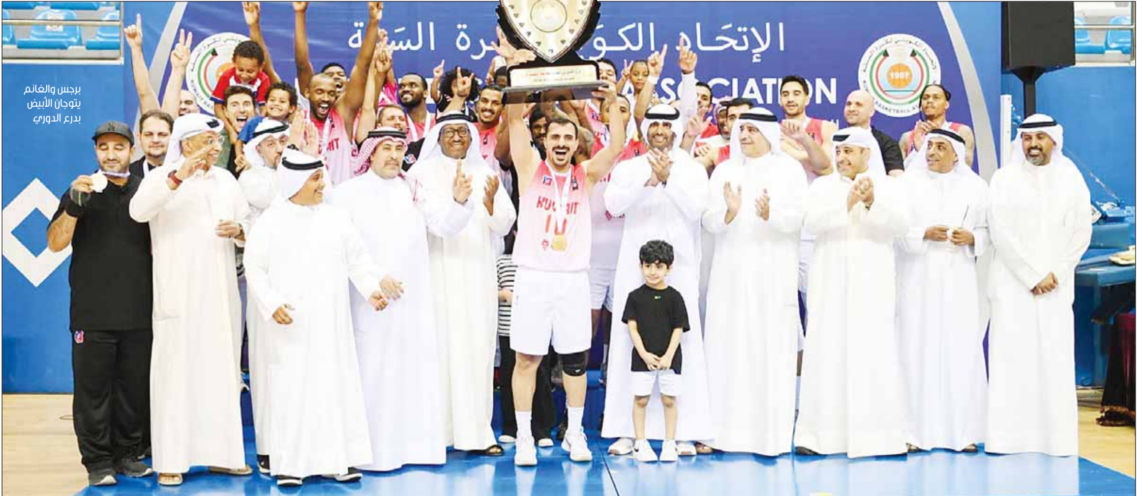
برجس والغانم يتوجان الأبيض بدرع الدوري