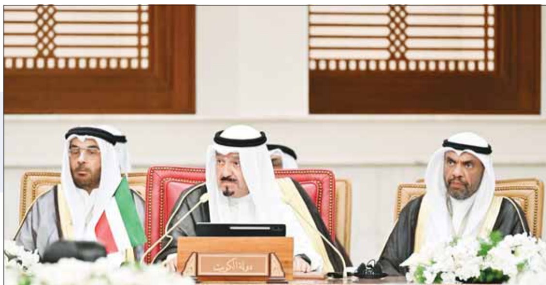
ممثل سمو الأمير سمو رئيس مجلس الوزراء الشيخ أحمد العبدالله يلقي كلمة الكويت خلال مؤتمر القمة العربية

نوكد على مبادئ الحوار والحلول السلمية واحترام سيادة الدول والعهود والمواثيق