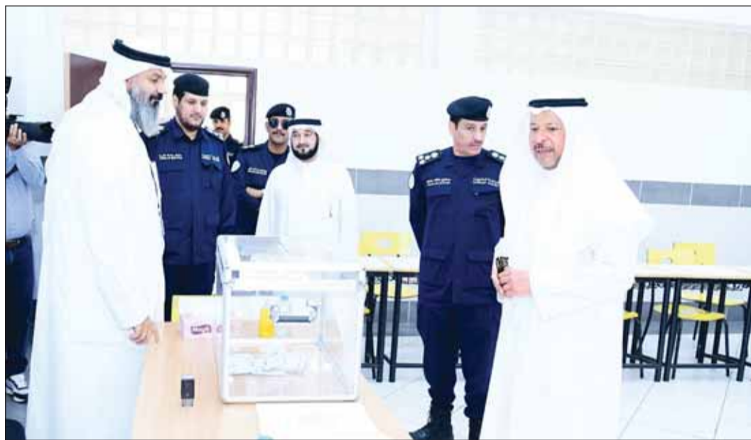
محافظ الفروانية خلال تفقده سير العملية الانتخابية

تفقد وزير العدل ووزير الأوقاف والشؤون الإسلامية الدكتور محمد الوسمي مراكز الاقتراع للانتخابات التكميلية للمجلس البلدي 2024 للاطمئنان على توافر الخدمات الإدارية والتنظيمية اللازمة لضمان سهولة سير العملية الانتخابية وتدليل عواقبها. وأعرب عن خالص شكره وتقديره للجهود التي يقوم بها أعضاء السلطة القضائية بتضافر جهود جميع العاملين في وزارات العدل والداخلية والتربية والصحة والجهات المعنية الأخرى لتسهيل وتسير العملية الانتخابية بأفضل صورة.