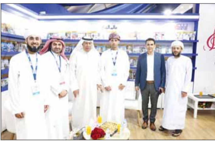
السفير عبداللطيف الجيحا خلال زيارته المعرض الدولي للكتاب في الرباط

■ الرباط - كونا، أكد سفير الكويت لدى المغرب عبداللطيف الجيحا أهمية مشاركة المؤسسات الثقافية ودور النشر الكويتية وبخاصة المجلس الوطني للثقافة والفنون والآداب في المعارض العربية والدولية للكتاب لإبراز النهضة الثقافية والفكرية في دولة الكويت. وقال السفير الجيحا في تصريح لوكالة الأنباء الكويتية (كونا) خلال زيارته أمس، للمعرض الدولي للنشر والكتاب بالرباط في دورته الـ 29، «دولة الكويت وعت منذ وقت مبكر أهمية الدور الذي تضطلع به الثقافة في تعزيز مكانتها وترسيخ جاذبيتها ونفوذها خاصة في الدول العربية..