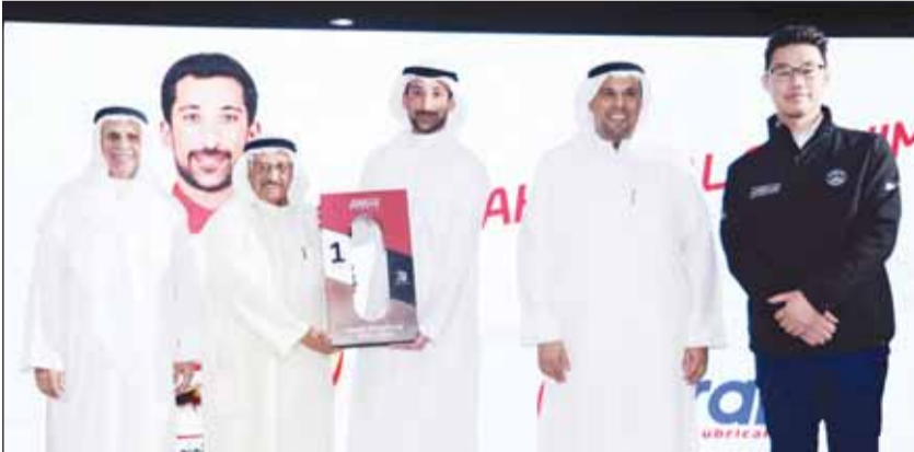
صورة جماعية خلال التكريم

■ اختتمت بطولة كأس جي آريارس في الكويت بنسختها الأولى، أول بطولة من نوعها في منطقة الشرق الأوسط، أطلقتها شركة مؤسسة محمد ناصر السايبر وأولاده في نوفمبر الماضي، بدعم من شركة تويوتا موتور كوربوريشن وبالتعاون مع مدينة الكويت لرياضة المحركات وشركة سافكس.