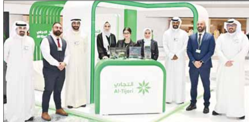
فريق البنك التجاري

■ في إطار حرص البنك التجاري الكويتي على إطلاع جمهور العملاء على منتجاته وخدماته المصرفية الرقمية المصممة لتلبية احتياجات جميع العملاء، فضلاً عن جهوده في مجال التثقيف والتوعية المالية، تواجدهم في العاصمة مول خلال جناحاً له بهدف تعريف رواد المجمع بالمزايا والخدمات والحلول المصرفية التي يقدمها البنك التجاري الكويتي.