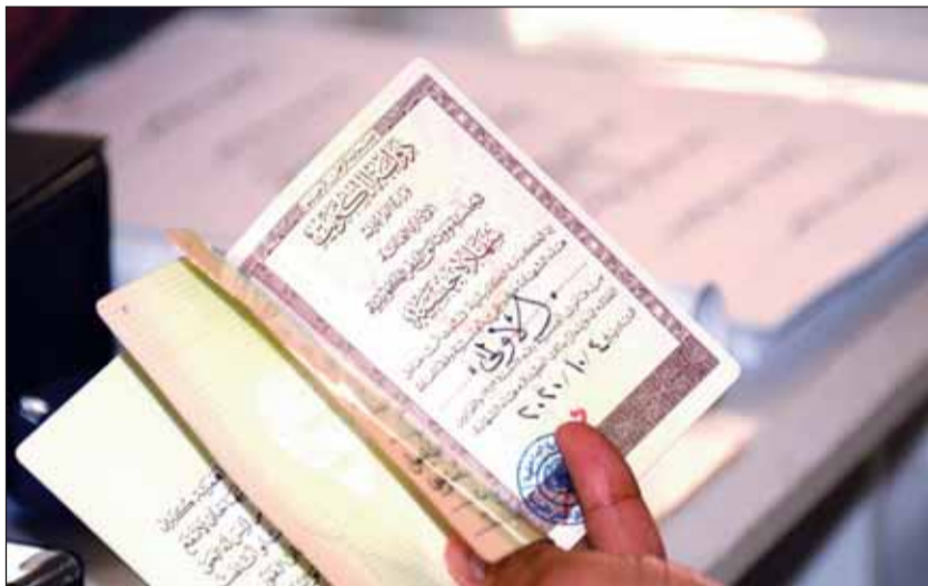
الجنسية... أحد متطلبات التصويت

العمر: اللجنة استقبلت صوتاً نسائياً واحداً فقط منذ بدء التصويت حتى بعد ساعتين من فتح باب الاقتراع