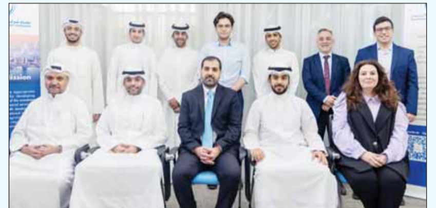
المشاركون في البرنامج

نظم مركز دراسات الاستثمار التابع لاتحاد شركات الاستثمار برنامجاً تدريبياً مكثفاً بعنوان Real Estate Valuation Methods & Techniques Used by Expert، وذلك بمقر الاتحاد، وذلك بهدف تزويد المتدربين بالمعرفة والمهارات اللازمة لتقييم دقيق لمختلف أنواع العقارات، حيث اكتسب عملية تقييم العقارات أهمية متزايدة بسبب تنوع خصائص العقارات السكنية والتجارية والأراضي وشركات الاستثمار العقاري. ويضمن التقييم العقاري الدقيق اتخاذ قرارات استثمارية صائبة سواء كنت تفكر بشراء عقار أو بيعه أو الاستثمار في أسهم شركة مدرجة في مجال الاستثمار العقاري.