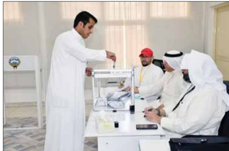
الشباب تحملوا المسؤولية وبادروا بالتصويت في الفردوس