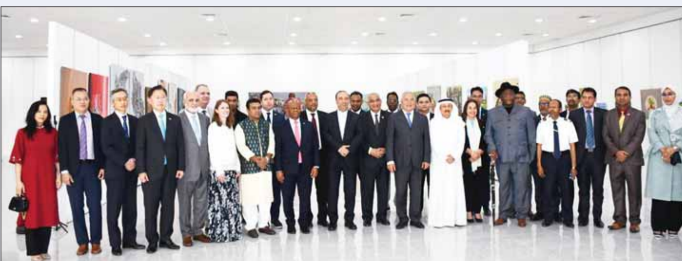
سفير بنغلاديش ام ديم عشيق الزمان ورئيس جمعية الفنانين الكويتية عبد الرسول سلمان مع عدد من السفراء والديبلوماسيين خلال حفل الافتتاح

■ نظمت سفارة بنغلاديش لدى الكويت وجمعية الفنون الكويتية، وبشكل مشترك، معرضاً فنياً، لمدة أربعة أيام في جمعية الفنون الكويتية في حولي، للاحتفال بمرور 50 عاماً «اليوبيل الذهبي» للعلاقات البنغلاديشية الكويتية. افتتح المعرض سفير بنغلاديش اللواء، المقتاعد، ام دي عشيق الزمان ورئيس جمعية الفنانين الكويتية عبد الرسول سلمان، الاربعاء الماضي. حضر حفل الافتتاح أكثر من 20 سفيراً من مختلف البلدان لدى الكويت، وأعضاء وفنانين