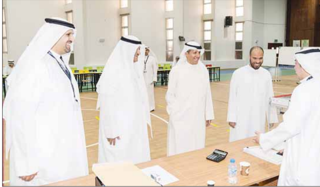
وزير العدل متفقداً سير العملية الانتخابية في أحد مراكز الاقتراع

أثنى عدد من الناخبين على جهود وزارات الداخلية والتربية والبلدية في تجهيز المدارس بهذا المستوى العالي، مؤكدين أن هذه الجهود ستساهم في إنجاح العرس الديمقراطي.