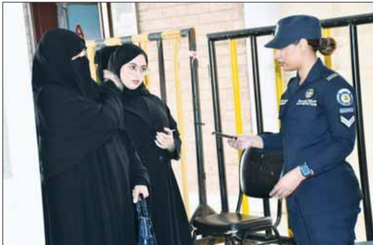
المرأة بكرت بالحضور في لجنة مدرسة الوليد بن عبدالمك الإبتدائية بنين

مع ساعات الصباح الأولى استعدت الفرق التابعة للجان المعنية والمسؤولة عن الانتخابات التكميلية للمجلس البلدي 2024 من وزارات الداخلية والبلدية والعدل والإعلام، لاستقبال الناخبين والناخبات في الدائرة السادسة التي يبلغ عدد لجانها 77 لجنة أصلية وفرعية موزعة على مناطق خيطان والفروانية والفردوس وضاحية الزهراء والصدوق والسلام والشهداء. وشهدت اللجان الانتخابية الذكور والإناث إقبالاً ضعيفاً بشكل لافت، وهو ما وصفه القضاة والمشرفون والمسؤولون عن اللجان بالمتوقع والمعتمد في انتخابات المجلس البلدي عموماً والتكميلية منها على وجه الخصوص، لاسيما مع ارتفاع حرارة الجو واختيار يوم السبت كموعدهم للانتخابات وهو يوم عطلة وراحة عادة ما يقل فيه الإقبال