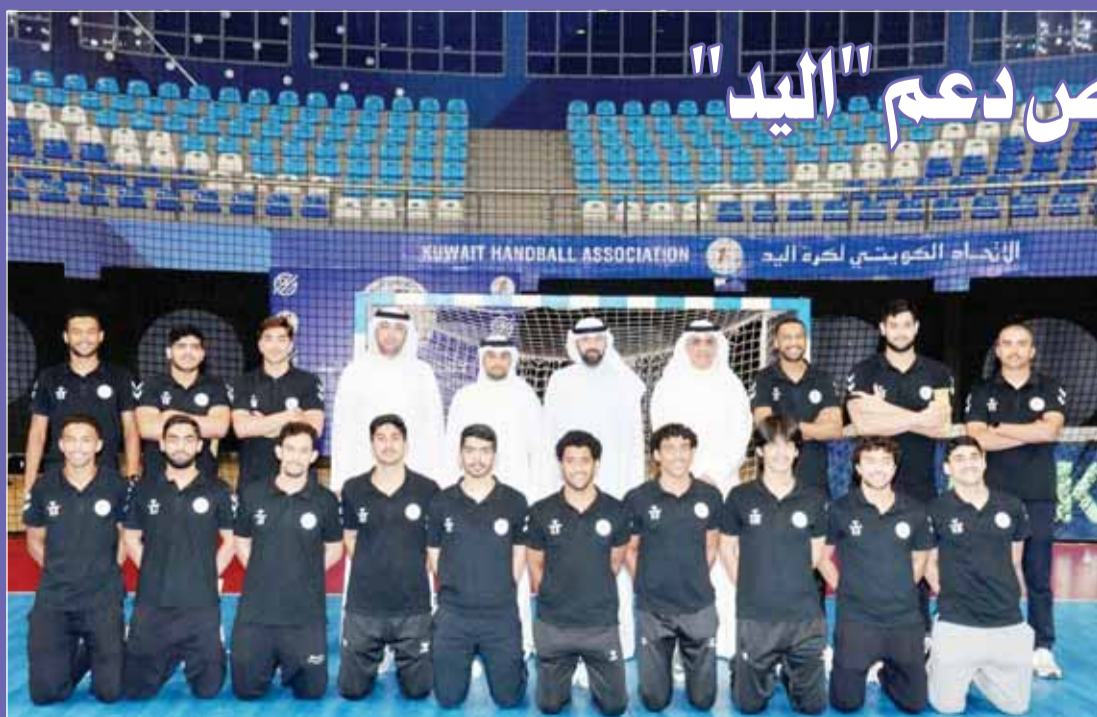
من تكريم منتخب الشباب والناشئين لليد

ويهيئ الشباب مع الجھراء إلى دوري الدرجة الاولى في الموسم المقبل 2024-2025.