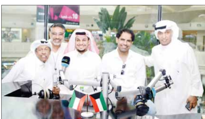
"شباب البومب" في ضيافة "مارينا"

بلقاء إذاعة وتلفزيون "مارينا" مع نجوم "شباب البومب"، تحدثوا خلاله عن مشوارهم الناجح في تقديم 12 جزءاً من المسلسل وتمضير الجزء الـ 13، بالإضافة إلى فيلم "شباب البومب"، الذي يعرض حالياً في دور السينما بالكويت، وسادت برنامج "الديوانية" في إذاعة "مارينا" أجواء المرح والتلقائية. من جهته أعرب الفنان فيصل العيسى، عن سعادته لتواجده مع زملائه في الكويت، وقال، عرفنا الكويت بفنون المسرح والدراما ونشعر بسعادة كبيرة هنا بعد كل هذه المفاولة من الجمهور، موضحاً أن فيلم "شباب البومب" قد شاهدته حتى الآن 160 ألفاً من جمهور الكويت ويتوقع زيادة كبيرة في عدد مشاهديه خلال أيام.