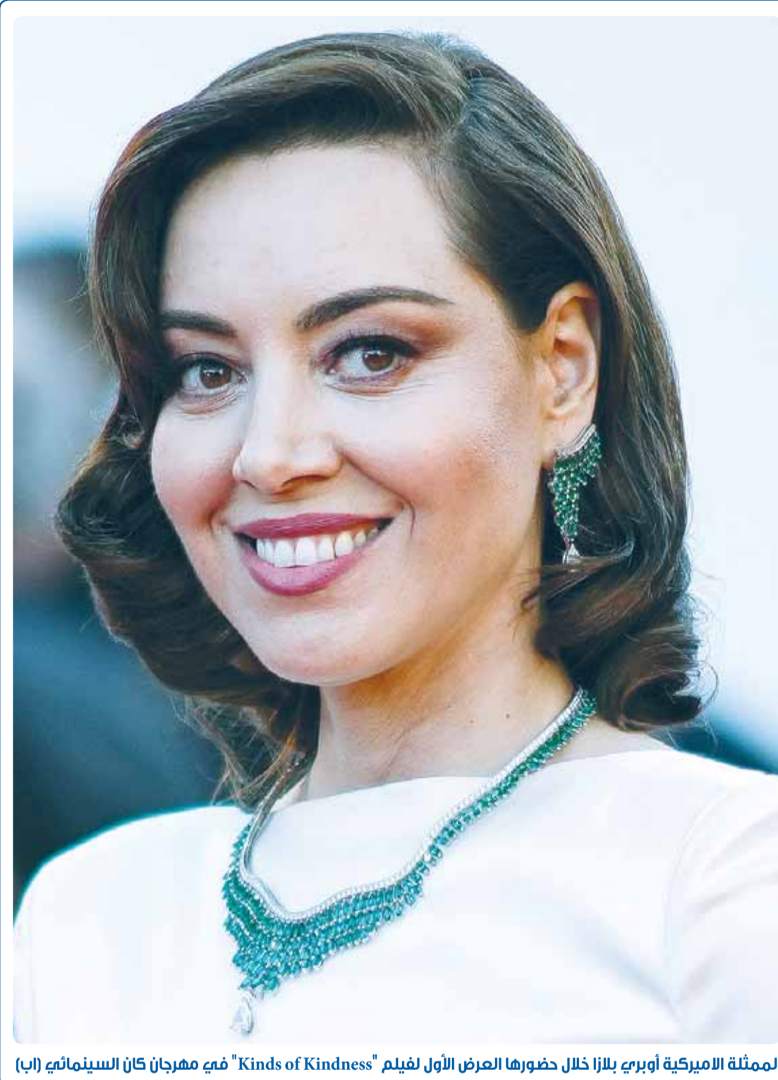
الممثلة الاميريكية أوبري بلانزا خلال حضورها العرض الأول لفيلم "Kinds of Kindness" في مهرجان كان السينمائي

صاحب السمو الأمير، حفظه الله ورعاه، حين خرج العمل السياسي عن مساره الصحيح حل مجلس الأمة، وعلق العمل ببعض مواد الدستور، إلى ان تعود الامور الى نصابها الصحيح، وتدور عجلة الحياة من جديد، فهل نحن بحاجة إلى حل للاتحادات الرياضية كلها، واستبعاد الأسماء الحالية التي ثبت فشلها، وانقرفت نحو الصراعات السياسية، فالكويت مليئة بالكفاءات الشابة المحبة للرياضة من اجل الرياضة، وليس من اجل السياسة، كما حصل مع المجلس ليعود المتصارعون إلى رشددهم، ويتوقف كل عند حده، وتدب الحياة في الحركة الرياضية كلها من جديد عندها فقط، نقول اننا نسير في طريق استعادة الريادة...زين؟