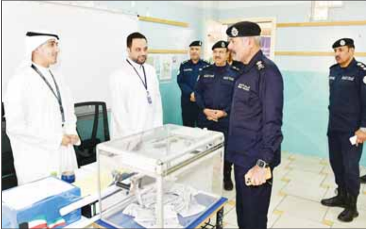
وكيل "الداخلية" يطمئن علمه سير العملية الانتخابية

تفقد وكيل وزارة الداخلية الفريق الشيخ سالم النواف أمس، مقار الانتخابات التكميلية للمجلس البلدي في فصله التشريعي الـ13. واطلع الشيخ سالم النواف خلال الجولة على سير العملية الانتخابية التكميلية والتي تجرى في 194 لجنة انتخابية تحتضنها 26 مدرسة خصصت لهذا الغرض. ورافقه خلال الجولة الوكيل المساعد لشؤون الأمن الخاص اللواء عبدالله سفاوح والوكيل المساعد لشؤون المرور اللواء يوسف الفدة ومدير عام العلاقات العامة والإعلام الأمني اللواء توحيد الكندري ومدير عام العمليات المركزية العميد عبدالله العتيقي وعدد من القيادات الأمنية.