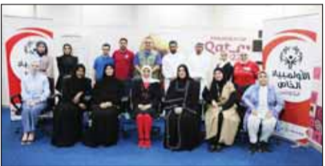
أول مجلس لأسر لاعبي الاولمبياد الخاص