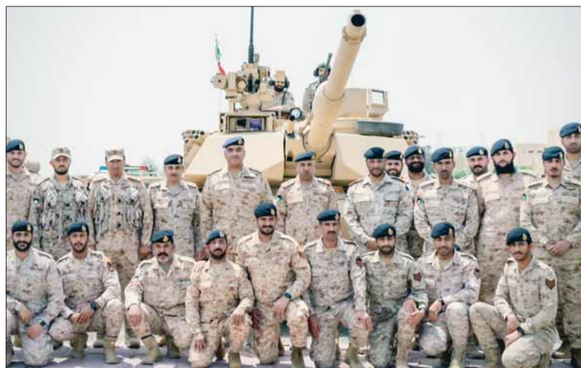
رئيس الأركان العامة للجيش الفريق الركن طيار بندر المزين متوسطاً قادة لواء التحرير الآلي 6/

جاهزيتها واستعدادها، فهم دروع الوطن، وهم أول من يلتي نداء الواجب في الدفاع عن أمنه واستقراره وسلامه أراضيه. وأشار إلى ضرورة مواصلة البذل والعطاء لخدمة هذا البلد المعطاء، داعياً المولى عز وجل أن يديم على الكويتنا الغالية وعلى قيادتها الحكيمة وشعبها الوفي نعمة الأمن والأمان والعهدة والرفعة.