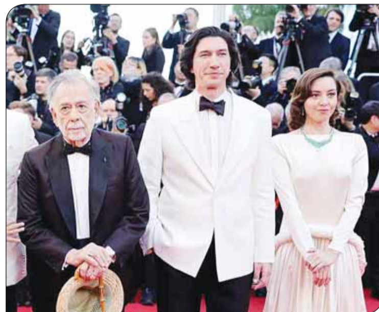
كوبولا مع نجميه فيلمه علم البساط الأحمر

يورغوس لانثيموس في فيلم "كايندز أوف كايندنس". وتؤدي دور البطولة في إحدى القصص القصيرة الثلاث للفيلم، والتي تضم أيضاً وليام ديغو والممثلين الصاعدين مارغريت كوالي وهنتر شيفر في مسلسل "يوفوريا"، الذي حقق نجاحاً كبيراً. كما يعود أحد أبرز نجوم هوليوود في القرن العشرين إلى المهرجان، إذ يؤدي ريتشارد غير، دور البطولة في فيلم "أو، كندا"، مكرراً التعاون مع بول شريدر، الذي أخرج له الفيلم الشهير "اميركان جيجولو" قبل أكثر من 40 عاماً. ويتناول شريدر، المشهور بكتابه نص فيلمي "تاكسي درايفر" و"ريجينغ بول"، في أحدث عمل له، استوداه جزئياً من إصابة بكوفيد-19 كادت تؤدي به، قصة رجل يتعثر يطارده ماضيه، بما في ذلك قراره بتقاضي التجنيد في حرب فيتنام. بينما يؤدي نجم هوليوود الجديد جايكوب لوردي، أحد الممثلين الأخرين في "يوفوريا"، شخصية ريتشارد غير أيضاً لكن في مرحلة عمرية أصغر.