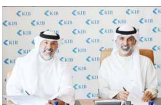
خلال توقيع المذكرة

وصل أساسية بين المبتكرين والجهات الحكومية والخاصة، بهدف تحقيق التأثير البيئي المستدام. ومن شأن مثل هذه المبادرات الحيوية إطلاق العنان للتميز الشمولي والجمع بين الخبرات العملية والمعرفة الأكاديمية وصولاً إلى تطوير حلول فعّالة تسهم في مواجهة التحديات التي تواجهها الكويت والمنطقة في مجال البيئة والطاقة". ومن الجدير بالذكر أن حاضنة إيكو تعتبر مبادرة رائدة في مجال الاستدامة والطاقة المتجددة، كما تلعب دوراً كبيراً في توفير الدعم التقني والاستشاري لتحويل الأفكار البيئية الإيجابية إلى مشاريع ناجحة، وكذلك تشجيع البحث والتطوير وتعزيز الوعي البيئي من خلال تنظيم فعاليات ورش عمل تعليمية للمساعدة في نشر ثقافة تقدير البيئة، وضرورة اتخاذ خطوات حقيقية نحو أسلوب حياة أكثر استدامة.