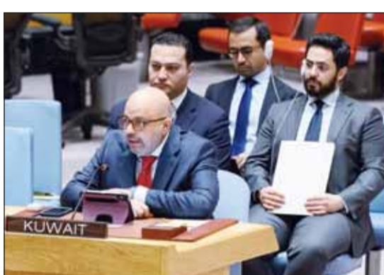
السفير طارق البنائي خلال جلسة مجلس الأمن الدولي

القرار 2107 لعام 2013. وأوضح البنائي أن لدولة الكويت كذلك الحق المطلق - فيما يتعلق بملف الأسرى والمفقودين والممتلكات الكويتية - في متابعة كل ما يخص أبنائها، مؤكدا أنه "بات واجبا علينا أن نبحث الألية الأممية وأن ندفع بالعملية للأمام". وأشار إلى ان الكويت خلال عضويتها غير الدائمة في مجلس الأمن لفترة (2018 - 2019) دفعت لاعتماد القرار (2474) بمشاركة 68 دولة الذي يؤكد ضرورة ألا تتفاقم الأضرار الدولية عن المفقودين في النزاعات المسلحة، مشددا على أهمية استمرار المتابعة الأممية لواقع الأحداث من خلال التقارير الدورية للأمين العام حتى يتم التعرف على رفات أفر مفقود ويغلق هذا الفصل