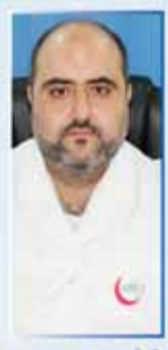
د/ إيهام BDS الأسنان