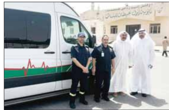
د.أحمد الشطيبة خلال تفقده فرق الطوارئ الطبية في المراكز

قال مدير إدارة الطوارئ الطبية في وزارة الصحة الدكتور أحمد الشطيبة إن الإدارة وفرت 26 عيادة طبية وتسع سيارات إسعاف تغطي 24 لجنة فرعية في مراكز الاقتراع للانتخابات التكميلية للمجلس البلدي في الدائرتين السادسة والتاسعة. وأوضح الشطيبة لوكالة الأنباء الكويتية (كونا) أمس، عقب جولة ميدانية على لجان الانتخابات أن العيادات وسيارات الإسعاف موزعة بواقع أربع عيادات وسيارات إسعاف في منطقة مبارك الكبير وست عيادات وسيارات إسعاف في منطقة الفروانية و16 عيادة وخمس سيارات إسعاف في منطقة الأحمدي يعمل بها 108 مسعفين وفنيين للطوارئ. وبين أن عدد المراجعين للعيادات الميدانية منذ بدء الاقتراع حتى الآن بلغ 12 مرابعا (9 ذكور و3 إناث) ولم يتم تحويل أي حالة للمستشفيات.