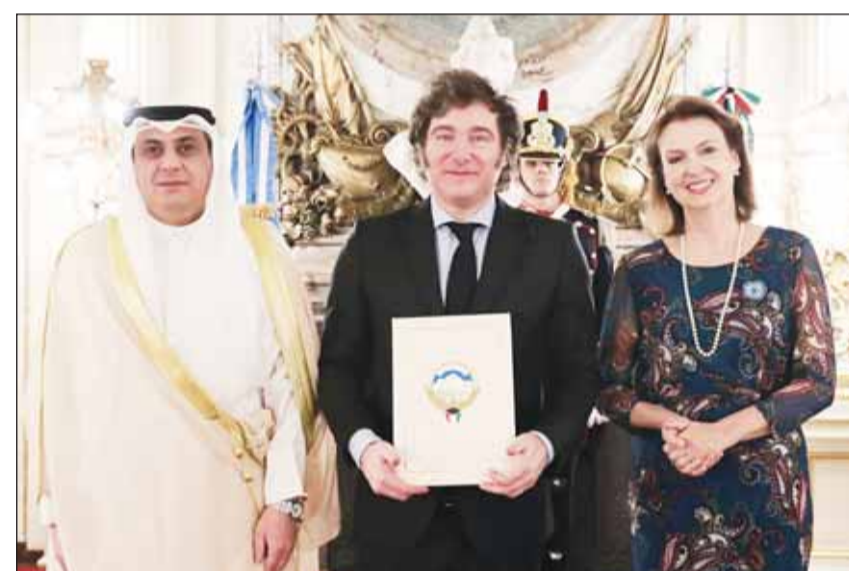
السفير عبد العزيز البشر يقدم أوراق اعتماده للرئيس الأرجنتيني خافيير ميلبي

■ واشنطن - كونا، قدم سفير دولة الكويت لدى جمهورية الأرجنتين عبدالعزيز البشر أوراق اعتماده إلى الرئيس الأرجنتيني خافيير ميلبي بحضور وزيرة الخارجية ديانا موندينو خلال مراسم أقيمت بمقر الحكومة (كاسا روسادا) في العاصمة بوينس آيرس.