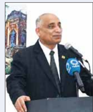
السفير عشيق الزمان متحدثاً

■ نظمت سفارة بنغلاديش لدى الكويت وجمعية الفنون الكويتية، وبشكل مشترك، معرضاً فنياً، لمدة أربعة أيام في جمعية الفنون الكويتية في حولي، للاحتفال بمرور 50 عاماً «اليوبيل الذهبي» للعلاقات البنغلاديشية الكويتية. افتتح المعرض سفير بنغلاديش اللواء، المقتاعد، ام دي عشيق الزمان ورئيس جمعية الفنانين الكويتية عبد الرسول سلمان، الاربعاء الماضي. حضر حفل الافتتاح أكثر من 20 سفيراً من مختلف البلدان لدى الكويت، وأعضاء وفنانين