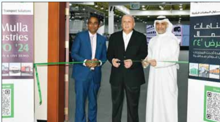
صورة خلال افتتاح المعرض