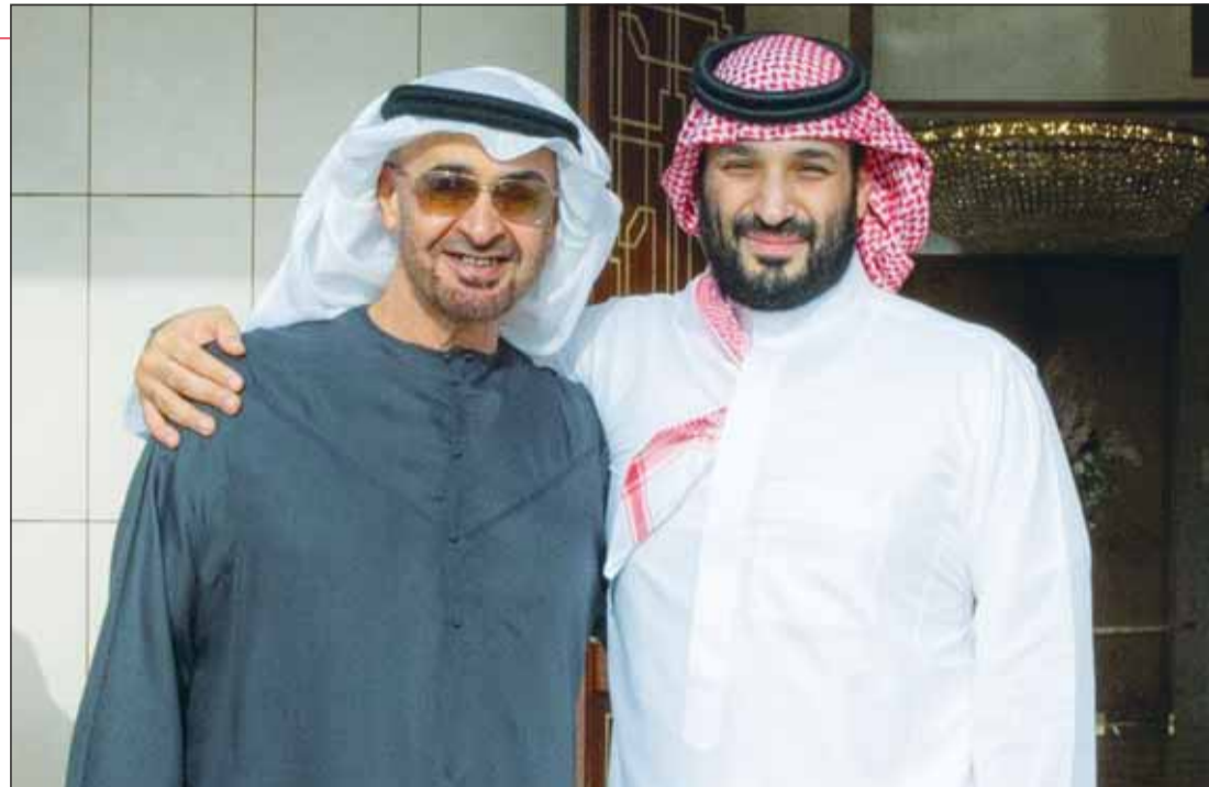
ولي العهد السعودي الأمير محمد بن سلمان مستقبلاً رئيس الإمارات الشيخ محمد بن زايد في قصر العزيزية بمدينة الخبر (إكس)

■ الرياض، عواصم - وكالات، استقبل ولي العهد السعودي الأمير محمد بن سلمان، رئيس الإمارات الشيخ محمد بن زايد في قصر العزيزية بمدينة الخبر، حيث نشر مدير المكتب الخاص بولي العهد السعودي بدر العساكر والمستشار الديبلوماسية لرئيس الإمارات أنور قرقاش، صورة للقاء بين سلمان وبن زايد عبر حسابيهما على منصة "إكس"، وعلق العساكر قائلاً: "ولي العهد يلتقي بأخيه رئيس الإمارات، يقصر العزيزية بالمنطقة الشرقية"، دون مزيد من التفاصيل، بينما قال قرقاش إن زيارة الشيخ محمد بن زايد ولقاؤه بالأمير محمد بن سلمان، تؤكد أن التواصل والتعاون والتكامل مع السعودية السبيل إلى ازدهار واستقرار المنطقة وأمنها"، مضيفاً أن "اللقاءات قاندي التنمية والتحديث فيها الخير لشعبونا وأوطاننا".