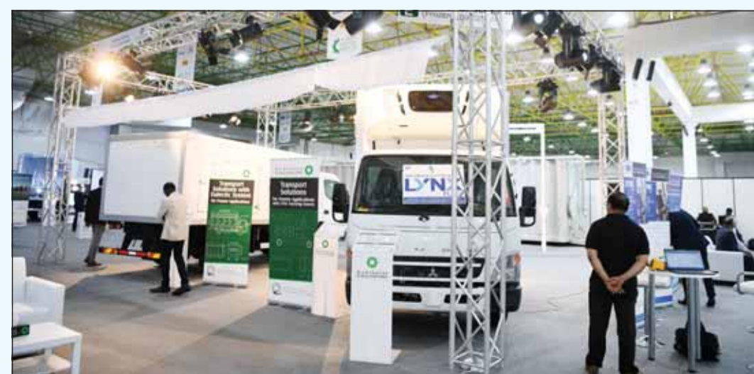
جانب من المعرض

والتقطورات، والشاحنات الصغيرة، وغيرها من المركبات المجهزة بوحدة التبريد، وتجهيزات المملقات للمساعد الميكانيكية خلف الشاحنات، وغيرها من الحلول المتكاملة بالإضافة إلى حلول المعدات الثابتة لقطاعي النفط والغاز في الكويت والتي تعكس تاريخ الشركة الطويل لأكثر من أربعة عقود من تقديم التميز في قطاعات تصنيع منتجات الحديد الصلب والتبريد والنقل. وقد تضمن معرض صناعات الملا 2024 أيضاً إطلاق نوعين من حلول نقل المنتجات المجهزة بواسطة صندوق تبريد الجولي بوريثان المعزول. وتعد حلول التبريد والنقل لدى شركة صناعات الملا الخيار الأفضل لنقل المنتجات المجهزة مثل الخلويات المثلجة (الآيس كريم) وغيرها من البضائع المثلجة الأخرى التي تتطلب درجات حرارة قد تصل إلى 30 درجة مئوية تحت الصفر. تم تجهيز حلول النقل المتطورة هذه بأجهزة تكييف الهواء من الشركات الرائدة عالمياً مثل شركة Carrier. وشمل المنتج الأخر الذي تم إطلاقه عرضاً توضيحياً مباشراً لبرنامج LYNX. من أبرز المعارضات في المعرض كان عرضاً لشاحنة للسيارات ذات طابقين مصممة خصيصاً ومزودة بنظام رفع هيدروليكي يجعلها مناسبة لنقل السيارات الفاخرة المنخفضة وكذلك سيارات الدفع الرباعي الكبيرة على كل من الطوابق السفلية والعلوية.