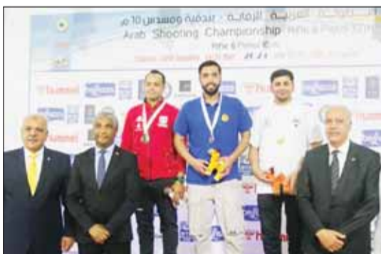
تتويج رماة الكويت

وأكد أهمية توقيت إقامة هذه المنافسات في إعداد الرماة والرامي العرب المتأهلين للمشاركة في دورة الألعاب الأولمبية (باريس 2024) التي ستنتقل في يوليو المقبل منها بتطور الرماية العربية على المستويين الفني والاداري.