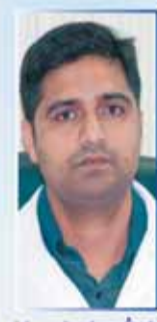
د/ شاجمان BDS, MDS الأسنان

مركز شفاء الجزيرة الطبي SHIFA AL JAZEERA MEDICAL CENTRE الفروانية FARWANIYA