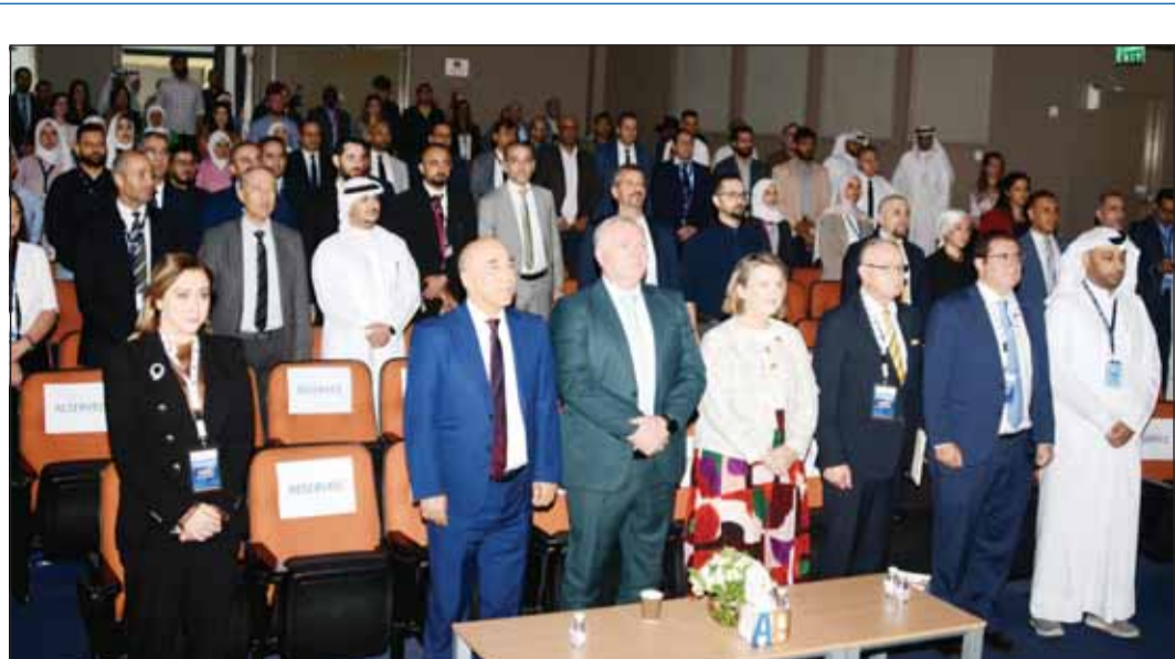
جانب من الحضور خلال عزف السلام الوطني في افتتاح ملتقى

وأعرب الهولي عن شكره للوكيلة المطوع على تفهمها وردها السريع، مؤكداً حرص الجمعية على تعزيز كل مجالات التعاون والتنسيق مع الوزارة للأخذ بملاحظات أهل الميدان تجاه القرارات التربوية، ولتهيئة الأجواء التربوية المناسبة.