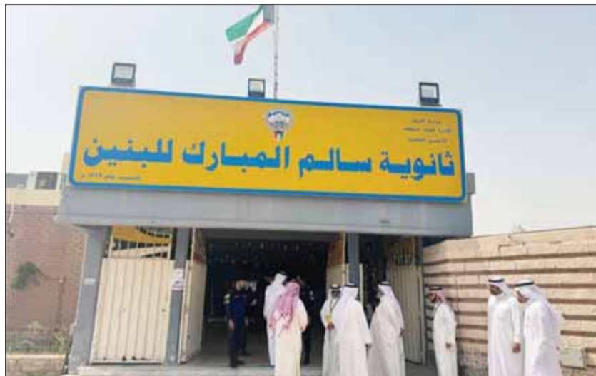
عدد من الناخبين بانتظار دورهم للتصويت في لجنة ثانوية سالم المبارك