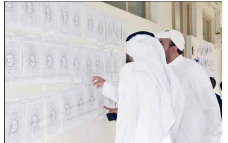
التأكد من الاسم في الكشوف الانتخابية

كبار السن تقدموا المشاركين كالعادة والعملية الانتخابية سارت بسلاسة ودون أي عراقيل