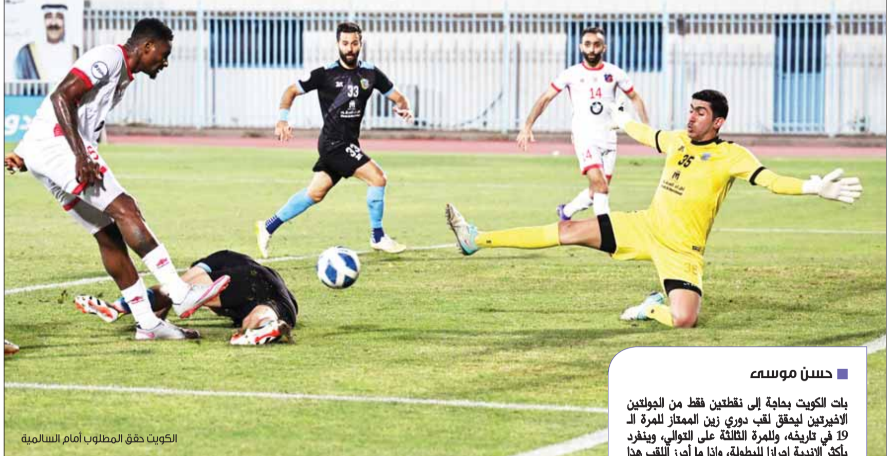
الكويت حقق المطلوب أمام السالمية