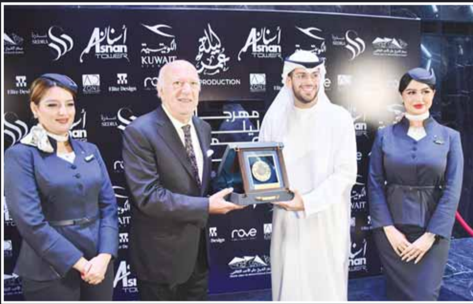
عمر خيرت وفرقته في مركز جابر الأحمّد الثقافي ونال تكريماً خاصاً