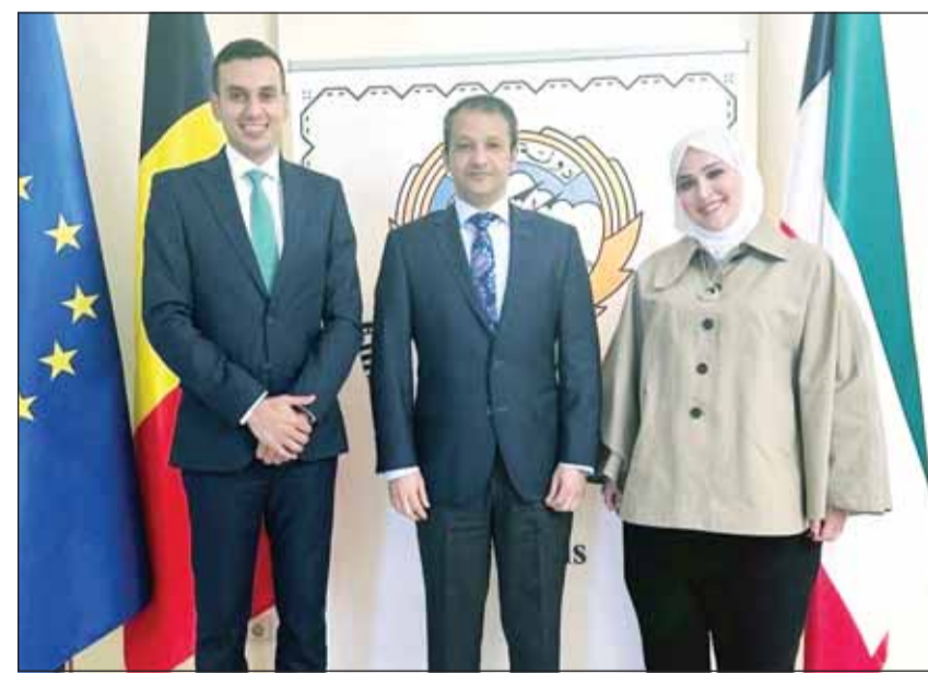
السفير نواف العنزي مع الدبلوماسيين عبد العزيز النويذ ونور الدولية

■ قال سفير الكويت لدى بلجيكا ورئيس بعثتها لدى الاتحاد الأوروبي ولف شمال الأطلسي (ناتو) نواف العنزي أمس، إن النسخة الأولى من برنامج (القيادات الشابة في الدبلوماسية الإقليمية) الذي استضافه الاتحاد الأوروبي يهدف إلى مد جسور التواصل بين الدبلوماسيين الناشئين الخليجين والأوروبيين.