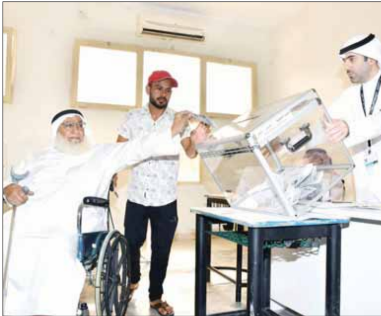
كبار السن في المقدمه