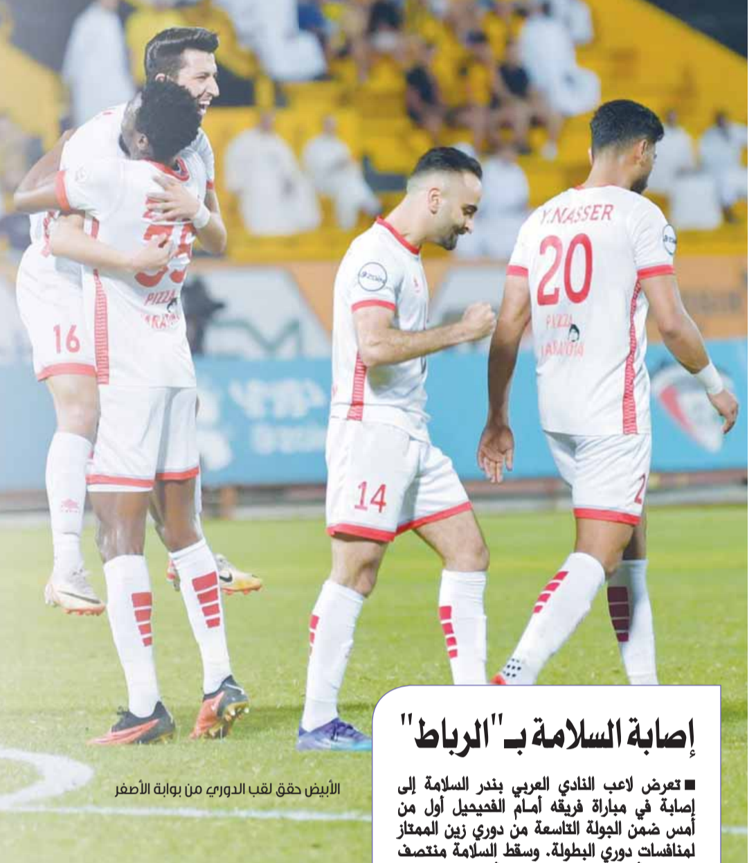
الأبيض حقق لقب الدوري من بوابة الأصفر

وكشّر "الأبيض" عن أنيابه أمام القادسية، ومقق مراده، وفاز بالنقاط