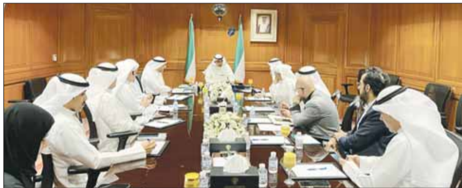
د. بوشهري مترسماً الاجتماع

الطاقة الكهربائية والمياه، لافتا الى ضرورة وضع خطة قابلة للتنفيذ وفقا لبرنامج زمني واقعي بشأن استخدام الطاقات المتعددة في عملية إنتاج الكهرباء والماء لتكون رديفاً لمصادر الإنتاج التقليدية. وعبر الوزير د. بوشهري عن فخره واعتزازه بالكوادر الوطنية المتميزة من منتسبي الوزارة، متوجهاً لهم بجزيل الشكر والتقدير على الجهود التي يبذلونها لتطوير أداء العمل وتحسين جودة الخدمات المقدمة للمستهلكين كافة.