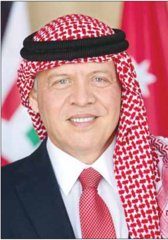
الملك عبدالله الثاني

بعث سمو أمير البلاد الشيخ مشعل الأحمدي ببرقية تهنئة إلى أخيه الملك عبدالله الثاني ابن الحسين ملك المملكة الأردنية الهاشمية الشقيقة، عبر فيها سموه عن خالص تهانیه بمناسبة العيد الوطني لبلاده. مشيدا سموه بالعلاقات الأخوية الوطيدة التي تجمع البلدين والشعبين الشقيقين، وموكدا على التطلع الدائم والمشارك لتعزيزها وتطويرها لما فيه خير ومصحة البلدين الشقيقين. متمنيا سموه له دوام الصحة والعافية وللمملكة الأردنية الهاشمية الشقيقة وشعبها الكريم المزيد من التقدم والازدهار في ظل القيادة الحكيمة لجلالته.