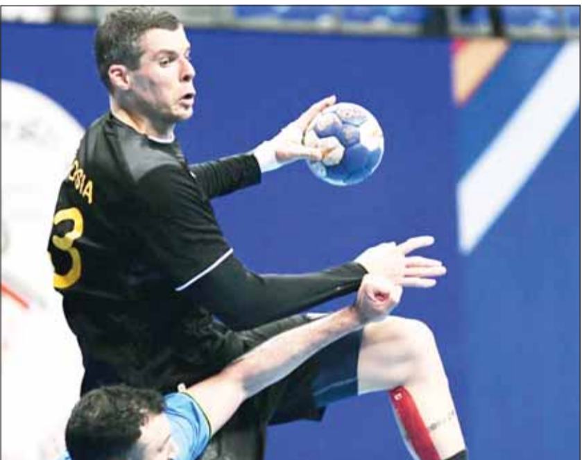
السماوي زاد من أوجاع الأصفر