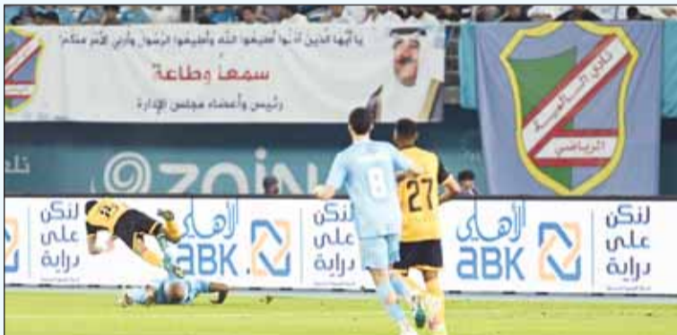
شعار البنك الأهلي الكويتي خلال نهائي كأس صاحب السمو أمير البلاد

وأضاف أن مبادرات برنامج المسؤولية الاجتماعية للبنك الأهلي الكويتي تحرص على عقد شراكات مع العديد من الجهات الرياضية، والمشاركة في المنافسات التي تقام داخل دولة الكويت بحضور أعداد كبيرة من الجماهير من جميع الأعمار.