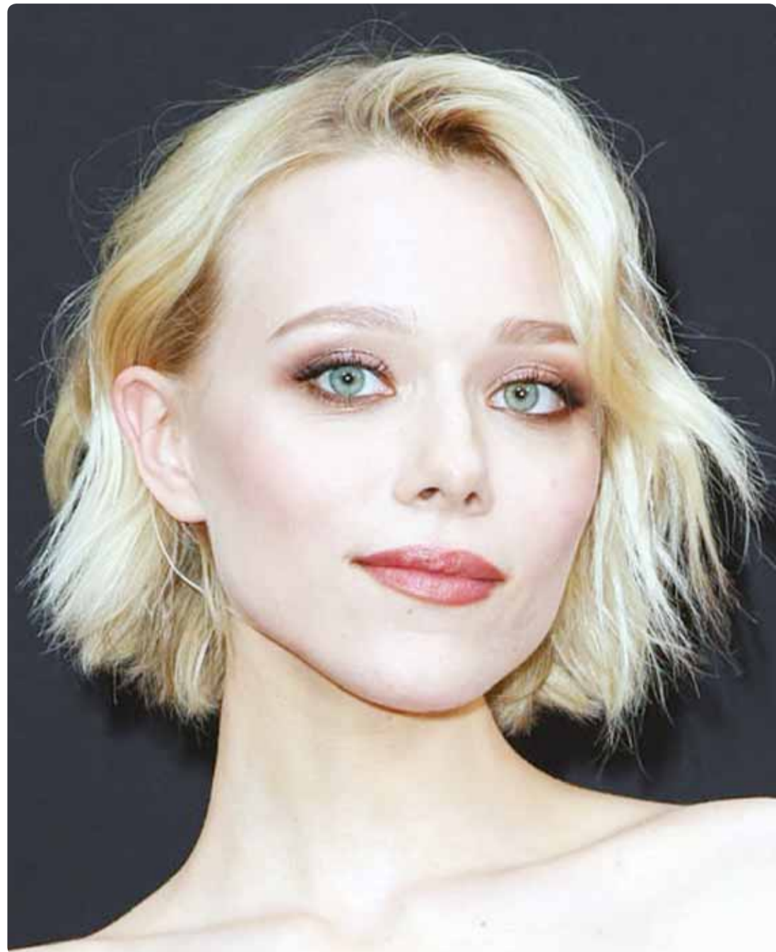
الممثلة الأوكرانية إيفانا ساخنو خلال حضورها إطلاق فيلم "ديزني ولوكاسفيلم" في لوس أنجلوس

ويضيف بالصوت العالي وباللهجة نفسها إياها، "الله يلعن ابو التنظيم فإنني اعرف عن مخططاتكم اضعاف... اضعاف ما تعرفه المخابرات الاردنية فهي لاتعرف سوى خمسة في المئة مما نعرفه". وأخيراً يطالب شباب الحزب بقوله: "يا شباب لا تصدقوا الإسلاميين كذبهم، وكذبوا قياداتهم، واولهم أنا، فليس لنا علاقة بالدين وخدمته، نحن اصحاب مصلحة!" هذا قليل من كثير مما ورد في كلمة المدعو ليث شبيلات، وكما اتمنى لويتها تلفزيوننا الرسمي أكثر من مرة، وتبينتها صحفنا المحلية، لكشف نوايا هذا التنظيم، الذي لا يزال ينفخ في جسم الدولة، ولا يزال هناك من يندفع بشعاراته... زين.