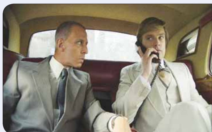
مشهد من فيلم "The Apprentice"

خلال المؤتمر، عبارة "عدو الشعب" استخدمها ستالين، ماو، جوبلز، وأخيرا دونالد ترامب، عندما هاجم الصحافة الحرة، ووصف CNN وNBC وABC وCBS News وصحيفة نيويورك تايمز بـ"وسائل الإعلام الكاذبة". نال الفيلم بعد عرضه تصفيقا استمر دقائق، رغم أنه يثير ردود فعل غاضبة من أنصار وفريق الرئيس السابق، حيث أصدرت حملة ترامب الانتخابية لعام 2024 بيانا قال فيه المتحدث الرسمي ستيفن تشوينج، "سخرع دعوى قضائية لمواجهة الادعاءات الكاذبة من هؤلاء المخرجين المزيفين، هذه القمامة هي خيال بحت يثير الأكاذيب التي تم دحضها منذ زمن طويل، كما هو الحال مع محاكمات بايند غير القانونية، هذا تدخل انتخابي من نخب هوليوود، الذين يعلمون أن الرئيس ترامب سيستعيد البيت الأبيض ويهزم مرشحهم المختار، لأن لا شيء مما فعلوه قد نجح".