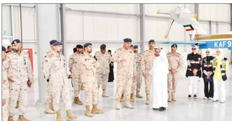
رئيس الأركان يستمع إلى شرح عن سير الأعمال في مشروعَي القاعدتين

تفقد رئيس الأركان العامة للجيش الفريق الركن طيار بندر المزين أمس، مشروعَي قاعدتي (عبدالله المبارك) و(نواف الأحمد) الجويين وذلك للاطلاع على سير الأعمال فيهما ونسب الإنجاز في إطار متابعتها تنفيذ المشاريع بمختلف قطاعات الجيش الكويتي. وقالت رئاسة الأركان العامة للجيش في بيان صحفي إن الفريق المزين أكد خلال الجولة حرصه على سرعة وتيرة الانجاز وتجهيزها بالوقت المحدد. وأضاف البيان أن الجولة جاءت بهدف التأكد من توافر متطلبات وتجهيزات التشغيل وتزويدها باحتياجاتها من المعدات والمستلزمات كما شملت الجولة تفقد سير الأعمال المنجزة بالقاعدتين. ورافق الفريق المزين خلال الجولة أمر القوة الجوية اللواء الركن طيار صباح جابر الأحمدي ورئيس انتقال القواعد العسكرية المهندس فيصل الهاجري وعدد من ضباط القوة الجوية ومهندسين من المنشآت العسكرية.