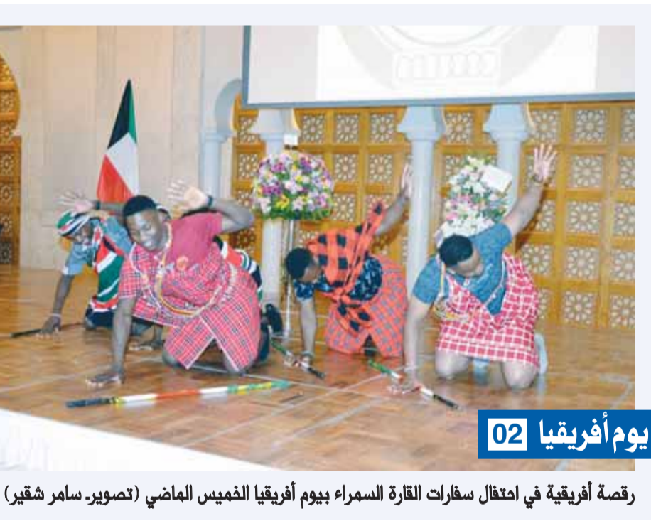
رقصة أفريقية في امتفال سفارات القارة السمراء بيوم أفريقيا الماضي

رصدت 4 متهمين في أحد المكاتب بدلاً من النظارة "الرقابة والتفتيش" تأمر بحجز "زام" في مخفر "سعد العبدالله"