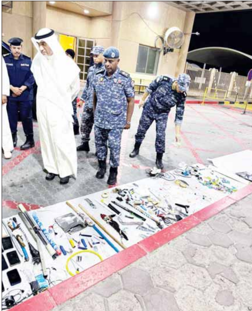
النائب الأول الشيخ فهد اليوسف يتفقد المضبوطات خلال الحملة التفتيشية المفاجئة لمجمع السجون