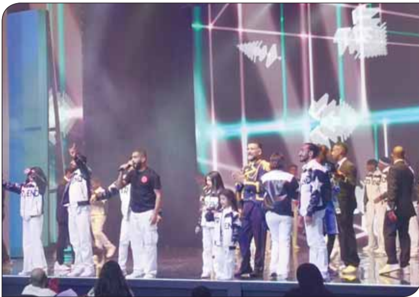
مشهد من "أبرا كدابرا 2"