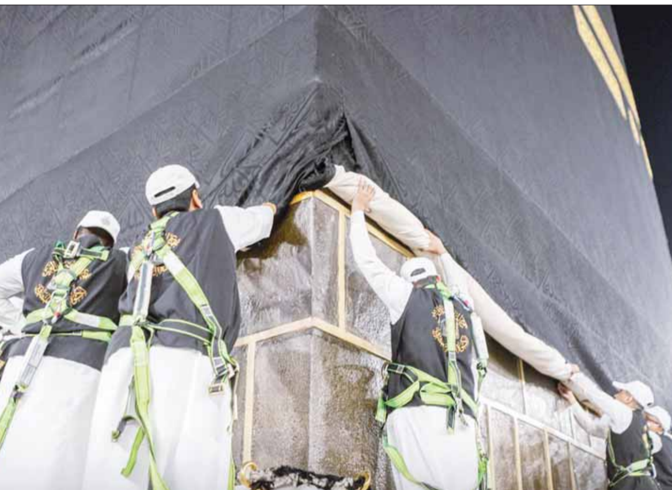
جانب من عملية رفع الجزء السفلي من كسوة الكعبة المشرفة استعداداً لموسم الحج

في المقابل، رحبت جنوب أفريقيا بأمر محكمة العدل الدولية، وقال الرئيس سيريل رامافوزا إن حريتنا لن تكتمل حتى تتحقق حرية الشعب الفلسطيني، ورحبت "حماس" ودعت المجتمع الدولي والأمم المتحدة للضغط، مؤكدة أنه بدون ضغط دولي لن يكون لقرار المحكمة أي تأثير، كما رحبت الرئاسة الفلسطينية وطالبت بإلزام الاحتلال بالتنفيذ وإيقاف عدوانه على الشعب الفلسطيني في كل مكان في غزة والضفة والقدس، ورحبت القوى الوطنية والإسلامية الفلسطينية، مشددة على ضرورة وقف العدوان القاشي على رفح وجميع أنحاء قطاع غزة والأرض الفلسطينية وانسحاب جيش الاحتلال النازي بالكامل، مطالبة بالعمل الجاد والحقيقي لتنفيذ قرارات محكمة العدل الدولية وعدم تسويقها أو تعطيلها، محذرة من أي صيغة للاتفاف، معتبرة الحديث عن إدخال المساعدات عبر معبر كرم أبو سالم خطوة صغيرة لا تنهي المأساة الإنسانية.