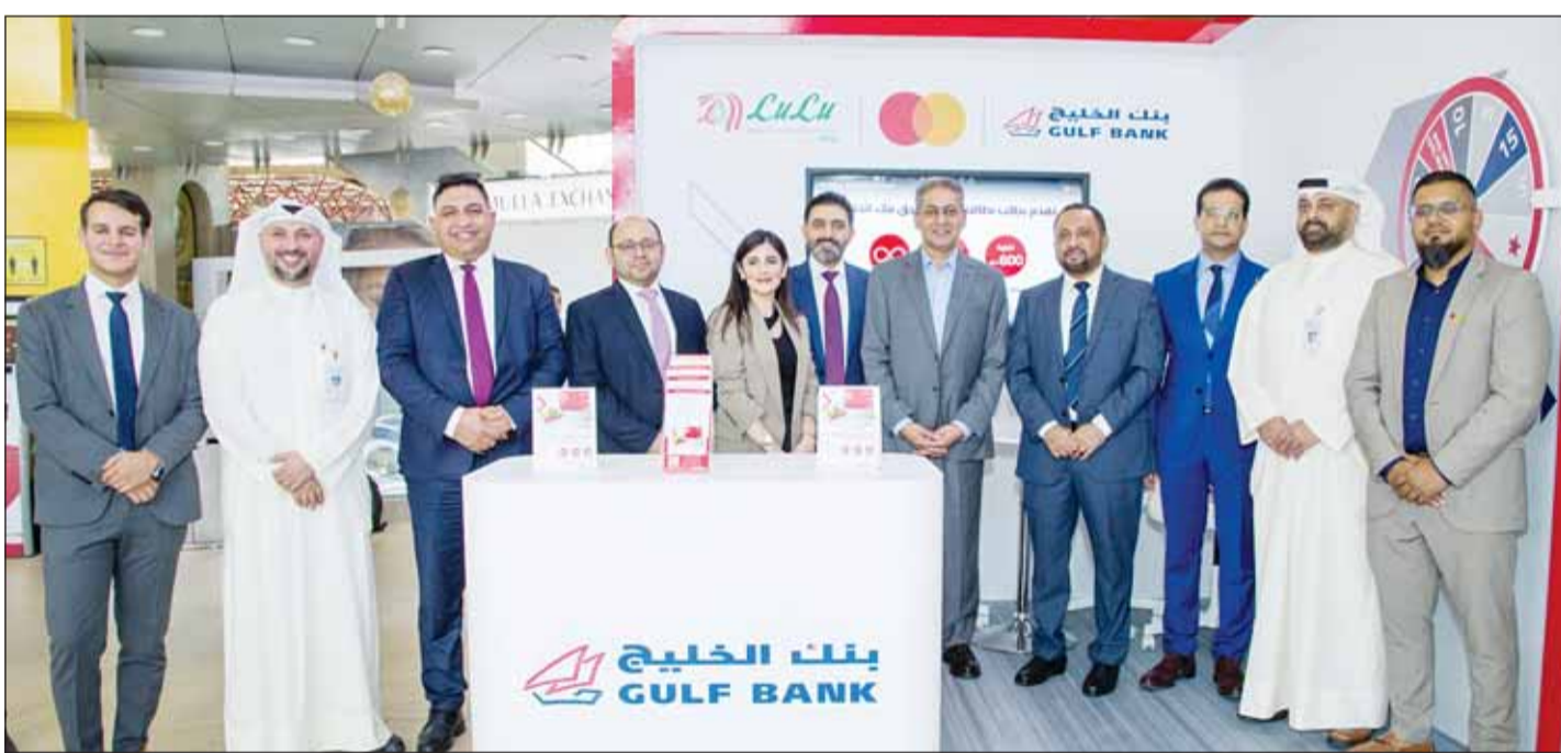
صورة جماعية لمسؤولي بنك الخليج مع ممثلي لولو هايبر ماركت وماستركارد

بنك الخليج الذي يعد أحد البنوك الرائدة في الكويت والمنطقة. "نسعى باستمرار إلى تزويد عملائنا بخدمات مميزة ذات قيمة مضافة تعزز مكانتنا في قطاع التجزئة، ونؤمن أن الشراكة مع بنك الخليج ستوفر تجربة جديدة ورائعة لعملائنا، متوقعاً أن تكون البطاقة الجديدة الأكثر شعبية وقيمة للمستهلكين في الكويت.