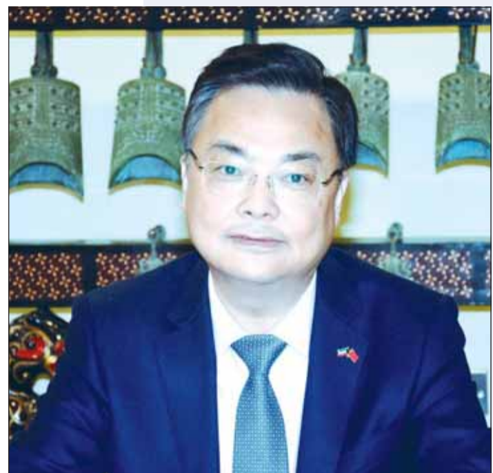
السفير الصيني تشانغ جيانوي يتحدث خلال المؤتمر الصحفي

هذا المجال. وأوضح ان بلاده لديها الرغبة القوية في اتمام هذا الاتفاق في اقرب وقت ممكن، كما ان بنود الاتفاق وتفصيله متناج الى المزيد من التشاور بين الجانبين.