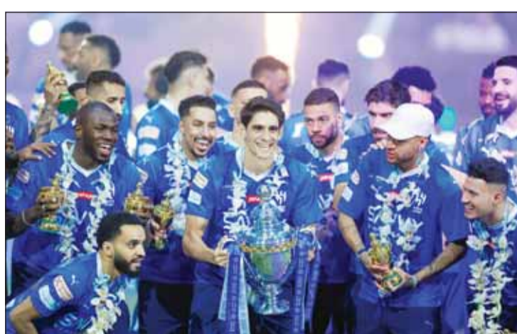
تتويج الهلال بدوري روشن