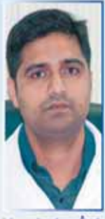
د/ شاجمان BDS, MDS الأسنان

مركز شفاء الجزيرة الطبي SHIFA AL JAZEERA MEDICAL CENTRE الفروانية FARWANIYA