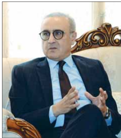
السفير التونسي محمد البودالي

وحول المجالات الأكثر طلباً، قال: "الكلام كان أن السلطات الكويتية منفتحة على التعاون في جميع المجالات، ومستعدة للقبول وجلب الخبرات التونسية في كل المجالات ولكن التركيز كان على الصحة والعمل والتعليم والتكنولوجيا، واتفقا على التركيز بالمرحلة الأولى على