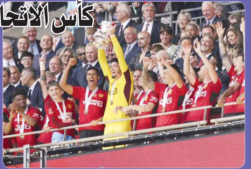
مانشستر يونايتد يحصد كأس الاتحاد الإنجليزي

واستغل غارناتشو خطأ فادحاً من المدافع الكرواتي يوسكو غفارديول، في الدقيقة 30، حيث مرر الأخر الكرة إلى المرمي الخالي، ليضعها الشاب الأرجنتيني بسهولة في الشباك. وعزز المراهق الإنكليزي كوبي ماينو التقدم في الدقيقة 39،