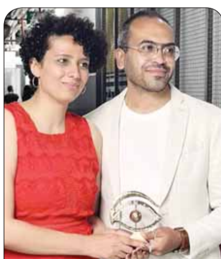
المخرجان المصريان يحملان جائزة "العين الذهبية"

علاقات رومانسية بينهم في مسلسل "فرييندز" نجمت عن الآثار الحادة لتعاطيه مادة الكيتامين المخدرة، ووصفت وفاته بأنها حادث، لكنها لا تزال قيد التحقيق. وأشارت الشرطة في بيان إلى أنها تواصل بمساعدة شرطة مكافحة المخدرات الفيدرالية وشرطة البريد الأمريكية بناء على تقرير الطب الشرعي. وكان الكيتامين، وهو دواء مخصص للتخدير الطبي والبيطري، ولكن يساء استخدامه لأغراض ترويحية كالتحفيز أو النشوة، جزءا من علاج كان يخضع له بيرري، من الاكتئاب، ويحقن به خلال جلسات بإشراف طبي، لكن التحقيق ينصب على طريقة حصول ماثيو بيرري، على الكيتامين مع أنه لم يخضع لجلسة حقن تحت الإشراف الطبي في الأيام السابقة لوفاته.