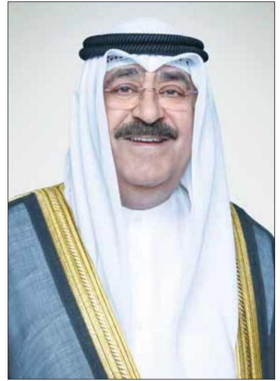
سمو أمير البلاد الشيخ مشعل الأحمدي