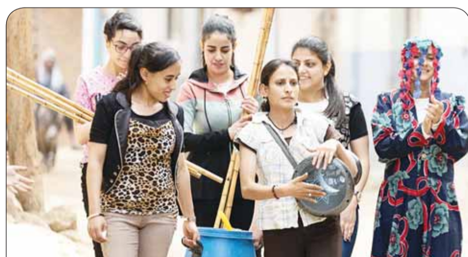
مشهد من فيلم "رفعت عيني للسما"

الروائي القصير "فخ" بمهرجان "كان" العام 2019، وحصل الفيلم على تنويه خاص من مهرجان القاهرة السينمائي الدولي في العام ذاته. كما عرض فيلمهما التسجيلي "لأهاليات سعيدة" العام 2016 بمهرجان أمستردام الدولي للأفلام التسجيلية، أمد أكبر وأهم مهرجانات الأفلام التسجيلية بالعالم. "رفعت عيني للسما"، إنتاج شركة "فلوكة فيلمز"، المنتج المنفذ محمد خالد، مساعدات الإخراج هانيس البلشي وضفي حمدي، مدير التصوير دينا الزنيني وأحمد إسماعيل وأيمن الأمير، صوت مصطفى شعبان وسامح نبيل وأسامة جيبيل، موسيقى تصويرية أحمد الصاوي، مونتاج فيرونيك لاجواراد وأحمد مجدي مرسي وأيمن الأمير وندى رياض، علاقات عامة للفيلم في مصر والشرق الأوسط شركة "كاروتس" مروة الصاوي.