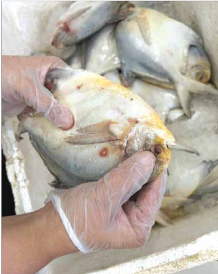
أسماك فاسدة وغير صالحة للاستهلاك الآدمي