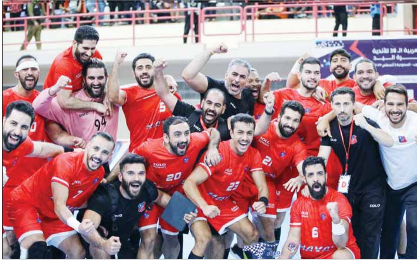
بطل العرب يستضيف النسخة الـ39 بصالة السعد