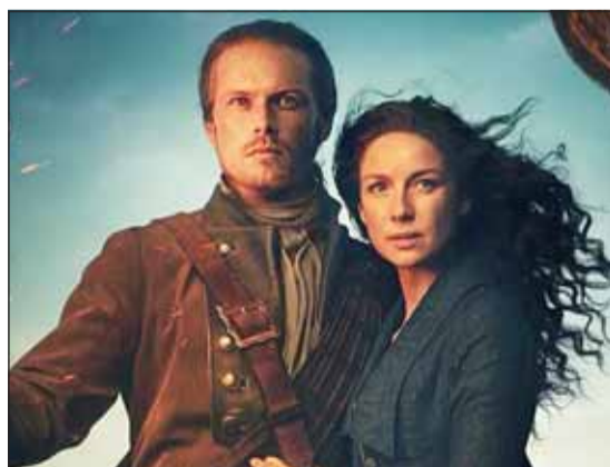
الجزء الثاني من الموسم السابع

طرحت منصة Starz صوراً جديدة للجزء الثاني من الموسم السابع لمسلسل Outlander، لأبطال العمل والذي سيتكون من ثمانية حلقات أخيرة، حيث من المقرر لهم في 22 نوفمبر المقبل، على أن تكون الحلقات متاحة للجمعة من كل أسبوع في منتصف الليل على المنصة والتطبيق. مسلسل Outlander الذي يعرض على منصة Starz يدور في حقيقتين زمنيتين مختلفتين (1945 - 1743)، وبحسب "اليوم السابع" يدور حول كليز راندال الممرضة الإنكليزية التي تذهب مع زوجها فرانك راندال في إجازة لإسكتلندا، بعد انتهاء الحرب العالمية الثانية في عام 1945، وفوق تل قديم تعلوه دائرة أحجار تدور حولها الكثير من الأساطير، تسمع كليز أغنية الأحجار وتلمسها،