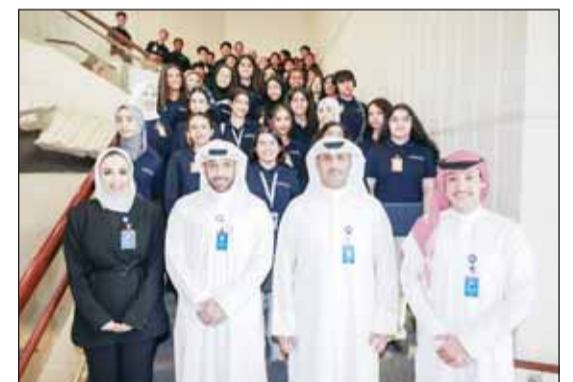
المكرمون مع مسؤولي المركز العلمي

استضاف المركز العلمي، احتفالية تكريم متميزة لمتدربي برنامج التدريب الميداني، الذي يعد أحد البرامج الحيوية التي تهدف لتعزيز رسالة المركز ورويته في أن يكون مركزاً مستقبلياً للمبتكرين المستقلين في مجالات العلوم والمحاكاة على البيئة من خلال أنشطة التعليم التفاعلي.