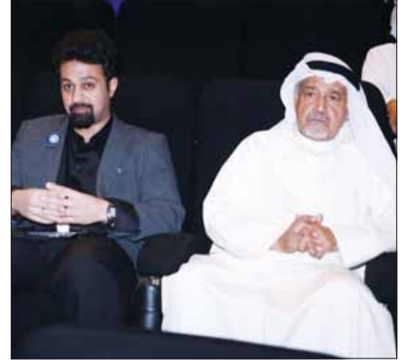
نجوم الفيلم جاسم النبهان وعبد الله الجبران

حالياً في دور العرض ويشارك فيه كوكبة من النجوم