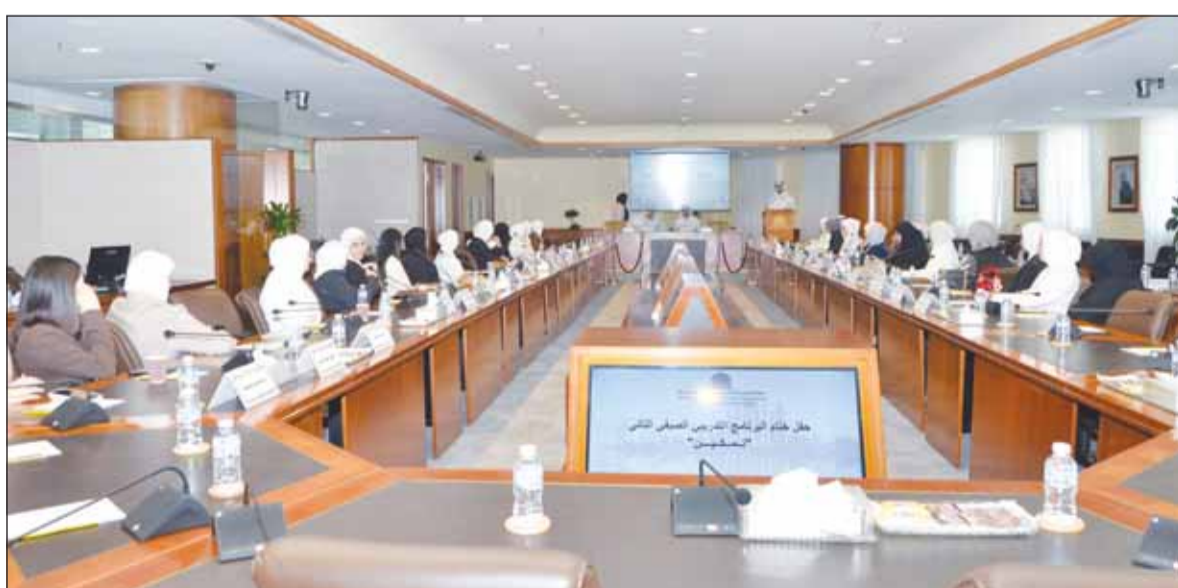
جانب من البرنامج التدريبي فيم الغرفة

■ وقد تضمنت فعاليات البرنامج التدريبي العديد من الندوات والمحاضرات والنقاشات والمحاكمات وورش العمل التي تم تقسيمها على ثلاث مراحل مستقلة ومتسلسلة. المرحلة الأولى، التحكيم التجاري، المرحلة الثانية، الوساطة والتوفيق، المرحلة الثالثة، المهارات القانونية، وحاضر بالبرنامج نخبة من القاديين وأساتذة القانون والأكاديميين وخبراء التحكيم من قطاعات مختلفة محلياً وإقليمياً والذي بلغ عددهم 12 محاضراً، وبلغت ساعات التدريب أكثر من 50 ساعة تدريبية تم التركيز فيها على التطبيقات العملية منها من النواحي النظرية بنسبة 80% بهدف جعل المتدرب أكثر