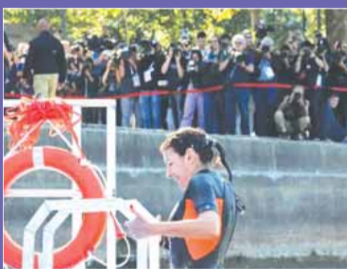
آن هيدالغو سبحت بنهر السين

ويحتضن المهرم المائي الشهير حفل الافتتاح في 26 يوليو، وذلك في سابقة لأنها المرة الأولى التي تفتتح فيها الألعاب الصيفية خارج الملعب الرئيسي. كما سيستضيف السين سباقات السباحة في المياه المفتوحة ووزعاً من سباق الترياثلون.