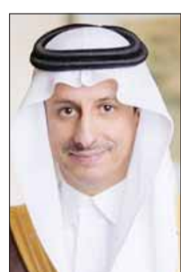
وزير السياحة أحمد الخطيب

يجسد دورًا هامًا في تقديم التمويل لعدد من المشاريع السياحية المميزة حيث ساهم الصندوق في أكثر من 7,4 مليار ريال لتمكين أكثر من 100 مشروع سياحي في مختلف مناطق المملكة تجاوزت قيمتها 35 مليار ريال حيث توفر أكثر من 7500 غرفة وجناح فندقي في الوجهات السياحية".