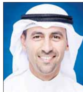
الشيخ نواف الصباح

تأكيدا لما نشرته "السياسة" في 3 مارس 2024 تحت عنوان "الدرة" على سكة التنفيذ قريبا وما تضمنه الخبر من أن السعودية والكويت تتسابقان الزمن لبدء استغلاله في أسرع وقت وفقا لتصريحات الرئيس التنفيذي السابق للشركة الكويتية لنفط الخليج خالد العتيبي، أعلن الرئيس التنفيذي لمؤسسة البترول الشيخ نواف الصباح إن المؤسسة ستبدأ "إجراءات" أعمال الحفر والبناء في حقل الـ درة في 2024. وأكد رئيس المؤسسة في تصريح