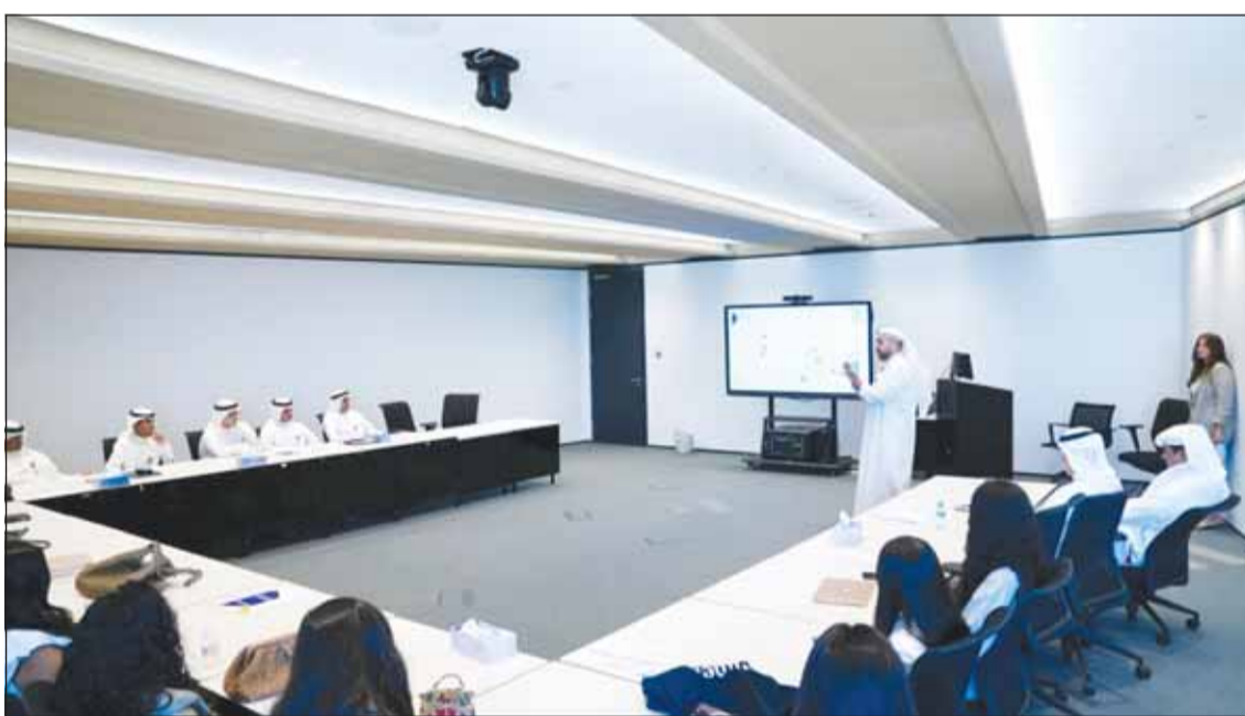
جانب من الحلقة النقاشية

قنواته الإلكترونية المختلفة على أساليب الاحتيال المتنوعة، كما يحرص على التحضير دائماً من مخاطر الاحتيال، سواء باستخدام الرسائل النصية أو البريد الإلكتروني أو حتى المكالمات الهاتفية، وينشر عبر حساباته في مواقع التواصل الاجتماعي مواد تحذر من الضغط على إعلانات مجهولة المصدر مثل التي تعد بالفوز بأرباح مغرية.