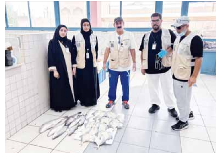
فرق الهيئة خلال الحملة التفتيشية بأحد المحال