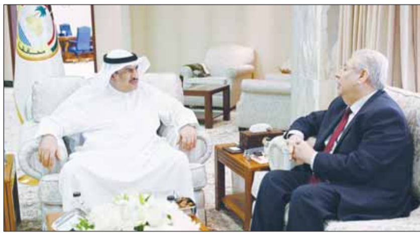
محافظ الجبراء حمد الحبشي لدى لقائه سفير مصر أسامة شلنوت

استقبل محافظ الجبراء حمد الحبشي بمكتبه في ديوان عام المحافظة أمس سفير مصر أسامة شلنوت، حيث تناول الطرفان العلاقات التاريخية الوثيقة التي تربط قيادتي وشعبي البلدين. وأوضح الحبشي أنه تم بحث ومناقشة تعزيز العلاقات الثنائية في مختلف المجالات والفرص والإمكانات المتاحة لتطوير التعاون المشترك وتبادل الخبرات، مؤكداً أن مصر والكويت شعب واحد يربطهما مصير مشترك وعلاقات متجددة.