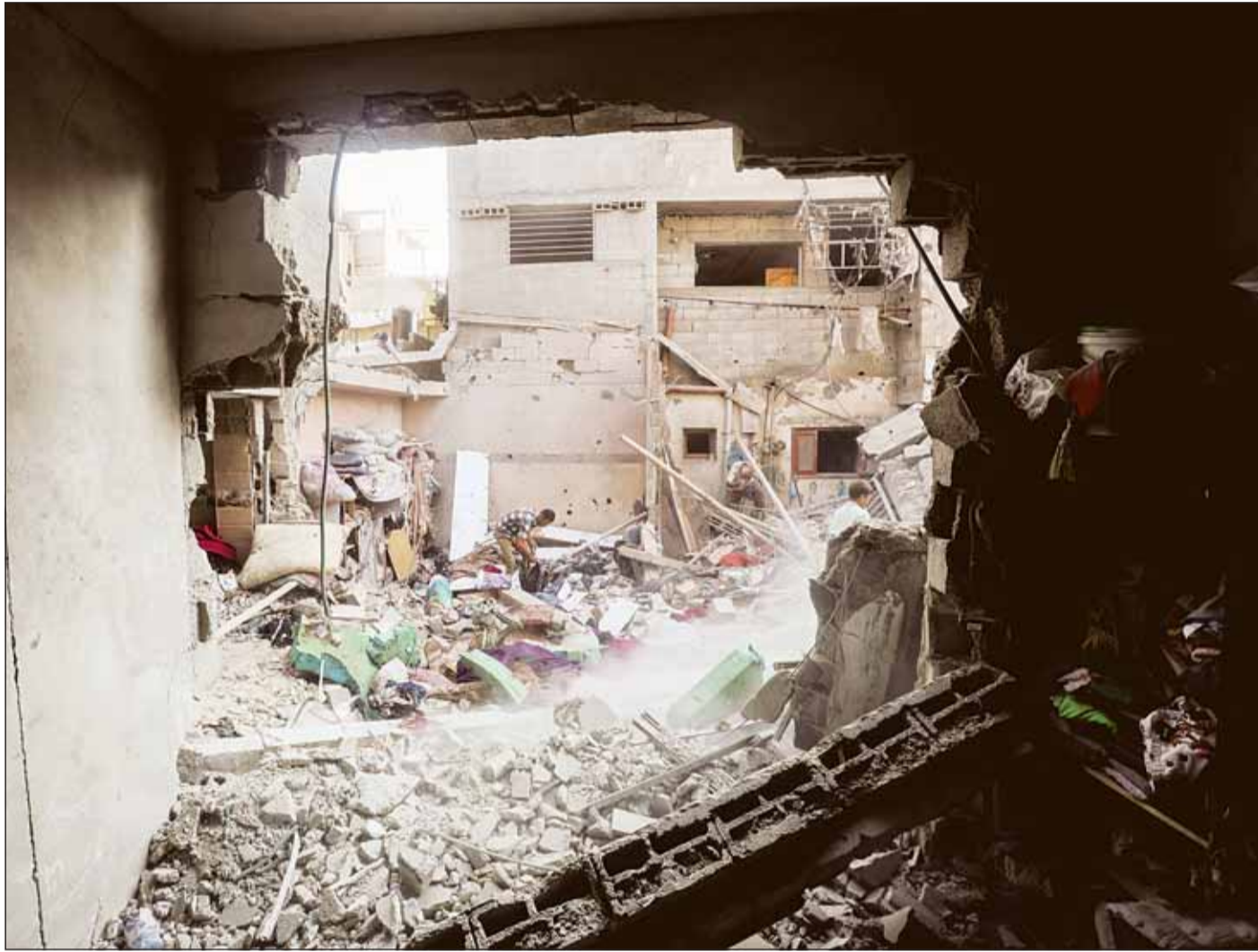
نارحون فلسطينيون يتحدثون بين ركام المنازل المدمرة عن أي متعلقات تساعدهم على الحياة وسط المجازر والقصف الإسرائيلي المتواصل

غزة، القاهرة، الدومة، عواصم - وكالات، فيما وصل وفد إسرائيلي إلى العاصمة المصرية "القاهرة" لمواصلة مفاوضات وقف إطلاق النار في غزة وإبرام صفقة تبادل أسرى بين حركة "حماس" ودولة الاحتلال، حيث أكد ثلاثة مسؤولين مصريين في المطارات وصول الوفد الإسرائيلي، كشفت مصادر أن وفد الاحتلال يضم ستة مسؤولين، دون الكشف عن هوياتهم، بينما قالت هيئة البث الإسرائيلية إنه من غير المتوقع أن يتوجه رئيس جهاز الاستخبارات "الموساد" ديفيد برنيع، أحد أعضاء فريق التفاوض هذا الأسبوع، إلى الدومة، لمواصلة المفاوضات لإبرام صفقة. ونقلت الهيئة عن مصدر إسرائيلي قوله، "لا تزال هناك فرصة لخروج وفد على مستوى الخبراء، أو احتمال آخر أن يلتقي رئيس الموساد مع الوسطاء في الولايات المتحدة، لكن فرص ذلك ضئيلة"، كما قالت مصادر مطلعة إن الاتصالات مستمرة، من ذلك المفاوضات اليومية التي يجريها رئيس "الموساد" مع القطريين والأميركيين، ونقلت الهيئة عن المصادر قولها إن الكرة لا تزال في ملعب الاحتلال. وكانت صحيفة نيويورك تايمز الأميركية قالت إن القاهرة وتل أبيب تجريان محادثات سرية بخصوص الانسحاب المحتمل لجنود الاحتلال من محور فيلا دلفيا على الشريط الحدودي بين قطاع غزة ومصر، معتبرة من شأن الانسحاب أن يزيد واحدة من أهم العقبات في وجه إبرام اتفاق لوقف حرب غزة، كما قالت قناة "كان 11" العبرية إن هناك خلافا كبيرا بين نتنياهو وفريق التفاوض الإسرائيلي بشأن محور فيلا دلفيا، إذ يصر الأول على عدم الانسحاب من المحور وبقاء قوات الجيش هناك وعدم السماح لسكان غزة بالعودة إلى شمال القطاع، وبحسب القناة، أوضح فريق التفاوض لنتنياهو أن هناك تقدما في المفاوضات، لكنه أكد أنه دون حل