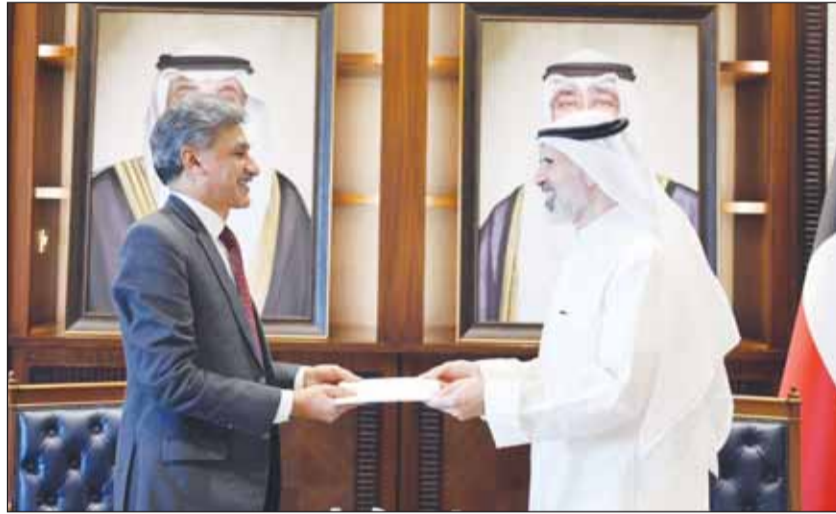
الشيخ جراح الجابر يتسلم الرسالتين من السفير الباكستاني مالك فاروق

تلقى سمو أمير البلاد الشيخ مشعل أحمد رسالة خطية من رئيس وزراء جمهورية باكستان الإسلامية محمد شهباز شريف. كما تلقى سمو رئيس مجلس الوزراء الشيخ أحمد عبدالله رئيس مجلس الوزراء رسالة مماثلة من نظيره الباكستاني. وتسلم الرسالتين نائب وزير الخارجية السفير الشيخ جراح الجابر أثناء استقباله سفير جمهورية باكستان الإسلامية مالك محمد فاروق بمناسبة انتهاء مدة عمله سفيراً لبلاده لدى دولة الكويت.