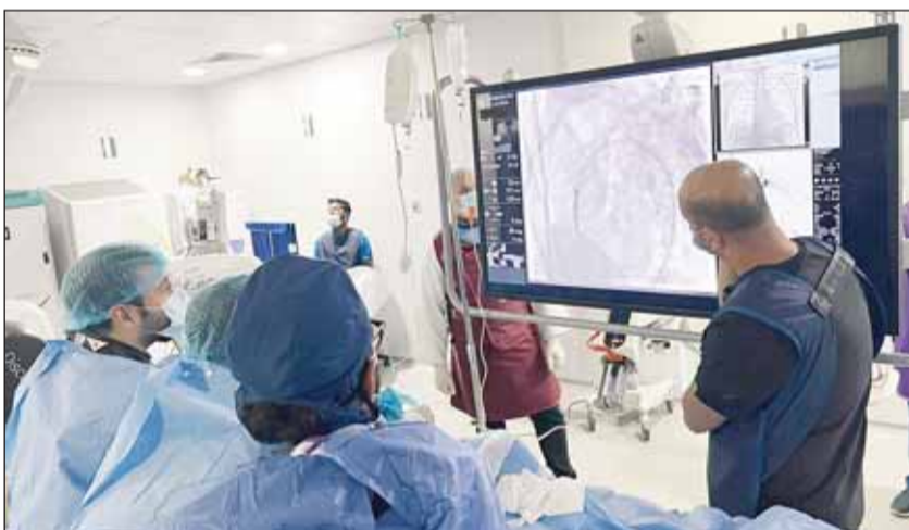
فريق جراحة الأوعية الدموية والقسطرة خلال العملية

وأشار إلى "الدور الحيوي لفريق التمريض والفنيين في كل خطوة من خطوات العلاج والدعم غير المحدود من وزارة الصحة في توفير أحدث التقنيات في علاج المرضى"، مضيفاً أن اندماج وتكامل الخبرات بين جراحة الأوعية الدموية والأشعة التشخيصية جعل مستشفى مبارك من المراكز الطبية المتخصصة والممتازة في علاج تمدد الشريان الأورطي.