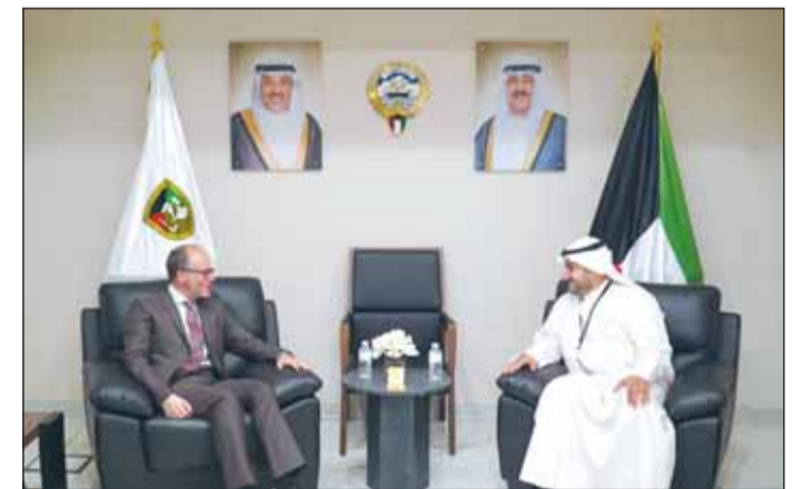
الشيخ د.عبدالله الصباح مستقبلاً الوزير الإسباني ديفغو مارتينيز بيليو

بحث وكيل وزارة الدفاع الشيخ د. عبدالله مشعل الصباح أمس مع وزير الدولة للشؤون الخارجية والعالمية في إسبانيا ديفغو مارتينيز بيليو أهم المواضيع ذات الاهتمام المشترك وسبل تعزيز أواصر التعاون بين البلدين الصديقين. وذكرت وزارة الدفاع - في بيان صحافي - أن الصباح استقبل الوزير الإسباني يرافقه سفير مملكة إسبانيا لدى الكويت ميقيل فوسي مورو أغيلار، حيث تمت مناقشة العلاقات الثنائية بين البلدين في مجال الدفاع العسكري. حضر اللقاء ممثلون من الهيئة العسكرية في وزارة الدفاع.