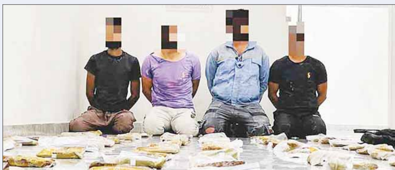
المتهمون وأمامهم المضبوطات

■ أعلنت وزارة الداخلية الكويتية أمس، إحباط محاولة تهريب نحو 160 كيلوغراماً من مادة الحشيش المخدرة حاول أربعة أشخاص تهريبها إلى داخل البلاد عن طريق البحر. وذكرت الإدارة العامة للعلاقات والإعلام الأمني بوزارة الداخلية في بيان صحافي أنه ضمن جهود قطاع الأمن الجنائي في ضبط الخارجين على القانون واستمرار اتخاذ التدابير اللازمة لتجفيف منابع التهريب والاتجار بالمواد المخدرة تم إحباط عملية التهريب وضبط أربعة أشخاص كانوا بصدد إدخالها إلى البلاد عن طريق البحر بقصد الاتجار. وأوضحت أنه تمت إحالتهم إلى جهة الاختصاص لاتخاذ الإجراءات القانونية اللازمة بحقهم.