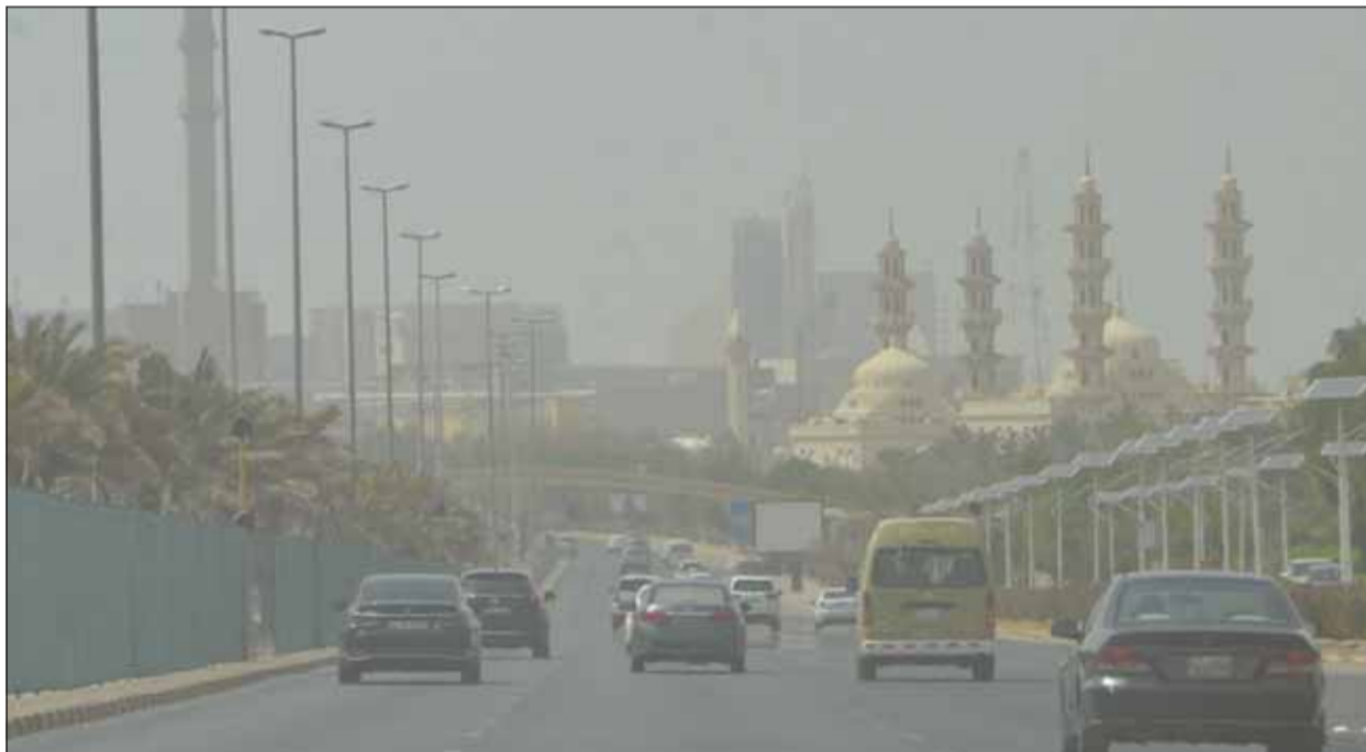
موجة من الغبار تلف البلاد خلال عطلة نهاية الأسبوع

للغبار وتتراوح درجات الحرارة العظمى المتوقعة ما بين 48 و50 درجة مئوية ويكون البحر خفيفاً إلى معتدل الموج يعلو أحياناً ما بين 2 و6 أقدام. وبين أن الطقس المتوقع غداً ليلاً يكون حاراً إلى مائل للحرارة ودرجة الحرارة الصغرى المتوقعة ما بين 33 و35 درجة مئوية. وقال القراوي إن الطقس نهار غد السبت يكون شديد الحرارة والرياح شمالية غربية خفيفة إلى معتدلة السرعة تنشط أحياناً ما بين 12 و40 كيلومتراً في الساعة وتتراوح درجة الحرارة العظمى المتوقعة ما بين 48 و50 درجة مئوية ويكون البحر خفيفاً إلى معتدل الموج يعلو أحياناً ما بين 2 و6 أقدام. وأشار إلى أن الطقس السبت ليلاً يكون حاراً إلى مائل للحرارة ودرجة الحرارة الصغرى المتوقعة ما بين 34 و36 درجة مئوية ويكون البحر خفيفاً إلى معتدل الموج ما بين 1 و3 أقدام.