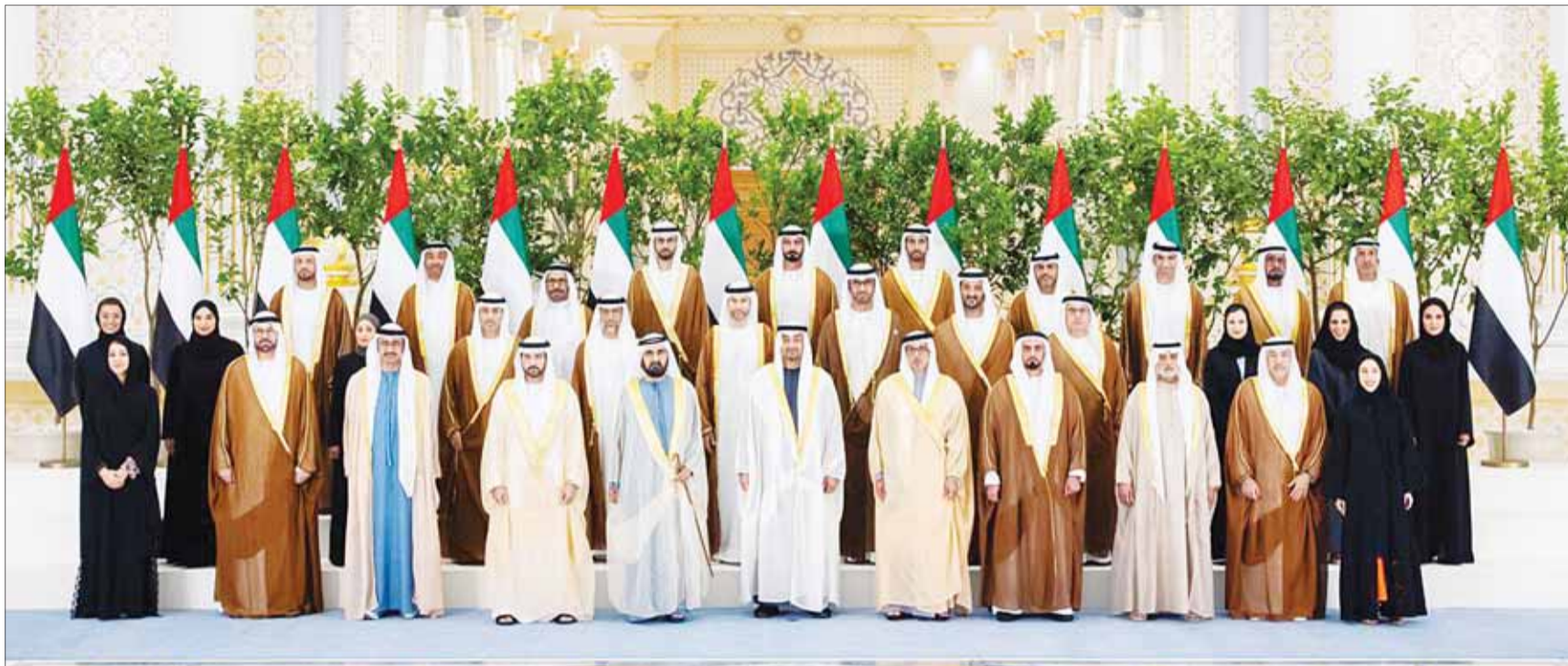
رئيس الإمارات الشيخ محمد بن زايد ونائب رئيس الدولة رئيس الحكومة حاكم دبي الشيخ محمد بن راشد في صورة تذكارية مع أعضاء الحكومة عقب أداء وزراء الحكومة الجدد اليمين أمس

الاعتناء بتاريخ الإمارات وخطوات تأسيس اتحاد الدولة، وقال على "إكس"، "في مثل هذا اليوم عام 1971، وقع الوالد المؤسس الشيخ زايد بن سلطان وأخوانه الحكام وثيقة الاتحاد ودستور الإمارات، وأعلنوا عن اسم دولتنا، تمهيداً للاتحاد في الثاني من ديسمبر"، مضيفاً "يوم تاريخي وضعوا فيه عهد الاتحاد وأسسوه، واليوم نعلن 18 يوليو مناسبة وطنية، نحتفي فيها بتاريخ دولتنا والخطوات المباركة لتأسيس الاتحاد".