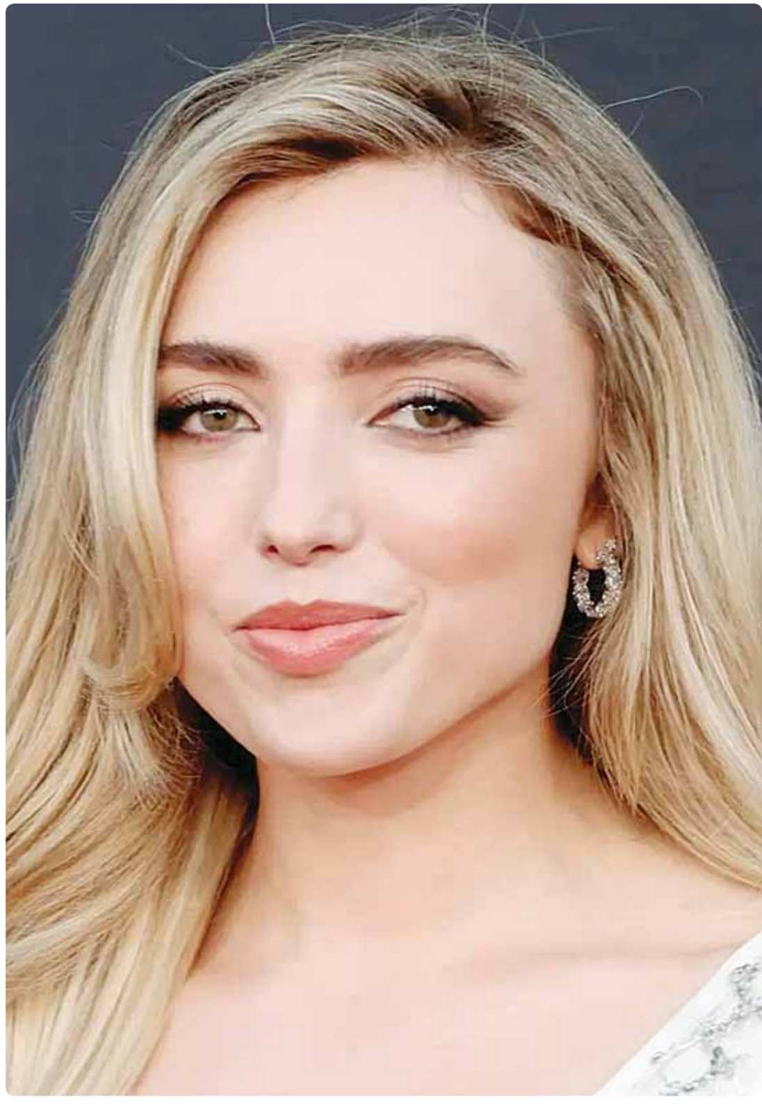
الممثلة الأمريكية بيتن ليست خلال حضورها عرض مسلسل "Cobra Kai" لوس أنجلوس

الزينة يحتاج إلى الف شبيب مثل شبيب العجمي، لنرى الكويت خضراء...زين.