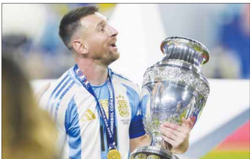
ميسي مطالب بالاعتذار عن إساءات زملائه

سعى كيلد خاصة في وقت امتقالات، لذلك أرى أن الاعتذار سيكون جيداً لبلدنا وللعالم. وفي ذات السياق، تشهد غرفة ملابس تشيلسي توترا، على خلفية حادثة ترديد نجم الفريق، الأرجنتيني إنزو فرنانديز، لأغنية فيها إهانات عنصرية بحق لاعبي المنتخب الفرنسي أصحاب الأصول الأفريقية. وكان فرنانديز يحتفل مع زملائه بالمنتخب الأرجنتيني بالفوز بلقب كوبا أمريكا 2024، عندما سفروا من المنتخب الفرنسي لاحتوائه على لاعبين من جذور أفريقية، ينتمون أساساً لدول مثل الكاميرون. وأشارت تقارير صحفية سابقة، إلى أن مدافع تشيلسي ويسلي فوفانا، وصف ما فعله فرنانديز بـ "عنصرية غير مقيدة"، في وقت ألقى فيه عدد من لاعبي الفريق متابعة النجم الأرجنتيني على منصات التواصل الاجتماعي.