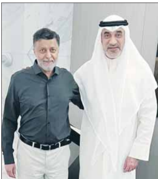
النائب الأول خلال زيارته لوزير النفط د.عماد العتيقي في تركيا

أنقرة - كونا، قام النائب الأول لرئيس مجلس الوزراء وزير الدفاع وزير الداخلية الشيخ فهد اليوسف أمس - مبعوثاً عن سمو أمير البلاد الشيخ مشعل الأحمد - بزيارة نائب رئيس مجلس الوزراء وزير النفط د.عماد العتيقي في تركيا، للاطمئنان على صحته، سائلاً المولى - عز وجل - أن يمن عليه بالشفاء العاجل وموفور الصحة والعافية والعودة إلى أرض الوطن العزيز مشافئاً معافى ليواصل عطاءه المعهود في خدمته.