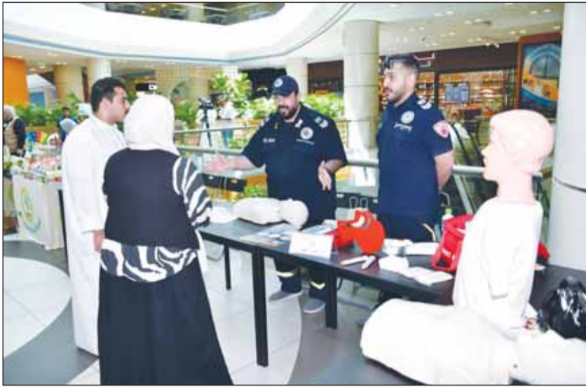
مشاركة إدارة الطوارئ الطبية فيم الحملة