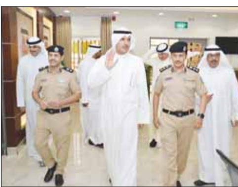
محافظ الاحمد تفقد الجولة بمراكز الخدمة

تفقد محافظ الأحمد الشيخ حمود الجابر، عدداً من مراكز الخدمة التابعة لوزارة الداخلية بالمحافظة صباح أمس. اطلع الجابر خلال الجولة على سير العمل بها، واستمع إلى ملاحظات واقتراحات عدد من المواطنين، مثمناً جهود مسؤوليها ومنتسبي مراكز الخدمة لتقديم الخدمات للمراجعين على الوجه الأمثل.