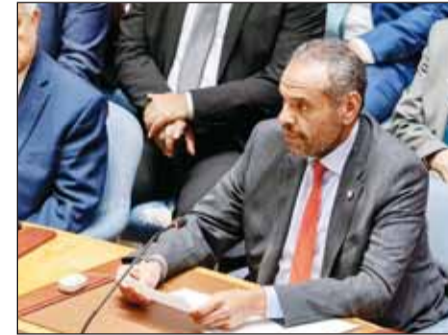
البيدا مترشساً وفد الكويت في جلسة مجلس الأمن

وطالب الوزير الجبج أيضاً الدول المتقدمة بنقل خبراتها لبناء قدرات الدول الأقل نمواً لمواجهة التحديات العابرة للدول. وفيما يتعلق باللقاءات التي قام بها على هامش زيارته مع عدد من مسؤولي المنظمات والدول الشقيقة والصديقة أفاد الوزير الجبج بأن مثل هذه اللقاءات يتم خلالها استعراض العلاقات الثنائية الوثيقة إضافة إلى بحث الموضوعات والقضايا المشتركة والاستحقاقات المقبلة والتنسيق حيالها.