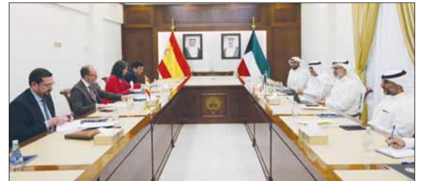
جانب من المشاورات السياسية بين وزارتي خارجية الكويت وإسبانيا

الجانبا عددا من القضايا الإقليمية والدولية لاسيما القضية الفلسطينية والجهود الدولية لإيقاف اعتداءات الاحتلال الإسرائيلي المستمرة على الشعب الفلسطيني. وأقام نائب وزير الخارجية مادية غداء على شرف الضيف والوفد المرافق له حضرها كبار المسؤولين في وزارة الخارجية.