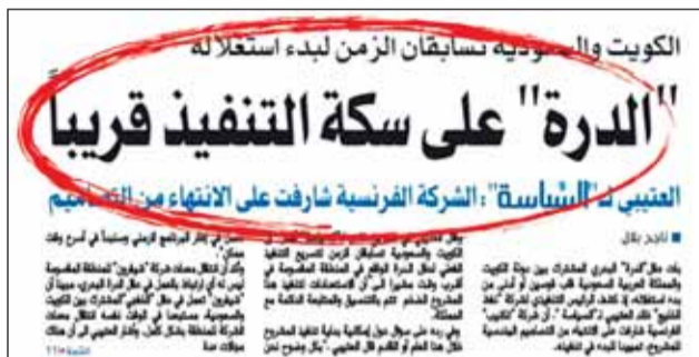
خبر "السياسة" المنشور فيه 3 مارس الماضي

الى انها تبحث عن "أرض تمويل" لمشاريعها وسوف تعتمد في تمويل هذه المشاريع على مزيج من التمويل الذاتي والاقراض والدخول في شركات مع شركاء آخرين. وأكد الصباح، "عمليات الإنتاج في المكامن البحرية تتطلب 7