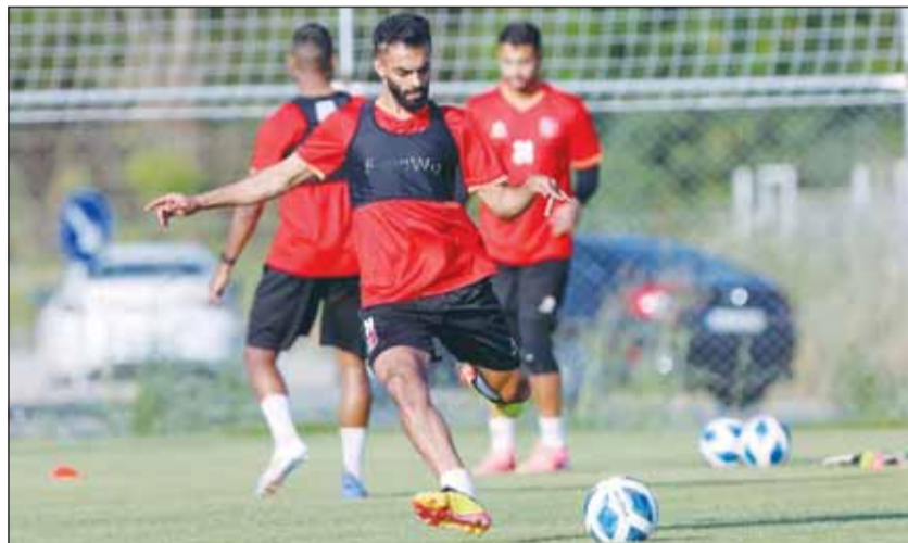
تدريبات الأبيض خلال معسكر تركيا