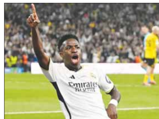
المحكمة انصفت فينيسوس

مشععي فالنسيا بالسجن لمدة ثمانية أشهر بعد اعترافهم بتهمته إهانة فينيسوس عنصرياً خلال مباراة بالدوري الإسباني في مايو 2023. وكانت هذه أول إدانة في قضايا تتعلق بالعنصرية في كرة القدم