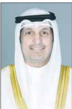
عبد الرحمن المطيري

يقدم وزير الإعلام والثقافة عبدالرحمن المطيري الأحد المقبل عرضاً بعنوان (مخرجات استراتيجية وزارة الإعلام) وذلك بمقر مركز التواصل الحكومي في الأمانة العامة لمجلس الوزراء. وقالت وزارة الإعلام في بيان أمس إن العرض سيضمن تفاصيل ما تم إنجازه من خطة استراتيجية الوزارة (2021 - 2026) منذ إنشائها حتى الآن وما استجد عليها. وأضافت أن العرض سيضمن كذلك الحديث عن أبرز ما سيتم إنجازه في الفترة المقبلة والمتبقية من خطة استراتيجية الوزارة وتوضيح الجهود المبذولة لإنجازها على أكمل وجه داعية مختلف وسائل الإعلام لحضور هذا العرض.