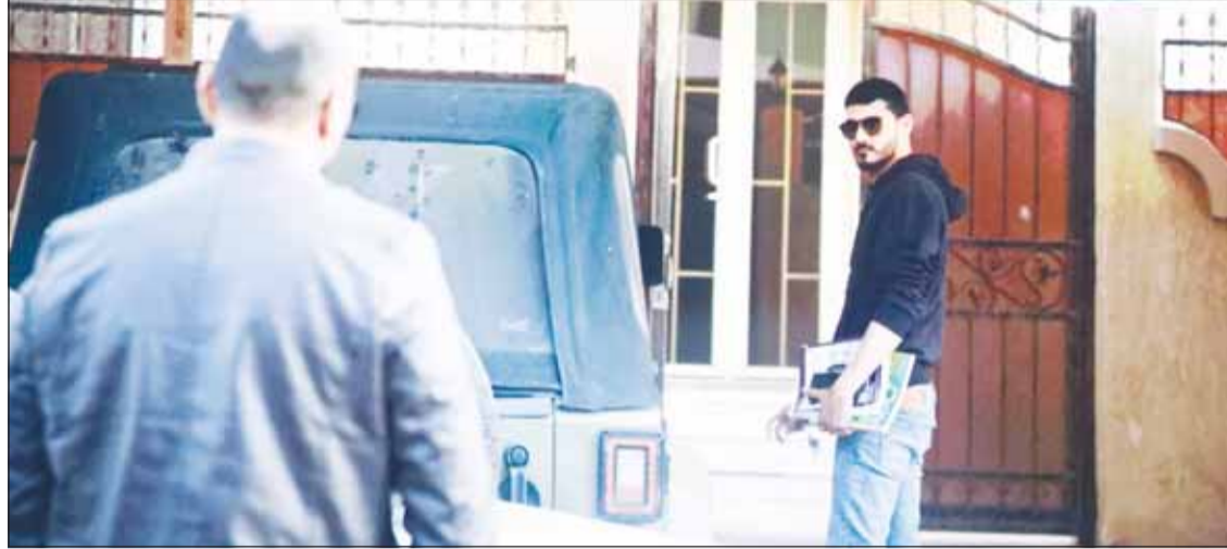
مشهد من الفيلم