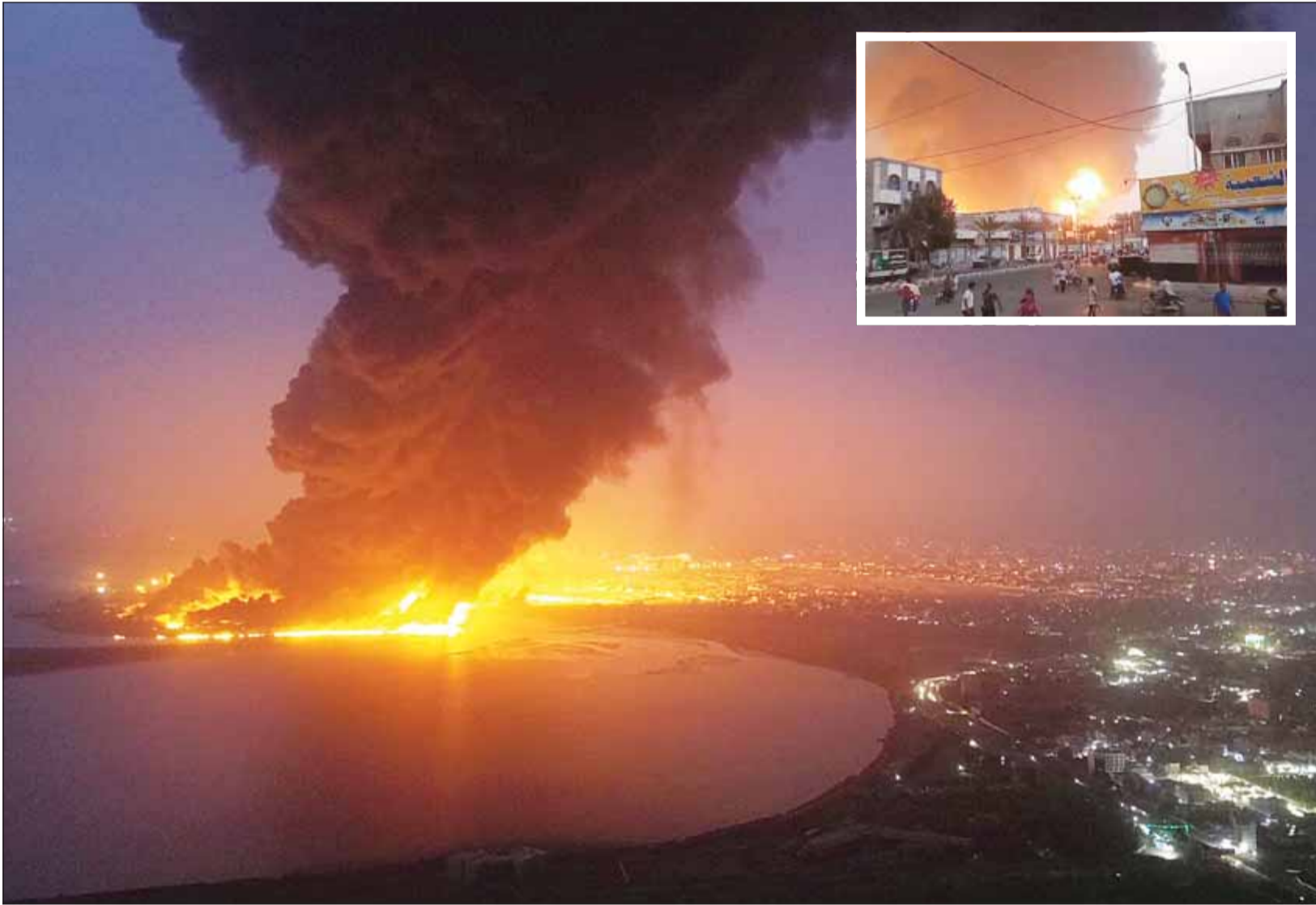
النيران تشتعل في مضافي النفط بالحديدة أعقاب الغارات الإسرائيلية التي استهدفتها أول من أمس وفيه الإضرار بمبنيين يراقبون النيران وهي تشتعل في مضافي النفط

صنعاء، عواصم - وكالات. بعد يوم من القصف الإسرائيلي العنيف على مصافي النفط وأهداف حيوية في الحديدة، أعلنت جماعة الحوثي في اليمن صباح أمس، تنفيذ عملية عسكرية نوعية قصفت خلالها أهدافاً مهمة في إيلات جنوب فلسطين المحتلة بعدد من الصواريخ الباليستية، واستهداف سفينة أميركية في البحر الأحمر، مؤكدة أن الرد على العدوان الصهيوني على الحديدة قادم لا محالة، وبينما أعلن جيش الاحتلال أنه اعترض صاروخ "سطح - سطح" تم إطلاقه من اليمن، قائلًا إن نظام الدفاع الصاروخي "أر 3" أسقط الصاروخ قبل عبوره إلى داخل الأراضي الإسرائيلية، مضيفاً أنه تم إطلاق صقارات الإنذار من الصواريخ في أعقاب احتمالية سقوط شظاياها. قال المتحدث العسكري للحوثيين يحيى سريع في بيان متلفز: "نفذت القوة الصاروخية في القوات المسلحة اليمنية عملية عسكرية نوعية استهدفت أهدافاً مهمة في منطقة أم الرشراش جنوب فلسطين المحتلة، وذلك بعدد من الصواريخ الباليستية وحققت أهدافها بنجاح"، مضيفاً أن القوات البحرية وسلاح الجو المسير والقوة الصاروخية نفذت عملية عسكرية مشتركة استهدفت سفينة "بومبا" الأميركية في البحر الأحمر بعدد من الصواريخ الباليستية والطائرات المسيرة، وأدت العملية إلى إصابة السفينة بشكل مباشر، مشيراً إلى أن العمليات تأتي انتصاراً لمظلومية الشعب الفلسطيني ومجاهديه ورداً على العدوان الأميركي البريطاني الإسرائيلي على اليمن.