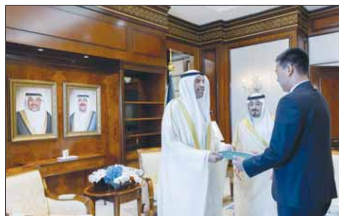
وزير الخارجية يتسلم نسخة من أوراق اعتماد سفير قيرغيزستان الجديد لدم البلاد

عمله وللعلاقات الثنائية الوثيقة التي تجمع البلدين الصديقين المزيد من التقدم والازدهار. أخيراً، تسلم اليحيا نسخة من أوراق اعتماد سفير قيرغيزستان لدى الكويت نورلان كاجينبايفيتش توكوبايف خلال اللقاء الذي تم أمس في ديوان عام الوزارة. وتمنى الوزير للسفير الجديد التوفيق في مهام عمله وللعلاقات الثنائية الوثيقة التي تجمع البلدين المزيد من التقدم والازدهار.