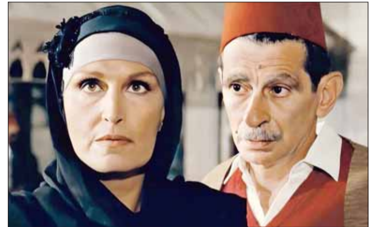
يوسف شاهين مع داليدا

تداول ناشطون عبر مواقع التواصل الاجتماعي في الأيام الماضية منشوراً كشف عن أن الفنانة الراحلة المصرية محسنة توفيق قد أوضحت في آخر مقابلة تلفزيونية لها، أنها كانت المرشحة الأولى لتجسيد الشخصية التي أدتها الفنانة العالمية داليدا، في فيلم "اليوم السادس" من إخراج الرائل يوسف شاهين. وعبرت توفيق، التي توفيت عام 2019، عن غضبها من هذا الموقف، على الرغم من أنها بدأت تصوير مشاهدتها الأولى، ودخلت في نوبة انهيار أثناء مشاهدتها له للمرة الأولى،