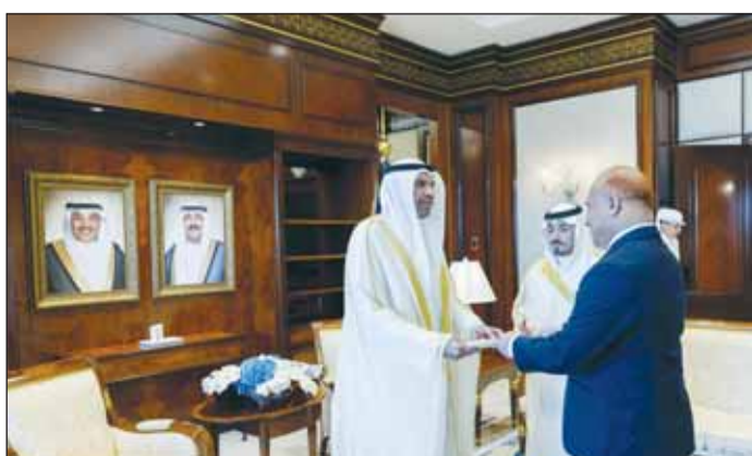
... وسفير بنغلاديش الجديد

القاضي بضرورة النأي بالمنطقة وشعبها عن مخاطر العنف والدمار، وعلى أهمية اضطلاع المجتمع الدولي ومجلس الأمن بمسؤولياتهما في إنهاء الصراعات كافة، لتؤكد على استمرار دولة الكويت في دعم الجهود الرامية لإحلال الأمن والاستقرار في اليمن، وتجنّب شعبها الشقيق مزيداً من المعاناة.