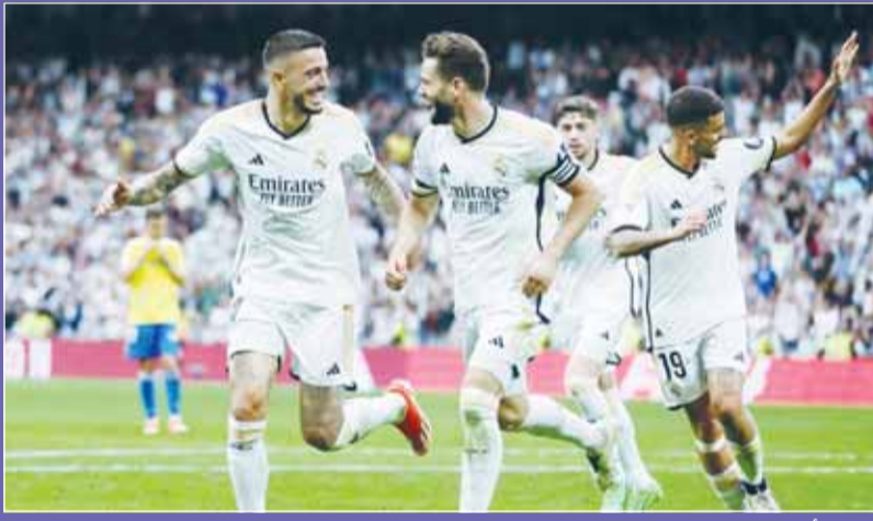
الريال الأقدم تجاريا