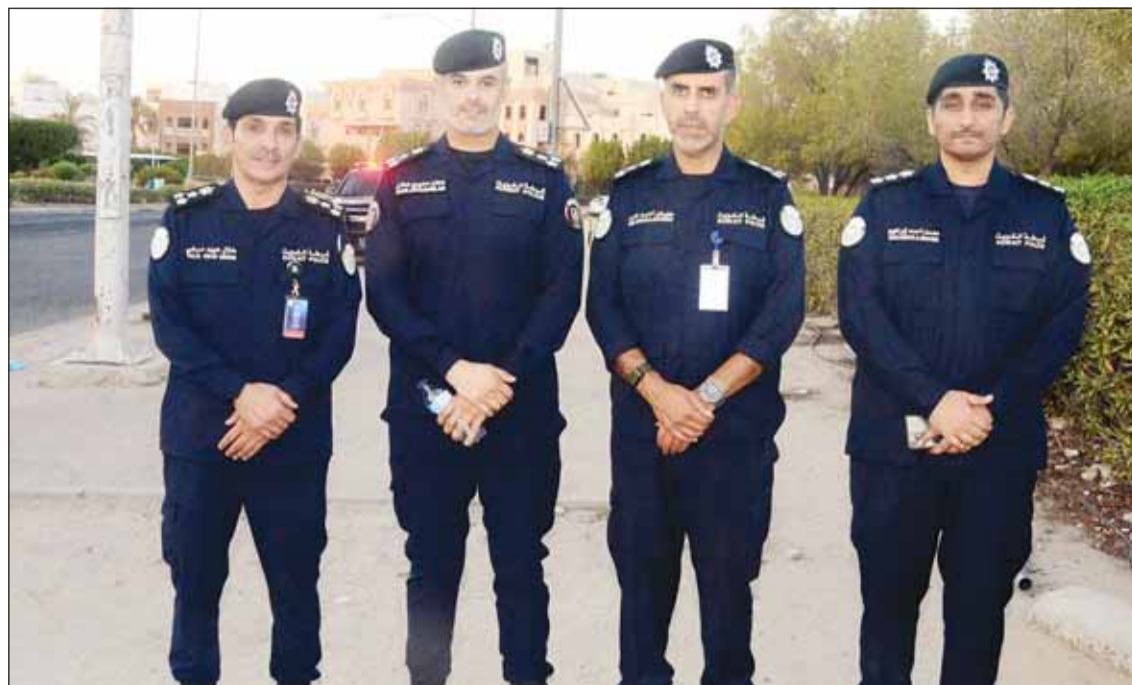
العميد سليمان الجراح وطلال العنزي وهملان الهملان والعقيد محمد ابراهيم

تقدمتها القيادات الأمنية من مختلف الرتب رغم لهيب الطقس