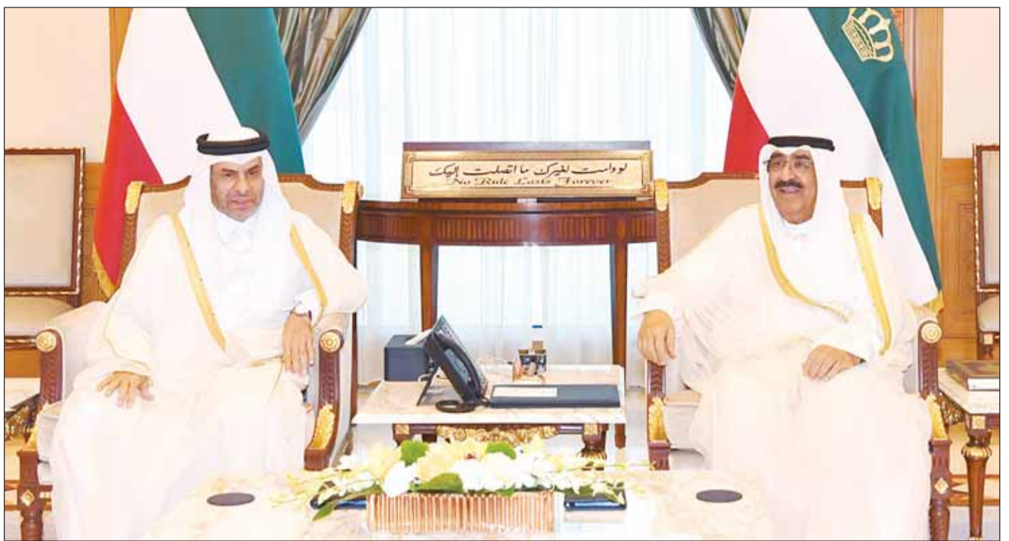
سمو أمير البلاد الشيخ مشعل الأحمد لدم استقباله السفير القطري علي آل محمود

■ تسلم سمو أمير البلاد الشيخ مشعل الأحمد بقصر السيف أمس رسالة فخرية من أخيه سمو الشيخ تميم بن حمد آل ثاني أمير دولة قطر الشقيقة تضمنت دعوة سموه للمشاركة في القمة الثالثة لحوار التعاون الآسيوي بعنوان (الدبلوماسية الرياضية) والتي ستعقد في العاصمة الدوحة خلال شهر أكتوبر المقبل. وقام بتسليم الرسالة لسموه سفير دولة قطر لدى دولة الكويت علي آل محمود.