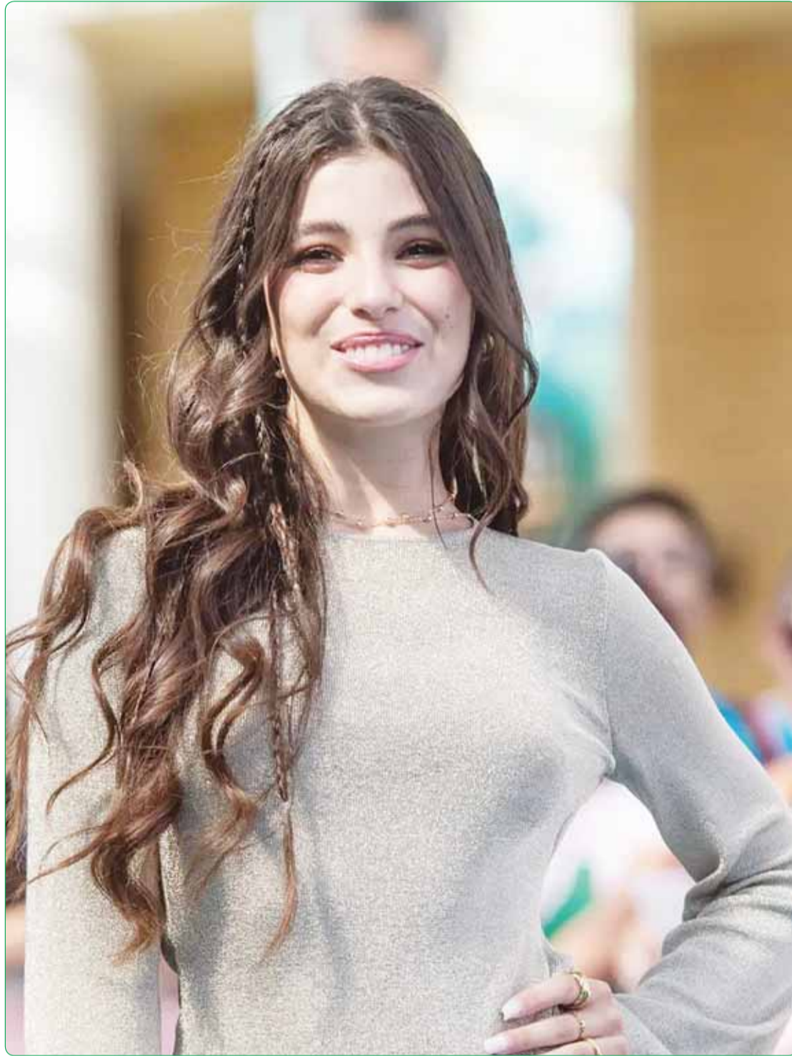
الممثلة الإيطالية جوليا إيزو خلال حضورها مهرجان "جيفونيه" السينمائي

اللهم أعد اليمن لأهله، واكفهم شر الدخلاء والغرباء... آمين.