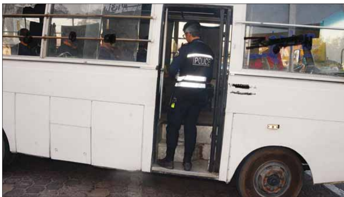
المخالفون إلى الإبعاد

ولم يمنع لهيب حرارة الطقس رجال الدائرية من الاشراف ميدانيا على الحملات المفاجئة في شارع الصحافة، حيث كانت القيادات من مختلف الرتب تتحقق وتتحقق من اثباتات وبيانات الأشخاص. وتأتي هذه الحملات المستمرة بتعليمات من النائب الاول لرئيس مجلس الوزراء وزير الدفاع والداخلية الشيخ فهد اليفوسف ووكيل وزارة الداخلية الفريق سالم النواف للقضاء على المخالفين والعمالة السائبة والهامشية.