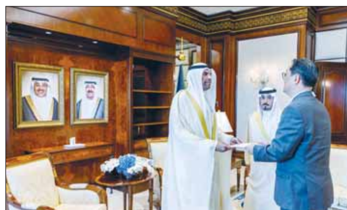
... وأوراق اعتماد سفير جمهورية كوريا