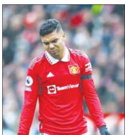
كاسيميرو يقترب من السعودية

وقيمته السوقية تبلغ تزيد من 20 مليون يورو وفقاً لموقع ترانسفير ماركيت، لذلك يتوقعون الحصول على تعويض مهم في حالة رحيله.