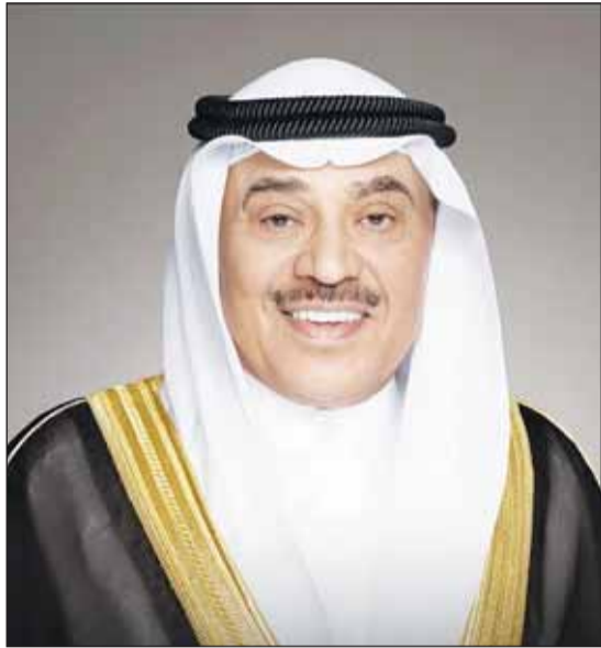
سمو ولي العهد الشيخ صباح الخالد

■ استقبل سمو ولي العهد الشيخ صباح الخالد بقصر السيف أمس، سمو رئيس مجلس الوزراء الشيخ أحمد العبدالله. كما استقبل سموه النائب الأول لرئيس مجلس الوزراء ووزير الدفاع ووزير الداخلية الشيخ فهد اليوسف. من جهة أخرى، بعث سمو ولي العهد ببرقية تهنئة إلى الملك فيليب ملك البلجيكيين ضمنها سموه خالص تهانیه بمناسبة العيد الوطني لبلاده وراجيا له دوام الصحة والعافية.