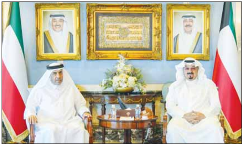
سمو رئيس مجلس الوزراء الشيخ أحمد العبدالله مستقبلا السفير القطري علي آل محمود

■ استقبل سمو رئيس مجلس الوزراء الشيخ أحمد العبدالله في قصر السيف أمس، سفير دولة قطر الشقيقة لدى الكويت علي بن عبدالله آل محمود. حضر المقابلة رئيس ديوان رئيس مجلس الوزراء عبدالعزيز الدخيل. من جهة أخرى، بعث سمو الشيخ أحمد العبدالله ببرقية تهنئة إلى الملك فيليب ملك البلجيكيين بمناسبة العيد الوطني لبلاده.