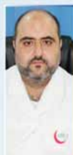
د/ إهم BDS الأسنان