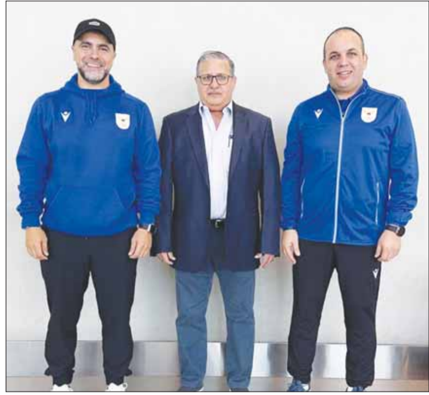
المرى مع السعدي وندوم

الألعاب الأولمبية الصيفية حيث كانت المشاركة الأولى فى أولمبياد مكسيكو عام 1968 بمشاركة لاعبين فى حين كانت أكبر مشاركة لوفد الكويت الرياضى فى أولمبياد موسكو عام 1980 بـ 56 لاعب، وكانت أول مشاركة للمرأة الكويتية فى أولمبياد أثينا 2004 عن طريق لاعبة دانة النصرالله فى ألعاب القوى، وسجلت الكويت أول ميدالية أولمبية لها عن طريق بطل الرماية الكويتي فهيد الديحاني بحصوله على الميدالية البرونزية فى أولمبياد سيدني 2000 كما أعاد الانجاز بتحقيق برونزية ثانية فى أولمبياد لندن 2012، وكان مشاركة لاعبو الكويت تحت العلم الأولمبي فى أولمبياد الريو 2016 بالبرازيل هي الأفضل على مستوى تحقيق الميداليات الأولمبية بعد تحقيق بطل الرماية الكويتي فهيد الديحاني أول ميدالية ذهبية أولمبية على صعد بطل الرماية عبدالله الطريقي مسيرته فى أولمبياد طوكيو 2020 بتحقيق الميدالية البرونزية فى الرماية، لتصبح الحصيلة النهائية للميداليات الأولمبية التي حصدها أبطال الكويت ذهبية و 4 برونزيات على مدار المشاركات الأولمبية.