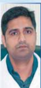
د/ شاجمان BDS, MDS الأسنان