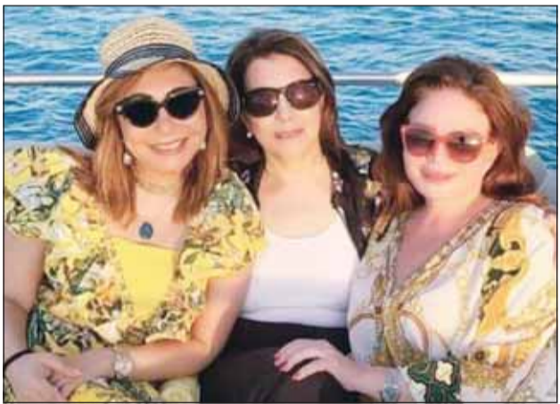
ماجدة الرومي برفقة إلهام شاهين ولويس الحديدي

نجاح حثك بالعلمين والأصدقاء الرائعة من جمهورك الذي يحبك ويحترمك". وأيدت النجمة ماجدة الرومي الجمعة حفلاً غنائياً على مسرح يو أرينا، ضمن فعاليات مهرجان العلمين الجديدة في دورته الثانية، بقيادة المايسترو نادر عباسي، وأطلقت ماجدة على جمهورها بستان طويل باللون الأبيض، كما افتتحت الحفل بأغنيتهما "عم يسألوني الناس عليك". ويحسب جريدة اليوم السابع قدمت النجمة ماجدة الرومي خلال حفلها بمهرجان العلمين في نسخته الثانية عدداً من أغانيها المميزة، وسط مناقشات الجمهور وتفاعلهم معها، منها أغنيته "غني للحب"، ولا ما راح أزعل على شي، وأنا كل ما أقول التوبة للعنديل عبد الحليم حافظ.