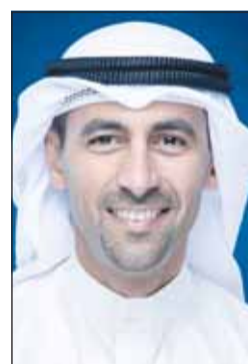
الشيخ نواف سعود الصباح