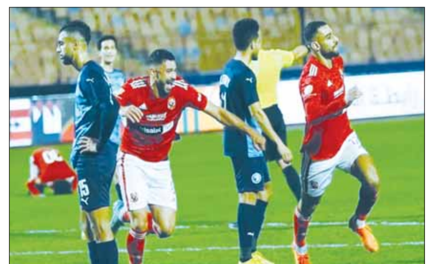
مواجهة حساسة بين الأهلي وبيراميدز

■ سيمسى الأهلي حامل اللقب إلى تحقيق الفوز على مضيئه بيراميدز عندما يواجه اليوم في ختام مباريات الجولة 31 للدوري المصري الممتاز لكرة القدم. يرغب الأهلي في تكرار الفوز على بيراميدز لتحقيق أكثر من هدف بداية من الاقتراب كثيراً من صدارة المسابقة ومنع بيراميدز من الفوز بأول بطولة في تاريخه إلى جانب الفوز باللقب المحلي المفضل لدى جمهوره للمرة 43. ويتصدر بيراميدز الترتيب برصيد 68 نقطة من 28 مباراة بفارق خمس نقاط عن الأهلي الثاني والذي لعب 25 مباراة. في المقابل يسعى بيراميدز إلى تحقيق الفوز من