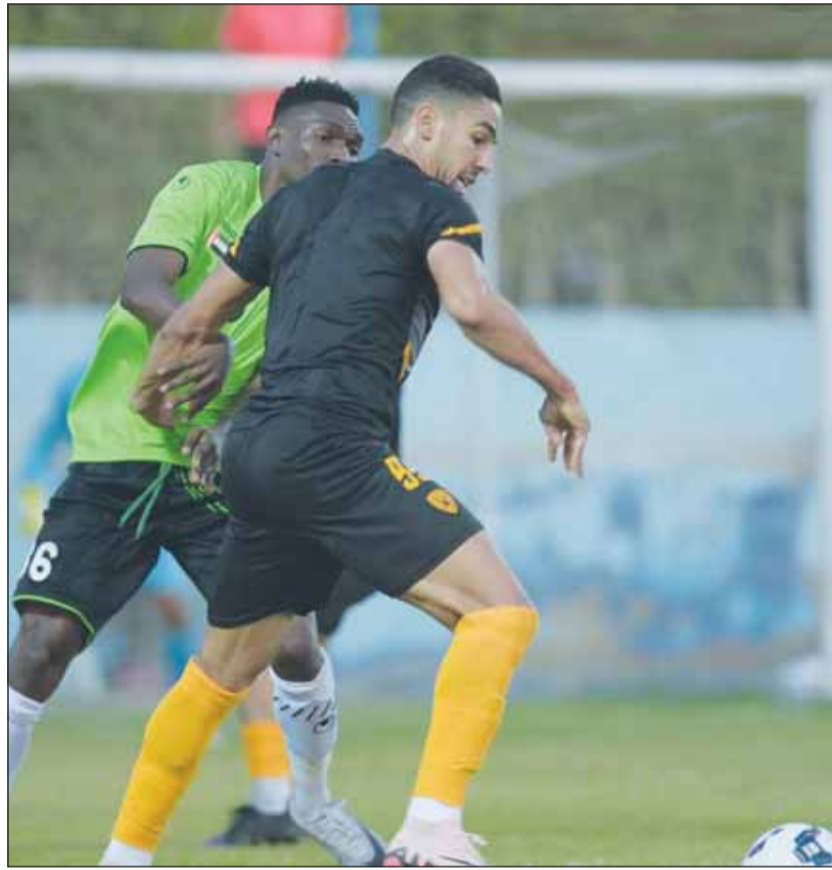
خافي سجل اسمه في أول حضور مع الأخضر

من جانب آخر، تعادل القادسية العروبة 1-1، في المباراة الودية الأولى التي يخوضها "الأخضر"