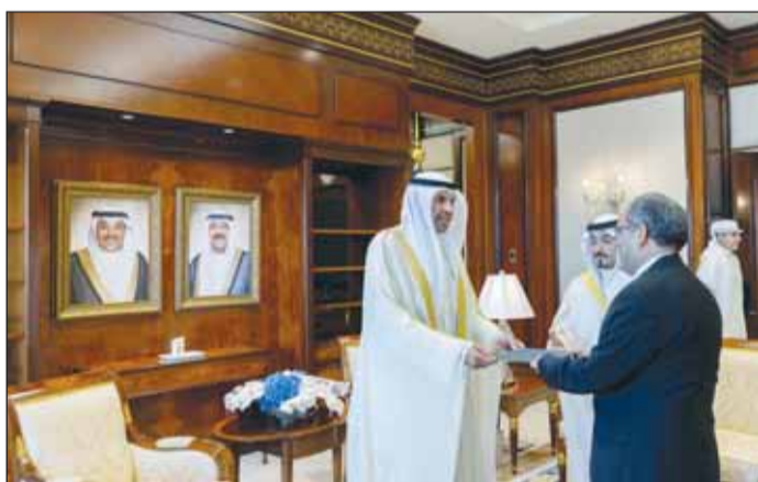
... وأوراق اعتماد سفير الجزائر الجديد