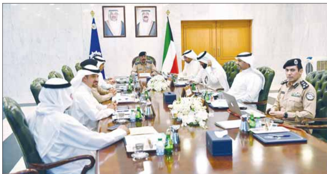
وكيل وزارة الداخلية الفريق الشيخ سالم النواف مترئسا الاجتماع

والمعملية للاختناقات المرورية وبعض المشاكل المرورية. وذكر البيان أنه تم خلال الاجتماع تقديم عرض مرئي من قبل أمين سر المجلس الأعلى للمرور العميد سالم العجمي ورئيس لجنة النقل العام المنبثقة من المجلس الأعلى للمرور، أشار خلاله الى ملاحظات اللجنة على السلبيات والعيوب التي أدت لانخفاض وتردي خدمات النقل العام (الحافلات) في البلاد.