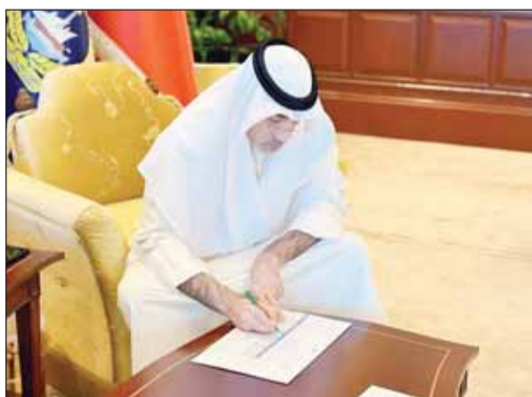
وزير الدفاع الشيخ فهد اليوسف خلال القرعة

■ شهد النائب الأول لرئيس مجلس الوزراء وزير الدفاع وزير الداخلية الشيخ فهد اليوسف مساء أمس، قرعة اختيار الضباط وضباط الصف والأفراد المتقدمين لشغل الوظائف الإشرافية الشاغرة لدى القيادة العسكرية الموحدة لدول مجلس التعاون ودرع الجزيرة الذين تنطبق عليهم الشروط والضوابط المطلوبة. وأكد الشيخ فهد اليوسف وفق بيان صادر عن وزارة الدفاع أن تطبيق نظام القرعة للاختيار بين جميع المتقدمين لشغل هذه الوظائف يأتي تحقيقاً لمبدأ الشفافية والعدالة وتكافؤ الفرص وكونها قائمة على مبدأ عدم التدخل وذلك وفقاً لضوابط وشروط واضحة من دون أي استثناءات بعد التأكد من استيفاء الشروط والمتطلبات المطلوبة لشغل هذه الوظائف. وبارك النائب الأول لإخوانه الضباط وضباط الصف والأفراد الذين وقع عليهم الاختيار بالقرعة وأوصاهم بضرورة بذل قصارى جهدهم لتمثيل الكويت والجيش الكويتي خير تمثيل متمنيا لهم التوفيق والنجاح في مهام عملهم الجديدة.