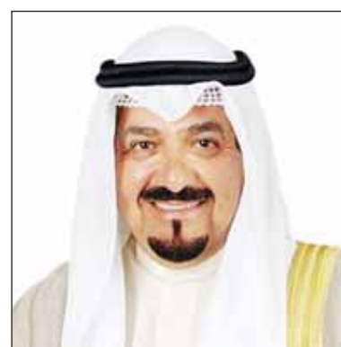
سموه الشيخ أحمد عبدالله

■ بعث سمو رئيس مجلس الوزراء الشيخ أحمد عبدالله ببرقية تعزية إلى الرئيس تولاام رئيس جمهورية فيتنام الاشتراكية الصديقة، ضمنها سموه خالص تعازيه وصادق مواساته بوفاة رئيس جمهورية فيتنام الاشتراكية الأسبق نغيون فو ترونغ.