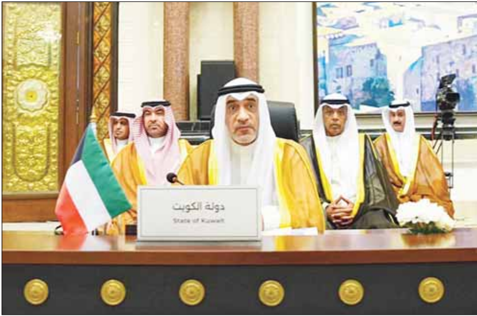
النائب الأول الشيخ فهد اليوسف مترئسا وفد الكويت في مؤتمر بغداد الثاني لمكافحة المخدرات

بغداد - كونا، بحث النائب الأول لرئاسة الوزراء وزير الدفاع وزير الداخلية الشيخ فهد اليوسف مع رئيس الوزراء العراقي محمد السوداني أمس سبل تعزيز العلاقات الثنائية وتطلع البلدين لتوسعة آفاق التعاون في مختلف المجالات والصعد. وقال المكتب الاعلامي لرئاسة الوزراء العراقية - في بيان صحفي - إن الجانبين ناقشا كذلك بناء شراكات اقتصادية مثمرة تسهم في تحقيق المصالح المتبادلة وتمتد أمن البلدين وتدعم الاستقرار في المنطقة. وأكد الجانبان ضرورة مواصلة عقد المبادرات واجتماعات اللجان العراقية-الكويتية التي تنظر في عدد من القضايا والملفات ذات المصلحة المشتركة. في الاطار نفسه، أكد النائب الأول الشيخ فهد اليوسف ومستشار الأمن القومي العراقي قاسم الأعرجي أهمية استمرار التعاون بين الكويت والعراق في إطار المعاهدات الدولية والاتفاقيات الثنائية الموقعة بين الجانبين. وذكرت مستشارية الأمن القومي العراقية - في بيان صحفي - أن تأكيدات اليوسف والأعرجي جاءت خلال لقاء عقده الجانبان على هامش التهمة 12