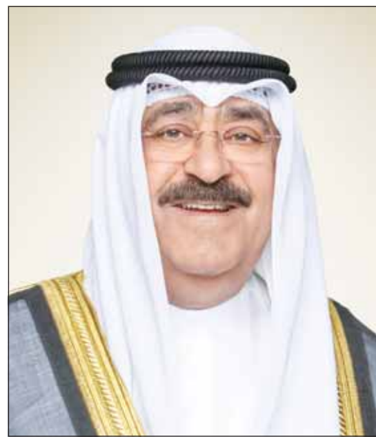
سموه أمير البلاد الشيخ مشعل الأحمد

كما بعث سمو ولي العهد ببرقية تهنئة إلى أورسولا فون دير لاين رئيسة المفوضية الأوروبية ضمنها سموه خالص التهنئة بمناسبة إعادة انتخابها لرئاسة المفوضية الأوروبية لفترة ثانية، متمنيا سموه لسعادتها كل التوفيق والسداد ودوام الصحة والعافية.