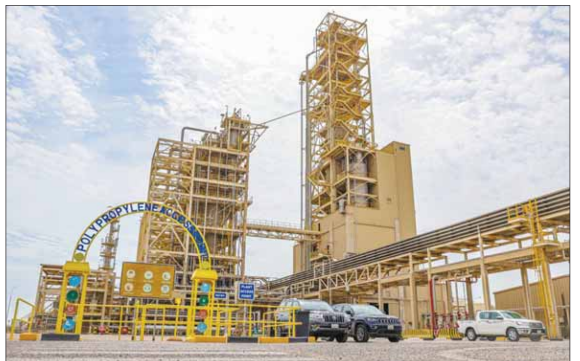
مصنع البولي بروبيلين التابع للشركة

وعلى صعيد التنمية البشرية والاستثمار في الأفراد والاستفادة من ابتكاراتهم أفادت بأن الشركة اعتمدت مبادرة تعد الأولى في القطاع الخطي بشأن تطوير مهارات الشباب الذين يمثلون 40 في المئة من العاملين فيها بهدف تعزيز دورهم في تحقيق استراتيجية 2040 إذ تم تشكيل لجنة تمكين الشباب عام 2020 وتتم مراجعة أعضائها سنوياً لأجل إتاحة الفرصة لمشاركة أعضاء جدد.