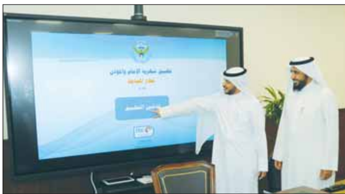
مسؤولو الأوقاف خلال تدشين تطبيق "شهرية الإمام والمؤذن"

أعلن وكيل وزارة الأوقاف والشؤون الإسلامية الدكتور بدر المطيري أن وزارة الأوقاف والشؤون الإسلامية ممثلة في قطاع المساجد وإدارة مركز نظم المعلومات استمدت تطبيقاً تكنولوجياً جديداً بديلاً للكشوف الورقية للحضور أطلقت عليه "شهرية الإمام والمؤذن"، وذلك للتسهيل على شاغلي الوظائف الدينية في تنفيذ الأعمال الموكلة إليهم. وقال المطيري في تصريح أمس ان وزارة الأوقاف والشؤون الإسلامية ومن منطلق حرصها على تطبيق الأساليب التكنولوجية الحديثة في النواحي التنظيمية لألية العمل لمواكبة التطور في وزارات ومؤسسات الدولة أطلقت هذا التطبيق الذي تتمثل فكرته بحفظ حقوق الإمام والمؤذن وتسهيل العمل ومنها سرعة صرف الرواتب