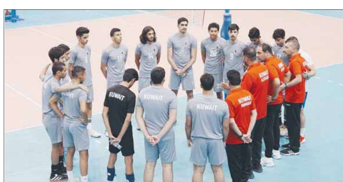
الطائرة يوجه اللاعبين بمران سابق