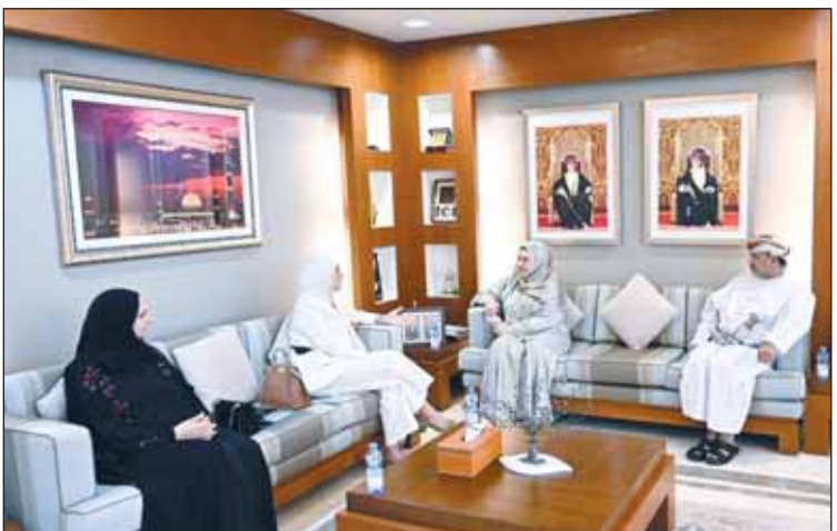
جانب من لقاء الوفد الكويتي ووزارة التعليم العالي في السلطنة درجعة المحرقية

■ بحث وفد من وزارة التعليم العالي مع نظرائه في وزارة التعليم العالي بسلطنة عمان أوجه التعاون المشترك وسبل تعزيزه في مجال التعليم العالي والبحث العلمي والابتكار، بالإضافة إلى تعزيز التعاون الأكاديمي وتطوير التبادل الثقافي والطلابي وتوأمة مؤسسات التعليم العالي في البلدين.