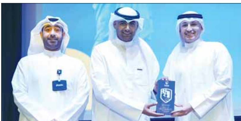
خلال تكريم "زين" في اللقاء التنويري

الرئيسي لبحث سبل التعاون بين زين والاتحاد، والاستعدادات للعام الدراسي الحالي، كما استعرض الوفد خطة الاتحاد للأنشطة المرتقبة داخل الكويت وخارجها لخدمة كافة احتياجات الطلبة والطالبات، سواءً المستجدين منهم أو الحاليين والخريجين. وتقوم زين تحت مظلة هذه الشراكة بدعم جميع الأنشطة