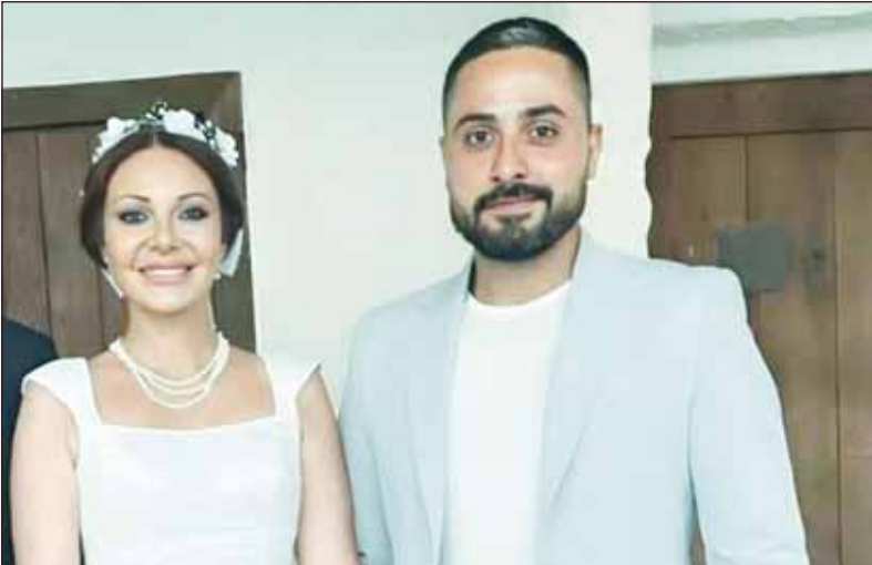
نادين تحسين بيك وإياد عيسى

■ احتفلت الفنانة السورية نادين تحسين بيك بزفافها على الممثل إياد عيسى في وادي قنديل بسورية، بعد قصة حب جمعتهم في مسلسل "كسر عضم" بجزئه الأول عام 2022. حيث قد حضر حفل الزفاف عائلة وأصدقاء تحسين بيك وعيسى، بالإضافة إلى عدد من النجوم والمشاهير والإعلاميين المقربين من العروسين. وشاركت تحسين بيك لقطات من زفافها عبر حسابها الرسمي في فايسبوك، وكثرت "دخلت القفص الذهبي، عقيل ما أفرح فيكم بكل شيء جميل يا رب."