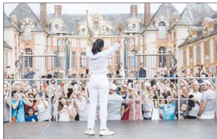
آلاف المستعدين من باريس

سكان المنطقة التي ستحتضن حفل افتتاح الألعاب الأولمبية يوم الجمعة المقبل بوسط العاصمة الفرنسية.