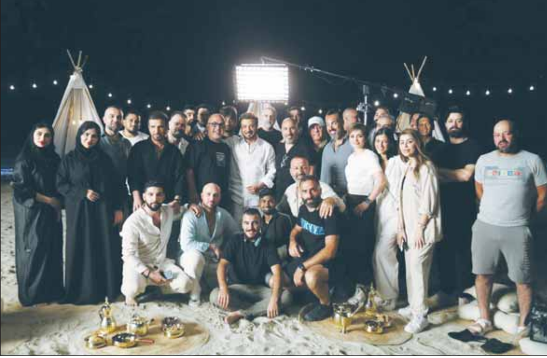
صورة جماعية للمشاركين في "الألبوم كليب"