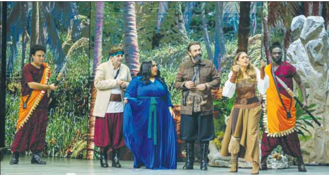
مشهد من مسرحية السندباد

■ طرحت تذاكر مسرحية "السندباد" للنجم كريم عبد العزيز في مهرجان العلمين بنسخته الثانية خلال منصة "تذكريتي" الإلكترونية، وإتاحة التذاكر لأربع فئات، حيث تعرض المسرحية لمدة 3 ليال، أيام الخميس 8 والجمعة 9 والسبت 10 أغسطس المقبل. مسرحية السندباد تعرض في مهرجان العلمين بدورته الثانية في إطار التعاون بين الشركة المتحدة للخدمات الإعلامية وموسم الرياض وهيئة الترفيه السعودية، والمسرحية من بطولة كريم عبد العزيز ونيللي كريم ومصطفى خاطر وبيومي فؤاد وويوزو. وتدور أحداث مسرحية السندباد في إطار فانتازي حول عمر أبو الهول الذي يجسده النجم كريم عبد العزيز، حيث يجد قلادة سحرية في مقبرة قديمة، تعود به إلى زمن السندباد، فيقرر أن ينتحل تلك الشخصية ليعيش حياة المغامرات والبطولات.