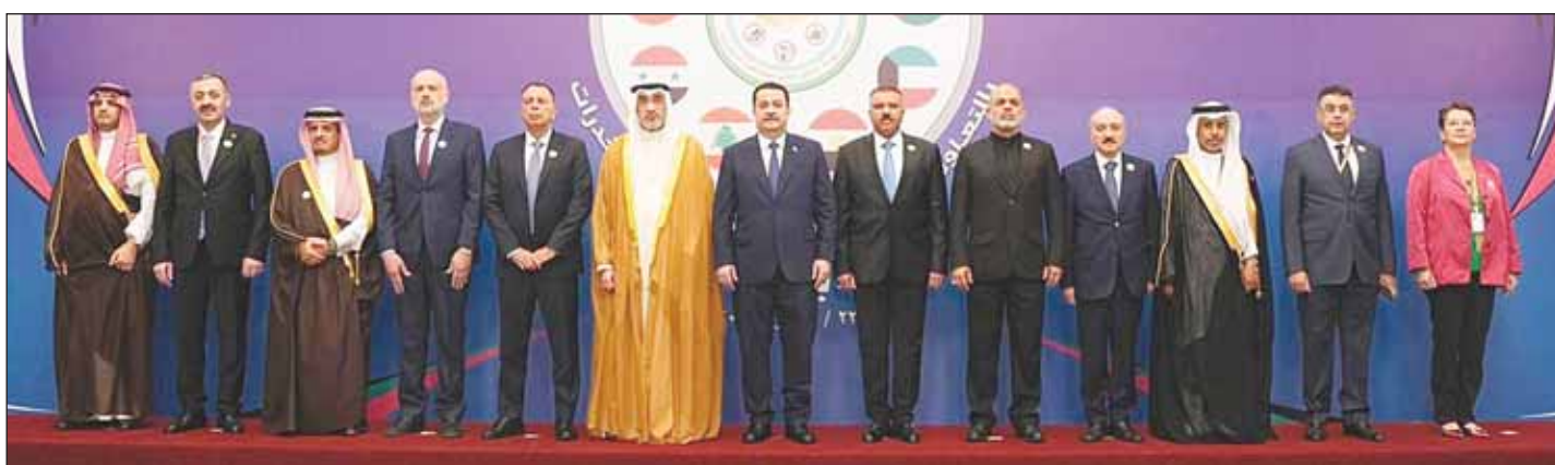
الشيخ فهد اليوسف مع وزراء الداخلية ورؤساء الوفود المشاركة في مؤتمر بغداد الدولي الثاني لمكافحة المخدرات