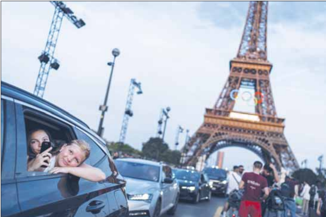
الحضور الجماهيري يعود للأولمبياد

ويريد سكان العاصمة الفرنسية أن يكون الأولمبياد بمثابة مهرجان للرياضة في الشوارع منذ إفتتاحه على ضفاف نهر السين مفتوحاً للجميع مجاناً إلا في بعض النقاط. وأول مرة في التاريخ، سيستعرض الرياضيون حفل الافتتاح خارج استاد، حيث أعدت المنظمة 94 قارباً لنقل 10500 رياضي على طريق طوله 6 كيلومترات، من جسر أوستريليز إلى ساحة تروكاديرو، وهو حفل يمكن متابعته أيضاً على 80 شاشة عملاقة ذات مواقع استراتيجية.