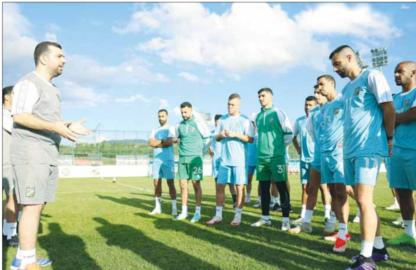
المنتخب يمتحن تعليماته للاعب العربي قبل الحصة التدريبية