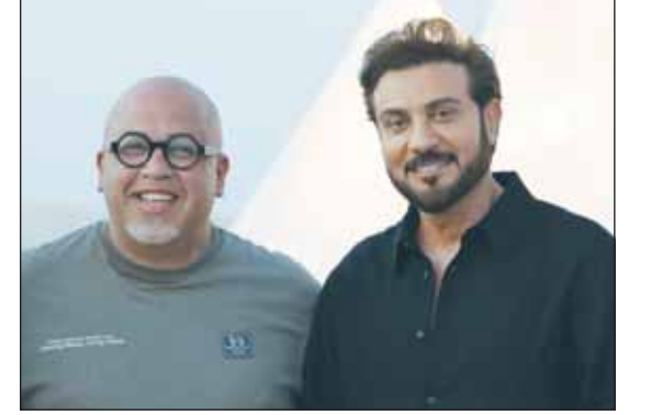
ماجد المهندس وبسام الترك

أعمالهم، وهذا ما يفرغنا عندما يقدر الفنان قيمة الصورة ودورها في توصيل رسالة الأغنية، إلى جانب الأغنية المسموعة، مشيراً إلى أن الفيديو كليب مازال يمثل قيمة حقيقية في رسم صورة الأغنية ومعناها في وجدان الجمهور. واختتم الترك كلامه بالقول: "أشكر ماجد المهندس على ثقته الدائمة والمستمرة بي، وهو دائماً يأخذني إلى أماكن مختلفة، ولهذا تكون النتيجة معنا دائماً مختلفة، من خلال إطلالته وشكل ومضمون الكليب، وأنا دائماً أتمنى أن أكون معه لأنه فنان متميز ولا يشبه أحداً، منوهاً بأن البرنس صديق حقيقي ولا يشبهه أحد وأشرف دائماً بالعمل والتعاون معه، لأنه بثقته الكبيرة التي يمنحها لكل من يعملون معه يكون العمل أكثر إبداعاً". الجدير بالذكر أن المخرج الترك هو مصور كليبات العديد من النجوم منهم الفنان عبد الله الرويشد، ماجد المهندس، وليد الشامي وغيرهم.