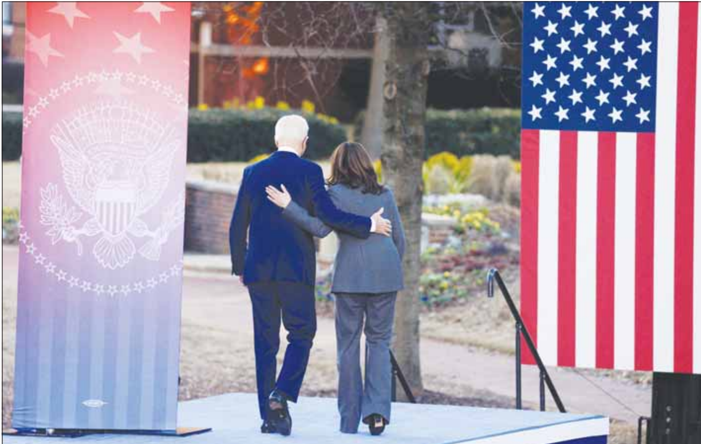
الرئيس الأمريكي جو بايدن ونائبة الرئيس كامالا هاريس خلال زيارة لكتبة مورهاوس وجامعة كلارك أتلانتا في أتلانتا

وعلى صعيد الجمهوريين، ستكون لانسحاب بايدن انعكاسات لا مفرّ منها على حملة الرئيس السابق ترامب، إذ سيضطر لإعادة رسم استراتيجيته الانتخابية التي تمصورت بشكل كبير إلى الآن على وضع بايدن الصني والذهني، وكثف فريق الحملة في الأونة الأخيرة من المواد الدعائية التي تركز على بايدن وهو يرتكب الهفوات أو يتعلم ويتعثر، لكن يُخشى أن يتقلب السحر على الساحر، ويصبح تركيز الدعاية على السنّ والقدرة الذهنية سلاماً للديمقراطيين بمواجهة ترامب البالغ من العمر 78 عاماً، خصوصاً في حال نالت هاريس التي تصغره بزهاء 20 عاماً، ترشيح الحزب، وقد تعمد هاريس التي أصبحت في مارس أول نائبة للرئيس تزور عبادة للإله، إلى جعل القضية محوراً أساسياً في مواجهة ترامب، لكن حملة ترامب تؤكد أن انسحاب بايدن لم يأخذها على حين غرة، وأن المسؤولين عنها أعدوا حملات دعائية موجهة ضد هاريس ستبث في عدد من الولايات المتقاطية في السباق الانتخابي خلال الأيام القليلة المقبلة.