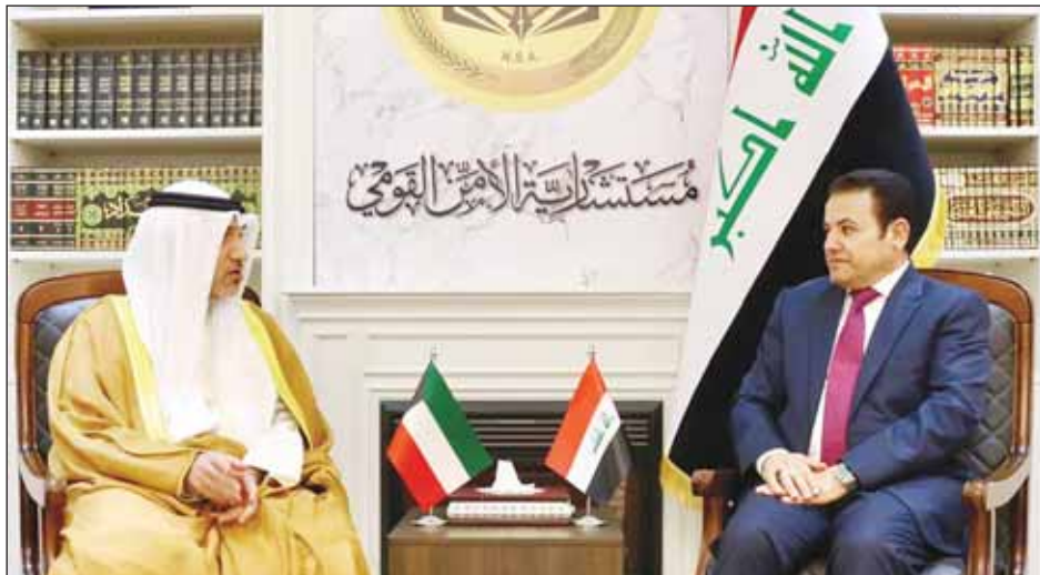
الوزير الشيخ فهد اليوسف خلال الاجتماع مع مستشار الأمن القومي العراقي قاسم الأعرجي

وزير الداخلية: مواصلة التعاون الأمني والإقليمي والدولي لمواجهة المخدرات والتصدي للشبكات الإجرامية إنشاء قنوات اتصال ومراجعة التشريعات