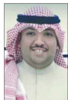
الشيخ ناصر الجراح الصباح

أصدر النائب الأول لرئيس مجلس الوزراء وزير الدفاع وزير الداخلية الشيخ فهد اليوسف قراراً بتعيين الشيخ ناصر محمد الجراح الصباح مديراً عاماً للشؤون الإدارية في وزارة الداخلية. جاء القرار استكمالاً لتسكين المناصب القيادية في جميع إدارات قطاعات وزارة الداخلية التي انطلقت في مارس الماضي.