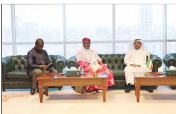
العتيبي مستقبلاً سفيرة سيراليون

بدورها، أبدت السفيرة حاجا ايشاتا طوموس امتنانها وشكرها للكويت بشكل عام وللهيئة بشكل خاص على ما تقدمه من جهود تخصص قضايا الجالية، مؤكدة السعي الدائم لتطوير العلاقات بين البلدين بما يخدم مصلحة جميع الأطراف.