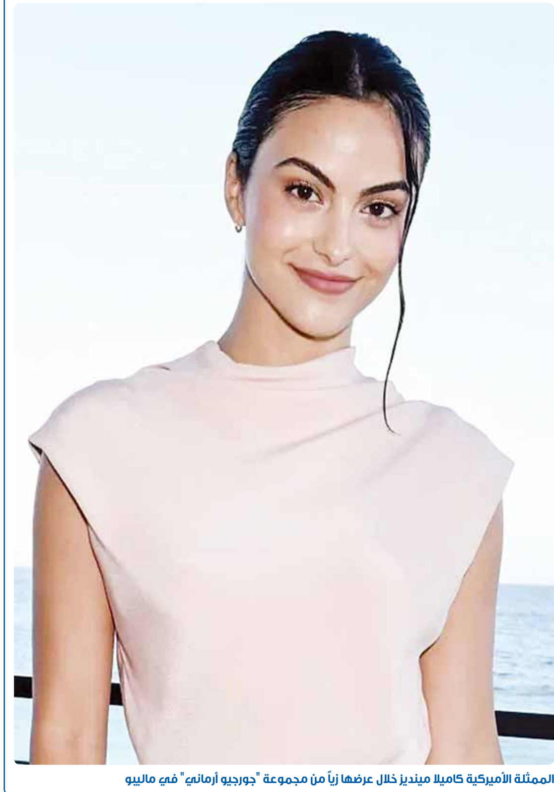
الممثلة الأميركية كاميليا مينديز خلال عرضها زياً من مجموعة "جورجيو أرماني" في مالميو

نسأل الله ان يغفر لأحيائنا، وأمواتنا، ويحفظ بلدنا وأميرنا، وولي عهد من كل شر ومكروه... آمين.