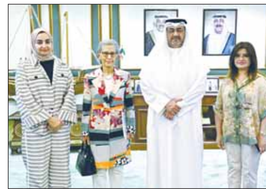
محافظ العاصمة مستقبلاً اللجنة التنسيقية لمنطقة قرطبة