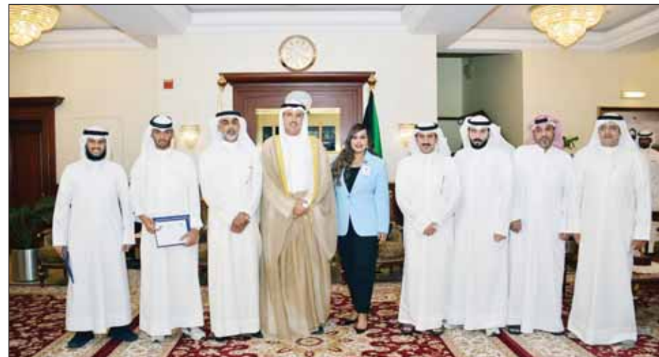
محافظ الأحمد ومسؤولو بنك برقان والمنطقة التعليمية يتوسطون الطلاب المكرمين وأولياء الأمور

والمالي وصولاً إلى الاعتراف بإنجازاتهم، كما أننا فخورون جداً بأن نكون شركاء مع محافظة الأحمد في الاحتفال بنجاح خريجينا المتميزين، وواثقون بأننا سنحتفل بمزيد من النجاحات في المستقبل.