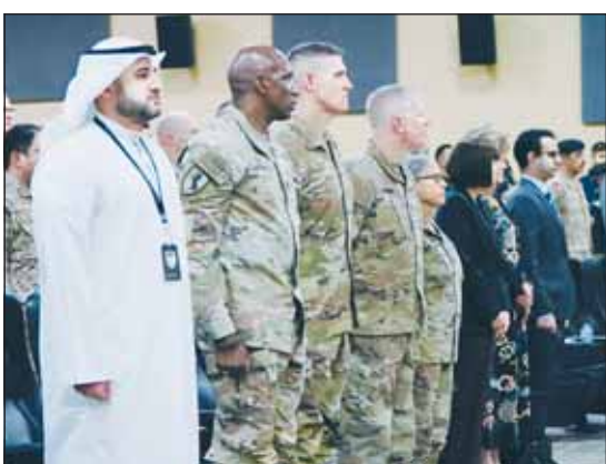
المشعل لادم حضوره مراسم تغيير القيادة في عريفجان