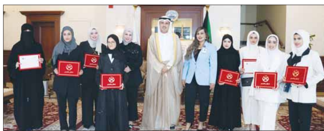
المحافظ الشيخ حمود جابر الأحمد الصباح مع فريق برقان والطالبات الفائحات

قام بنك برقان مؤخراً بدعم فعالية محافظة الأحمدية لتكريم الطلبة المتفوقين في الثانوية العامة على مستوى مدارس المحافظة، وذلك في إطار استراتيجيتها البنك الشاملة للمسؤولية الاجتماعية، وانطلاقاً من سعيه لترسيخ مبادئ الحوكمة البيئية والاجتماعية والموسمية، والارتقاء بمساهمته في تطوير وزدهار المجتمع، خصوصاً من خلال دعم المواهب الوطنية الشابة والقطاع التعليمي ككل، حيث يمثل هؤلاء الطلبة والطالبات مستقبل الكويت المشرق.