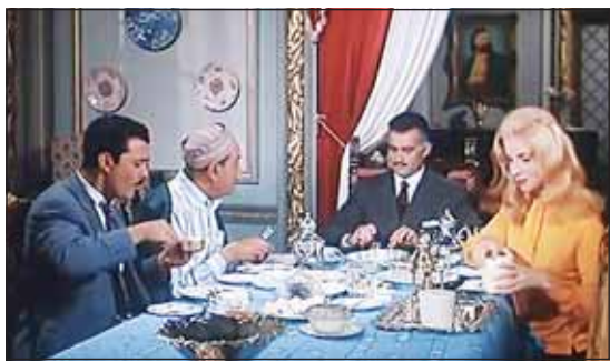
مشهد من فيلم الأيدي الناعمة

وبعد ذلك يتمكنان من الزواج، وقد تم تصنيف الفيلم في المركز الثالث عشر ضمن أفضل 100 فيلم في تاريخ السينما المصرية في استفتاء النقاد عام 1996 في احتفالية مئوية السينما المصرية. وهناك أفلام أخرى كثيرة منها: فيلم "الباب المفتوح" لغاتن حمامة وفيلم "يوسعيد" لفريد شوقي وهدى سلطان وفيلم "الأيدي الناعمة" لأحمد مظهر وصباح وصالح ذو الفقار، وفيلم "الحقيقة العارية" لماجدة ومن نامية أخرى، أنتجت السينما أفلاما أخرى لمهاجمة العصر الملكي وسليبياته وإفخافاته مثل أفلام: غروب وشروق، القاهرة 30 بداية ونهاية، في بيتنا رجل، وعبرت تلك الأفلام عن حقبة تاريخية هامة في تاريخ مصر وهي الملكية. ومن الأفلام أيضا فيلم "الله معنا" لعلماد حمدي وفاتن حمامة، فقد تناول الحدث، وكان من إرهاصات الثورة وهو عن قصة الأديب الكبير إسمان القنوس، وأخراج أحمد بدرخان وشارك في بطولته أيضا محمود المليجي، ماجدة، شكري سرحان، وحسين رياض والفيلم كان يتناول ذهاب الضباط للمشاركة في حرب فلسطين ثم إصابتهم ما أدى إلى غضب بين رجال الجيش، ويتكون تنظيم الضباط الأحرار لكي ينتقموا للوطن وتنتهي الأحداث بالإطاحة بملك البلاد وتولي الجيش مقاليد الحكم.