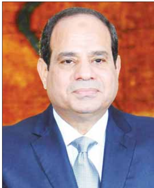
الرئيس المصري عبد الفتاح السيسي