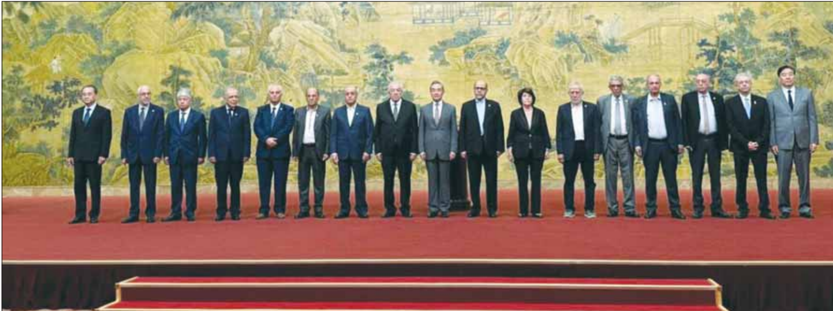
وزير الخارجية الصيني وانغ يي، متوسطاً فيه بكين قادة وممثلين 14 فصيلاً فلسطينياً عقب اتفاهم على تشكيل حكومة مصالحة وطنية موقته لإدارة غزة بعد الحرب (وكالات)

■ غزة، بكين، عواصم - وكالات. في خرق جديد لا يقل أهمية عن اتفاق التطبيع الذي رعته بكين بين السعودية وإيران، أعلن وزير الخارجية الصيني وانغ يي أمس، اتفاق 14 فصيلاً فلسطينياً على تشكيل حكومة مصالحة وطنية موقته لإدارة غزة بعد الحرب، قائلاً خلال توقيع "إعلان بكين" من جانب الفصائل في العاصمة الصينية بين أن أهم نقطة في هذا الاجتماع هو الاتفاق بين الفصائل المشاركة على تشكيل حكومة مصالحة وطنية موقته حول إدارة غزة بعد الحرب، موضحاً أن الاتفاق يتطرق إلى إدارة غزة بعد الحرب، وهي إحدى النقاط التي يدور النقاش بشأنها من أطراف مختلفة منذ أشهر، مشدداً على أن المصالحة شأن داخلي بالنسبة إلى الفصائل الفلسطينية، لكن في الوقت عينه لا يمكن أن تتحقق من دون دعم المجتمع الدولي، مؤكداً أن بلاده حريصة على أداء دور بناء في حماية السلام والاستقرار في الشرق الأوسط، مشدداً على أن بكين تدعو إلى وقف لإطلاق النار يكون شاملاً ودائماً ومستداماً، إضافة إلى بذل الجهود لدعم الحكم الذاتي الفلسطيني والاعتراف بدولة فلسطينية في الأمم المتحدة.