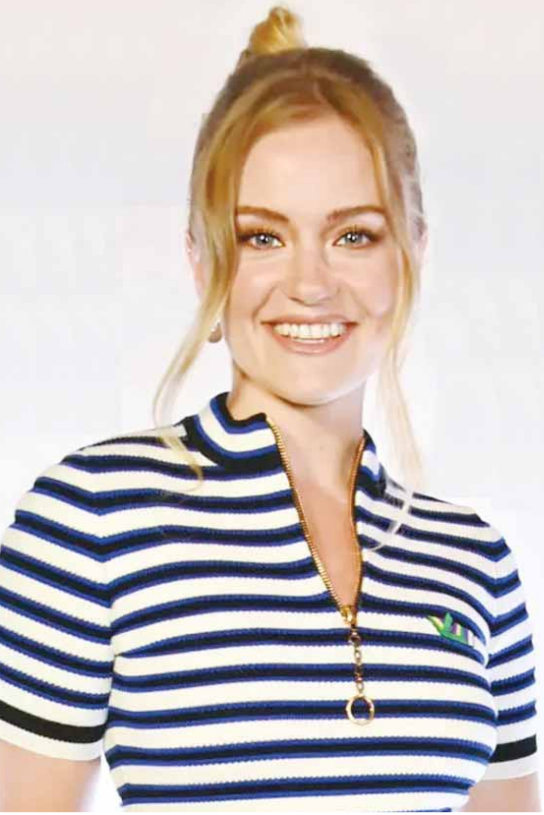
الممثلة السويدية أليسبا أغنيسون خلال حضورها سباق "Hankook London ePrix" في لندن

نظراً لأن هذه الميليشيات تُدار من إيران، علينا أن نسال