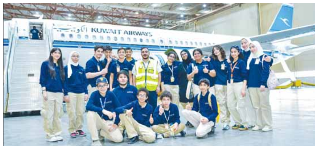
فريق المركز العلمي مع أحد المسؤولين بـ"الكويتية"

نظمت شركة الخطوط الجوية الكويتية رحلة ميدانية تثقيفية للشباب والشابات المشاركين في برنامج التدريب الميداني للمركز العلمي في مرافق الشركة المختلفة على مدار ثلاثة أيام خلال الفترة من 14 - 16 يوليو 2024، حيث تخلت الرحلة زيارة إلى حظيرة الطائرات في دائرة الهندسة وتعريف الشباب والشابات المشاركين على آلية وإجراءات صيانة الطائرات وفحصها وفق أفضل التقنيات والتكنولوجيا المتقدمة.