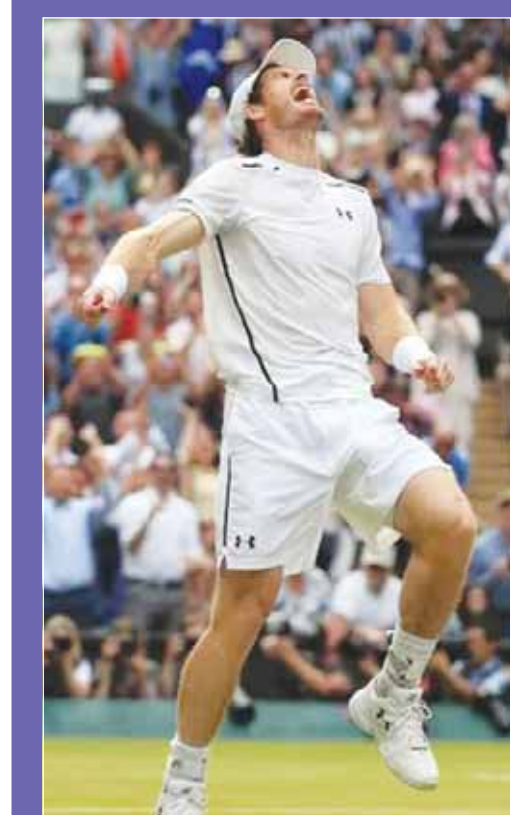
البريطاني أندى موراي

أعلن لاعب التنس البريطاني أندى موراي اعتزاله اللعبة عقب أولمبياد باريس وذلك بعدما نشر أمس على حساباته بمواقع التواصل الاجتماعي أنه وصل لباريس للمشاركة "في آخر بطولة تنس له". وفقد موراي فرصة توديع منافسات الفردى في بطولة ويمبلدون بعد خضوعه لجراحة قبل أسبوع واحد من بدء البطولة.