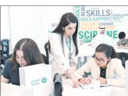
جانب من البرنامج التدريبي

وبالنسبة لحساب السنبلة فهو يمثل الخيار الأمثل لكل الراغبين بتوفير الأموال وتحقيق عوائد مالية مناسبة على أرصحتهم في الوقت نفسه بالإضافة إلى فرص الفوز بجوائز نقدية طوال العام. وصول الشروط قال عبد العزيز سعود البخيّث - مدير منطقة المجموعة المصرفية للأفراد، "يتطلب الآن وجود 100 د.ك لدخول سمويات السنبلة الأسبوعية والسمويات الكبرى، علماً بأن العميل لا زال يحصل على فرصة واحدة مقابل كل 10 د.ك في الحساب، والفرص تقتسب على حسب أدنى رصيد في الحساب خلال الشهر. لذلك يجب أن يكون قد مضى على المبلغ شهر كامل في الحساب للتأهل للسحب الأسبوعي، وشهرين كاملين للسمويات الكبرى لاقتساب الفرص. هذا ولا توجد قيود أو حدود للسحب والإيداع، كلما زاد المبلغ المودع زادت فرص العميل للربح".