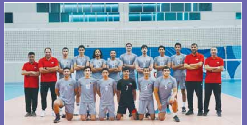
منتخب شباب الكرة الطائرة