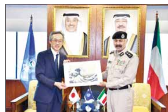
الفريق الشيخ سالم النواف والسفير الياباني مورينو ياسوناري

استقبل وكيل وزارة الداخلية الفريق الشيخ سالم النواف أمس سفير فوق العادة والمفوض من دولة اليابان لدى الكويت مورينو ياسوناري والوفد المرافق له. وثمان الفريق جهود السفير ياسوناري في تعزيز وتنمية العلاقات الثنائية التي تجمع البلدين الصديقين، وتم خلال اللقاء بحث عدد من الموضوعات ذات الاهتمام المشترك.