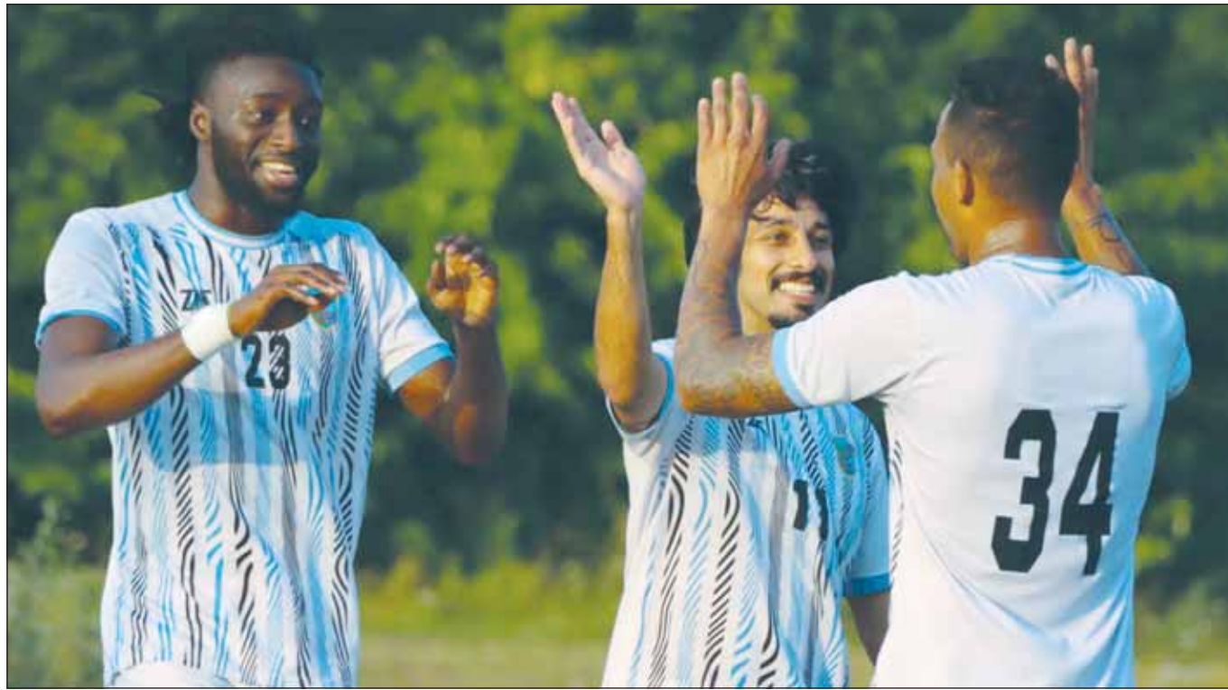
ليما يشارك الحشاش وسنانغ فرحة أحد الأهداف

وسيجوز السالمية مبارياتين وديتين خلال ما تبقى من فترة المعسكر، وذلك استعداداً للمشاركة في دوري زين الممتاز الذي سينطلق يوم 9 أغسطس المقبل.