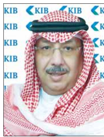
الشيخ محمد الجراح

نتائج مالية إيجابية بفضل استراتيجيته طويلة المدى والتي تواكب التطورات والمستجدات المتسارعة في القطاع المصرفي، مع التركيز بشكل أساسي على الابتكار، وسعيها المتواصل إلى تحقيق مهمتها في تقديم تجربة مصرفية استثنائية لعملائها، والحرص على تطبيق أفضل الممارسات المصرفية المسؤولة، وإدارة المخاطر، مع الالتزام بتوفير قيمة مضافة لمساهميها. واستعرض بوفخمين أبرز النتائج المالية للنصف الأول من العام 2024، حيث ارتفعت الإيرادات التمويلية لتصل إلى مبلغ 89 مليون دينار مقارنة بمبلغ 82 مليون دينار تقريباً وبنسبة نمو 9% على أساس سنوي، وارتفاع صافي الإيرادات التمويلية ليصل إلى مبلغ 31 مليون دينار مقارنة بمبلغ 23 مليون دينار وبنسبة نمو 33% على أساس سنوي، وارتفاع إيرادات الائتمار والمعاملات لتصل إلى مبلغ 7,8 مليون دينار تقريباً مقارنة بمبلغ 6 ملايين دينار وبنسبة نمو 28% على أساس سنوي،