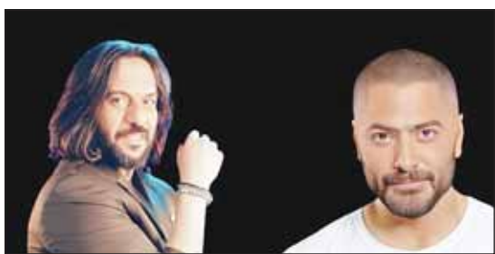
تامر حسني وبهاء سلطان

من كلمات محمود سليم وألمان تيام علي وتوزيع هشام محمد وماستر علي فاتح الله وبيترارات محمد مغربي. وكذلك طرح بهاء سلطان أغنية جديدة بعنوان "مارتناش" من كلمات هاني رجب وألمان إسلام معز وتوزيع عمرو صلاح ومننتج فني سعيد إمام ومدير إنتاج ماجد سليمان. وبحسب "اليوم السابع" كان النجم بهاء سلطان قد طرح عدداً من الأغاني خلال الفترة الماضية، منها أغنية "دادينا" و"ندر عليا"، وهي من كلمات أيمن بهجت قمر، ألمان محمد يحيى وتوزيع وسام عبدالمعتم، كما طرح أغنية "دلوقتي عجبناكو" كلمات مئة القيحي وألمان عزيز الشافعي وتوزيع أحمد عادل ومكس ماهر صلاح وماسر جلال صمدوي، وطرح أيضاً أغنية "الجو ولع" من كلمات باسم عادل وألمان محمد يحيى وتوزيع وسام عبدالمعتم.