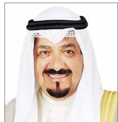
سمو الشيخ أحمد العبدالله

بعث سمو رئيس مجلس الوزراء الشيخ أحمد العبدالله ببرقية تهنئة إلى الرئيس عبد الفتاح السيسي رئيس جمهورية مصر العربية الشقيقة بمناسبة ذكرى ثورة الثالث والعشرين من يوليو.