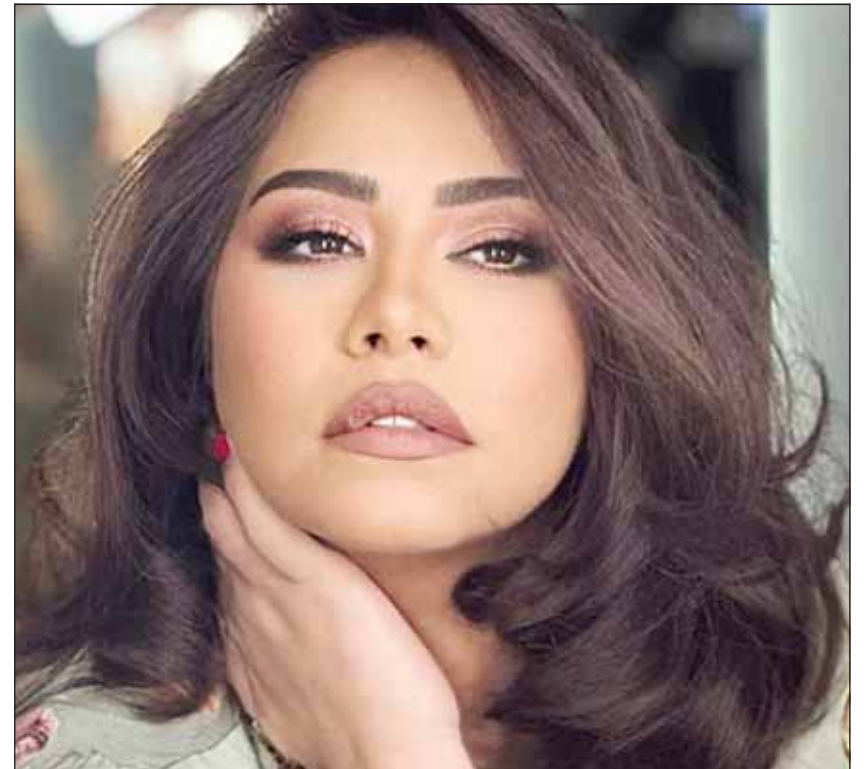
شيرين عبد الوهاب

وقدمت السينما الكثير من الأعمال عن ذلك الحدث الذي غير مصر وخرية العالم آنذاك وكان للسينما المصرية دور عظيم في مباركة الثورة من خلال رصدها وتوثيقها وذلك حينما خلدها بمجموعة من الأفلام المتميزة، ويأتي فيلم "رد قلبي" لمريم فخر الدين وشكري سرحان وأحمد مظهر على قائمة الأفلام التي رصدت النضال الاجتماعي للثورة على أسرة مصرية فقيرة وبسيطة، فهذا الفيلم اعتبره أيقونة من أيقونات ثورة يوليو لأنه تناول معاناة الشعب المصري قبل الثورة من خلال قصة حب الأميرة "إنجي" ابنة الباشا لابن اللاح البسيط "علي"، والذي يصبح ضابطا في الجيش وتمر الأيام حتى تندلع الثورة