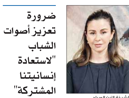
الشيخة الزين الصباح

واستهدف التكريم الاجتماع مقالات هؤلاء الطلاب المتميزين العميقة حول العنف وطولهم المبتكرة التي سيتم تضمينها ضمن الكتابات المحفوظة في مكتبة الكونغرس الأمر الذي سيسهم في توثيق أصواتهم وأفكارهم للأجيال القادمة.