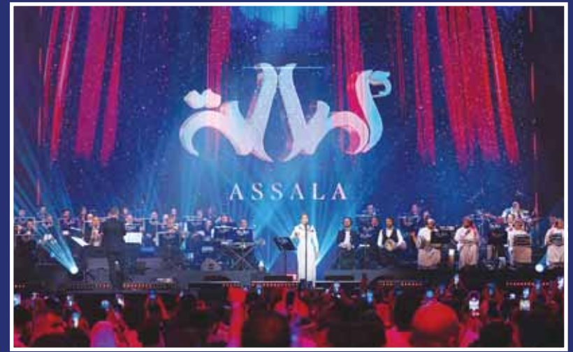
حضور كامل العدد