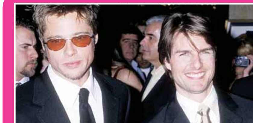
براد بيت وتوم كروز

ليوجه له الانتقادات". وأشار مصدر لـ "إن تاتش" إلى أن "توم أصبح شديد التمسك بـ (بريطانيا)، ولا يجب أن يسرق براد الأضواء منه من خلال تصوير فيلم كبير هناك. كما أن عمل براد يزججه مع نفس الفريق الذي استأجره توم لتصوير فيلم "Top Gun: Maverick"، بمن فيه المنتج جيري بروكهايمر والمخرج جوزيف كوسينسكي". وكشف المصدر، "كان هناك ضجة كبيرة حول أن براد سيمدو حدو نجاح توم، ويحقق مليار دولار عندما يعرض الفيلم في دور السينما الصيف المقبل، الذي لم يزل إعجاب توم". وتابع: "إنه مقتنع بأن براد، الحائز جائزة الأوسكار، يتدخل في حياته عمداً ويحاول أن يظهره بمظهر سيئ