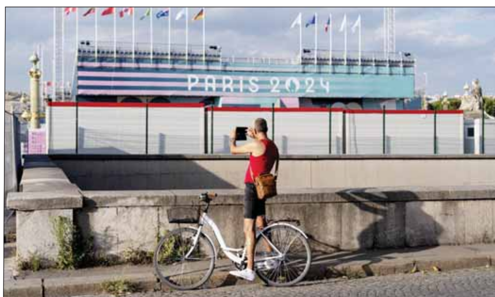
التوقعات تشتعل قبل بدء منافسات "باريس 24"

ذهبية، مقابل 17 ذهبية لبريطانيا. وتشير التوقعات إلى أن فرنسا ستضاعف تقريبا عدد الميداليات التي حصتها في 2021، حيث حققت 33 ميدالية، كما أن التوقعات بأن فرنسا ستحصد 27 ميدالية ذهبية سيكون تقريبا هو ثلاثة أضعاف العدد الذي حققتة قبل ثلاثة أعوام حيث حصت 10 ميداليات ذهبية، وسيكون إجمالي الميداليات البالغ 63 ميدالية هو أكبر عدد ميداليات في تاريخ البلاد منذ حصدها 115 ميدالية عندما استضافت الأولمبياد للمرة الأولى في عام 1900 أي قبل 124 عاماً.