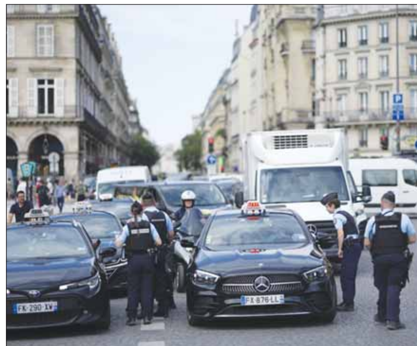
الأمن الفرنسي يستنفر قبل الاولمبياد

الأراضي الفرنسية"، و142 شخصاً صُنّفوا على أنهم "S" ("أمن الدولة")، حسب تفاصيل من مصدر قريب من الوزير لوكالة "فرانس برس". من بين المستعبدين، هناك أيضاً 260 شخصاً مسجّلين كمترقبين، و186 شخصاً مسجّلين كجاسوس متطرف و96 شخصاً مسجّلين كجاسوسين متطرف، حسب المصدر عينه. وسيتمركز يومياً حوالي 35 ألف شرطى ودركي و18 ألف جندي فرنسي كمعدل وسطي لتأمين الألعاب.