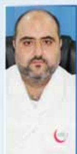
د/ ايمهم BDS الأسنان