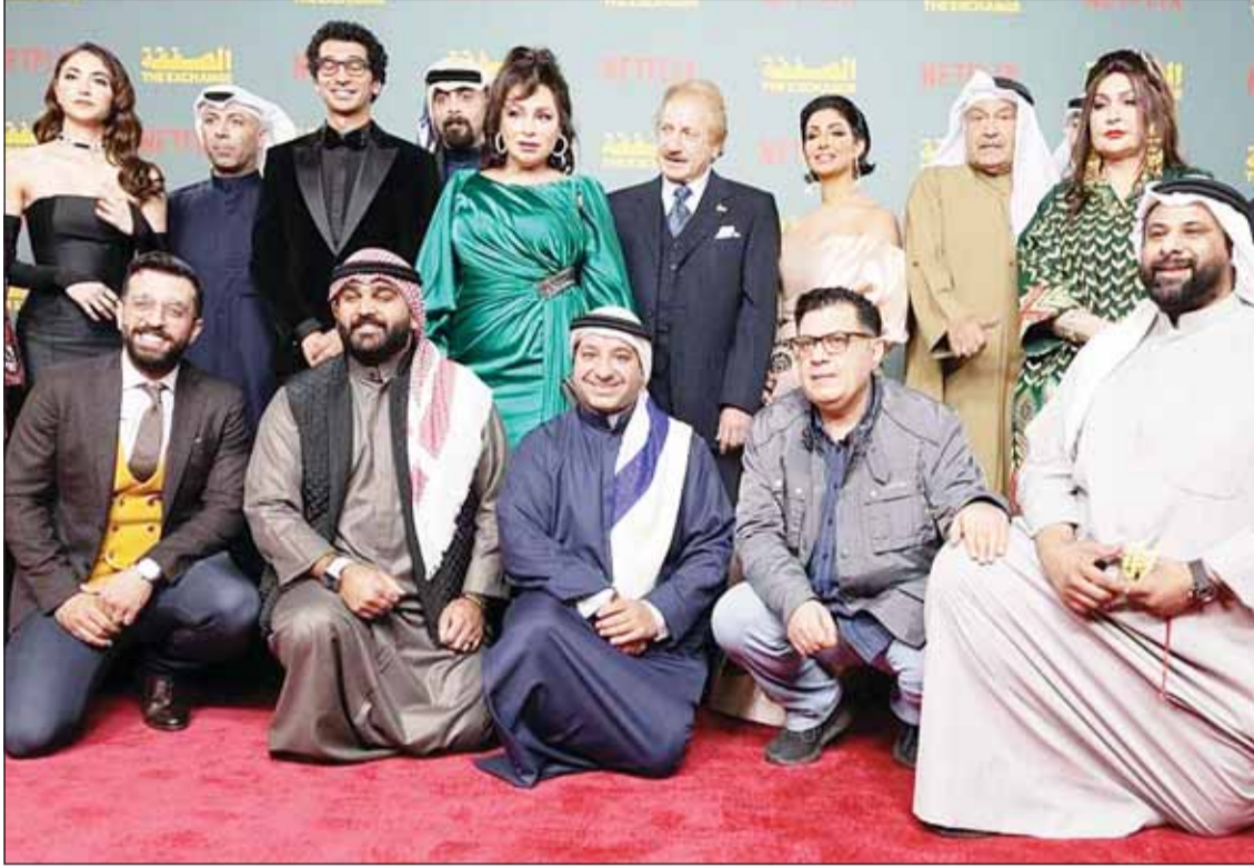
نجوم مسلسل الصفة