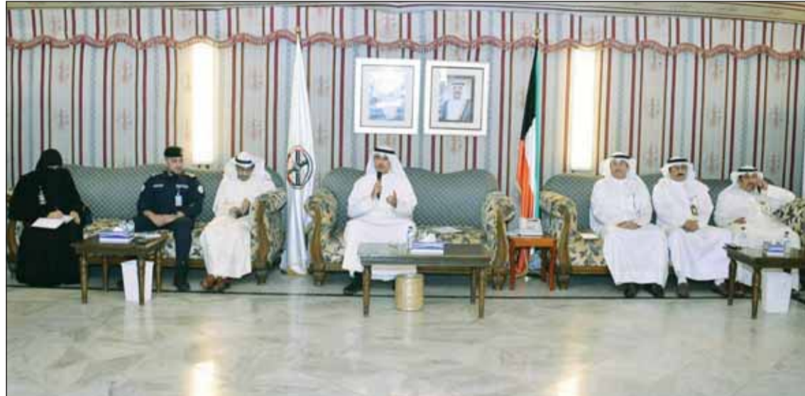
محافظ الأحمدى، متوسطاً عدداً من المسؤولين خلال اللقاء

بين المواطنين والمسؤولين، تهدف إلى استماع مسؤولي وممثلي الجهات الخدمية إلى كل الملاحظات مباشرة من المواطنين، وصولاً إلى أفضل وأسرع الحلول المناسبة. شهد اللقاء عرضاً لأبرز المشكلات والنواقص في الخدمات بمختلف مناطق المحافظة، تركزت على المدافق العامة والطرق والخدمات الأمنية والصحية والمرورية والتعليمية، والتي وجدت اهتماماً لافتاً من قبل المسؤولين، الذين وعدوا بالعمل على إيجاد حلول عاجلة لها.