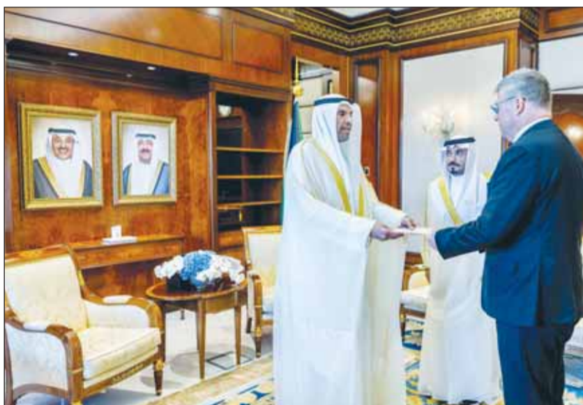
الوزير عبد الله اليحيا يتسلم نسخة من أوراق اعتماد السفير التشيكي بورايه خميل

تسلم وزير الخارجية عبدالله اليحيا نسخة من أوراق اعتماد سفير الجمهورية التشيكية لدى دولة الكويت يوراي خميل خلال اللقاء الذي تم أمس، في ديوان عام الوزارة. وتمنى الوزير اليحيا للسفير الجديد التوفيق في مهام عمله وللعلاقات الثنائية الوثيقة التي تجمع البلدين الصديقين المزيد من التقدم والازدهار. من جهة أخرى، التقى وزير الخارجية أمس، بسفير جمهورية ألمانيا الاتحادية لدى دولة الكويت مانس كريستيان فون رينينغيس حيث تم خلال اللقاء استعراض العلاقات الوثيقة التي تربط البلدين الصديقين وأطر تعزيزها وتنميتها في مختلف المجالات.