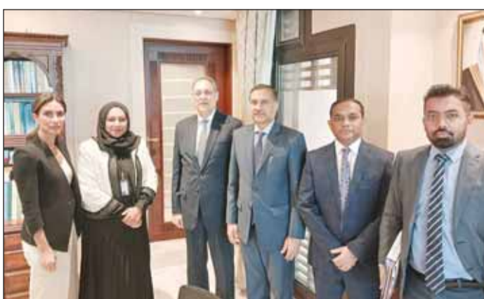
الوفد الهندي مع مساعد وزير الخارجية تهاني الناصر

مشاورة وزارتي الخارجية إلى إضافة المزيد من الرزم على العلاقات الثنائية. كما التقى مهاجان بوكيل وزارة التجارة والصناعة الكويتية زياد الناجم، وناقش سبل تعزيز التعاون التجاري والاستثماري الثنائي بما في ذلك تعزيز التجارة الثنائية وتنويع سلة التجارة، وتعميق التعاون في مجال الطاقة والمبادرات الجديدة في مجال التكنولوجيا والتكنولوجيا المالية.