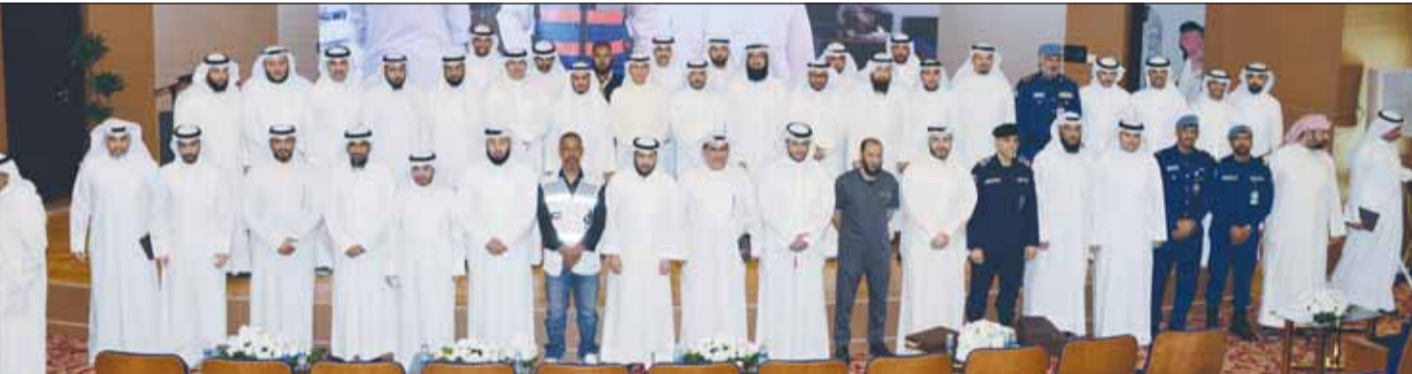
د. محمد الوسمي ويدر المطيري يتوسطان أعضاء بعثة الحج وممثلي الحملات واللجان العاملة معها

عهد الأمين الشيخ صباح الخالد. بدوره، عبر وكيل وزارة الأوقاف والشؤون الإسلامية بدر المطيري عن سعادته ببقاء أعضاء بعثة الحج الكويتية ولجانها لسنة 1445 هجرية الموافقة لسنة 2024 ميلادياً، مؤكداً أن بعثة الحج الكويتية وحملاتها غدت من أفضل البعثات الرسمية التي يشار إليها بالخنان تنظيمها وترتيبها. وإثنى المطيري في كلمة له خلال الحفل على التنسيق الفاعل الذي جرى بين جميع الجهات المعنية والمنظمة، بعناية ورعاية بصورة فاقت التوقعات وكافة ذلك مرصود بشكل تفصيلي دقيق في تقرير البعثة الذي صدر عنها. وأضاف: يأتي لقائنا هذا ليظهر لكم على لساننا ثناء، وفي قلوبنا محبة، وعلى جوارحنا عملاً وسلوكاً، حتى نكون في وزارتنا - برعاية الوزير الدكتور محمد الوسمي - بروح أسرة واحدة تحفها روح الأثوة.