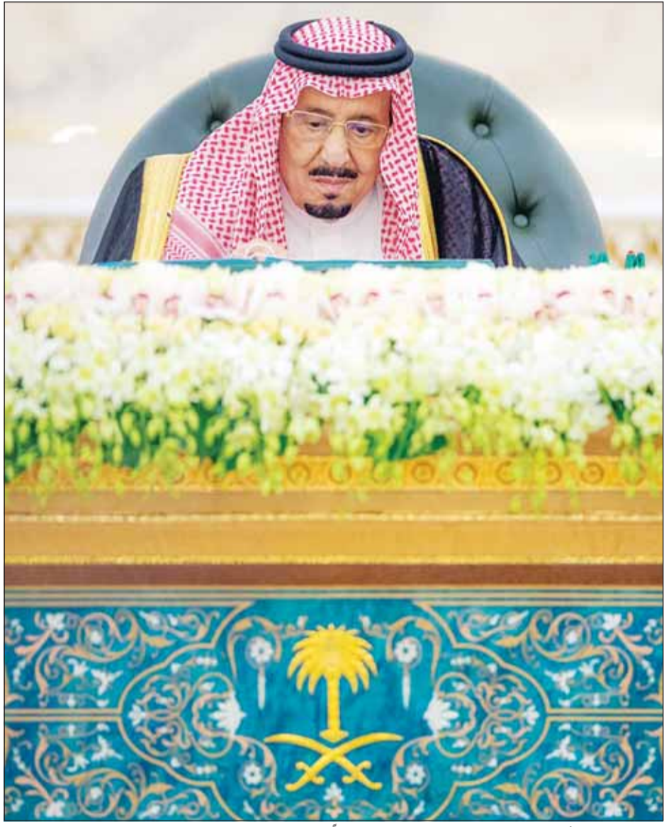
خادم الحرمين الشريفين الملك سلمان بن عبدالعزيز مترشاً لجلسة مجلس الوزراء السعودي، في جدة

من جانبها، داننت وزارة الخارجية الأردنية قرار برلمان الاحتلال الإسرائيلي "الكنيست" تصنيف وكالة "أونروا" منظمة إرهابية، واعتبر المتحدث سفيان القضاة القرار محاولة لاغتيال الوكالة سياسيا واستهداف رمزيته.