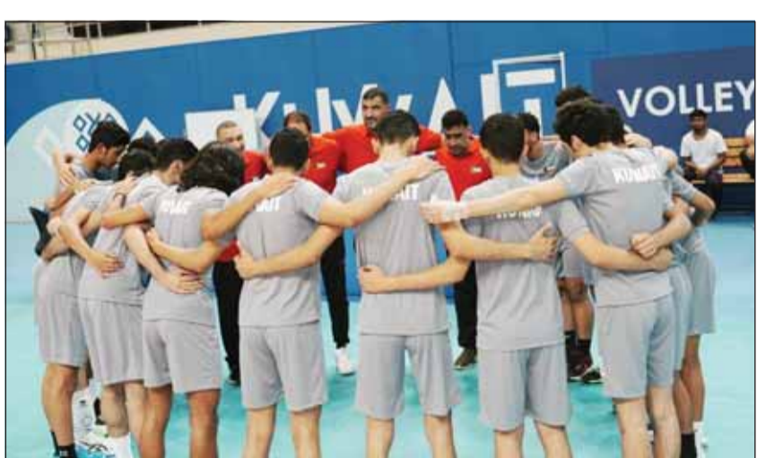
خسارة طائرة الشباب من الصند