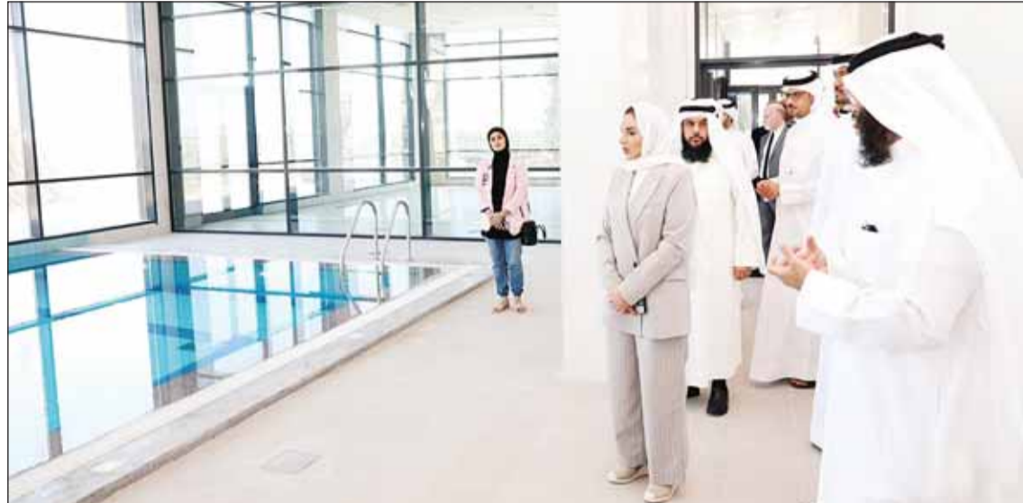
الوزير د. أمثال الحويلة خلال تفقدها مرافق المركز

المنفذة للمشروع. وشددت الحويلة على ضرورة العمل لتذليل كافة المعوقات للإسراع بتشغيل المركز من قبل وزارة الصحة وفق أحدث النظم المتبعة.