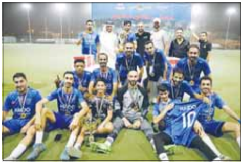
تتويج هيدو باللقب