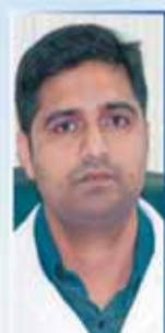
د/ شجاهمان BDS, MDS الأسنان