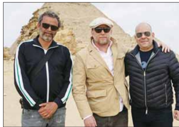
المخرج العالمي جاي ريتشي يتوسط فريق العمل

وهو الفيلم الجديد لـ جاي ريتشي من شركة Apple، ووفقاً للتقرير الذي نشر على موقع "Deadline"، لم يكشف عن دور الونسو إلى الآن.