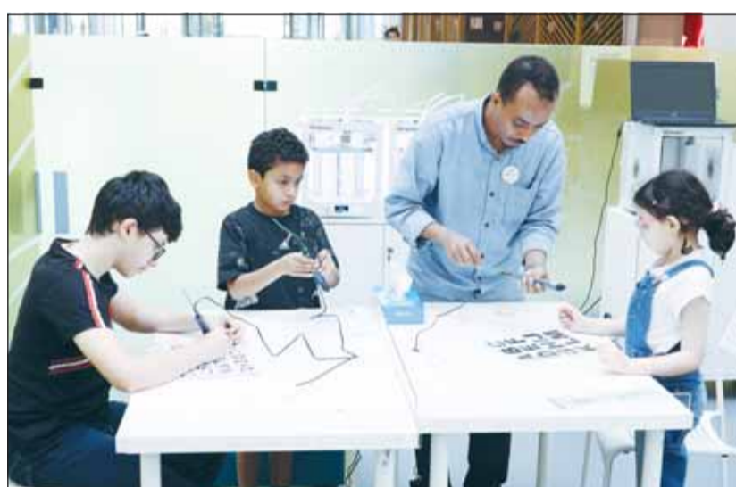
إحدى فعاليات البرنامج التدريبي

التابع لمركز صباح الأحمد، وهم من طلبة وطلبات المرحلة الجامعية الذي يعملون بنظام عمل جزئي في زين والمركز، حيث أتاحت هذه الفرصة لهم تطوير مهاراتهم في العديد من المجالات مثل إدارة المشاريع، والعلاقات العامة، والتعامل مع الجمهور، والعمل الجماعي، وحل المشكلات، والتفكير النقدي، وغيرها.