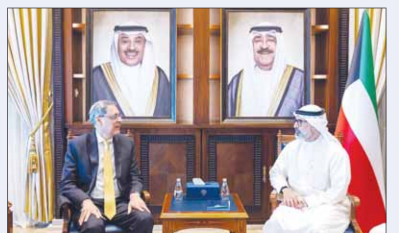
نائب وزير الخارجية مستقبلا الوكيل المساعد للشؤون الخليج بوزارة الشؤون الخارجية الهندي

ترأس نائب وزير الخارجية السفير الشيخ جراح جابر الأحمد أمس اجتماع لجنة الحدود الذي عقد في ديوان عام الوزارة. تم خلال الاجتماع بحث المواضيع كافة المدرجة على جدول الأعمال بالإضافة إلى التطورات ذات الصلة باختصاصات اللجنة. من جهة أخرى، استقبل الجابر الوكيل المساعد لشؤون الخليج بوزارة الشؤون الخارجية في الهند عصام مهاجان بمناسبة زيارته الرسمية للبلاد لغرض وفد بلاده المشارك في اجتماعات الجولة السادسة للمشاورة السياسية بين الكويت والهند.