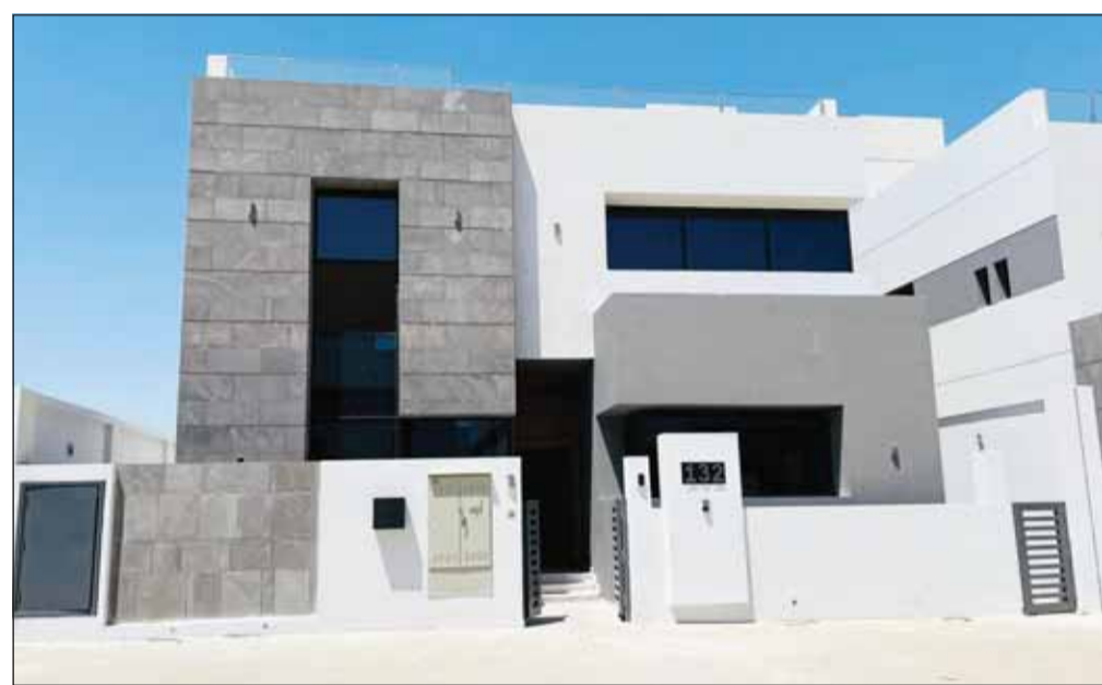
أحد البيوت من تنفيذ الشركة