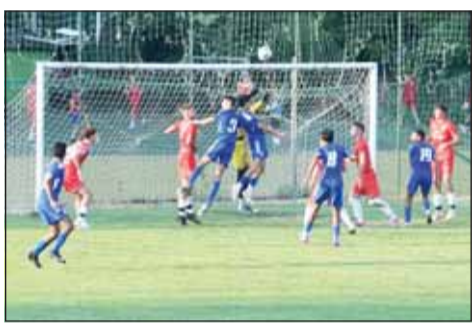
جانب من المباراة

تغلب منتخب الكويت للناشئين تحت 17 عاماً على فريق فودابيسكي كلوب الصربي للناشئين 1-3 في المباراة الودية التي جمعتهم أول من أمس ضمن معسكره الخارجي في صربيا، وذلك استعداداً لتصفيات كأس آسيا.