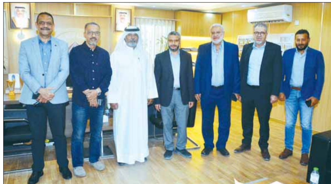
تمثل "الربحية السكنية" ومسؤولوه ومهندسو شركة "فيرست جروب"

أنجزتها "فيرست جروب" وتجمع بين التصميم العصري والاهتمام بالبيئة والاستدامة