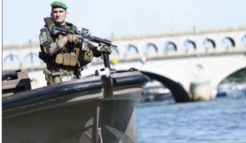
الجيش الفرنسي يشارك في تأمين العاصمة باريس

كما ستكون فرقة تدفّل الدرك النخبوية "سي إي جيه أن" مسؤولة أيضاً عن تأمين تنقلات رؤساء الدول والحكومات. ومن المقرر أن يصبح محيط الحماية من الإرهاب الذي دخل حيز التنفيذ منذ 18 يوليو، أكثر صرامة في 26 الحالي.