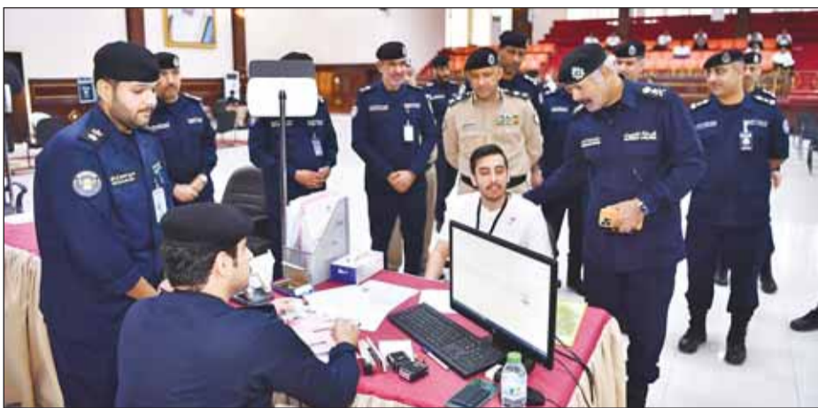
الفريق الشيخ سالم النواف يتابع عملية التسجيل منذ تقديم الطلبة حثه الانتهاء من إجراءات التسجيل والقبول

وبينت أن وكيل الوزارة تفقد بعد ذلك مستشفى الأكاديمية وعددا من المرافق الملحقة بها، مشيدا بالخدمات الصحية والطبية التي يقدمها وما يحتويه من أحدث الأجهزة والمعدات الطبية.