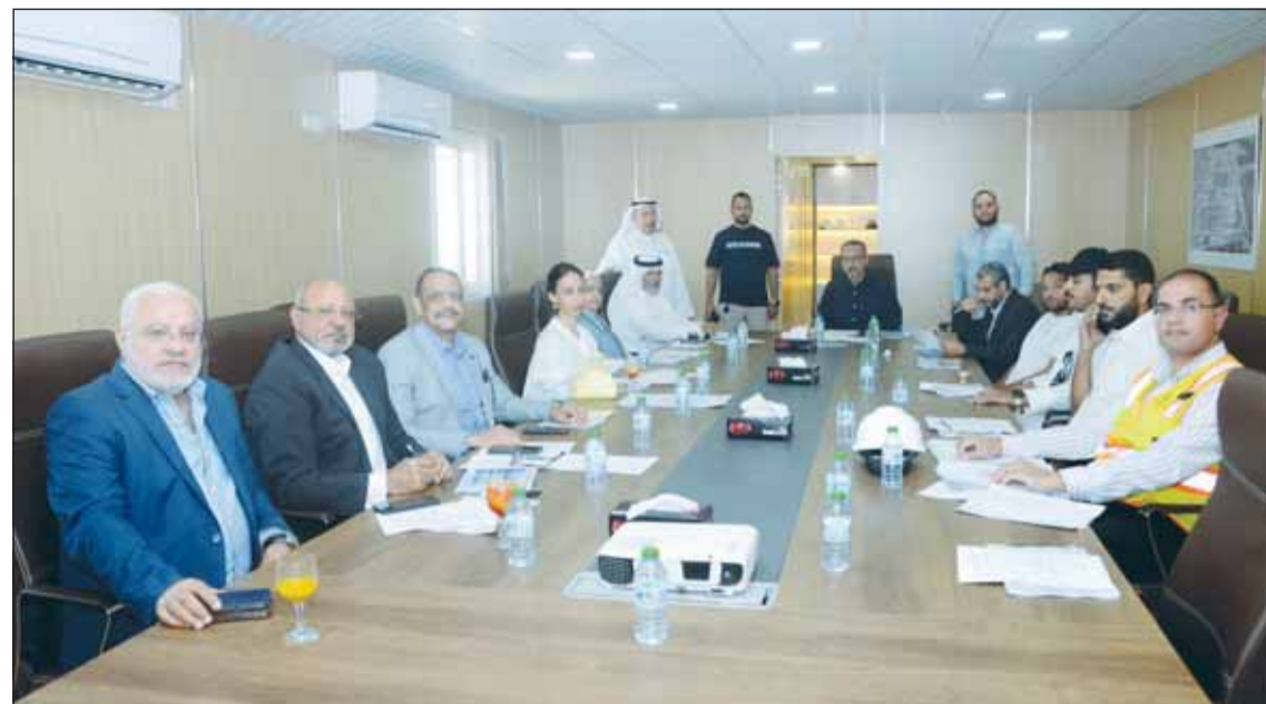
جانب من الاجتماع المشترك للتسليم الابتدائي للمشروع