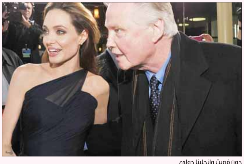
جون فويت وأنجلينا جولي

وبحسب النهار اللبنانية أكد فويت في وقت سابق مراراً وتكراراً أنه لا يريد المشاجرة مع ابنته، إلا أنه اعتبرها محاصرة في قاعة هوليوود، مشيراً إلى أنها