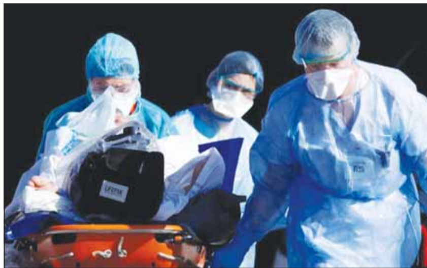
"كورونا" يهدد رياضيين الأولمبياد

الأولمبية). بدوره، يكافح الفريق الأسترالي لكرة الماء للسيدات لاحتواء تفشي انتشار فيروس كورونا، قبل افتتاح أولمبياد باريس، وأعلنت اللجنة الأولمبية الأسترالية عن ثلاث حالات إصابة جديدة أمس، ليرتفع عدد المصابين إلى 5 لاعبات وتم الإعلان أول من أمس عن إصابة لاعبتين، لم يتم ذكر اسميهما، بفيروس كورونا. وأكدت أنا ميريس رئيسة البعثة الأسترالية أن الفريق الأسترالي الأولمبي خضع لاختبار الكشف عن فيروس كورونا، ولكن الحالات الإيجابية تقتصر حالياً على فريق كرة الماء للسيدات. ولم تكشف اللجنة الأولمبية عن هوية الرياضيين المصابين.