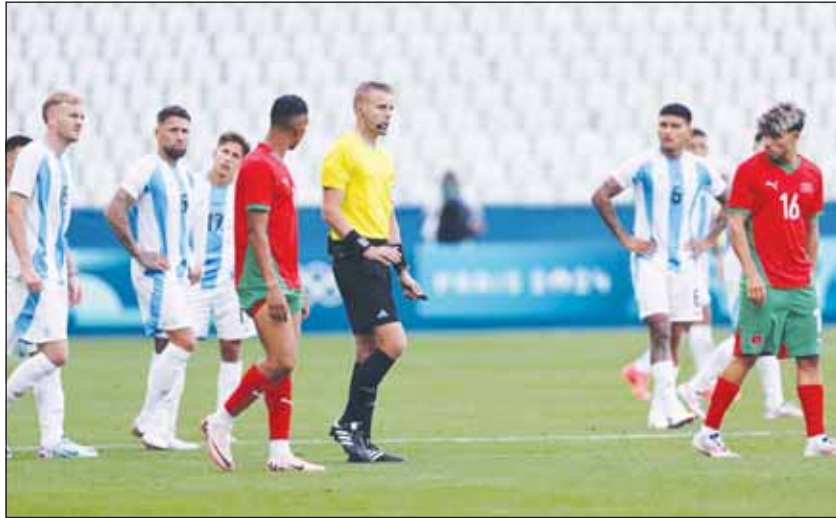
الحكم أفضه هدف الأرجنتين

أعلن الاتحاد الأرجنتيني لكرة القدم تقديمه بشكوى إلى "فيفا" عقب خسارة المنتخب الأولمبي أمام نظيره المغربي في اليوم الافتتاحي لمنافسات كرة القدم في دورة الألعاب الأولمبية. ونشرت صحيفة TYC الأرجنتينية بياناً رسمياً أصدره الاتحاد المحلي، اعترض فيه على نتيجة مباراته أمام المغرب والتي انتهت بفوز "أسود الأطلس" 2-1 بعد مباراة درامية تم استكمالها بعد ساعتين من توقفها، وإلغاء هدف التعادل لمنتخب الأرجنتين، ليخسر "التانغو" في الجولة الأولى من مباريات المجموعة الثانية في أولمبياد باريس 2024.