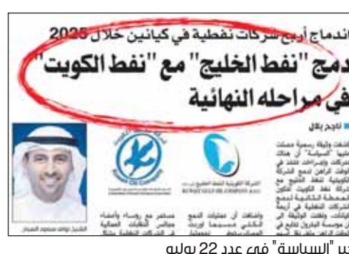
خبر "السياسة" فيه عدد 22 يوليو

تأكيداً لما نشرته "السياسة" يوم 22 الجاري تحت عنوان اندماج شركتي "نפט الخليج" مع "نפט الكويت" في مراحلها النهائية، كشفت مصادر نفطية لـ"السياسة" عن موافقة مؤسسة البترول الكويتية على الدمج الكامل بين شركة البترول الوطنية مع الشركة الكويتية للصناعات البترولية المتكاملة "كبيك"، كما وافقت على نقل اسم الشركة الكويتية لنفط الخليج مع شركة نفط الكويت لتصبح شركة شركة واحدة تحت مظلة أو راية "نפט الكويت"، مع نقل تسمية الغاز المسال لشركة ناقلات النفط الكويتية إلى شركة البترول الوطنية.