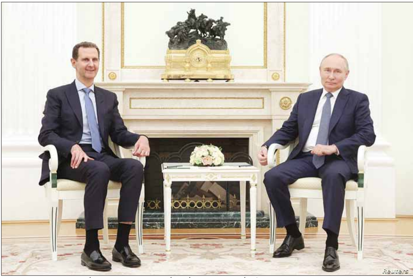
الرئيس الروسي فلاديمير بوتين مستقبلاً رئيس النظام السوري بشار الأسد في الكرملين ليل أول من أمس خلال زيارة مفاجئة قام بها الأسد إلى موسكو

باسل الحاج جاسم أنها تأتي في توقيت لا يمكن عدم ربطه بالعديد من التحولات والتحولات الإقليمية والدولية، قائلًا لموقع قناة "الحرية" الأمريكية هناك نظرة نحو التصعيد وربما تتوسع حرب غزة نحو دول أخرى من بينها لبنان، وخصوصاً بعد زيارة نتانياهو لواشنطن وخطابه في الكونغرس، وسيكون لاتعمالية توسع الحرب ارتدادات من نواحي عديدة اتجاه سورية، وهو ما سيؤثر بشكل مباشر على الأوضاع هناك. وهذا يتعلق بروسيا وسورية وتركيا أيضاً، معتبراً أن أنقرة اليوم ليس في مصلحتها تعرض دمشق لأي خطر إضافي، وأن دعمها لإعادة السيطرة على كامل الجغرافيا السورية بات من بين الأولويات التركية، وهو ما يتماشى مع تصريحات الأسد بخصوص المصالحة مع أنقرة حول العودة لواقع ما قبل عام 2011، مشيراً للتحول الكبير في الخطاب السياسي الديبلوماسي بين دمشق وأنقرة وأهميته الكبرى في مفاوضات بوتين والأسد.