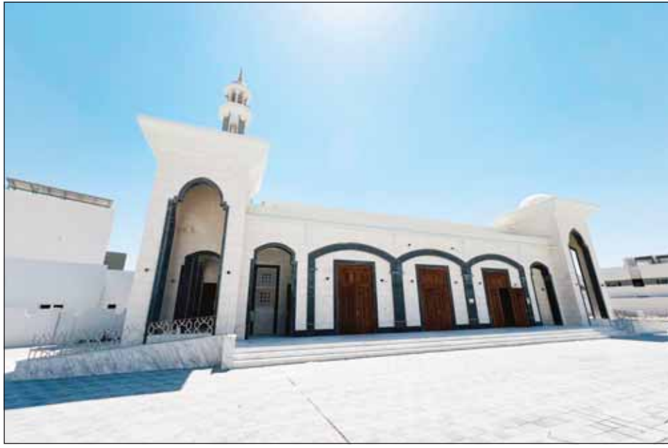
مسجد من تنفيذ الشركة