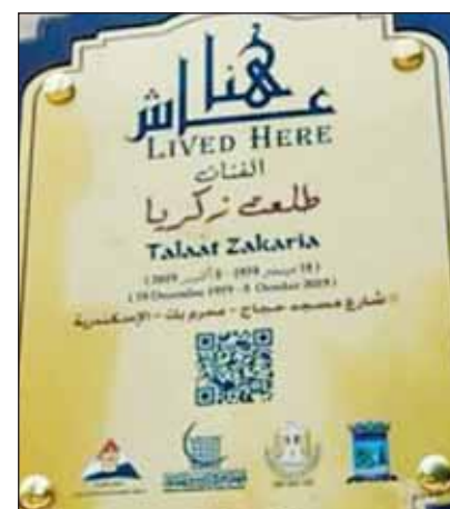
لافتة "عاش هنا"