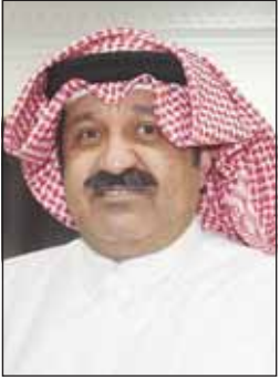
الشيخ أحمد اليوسف

دعا الشيخ أحمد اليوسف الصباح رئيس مجلس إدارة الاتحاد الكويتي لكرة القدم السابق، الأوساط الرياضية إلى ترك مسألة مصير اتحاد كرة القدم وعدم الخوض حالياً في الأسماء المرشحة للرقابة والتكليف على دعم المنتخب الذي سيخوض مباراتين