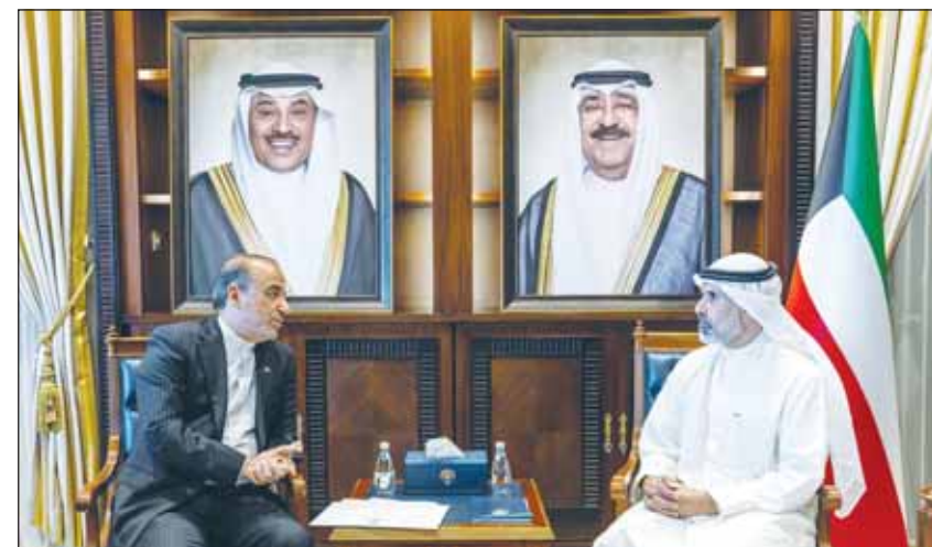
الشيخ جراح الجابر مستقبلاً السفير الإيراني محمد توتونجيه

استقبل نائب وزير الخارجية السفير الشيخ جراح الجابر أمس، سفير الجمهورية الإسلامية الإيرانية لدى دولة الكويت محمد توتونجيه حيث تم بحث العلاقات الثنائية بين البلدين الصديقين والقضايا محل الاهتمام المشترك.