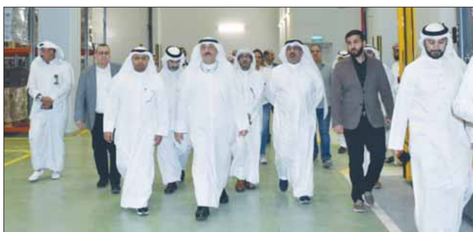
وزير الصحة د.أحمد العوضي وقيادات الصحة في جولة بالمستودع عقب افتتاحه

المخبرية، سواء المبردة أو غير المبردة، مبيّنا أن جميع المواد مرتبطة بنظام رقمي متخصص لمتابعة حركة المواد وتواريخ الصلاحية، مما يضمن أعلى درجات الكفاءة في إدارة المخزون. وبين أن المستودعات تضم مناطق لتخزين الأدوية وأخرى لتخزين المستهلكات الطبية، مجهزة وفق أفضل المعايير العالمية لضمان جودة وسلامة المواد المخزنة، مؤكداً أن هذه الافتتاحات تأتي ضمن جهود وزارة الصحة في تعزيز البنية التحتية الصحية وتوفير بيئة تخزين آمنة وفعالة للأدوية والمستهلكات الطبية، بما يحميها بشكل متوازن على المناطق كافة.