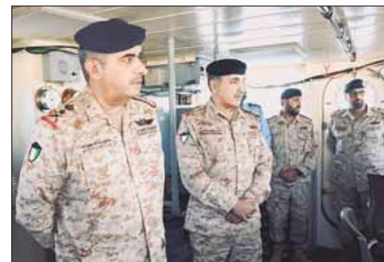
الفريق الركن بندر المرزبان خلال زيارته التقديرية للقوة البحرية

أكد رئيس الأركان العامة للجيش الفريق الركن طيار بندر المرزبان أمس ضرورة تحقيق أقصى درجات اليقظة والجاهزية والاستعداد لحفظ أمن وسلامة الوطن من أي تهديدات خارجية والاستمرار في هذا النهج وتعزيز القدرات عبر التدريب المستمر والتطوير الذاتي. جاء ذلك في بيان صادر عن رئاسة الأركان عقب زيارة تفقدية ميدانية قام بها الفريق المرزبان إلى القوة البحرية بمختلف وحداتها حيث أشاد بدورها في الدفاع عن الحدود البحرية والسمية الإقليمية للبلاد. وأضاف الفريق المرزبان أن القيادة الرشيدة تولي اهتماماً كبيراً لتوفير جميع الإمكانيات