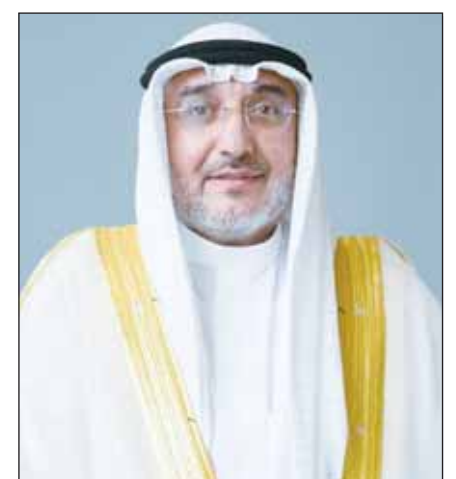
د. عادل العدواني

تأكيداً لما انفردت "السياسة" بنشره، أعلن وزير التربية وزير التعليم العالي والبحث العلمي د.عادل العدواني اعتماده توصيات لجنة التحقيق في وزارة التعليم العالي وإزالة عدد من الشهادات العلمية (ما بعد الثانوية العامة) للنيابة العامة كدفعة ثانية ، لتقديمهم مستندات مخالفة للحقيقة، وتغيير البيانات الواردة في الشهادة العلمية للحصول على معادلة الشهادة. وأوضح العدواني - في تصريح صحافي أمس - أن الخطوة تأتي تنفيذاً لتوجيهات سمو أمير البلاد الشيخ مشعل الأحمد بمحاربة الفساد