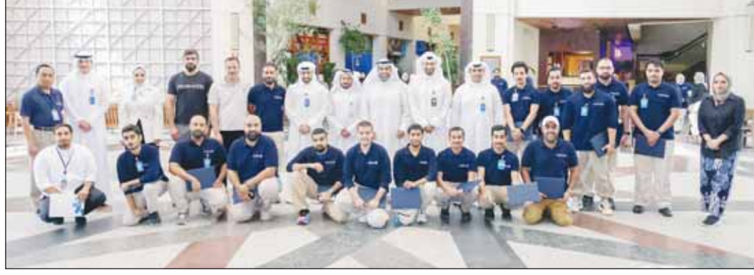
المشاركون في صورة تذكارية

تضمن البرنامج ورش عمل حول إدارة الفصول الدراسية، وتعلم STEAM (العلوم، التكنولوجيا، الهندسة، الفنون، والرياضيات)، والتعلم القائم على الاستفسار، مع التركيز على مفهوم الاستدامة وأهميتها في تنشئة جيل مثقف بيئياً لمستقبل أكثر استدامة.