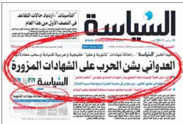
خبر "السياسة" في 4 يوليو أكدته إجراءات وزير التربية