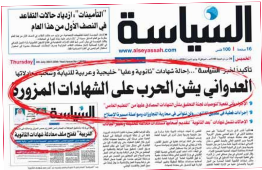
خبر "السياسة" فيه عدد 4 يوليو

البيانات الواردة في الشهادة العلمية للحصول على معادلتها. (راجع ص2) وقال العدواني في تصريح أمس إن الخطوة تأتي تنفيذاً لتوجيهات سمو أمير البلاد الشيخ مشعل الأحمد بجماركة الفساد والعمل على رفعة الوطن وتقدمه، وضمن الجهود المثمرة والشاملة لوزارة التعليم العالي في مكافحة الفساد والقضاء على المزورين، كاشفاً عن أن هناك مجموعة جديدة ستحال إلى النيابة التتمة - 11