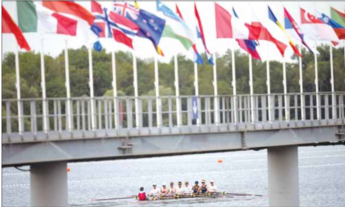
نهر السين يحتضن فعاليات الافتتاح

الميلاد واستمرت حتى القرن الرابع الميلادي وكانت عبارة عن مزيج من مهرجانات دينية ورياضية تقام كل أربع سنوات في "حرم زيوس" في أولمبيا.