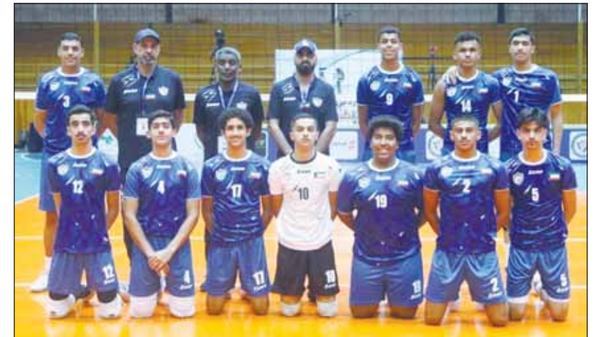
أزرق طائرة الناشئين