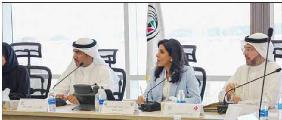
الوزير د.نورة المشعان ورئيس الطيران المدني الشيخ حمود المبارك خلال الاجتماع

التنسيق مع الجهات المعنية لترحيل الحواجز سرعة اعتماد مقاول الباطن لأنظمة وقود الطائرات وبيان التعارضات مع المشروع الأمنية لتسليم الأرض وطلب التشوين