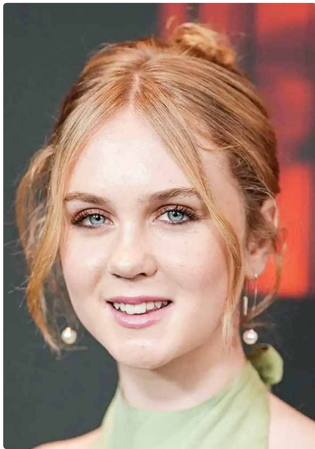
الممثلة الأميركية آرييل دونغو خلال حضورها العرض الأول لفيلم "Trap" في نيويورك

كذلك قد يتأثر اقتصاد بلد بالعالم، فإذا انخفضت أسعار النفط أو الكاكو، تأثر وضع الحكومة والشعب في البلد المنتج للنفط أو المحصول الزراعي، تكفي لضيق الجراح. ويقول لك، ما أحب السياسة، يعني متابعة الأكلات عنده على برامج التواصل الاجتماعي أهم من أوضاعه المعيشية واستقرار أمن بلاده؟