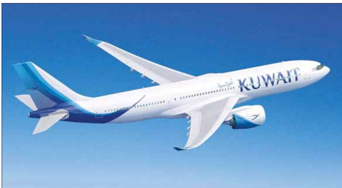
الخطوط الجوية الكويتية

تجري الآن تحقيقات لمعرفة اسباب هذا الخلل الفني وذلك وفقاً لإجراءات السلامة المعتمدة في الشركة.