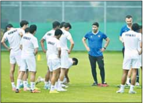
الجهاز الفني يوجه لاعبي أزرق الشباب

يلتقي منتخب الكويت للشباب مع منتخب الجبل الأسود "مونتينغرو" للشباب في مباراة ودية مساء اليوم بمعسكره في صربيا ضمن استعدادات الأزرق لتصفيات كأس آسيا. ويأتي المعسكر استعداداً لخوض منافسات المجموعة الثالثة التي يستضيف منافساتها الأزرق خلال الفترة من 21 حتى 29 سبتمبر المقبل، ضمن التصفيات المؤهلة لكأس آسيا 2025 في الصين، وتضم المجموعة منافسات لبنان والإمارات وكوريا الجنوبية وجزر شمال مارينا. وعمد الجهاز الفني للمنتخب بقيادة المدرب الكرواتي داريو باستيتش ومساعدته محمد الفيكاوي، في التدريبات الأخيرة إلى منح اللاعبين تعليمات لتلافي بعض الأخطاء الفردية التي ظهرت على أداء بعض اللاعبين في المباراة الودية الأخيرة أمام فريق سيفوجونو الصربي منتصف الأسبوع الجاري، رغم الفوز في اللقاء 3-2.