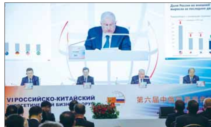
إيجور سيبستيان الرئيس التنفيذي لشركة "روسنفت" يتحدث في المنتدى

العملة الصينية توفقت على اليورو بالتسويات التجارية عبر "سويفت" في سبتمبر