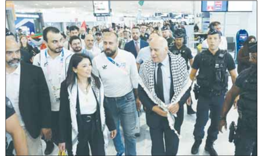
الرجوب يتقدم الوفد الفلسطيني

ووصلت البعثة الفلسطينية صباح أمس إلى العاصمة الفرنسية للمشاركة في أولمبياد باريس الصيفي، بعد أيام من مطالبتها بإقصاء إسرائيل من الألعاب بسبب "فترقا الهدنة والحرب الدائرة في غزة". وحطت طائرة تقل معظم أفراد الوفد الفلسطيني القادم من رام الله، عبر العاصمة الأردنية عمّان، في مطار شارل ديغول في رانس، تقدمه رئيس اللجنة الأولمبية جيريل الرجوب الذي سيمثل الرئيس محمود عباس في حفل الافتتاح الرسمي الجمعة على نهر السين.