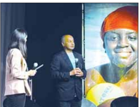
المسلم خلال المنتدى

أكد رئيس الاتحاد الدولي للألعاب المائية حسين المسلم، أن الاستثمار الحقيقي والذي يطور البلدان والمدن، هو عن طريق الرياضة، جاء ذلك خلال المنتدى الرياضي الدولي بعنوان "متحدون من خلال الرياضة" والذي أقيم أمس الخميس على هامش أولمبياد باريس 2024 ويحضره وزير الرياضة الفرنسية إميليه أوديا كاستيرا. وقال المسلم، أن من القارة الآسيوية انظروا إلى مدن آسيا سول وكين والدوحة كيف كانت وكيف أصبحت بعد تنظيمها الألعاب الآسيوية الأولمبية وكأس العالم. واكمل، سعيد بتواجدتي في باريس على هامش الأولمبياد وفي اليوم العالمي للموازية من الفرق. وبين رئيس الاتحاد الدولي للألعاب المائية، أنه وزملاءه في الاتحاد منذ 2021 غيروا الاستراتيجية وروية العمل وتم وضع استراتيجية واضحة لممارسة السباحة والتي تشمل الرياضة الصحة وإيقاد الأرواح، وبالأخص الأخيرة التي تساهم في إيقاد والحفاظ على أرواح البشرية، كما أنها توفر على الدول الكثير من المال.