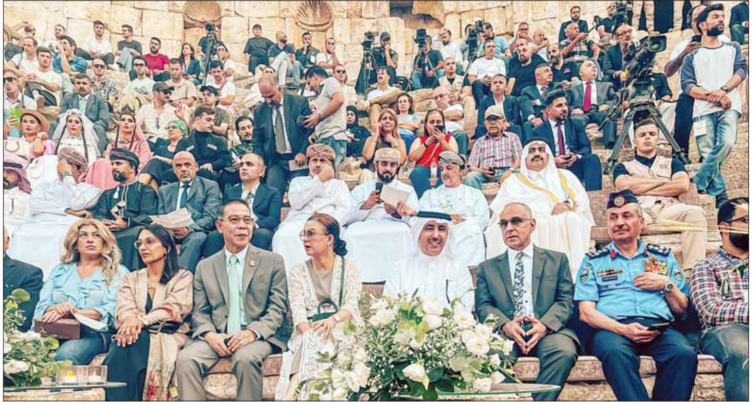
حضور كويتي في المهرجان