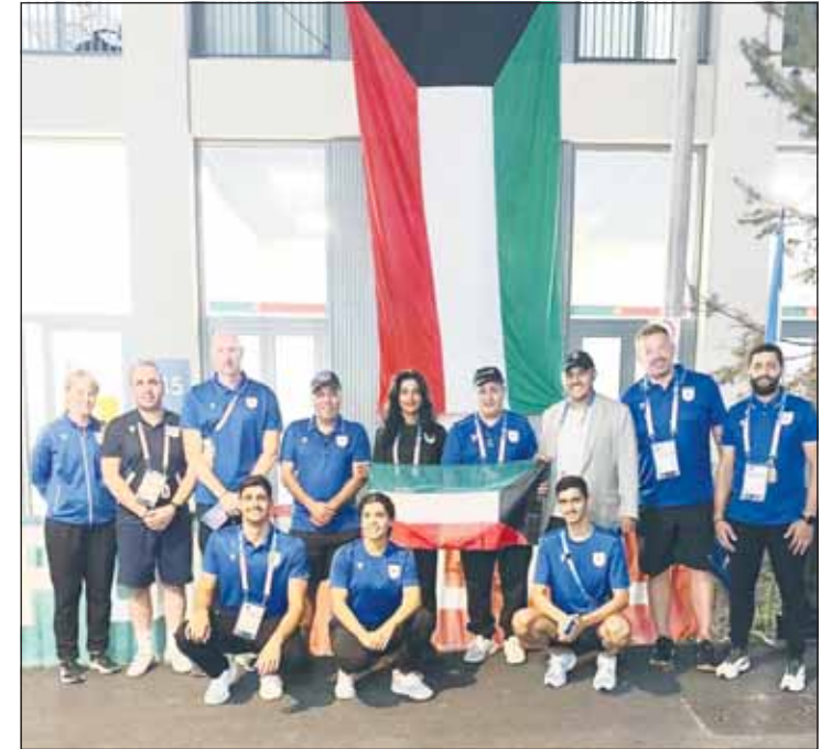
الفصيل مع لاعبي الكويت بالقرية الأولمبية