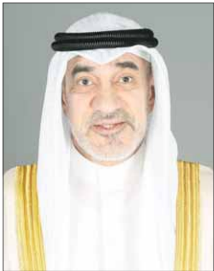
الشيخ فهد اليوسف

الربط الكامل بين الجهات المعنية في إطار عمل استراتيجي وفق المعايير والأنظمة الحديثة