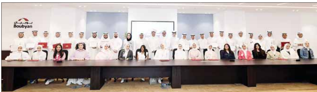
فريق البنك مع المتدربين

والتكنولوجية والتطبيقات العملية المتعددة التي تهدف إلى تضييق الفجوة بين المعرفة النظرية والتطبيق العملي.