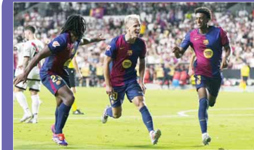
داني أولمو فحاً بهدف الحسم للبرشا

كوندي قبل تسجيل الهدف. وتلقى أولمو اللوف الجديد مقابل 60 مليون يورو كرة من لامين يامال داخل منطقة الجزاء سددها بيسرارة داخل المرمى قبل 8 دقائق من نهاية الوقت الأصلي. وبات برشلونة في صدارة الترتيب بعدما حقق الفوز في الجولات الثلاث الماضية، بينما يملك رايو 4 نقاط في المركز الثامن. وأبدى خبير تحكيمي رأيه في الهدف الملغى لروبرت ليفاندوسكي، خلال الانتصار (1-2) على رايو فايكانو في معقل الأخير ملعب "تيريزا ريفيرو". ففي الدقيقة 71، صوب لامين يامال كرة تصدى برشلونة".