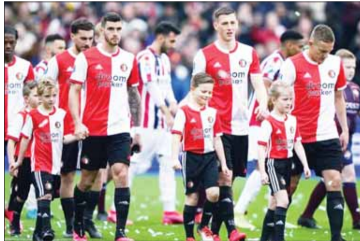
لا قمة هولندية هذا الاسبوع

استخدمتها الشرطة كمنعدي لترح قضيتها بشأن أوضاع العمل. وقال الاتحاد الهولندي في بيان، "يتم استخدام كرة القدم الآن كوسيلة وهذا يقول الكثير عن تأثيرها. ولكن بالطبع هذا ليس الغرض من اللعبة".