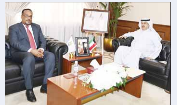
محافظ حولي علي الأصغر مستقبلاً سفير إثيوبيا سيد جبريل

استقبل محافظ حولي علي الأصغر سفير جمهورية إثيوبيا الفيدرالية الديمقراطية لدى الكويت سيد جبريل. وتناول اللقاء بحث العلاقات الثنائية بين البلدين وسبل تعزيز التعاون في مختلف المجالات، وتبادل وجهات النظر حول القضايا ذات الاهتمام المشترك.