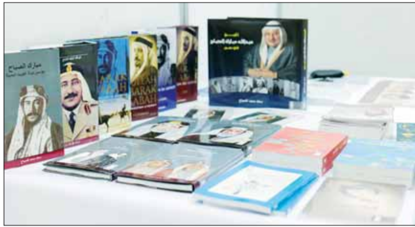
من الكتب المشاركة

استقاه، من التعدد اللساني والتعدد الثقافي المغربي، والذي يعرف غنى وإخصاباً مضاعفاً في مستويات القول الشعري "فصيحا، زجلا، أمازيغية، حسانية"، بل وضمن أنماط الكتابة الإبداعية الشعرية "الممودي، التعفيلي، قصيدة النثر، الهايكو...". ناهيك عن التراكم الذي تعرفه النصوص المرعبة لتقافتنا الشعبية "الملحون، العبيطة، الروايس. فسمت التعدد في الشعرية المغربية المعاصرة، "أشبه بلوحة فسيقائية متعددة الأحجام والألوان والأشكال والأبعاد، وهذا ما يضمن لها خصوصيتها، وراحتها، ووعدها المستقبلي...". وبالحديث عن هذه "المدونة الشعرية المغربية الحديثة والمعاصرة"، والتي يقارنها الكتاب في أشكال فنون الكتابة الشعرية، بدءاً من القصيدة العمودية، ومروراً بقصيدة التعفيلة، ثم قصيدة النثر وقصيدة الهايكو وقصيدة الومضة والشذرة، وشعر الملحون والزجل، وغيره من أشكال الشعر الأمازيغي والحساني، وفنون القول الشعبي الذي يختلف من منطقة إلى أخرى... يظهر جليا "إننا إزاء مدونة شعرية، أو فسيقساء من الأشكال والأنواع تتعايش فيما بينها في زمن ثقافي متجدد باستمرار.