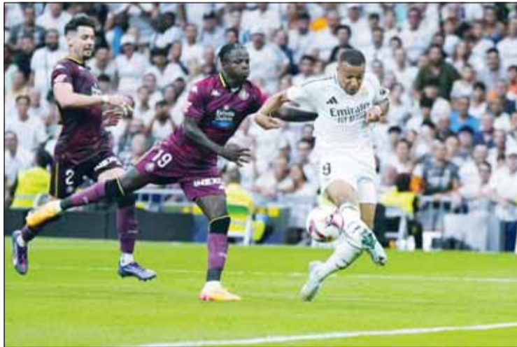
مبابي لم يسجل منذ اسبوعين

أو بدون مهاجمين مثل العام الماضي، لأن الجميع عملوا بشكل جيد للغاية". وتحدث أنشيلوتي عن كيفية إدارته لانضمام مبابي ورحيل الألماني توتي كروس، وقارن الوضع بالموسم الماضي الذي وصل فيه الإنكليزي جود بيلينجهام.