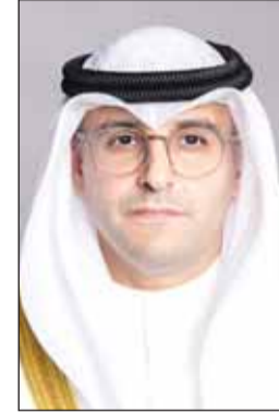
عبد اللطيف المشاري

أكد وزير الدولة لشؤون البلدية ووزير الدولة لشؤون الإسكان عبداللطيف المشاري ضرورة اتخاذ ما يلزم من خطوات وقرارات لتطوير آليات العمل وتسريع الإجراءات وتنفيذ المشاريع التنموية التابعة للبلدية خلال الفترة المقبلة. وشدد المشاري خلال اجتماعه الأول أمس بقيادي البلدية على أهمية رفع مستوى النظافة في البلاد من خلال وضع آلية مناسبة لتواكب التطور والتوسع العمراني من خلال التنسيق مع القطاعات المعنية في البلدية والجهات المعنية بالدولة عبر تكثيف الجهود واستخدام أحدث التقنيات، مشيراً إلى ضرورة التعاون بين قطاعات البلدية والمجلس البلدي للانتعاش من اللوائح التنفيذية للملغات والمدافق.