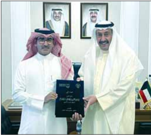
المستشار الشيخ فيصل الحمود ود. مناحيه العجمي

استقبل المستشار في الديوان الأميري الشيخ فيصل الحمود الدكتور مناحي محمد العجمي الذي أهداه رسالة الدكتوراه في الفلسفة بعنوان "تقييم التأسيسات البيئية الاستراتيجية في المدن الجديدة" متمنياً له التوفيق والسداد ومستقبلاً زاهراً في المجال البحثي والعلمي، مثنياً الجهد المبذول للخروج بها على هذا النحو.