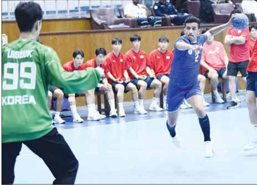
جانب من مواجهة الأزرق وكوريا الودية