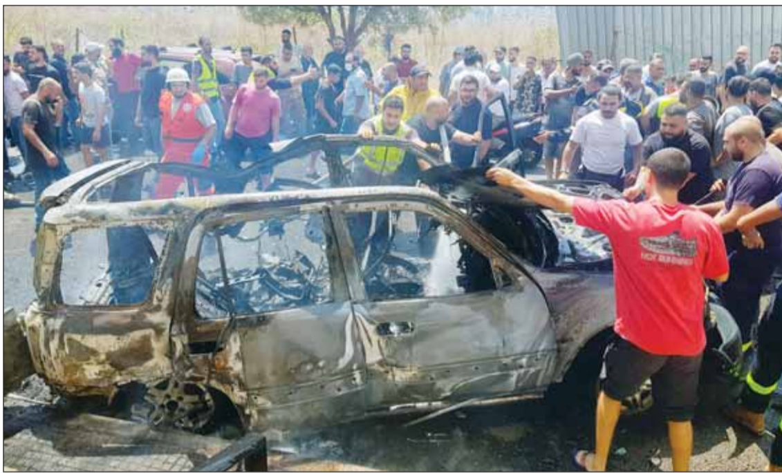
عمال الدفاع المدني والمواطنون يتفقدون بقايا سيارة محترقة ضربتها غارة إسرائيلية في مدينة صيدا الساحلية الجنوبية

لقد شعر "حزب الله" أنه كان عليه الرد على اغتيال إسرائيل لأحد