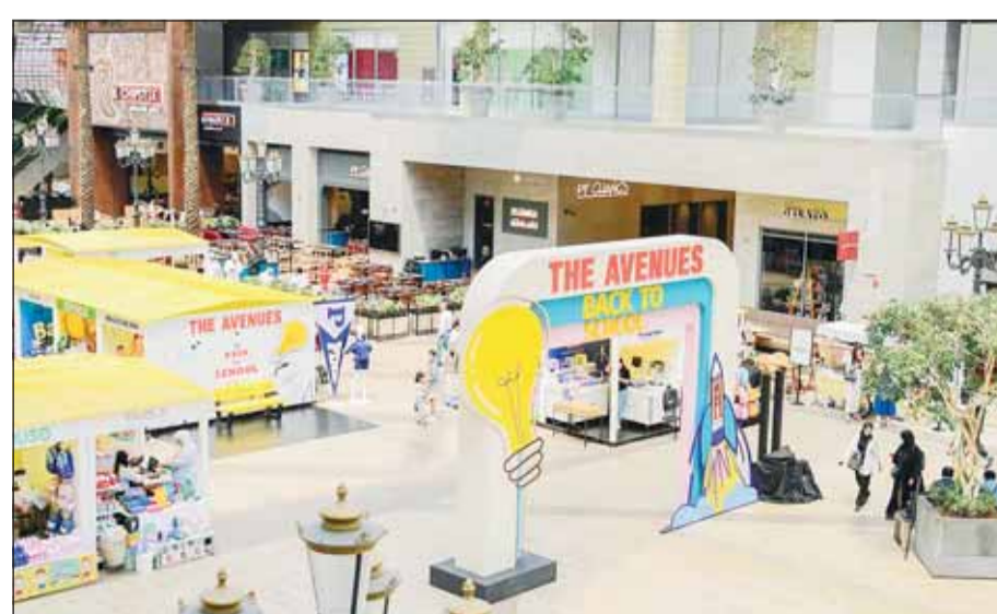
معرض العودة للمدارس في الأفنيوز

وأكدت إدارة الأفنيوز على أن معرض الأفنيوز للعودة إلى المدارس يهدف أيضاً إلى دعم المحلات الموجودة بداخل الأفنيوز، من خلال امتضان المعرض لعدة محلات لعرض منتجاتهم التي تتعلق بالمدارس.