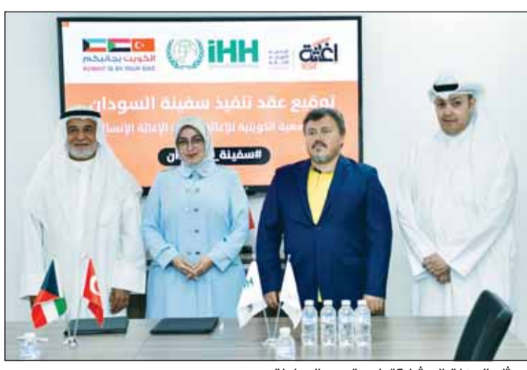
ممثلو الجهات المشاركة في تسيير السفينة

وبيّن أن الجمعية ستتحمل كلفة تجهيز 75 حاوية منها فيما ستتحمل هيئة الإغاثة الإنسانية التركية (IHH) تكلفة تجهيز 75 حاوية المتبقية من إجمالي حاويات حمولة السفينة الإغاثية الثامنة. على خط مواز، أقرت الطائرة الإغاثية الثامنة من الجسر الجوي الكويتي متجهة