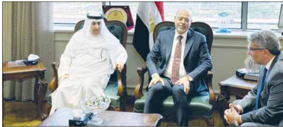
السفير عزيز الديحاني ووزير العمل المصري محمد جبران

في كلا البلدين. وأكد أن ذلك يأتي من أجل العمل على توفير الرعاية الكاملة والدائمة لمواطني البلدين وحرصاً على عقد اجتماعات اللجان القنصلية المشتركة بصفة دورية وبالتعاون بين مصر والكويت، لافتاً إلى أن لجنة أعمال اللجنة القنصلية تناولت عدداً من القضايا القنصلية إضافة إلى علاقات التعاون القضائي والصحي.