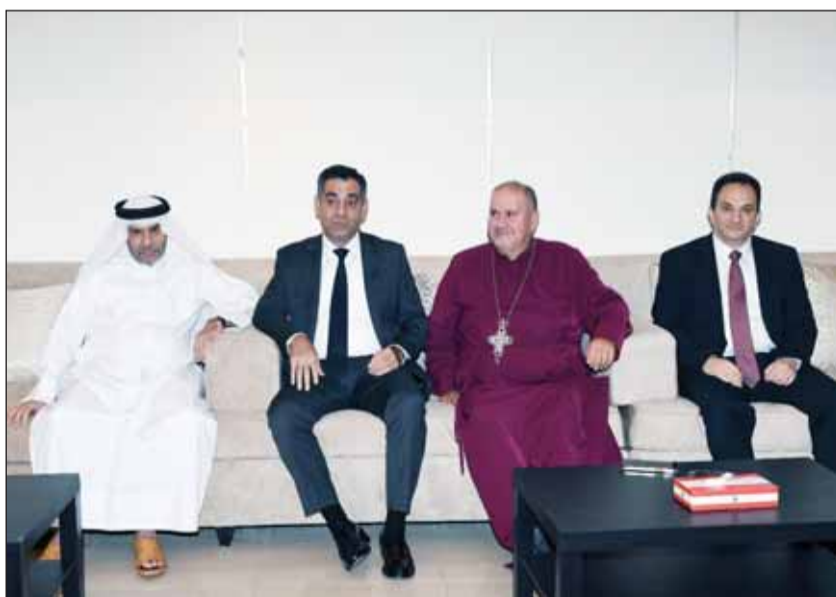
القائم بأعمال السفارة اللبنانية أحمد عرفة يتلقى التعازي من السفير القطري علي آل محمود

استقبلت السفارة اللبنانية أمس المعززين بوفاء رئيس الوزراء اللبناني الأسبق د. سليم الحص، كما فحمت سجلا للتعازي بالراحل الكبير. ضمت جموع المعززين عددا كبيرا من السفراء والديبلوماسيين المعتمدين لدى البلاد، إضافة إلى عدد من المواطنين، ومشد كبير من أبناء الجالية