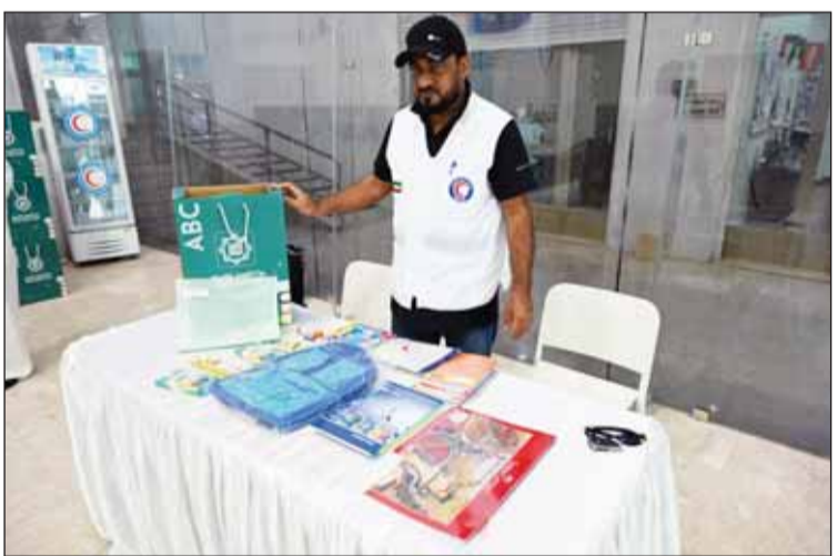
أحد متطوعي الهلال الأحمر خلال توزيع الحقيب المدرسية

ونكر أن نجاح العملية التعليمية بلا شك يعتمد على توفير الاحتياجات الأساسية المطلوبة للطلاب وذلك من خلال توفير الاحتياجات التعليمية والتي من أهمها الحقيبة المدرسية. وأكدت حرص الجمعية على هذه المبادرة بمطلع كل عام دراسي إيماناً منها بأن التعليم يمثل أحد أهم الحقوق الواجب توفيرها لاطفال الأسر المحتاجة لتوفير مناخ تعليمي ملائم للطلاب والطلاب لاستكمال مسيرتهم التعليمية. وأشار الحساوي إلى أن توزيع الحقيب المدرسية على أبناء الأسر المحتاجة يأتي ضمن المبادرات الإنسانية المستمرة للجمعية إلى جانب تنفيذ مشاريع عدة في الجانب التعليمي كدفع أقساط الرسوم الدراسية عن أبناء الأسر المحتاجة المسجلين بكشوفاتها.