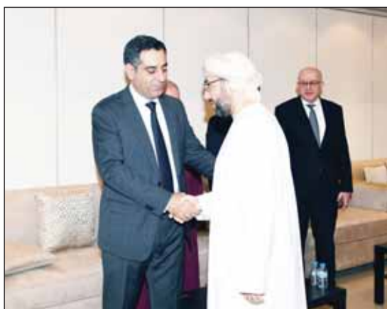
السفير العماني صالح الخروصي معزياً