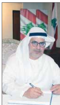
السفير الإماراتي د.مطر النديب

وغيرها من المناصب كان معروفا بولائه للبنان أولا، ولم يكن له الكثير من الأعداء في السياسة لأنه كان دائما يستند في مواقفه إلى الحق والالتزام، هذا على الصعيد الوطني، أما على الصعيد الإقليمي والعالمي، فالرئيس الحص كان شخصية لبنانية معروفة ومحبوبة ومقدرة ولها مواقف، ونحن كلبنانيين نفتخر بها".