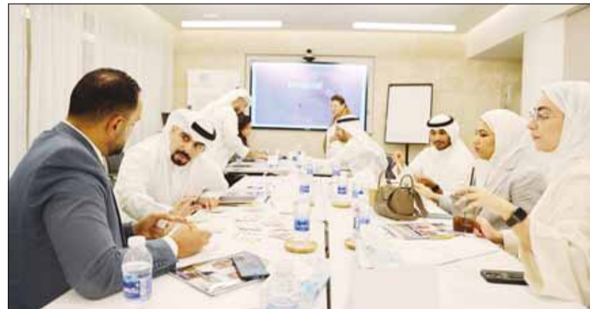
جانب من ورشة العمل

الفعالة التي تشكل جزءاً لا يتجزأ من نجاح وتطوير أي مؤسسة، حيث توفر هذه الاستراتيجيات معلومات شاملة لكيفية تحديد وجدب وإدارة وتطوير المواهب داخل المؤسسة لتلبية احتياجات الأعمال الحالية والمستقبلية، لضمان استدامة المواهب داخل المؤسسة. كما تم تناول مفهوم "العالة الطبيعية الجديدة" بين الشركات عالمياً، والذي يعرف باسم "الحرب من أجل المواهب"، حيث تم تسليط الضوء على أهمية خلق بيئة جاذبة للأفراد المميزين الذين يسهمون