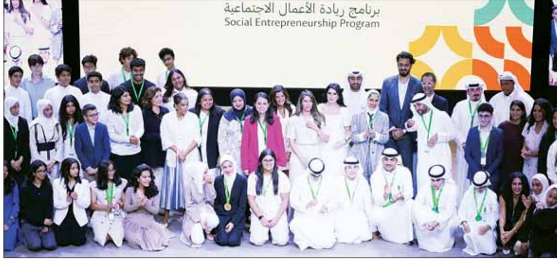
(تصوير- محمد مرسي)