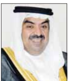
الشيخ خالد البدر

أكد رئيس اتحاد الألعاب المائية الشيخ خالد البدر، ان مجلس إدارة الاتحاد، سيجتمع خلال الفترة المقبلة على مواصلة الجهود من خلال التنسيق والتعاون مع الجهات المختصة من أجل توفير منشأة رياضية خاصة بالاتحاد حتى يتسنى لنا