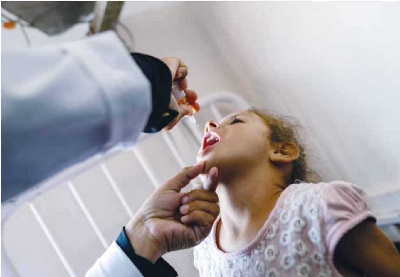
ممرضة تقوم بإعطاء لقاح شلل الأطفال لطفلة فلسطينية بمستشفى ناصر في خان يونس جنوب قطاع غزة أمس (وكالات)

على صعيد آخر، أنهت وزارة الصحة الفلسطينية الاستعدادات لإطلاق حملة التطعيم ضد شلل الأطفال في غزة اليوم، قائلّة إنها بالتعاون مع منظمة الصحة العالمية ومنظمة الأمم المتحدة للطفولة "يونيسيف" ووكالة غوث وتشغيل اللاجئين الفلسطينيين "الأونروا" أنهت استعداداتها لإطلاق حملة التطعيم في محافظات فلسطين الجنوبية، مؤكدة أن التطعيم آمن تماماً، وأن البرنامج يستهدف نحو 600 ألف طفل في محافظات فلسطين الجنوبية.