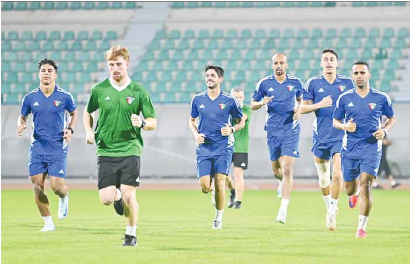
الأزرق يواصل تدريباته في مدينة دبي