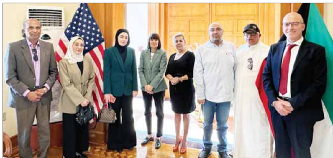
السفير الأميركية مع الزملاء الإعلاميين في ختام اللقاء

□ نقدر بشدة روى الكويت ما يضمن بقاء تعاوننا قوياً ومستجيباً للاحتياجات المتطورة