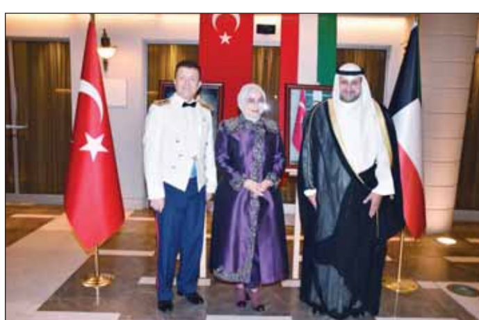
الشيخ د.عبدالله المشعل والسفيرة طوبى سونمز

المسلحة التركية خلال القرن الماضي وفي العقود الماضية، شمل تحقيق خطوات كبيرة من خلال الإصلاحات والابتكار التكنولوجي والتعاون الدولي. وأضافت، أن العلاقات مع الكويت قوية وعميقة وتاريخية بين البلدين، حيث تتقاسم الدولتان رؤية مماثلة للسلام والأمن الإقليميين، كما أن الزيارة الأخيرة لسمو أمير البلاد الشيخ مشعل الأحمد إلى تركيا وتوقيع اتفاقية شراء دفاعية بين الحكومتين تعكس التعاون بين البلدين. وتحدثت سونمز عن الأزمة المستمرة في غزة، وددت من المجتمع الدولي إلى اتخاذ إجراءات حاسمة لإنهاء العنف، لافتة إلى أن تركيا والكويت ملتزمان بدعم القضية الفلسطينية وتدعو إلى السلام العادل والدائم.