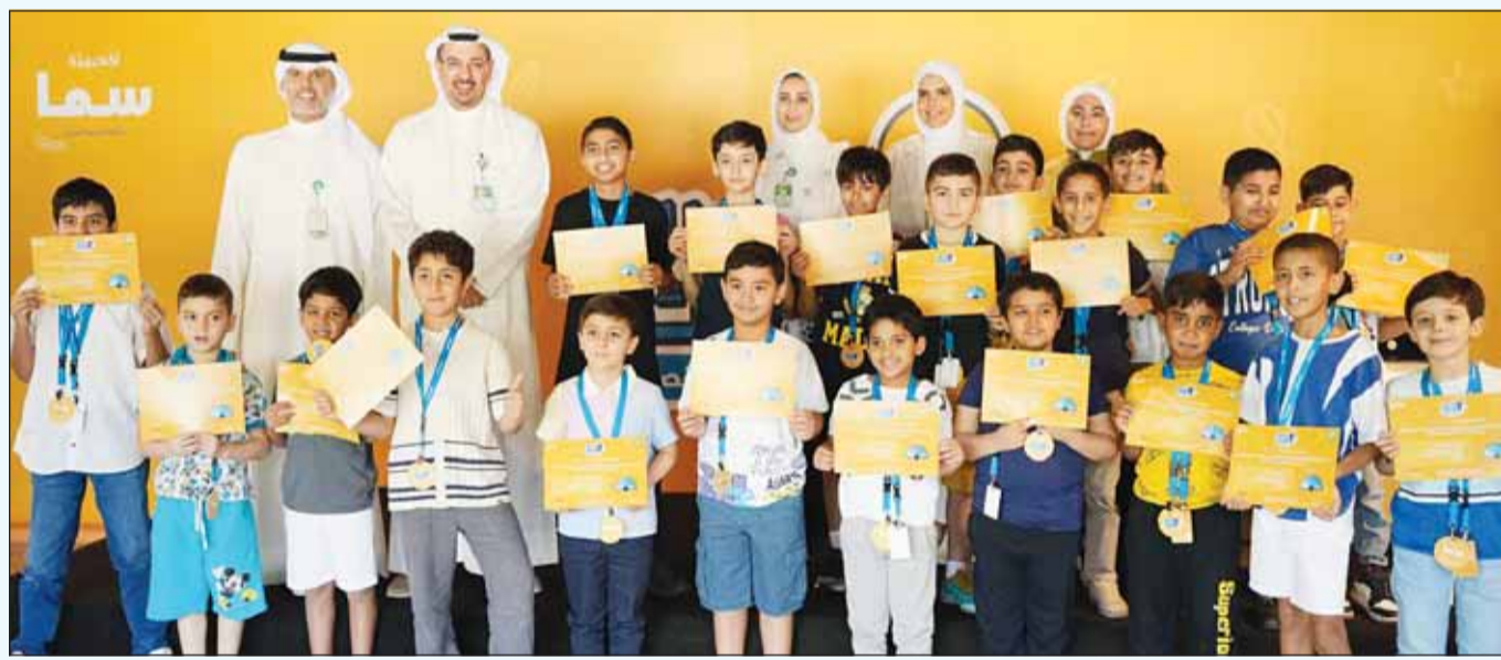
صورة جماعية للطلبة المشاركين في المبادرة

واصل بيت التمويل الكويتي "بيتك" فعاليات مبادرة "العربية لغتي" التي ينظمها لأبناء الموظفين بالتعاون المثمر مع أكاديمية "سما" بإدارة كوادر وطنية طامحة، لتعلم اللغة العربية على الطريقة الإسكندنافية التي تمزج بين التعليم والمرح، في تأكيد جديد على اهتمام "بيتك" بموظفيه وأسره وحرصه على تنظيم أنشطة مفيدة للجميع لخلق جيل واع ومجتمع ناجح. وتعتبر هذه المبادرة عن حب اللغة العربية والاعتزاز بها وأهمية تأسيسها لدى الأطفال، وتأسيس كوكبة من الكتاب الفاعلين لمستقبل الكويت، وقد قدم "بيتك" في النسخة الثانية من المبادرة، ثلاث فعاليات هي "بطولة كتابة القصة - أبدأ مبكراً - ماراثون القراءة".