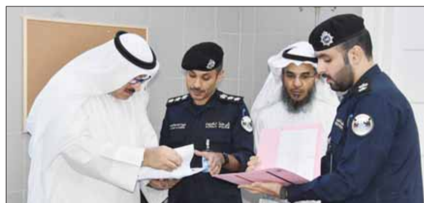
د.العوضي يطلع على الاحتياجات اللازمة لإجراءات فحص الطلبة المتقدمين للالتحاق بالأكاديمية

أكد وزير الصحة الدكتور أحمد العوضي، أول من أمس، التزام وزارة الصحة بتقديم جميع أشكال الدعم الفني لمستشفى أكاديمية سعد العبدالله للعلوم الأمنية بما يسهم في تعزيز كفاءة الخدمات الصحية المقدمة. ونذكرت الإدارة العامة للعلاقات والإعلام الأمني بوزارة الداخلية في بيان صحافي أن وزير الصحة أجرى زيارة إلى مستشفى أكاديمية سعد العبدالله للعلوم الأمنية "انطلاقاً من تعزيز التعاون بين وزارة الداخلية ووزارة الصحة" رافقه فيها وكيل وزارة الصحة الدكتور عبدالرحمن المطيري وذلك للاطلاع على الامتيازات اللازمة لاستكمال إجراءات فحص الطلبة المتقدمين للالتحاق بالأكاديمية سعد العبدالله للعلوم الأمنية. كما شملت الزيارة جولة في مستشفى الأكاديمية حيث اطّلع على الإجراءات الطبية المتبعة لفحص الطلبة المتقدمين والامتيازات اللازمة لتطوير الخدمات الصحية في المستشفى.