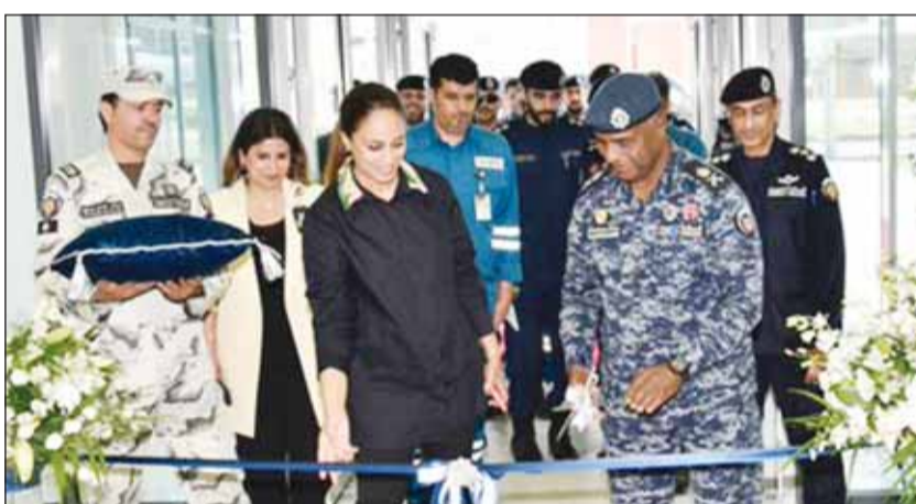
اللواء عبدالله سفاح والرئيس التنفيذي بالوكالة لـ "كيبك" وضحة الغظيب خلال قص شريط افتتاح المبنى

افتتح الوكيل المساعد لشؤون الأمن الخاص في وزارة الداخلية اللواء عبدالله سفاح الملا مبنى أمن المنشآت بمصفاة الزور التابعة للشركة الكويتية للصناعات البترولية المتكاملة. وأكد اللواء الملا حسب بيان صحافي لـ (الداخلية) أول من أمس، إن الافتتاح يأتي حرصاً من المؤسسة الأمنية على توفير أعلى درجات الأمن والحماية لمنشآت الوطن الحيوية وامتداداً لتوجيهات القيادة العليا للوزارة بالعمل والتكامل مع كل القطاعات المدنية والأمنية وصولاً إلى العمل بروح الفريق الواحد بهدف توفير أعلى درجات الأمن والحماية لمنشآت الوطن الحيوية. واستمع اللواء الملا خلال الافتتاح إلى شرح عن أنشطة الشركة ومهام ومسؤوليات فرق الأمن في مراقبتها وأشاد بعمل الإدارة العامة لأمن المنشآت