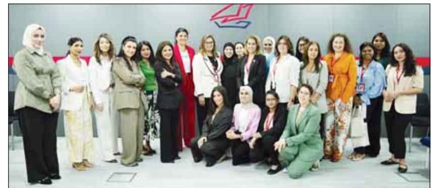
صورة جماعية خلال الفعالية

بمناسبة اليوم العالمي لمساواة المرأة، استضاف برنامج (WOW) في بنك الخليج خلال الاجتماع الشهري للبرنامج المتمثلة والمدرية الأمريكية المعروفة ميلودي ميتشيل مؤسسة Lean In Network في الكويت.