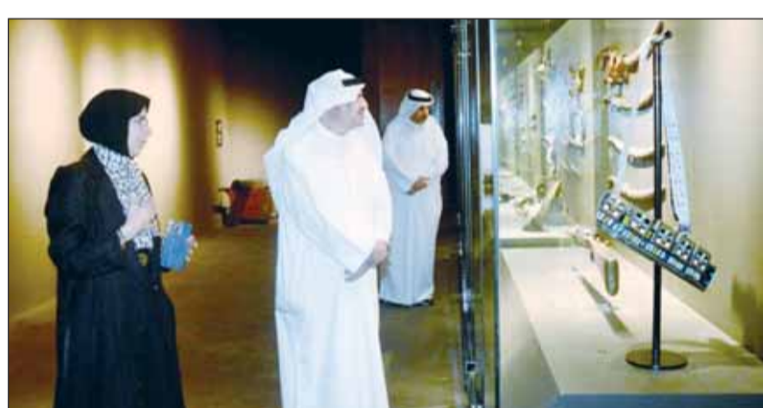
محافظ الجبراء حمد الحبشي يطلع على أنواع الأسلحة التراثية في المتحف

أكد محافظ الجبراء حمد الحبشي أن أعمال الصيانة والتطوير وإعادة تأهيل القصر الأحمر ومتحف السلاح تسير بالشكل المطلوب، مشيراً إلى أن موعد افتتاحها سيكون مطلع شهر نوفمبر المقبل. ويحث الحبشي، خلال زيارته "مبنى القصر الأحمر ومتحف السلاح" بحضور الباحث والأديب مشعل السعيد، مع المسؤولين آخر التطورات وجميع الملاحظات التي سيتم العمل عليها بما يليق بمكانة القصر التاريخية ليكون معلماً مهماً يقصده كل من يريد معرفة تاريخ هذا الصرح وأهم الأحداث التي وقعت فيه. وشدد الحبشي على ضرورة تضافر الجهود لتحويل الأفكار إلى أعمال على أرض الواقع لسرد تاريخ أهم معالم الكويت التاريخية. من جانبه، عبر الباحث والأديب مشعل السعيد عن سعاده بزيارة محافظ الجبراء والإطلاع بنفسه على الانجاز الذي قمنا به من تطوير وتأهيل لهذا الصرح التاريخي، مؤكداً أن كل ما تقدمه ونقوم به من أعمال هو واجب وطني.