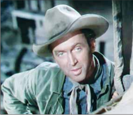
جيمس ستيوارت في انعطاف نهر