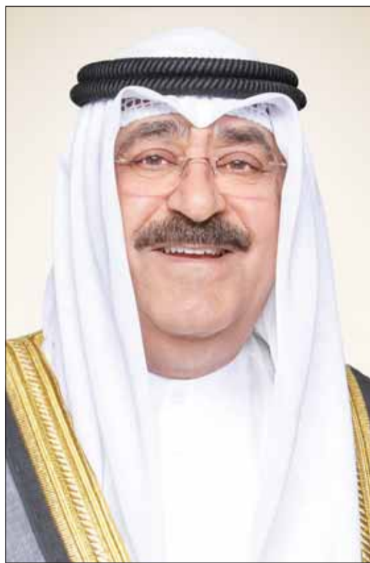
سموه أمير البلاد الشيخ مشعل الأحمد