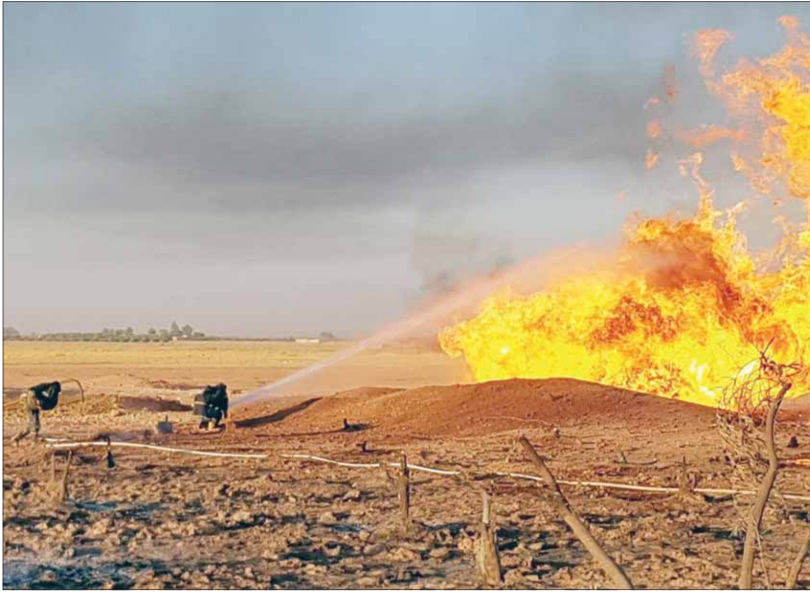
رجال إطفاء يحاولون السيطرة على حريق ناجم عن انفجار في مخيم للاجئين الفلسطينيين في بلدة الضمير وعدرا شمال غرب العاصمة السورية دمشق وسط ضربات إسرائيلية لمنع تمرکز وكلاء إيران

دمشق، عواصم - وكالات، منذ بداية الحرب في غزة، كثفت إسرائيل غاراتها الجوية على الأهداف في سورية، مستهدفة الجماعات المسلحة وخطوط الإمداد، ويأتي هذا التصعيد كجزء من استراتيجية أوسع لمواجهة تأثير إيران وحلفائها، وخصوصاً "حزب الله" اللبناني الذي نمت قوته بشكل كبير قرب الحدود الإسرائيلية مع لبنان، ووفقاً لتقرير لصحيفة "وول ستريت جورنال" تحت عنوان "حرب بين الحروب"، فإن إسرائيل نفذت منذ شهر أكتوبر عام 2023 نحو 180 غارة في سورية، وهي زيادة ملحوظة مقارنة بالسنوات السابقة، واستهدفت تلك الهجمات الجماعات المدعومة من إيران مثل "حزب الله" و"الجهاد" بهدف تعطيل قدراتهم العسكرية وسلاسل الإمداد، وأسفرت أفر الضربات بالقرب من الحدود السورية اللبنانية قبل نحو يومين، عن مقتل مسؤول رفيع في حركة "الجهاد" الفلسطيني قبل إنه كان يخطط لهجمات ضد إسرائيل.