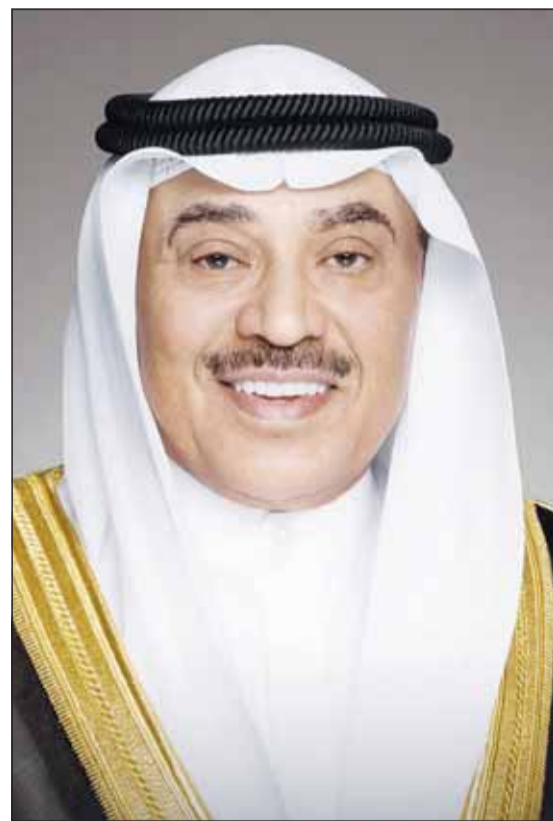
سموه ولي العهد الشيخ صباح الخالد

استقبل سمو ولي العهد الشيخ صباح الخالد بقصر السيف أمس، سمو رئيس مجلس الوزراء الشيخ أحمد عبدالله. كما استقبل سموه، النائب الأول لرئيس مجلس الوزراء وزير الدفاع وزير الداخلية الشيخ فهد اليوسف. من جهة أخرى، بعث سمو ولي العهد ببرقية تعزية إلى أخيه خادم الحرمين الشريفين الملك سلمان بن عبدالعزيز ملك المملكة العربية السعودية الشقيقة، بمناسبة وفاة المغفور لها بإذن الله تعالى الأميرة نورة بنت عبدالله آل عبدالرحمن سعود، راجياً سموه المولى جل وعلا أن يتغمدها بواسع رحمته ويسكنها فسيح جناته. كما بعث سموه ببرقية تعزية إلى الفريق أول ركن عبدالفتاح البرهان عبدالرحمن رئيس مجلس السيادة الانتقالي لجمهورية السودان الشقيقة، ضمنها سموه خالص تعازيه وصادق مواساته بضيحايا الفيضانات وأسفر عن سقوط العديد من الضحايا والمصابين وتدمير للممتلكات والمرافق العامة. وبعث سموه ببرقية تهنئة إلى الرئيس شوكت ميرضيائيف رئيس جمهورية أوزبكستان الصديقة، ضمنها سموه خالص تهانيه بمناسبة العيد الوطني لبلاده، وراجياً له دوام الصحة والعافية. كما بعث سمو ولي العهد ببرقية تهنئة إلى الرئيس بيتر بيليفريني رئيس جمهورية سلوفاكيا الصديقة، ضمنها سموه خالص تهانيه بمناسبة العيد الوطني لبلاده، وراجياً له دوام الصحة والعافية.