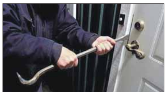
يمنية تزحف لصا تسلل إلى منزلها

■ صنعاء - وكالات، تمكنت امرأة يمنية، في محافظة البيضاء، وسط البلاد، من قتل لص تسلل إلى منزلها بحثاً عن مقتنيات يمكنه سرقتها.