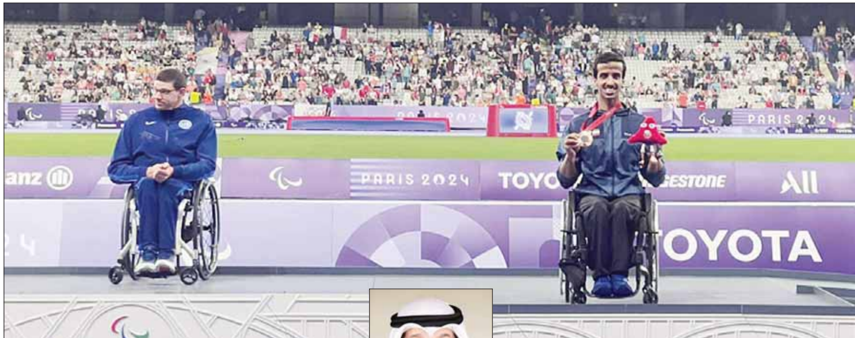
الراجحي يتوج ببرونزية الألعاب البارالمبية الصيفية "باريس 2024"