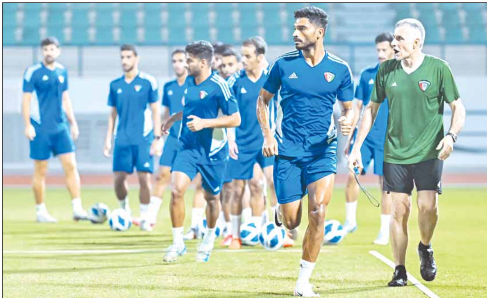
منتخبنا الوطني يواصل استعداداته لمواجهة النشامه