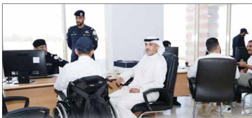
تدشين العمل في المبنى الجديد