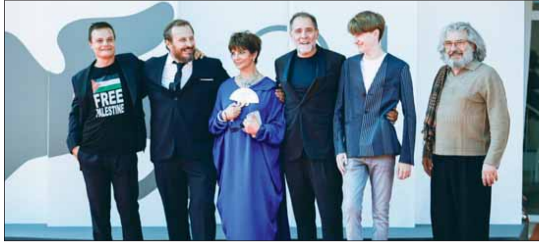
من حفل افتتاح مهرجان فينيسيا 2024