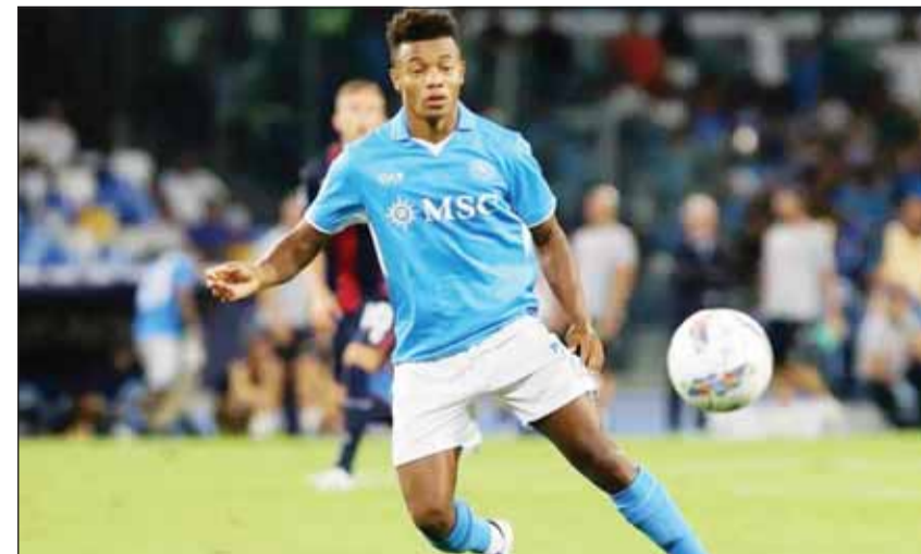
البرازيلي دافيد نيريس

■ تعرض لاعب نابولي الجديد البرازيلي دافيد نيريس للسرقة بقوة السلاح بعد فوز فريقه على بارما 2-1 أول من أمس في المرحلة الثالثة من الدوري الإيطالي لكرة القدم، وذلك وفق ما كشفت زوجته في منشور على إنستاغرام.