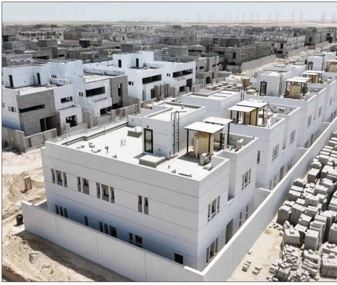
مدن إسكانية في الكويت

الشركات الأجنبية تفوز بالعقود والمحلية لـ "الباطن"