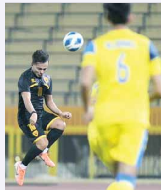
من لقاء القادسية والساحل