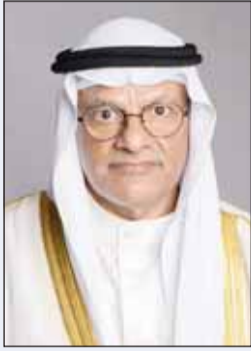
د. نادر الجلال

ولفت إلى أن الراغبين في لقاء الوزير عليهم رفع طلبهم عبر منصة تواصل الحكومية، علماً بأنه يتم تنسيق المواعيد حسب ترتيب طلبات التقديم في المنصة.