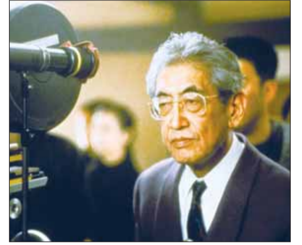
المخرج ناغيسا أوشيميا

هذا التنوع الشديد يتوالى مع اختيار فيلم فرنسوا تروفو "البشرة الناعمة" (1964) الذي ينتمي إلى أعماله الدرامية ذات المنوال الرومانسي، يحكي قصة ناشر يعيش حياة هانئة مع زوجته، لكن ذلك لا يمنعه من خديعتها مع مذيعة طيران التقى بها. أيضاً هناك الفيلم الكوميدي "فتاته فرايدي" (1940) وهو من تلك الأفلام التي تميّزت بمهارة المخرج هوراد هوكس في الكتابة وفي إخراج هذه الكوميديات العاطفية، حيث كان في البطولة كاري غرانت في دور الصحافي الذي يسعى لإثبات زوجته (روزيلاند راسل) عن طيب الطلاق، غرانت لديه نموذج لا يتغير في التمثيل وهو هنا يمارسه بنجاح مثالي. العاملون سينتبهون إلى أن الحكمة ليست بعيدة عن الفيلم الكلاسيكي الآخر "الصفحة الأولى" (The Front Page) الذي أنجز مرتين الأولى سنة 1931 على يد لويس مايلستون، والثانية الفيلم الأشهر الذي حققه بيلى وايلدر سنة 1974. أيضاً فيلم "مارون يعود إلى بيروت" (2024) ليس كلاسيكياً، ما يُثير التساؤل في اختياره بهذا القسم.