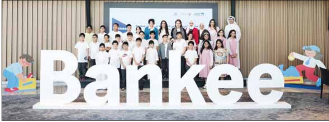
المشاركون في البرنامج