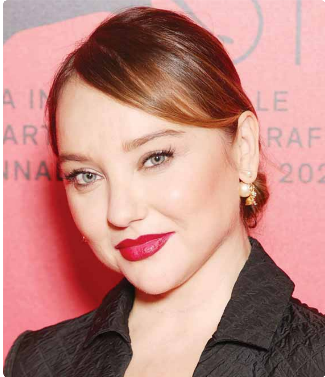
الممثلة الروسية جيني رومانوفا خلال حضورها مهرجان البندقية السينمائي