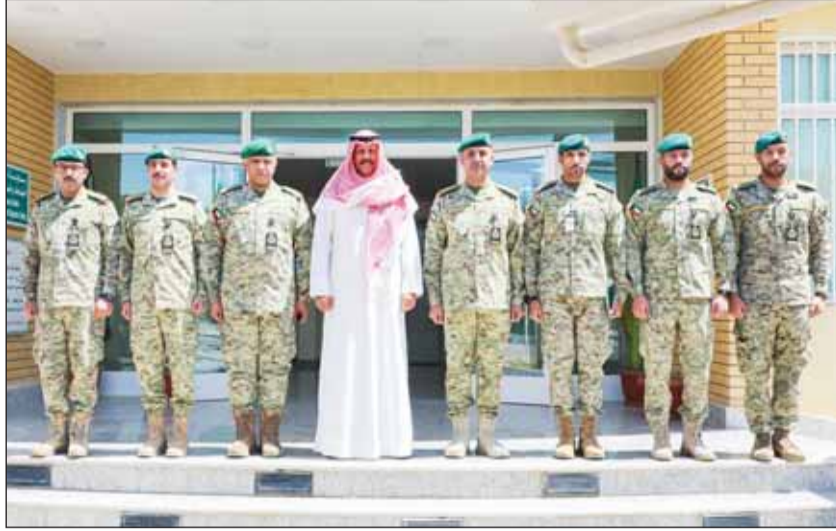
الشيخ فيصل النواف متوسلاً قيادات وضباط مديرية الأمن العسكري