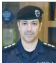
العقيد فيصل الدحيان