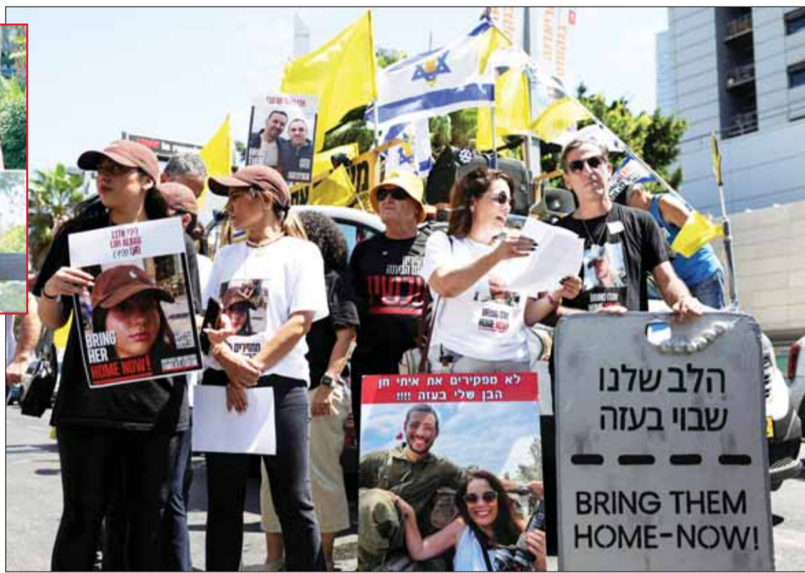
عائلات الرهائن يحملون لافتات خلال تظاهرات غاضبة ضد نتياهو وفيه الإطار المحتجزون الستة الذين تم انتشار جثثهم (وكالات)