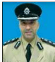
العقيد احمد دشتي