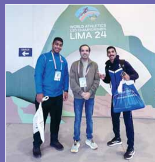
العميمي مع أبطال ألعاب القوى بموندنال الشباب

وترأس وفد منتخبنا الوطني لألعاب القوى في المعسكر التركي الذي خاضه المنتخب قبل الموندنال في تركيا، وكذلك في بطولة