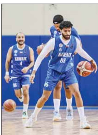
تدريب سابق لأزرق السلة

يبدأ منتخبنا الوطني الأول لكرة السلة، مشوار بطولة الخليج الـ17 والتي تنطلق اليوم بالمنامة، بمواجهة شقيقه السعودي في الخامسة مساء على صالة مدينة خليفة الرياضية، يعقها مواجهة قطر والبحرين. وحسب نظام البطولة التي اعتد عن عدم المشاركة بها الإمارات وعمان، تلعب الفرق بنظام الدوري من دور واحد، يتواجه بعدها أول مع الرابع والثاني مع الثالث، والفايزان يتأهلان للنهائي. بدوره، يدشن منتخب سلة الشباب اليوم، مشواره في نهائيات كأس آسيا للعبة التي تقام في العاصمة الأردنية عمان. من جانبه، قال رئيس اتحاد كرة السلة ضاري برجس، إن المنتخب الأول استعداد جيدا للبطولة الخليجية منذ أكثر من شهر عبر إجراء تدريبات قوية بالكويت تحت قيادة المدرب الجديد الصربي أوليفر كوستيتش قبل أن يقم معسكرا تدريبيا قويا في العاصمة المصرية بلقراد حتى موعد البطولة. وأضاف برجس أن المنتخب الوطني خاض بمعسكره التدريبي ثلاث مباريات ودية مع أندية المقدمة في صربيا قدم خلالها مستويات مطمئنة مؤكدا ثقته بتحقيق نتائج متميزة في هذا التجمع الخليجي. وذكر أن الأزرق سيبدأ بلقاء السعودية حامل اللقب ثم البحرين المستضيف وأخيرا قطر. على أن يبدأ الدور قبل النهائي والنهائي وفق تتاعج الدور الأول.