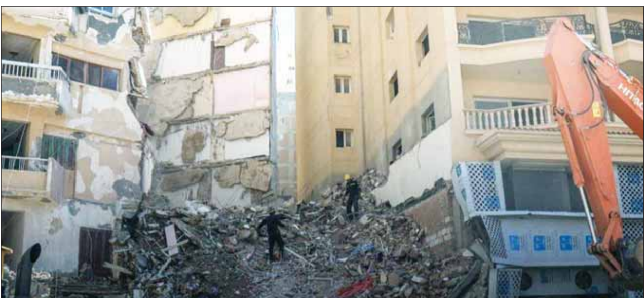
فرق الحماية المدنية في القاهرة ووحدات المحافطات تبشّر عمليات رفع أنقاض العقار المنهار بحثاً عن ضحايا ومصائبين