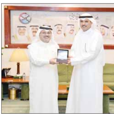
الجابر يقدم درعاً تذكارية لسفير البحرين صلاح المالكي

■ استقبل محافظ الأحمد الشيخ حمود جابر الأحمد، في مكتبه أمس، سفير مملكة البحرين لدى دولة الكويت صلاح المالكي. وجرى خلال اللقاء تبادل الأماني الودية التي تناولت العلاقات الثنائية الوثيقة التي تربط البلدين الشقيقين وسبل تعزيزها في جميع المجالات، إضافة إلى بحث سبل تطوير التعاون المشترك. وأعرب المحافظ الجابر عن تمنياته للسفير المالكي بالتوفيق في مهامه والدفع بعلاقات البلدين إلى آفاق أرحب ثنائياً وضمن منظومة مجلس التعاون لدول الخليج العربية. ومن جهته أكد السفير المالكي أن البحرين والكويت شعب واحد يربطهما مصير مشترك وعلاقات وثيقة.