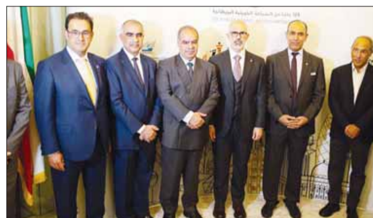
الشيخ جراح الجابر خلال حضوره حفل افتتاح الأسبوع الثقافي الكويتي في المملكة المتحدة

□ العبد الجليل: وثائق ومقتنيات نادرة وأصلية في "معرض العلاقات"