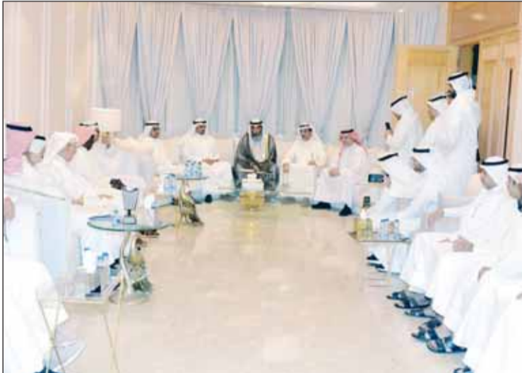
صوره تجمع الأقارب والأصدقاء