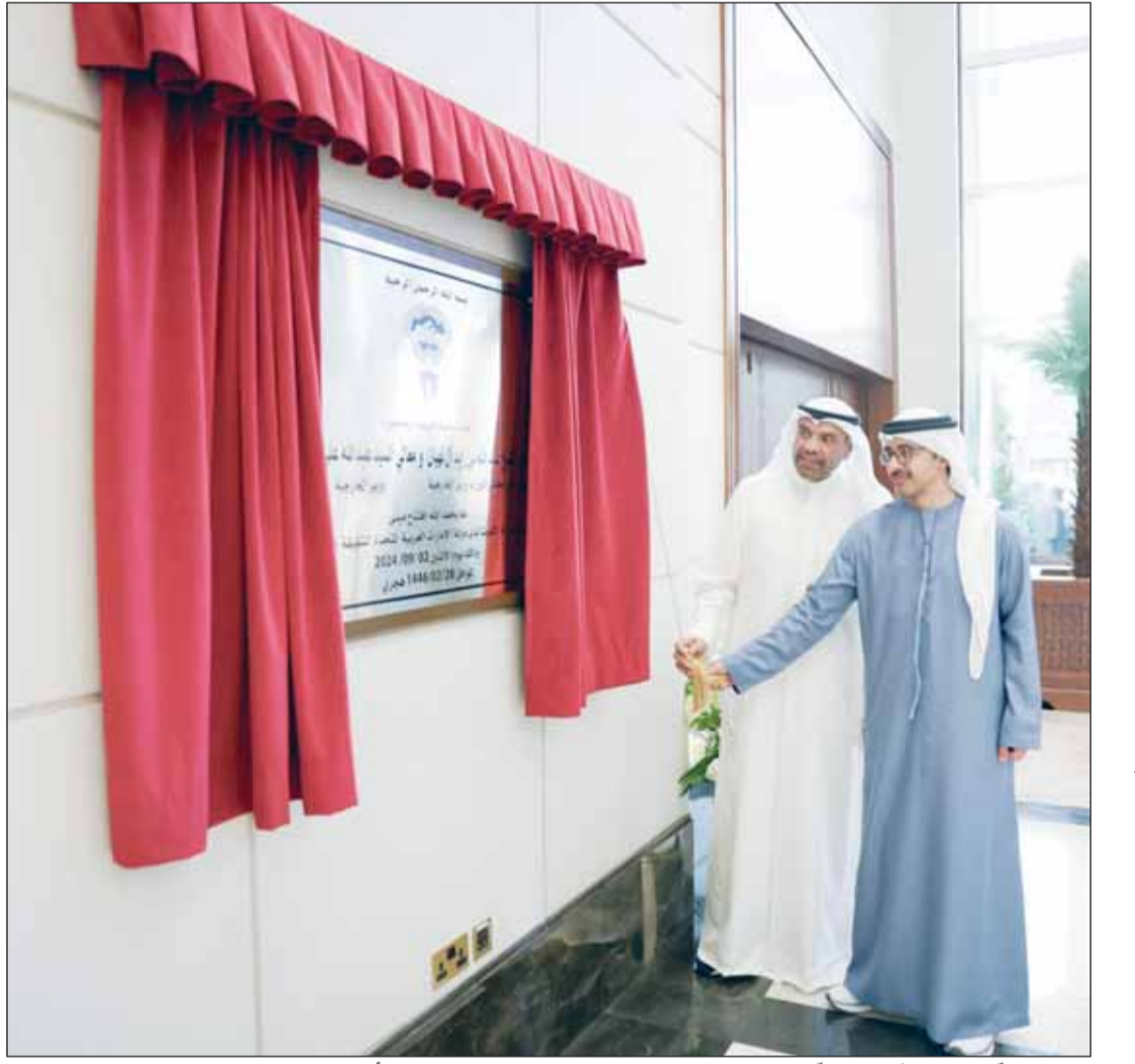
الوزير عبدالله الجبيا والشيخ عبدالله بن زايد خلال افتتاح المقر الجديد لسفارة الكويت في أبوظبي

بن زايد: ملكية الثروات الطبيعية في المنطقة المغمورة بما فيها حقل الدرة مشتركة بين السعودية والكويت فقط