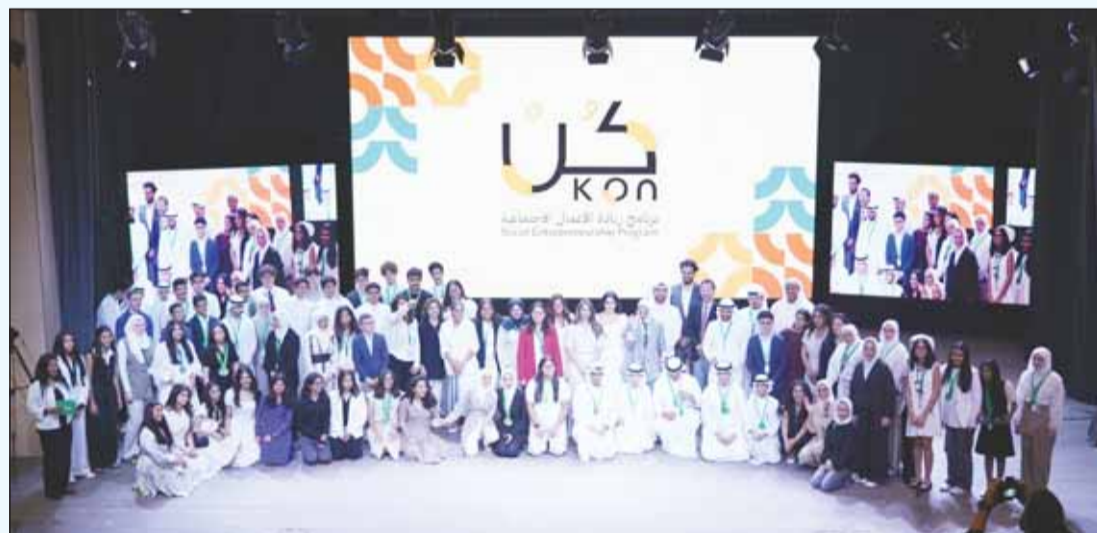
صورة جماعية مع المشاركين في برنامج كُنْ

وتتمتع شراكة أجيليتي الاستراتيجية مع لويك منذ عام 2006، حيث ساهمت في إعداد الشباب الكويتيين لدخول سوق العمل عبر دورات "لويك" المتخصصة ومبادراتها المميّزة في نشر الثقافة المالية وتعزيز طموح الشباب بريادة الأعمال. كذلك، تتمتع أجيليتي بالترام طويل الأمد تجاه برامج التعليم وبناء القدرات ونقل المعرفة التي تزود الشباب بالمهارات التي يحتاجونها للنجاح والقيادة. ومنذ عام 2014 استفاد أكثر من 687.000 شاب وفتاة من الدعم التعليمي الذي تقدمه الشركة، وكان نحو 50% من هذا الدعم موجهاً للإناث.