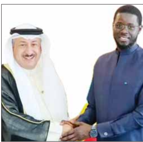
رئيس السنغال مستقبلاً السفير عادل الأمير

■ استقبل رئيس السنغال باسيريو جوماي جافار فاي في القصر الرئاسي سفير دولة الكويت بديكار عادل الأمير بمناسبة انتهاء مهام عمله. وذكرت سفارة دولة الكويت لدى السنغال في بيان تلقت وكالة الأنباء الكويتية (كونا) نسخة منه أمس، إنه جرى خلال اللقاء التطرق إلى العلاقات الثنائية بين دولة الكويت والسنغال. ونقل سفير الكويت للرئيس السنغالي تحيات ودمج سمو أمير البلاد الشيخ مشعل الأحمد وتحيات سمو ولي العهد الشيخ صباح خالد. من جانبه ثمن رئيس السنغال جهود سفارة دولة الكويت في توطيد العلاقات التاريخية الراسخة بين البلدين.