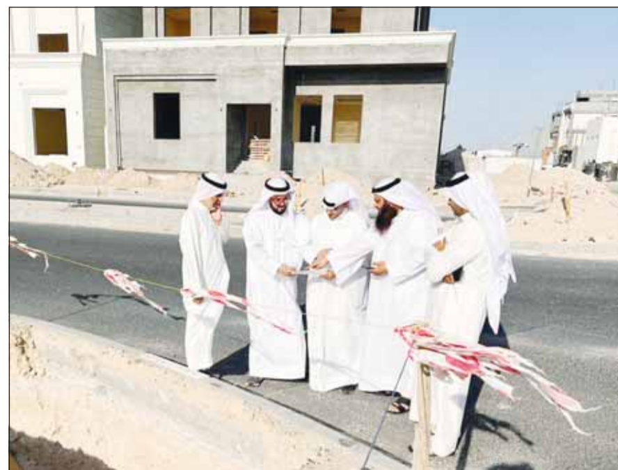
الوزير عبداللطيف المشاري مع قياديين المؤسسة خلال الجولة في "المطلاع السكنية"

من جانب آخر، أكدت المصادر أن (السكنية) اعتمدت العروض الفنية والمالية لمناقصتي الخدمات الاستشارية الخاصة بأعمال الإدارة والإشراف على أعمال إنشاء وإنجاز 3345 بيتاً بمشروع المساكن الميسرة في السالمي التي ستكون بديلاً عن منطقتي الصليبية وتيماء، لافتة إلى أن المناقصة الأولى الخاصة بالخدمات الاستشارية لبناء 1568 بيتاً تقدمت لها 4 شركات، فيما تقدمت للثانية الخاصة بالخدمات الاستشارية لإنجاز 1777 بيتاً 4 شركات أخرى. وذكرت المصادر أن المؤسسة طرحت كل العقود الخاصة بإنشاء وإنجاز 9800 بيت بمشروع المساكن الميسرة في السالمي.