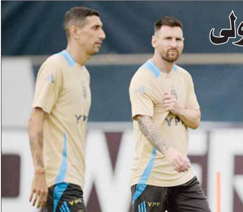
البرغوث ودي ماريا يخيبان عن التانغو

في المباراة التي انتهت بفوز التانغو بهدف نظيف وتوجيهه باللقب للمرة الثانية توالياً. وتعرض "البرغوث" وقتها لإصابة قوية بالتواء في الكامل الأيمن، وعاد بعد فترة تأهيل طويلة للتدرب مع فريقه الأسبوع الماضي. من جانبه، فإن دي ماريا صاحب الـ36 عاماً، كان قد أعلن قبل عدة أشهر أن بطولة كوبا أمريكا 2024 ستكون الأخيرة له مع منتخب بلاده قبل الاعتزال الدولي، ليكتفي بالتتويج بمونديال قطر 2022 وكوبا أمريكا 2021 و2024 وكأس لا فيناليسيمبا 2022، مثله مثل ميسي، إضافة لتتويجهما مع المنتخب أيضاً بلقب كأس العالم تحت 20 عاماً وذهبية أوليمبياد بكين 2008. ورغم أن لاعب بنفيكا البرتغالي حالياً في حقيقته الثانية، وريال مدريد ومانشستر يونايتد وباريس سان جيرمان ويوفنتوس السابق، سيكون حاضراً في استاد مونومنتال، في بونوس آيرس الخميس، فإنه لن يرتدي القميص رقم 11 في أرض الملعب، لكن سيتم تكريمه من قبل الجماهير. وستكون هذه المرة الأولى التي يغيب فيها النجمان عن منتخب الأرجنتين في مباراة رسمية منذ 15 أكتوبر 2013، حينما سقطت الأرجنتين 3-2 خلال زيارتها لأوروغواي في الجولة الأخيرة من التصفيات المؤهلة لمونديال البرازيل 2014، التي تأهل "التانغو" لنهائياها قبل السقوط أمام ألمانيا بهدف نظيف.