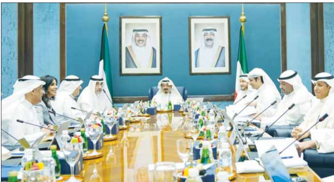
سمو الشيخ أحمد العبدالله مترسأ اجتماع مجلس الوزراء

من جانب آخر، أطيح بمجلس الوزراء علماً بنتائج الزيارة التي قام بها الوفد الصيني الحكومي مؤخرا للبلاد، واستمع بهذا الصدد إلى شرح قدمته د. نورة المشعان وزير الأشغال العامة بشأن تفعيل الاتفاقيات الموقعة بين حكومتی دولة الكويت وجمهورية الصين الشعبية الصديقة لتنفيذ المشاريع الحيوية الكبرى ومنها تنفيذ وإدارة وتشغيل مشروع ميناء مبارك الكبير بكل مراحله بهدف خلق ممر إقليمي آمن ومركز تجاري في المنطقة استكمالا وترجمة للتوجهات السامية لسمو أمير البلاد الشيخ مشعل الأحمد.