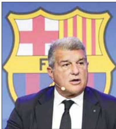
رئيس برشلونة خوان لابورتا

تحدث خوان لابورتا، رئيس برشلونة أمس، عن أكثر الموضوعات المثيرة للجدل داخل جدران النادي الكتالوني هذا الموسم. وقال لابورتا، في مؤتمر صحفي، "قبل 3 سنوات، كان النادي في وضع خطير وفارج عن السيطرة، لكننا عملنا على التعافي الاقتصادي، ونحن الآن في وضع أفضل من الناحية المالية والاجتماعية والرياضية". وأضاف رئيس برشلونة، "هانز فليك (مدرب الفريق) يمتلك عقلية الفوز، نحن سعداء للغاية وفخورون بالفريق، ونرى أن لا ماسيا (أكاديمية برشلونة) هي جوهر مشروعنا". وتابع، "نحن أيضاً سعداء جداً بديكو، لقد قام بعمل ممتاز ورائع خلال الفترة الأخيرة، بما في ذلك في جلب هانز فليك إلى هنا". واستطرد، "وصول داني أولمو يؤكد ما قلته قبل بضعة أشهر، نعم.. كان برشلونة مستعداً لتوقيع عقود مع لاعبين من مستوى عال". وعلق رئيس برشلونة على فشل التوقيع مع نيكو ويليامز نجم أتلتيك بيلباو، قائلاً، "لن أتحدث عن لاعبين ليسوا في برشلونة، احتراماً لناديهم". وسئل لابورتا لماذا لم يحتفظ برشلونة بجواو فيليكس وكانسيلو؟ فأجاب، "قررنا التخطيط للفريق بطريقة مختلفة، لقد كان الثنائي على