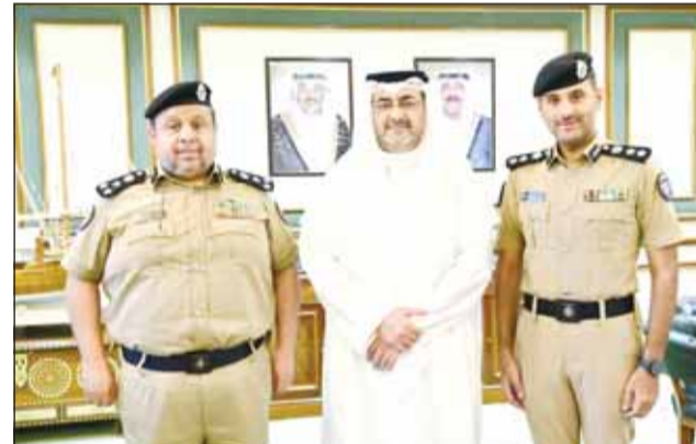
العلمية متوسطاً مديري كلية الأمن الوطني ومعهد الدراسات الاستراتيجية

شدد محافظ العاصمة ومحافظ الفروانية بالوكالة الشيخ عبدالله سالم العلي، على أهمية بذل المزيد من الجهود من قبل رجال الأمن، وفرض الانضباط والالتزام بالقانون، واتخاذ كافة الترتيبات والجاهزية في القطاعات الأمنية لحفظ الأمن. وجاء ذلك خلال الجولة التفقدية التي قام بها المحافظ إلى مديرية أمن محافظة الفروانية، وتخللها الاطلاع على الحالة الأمنية ومدى الاستعداد في القطاعات الأمنية التابعة للمحافظة، بحضور مدير