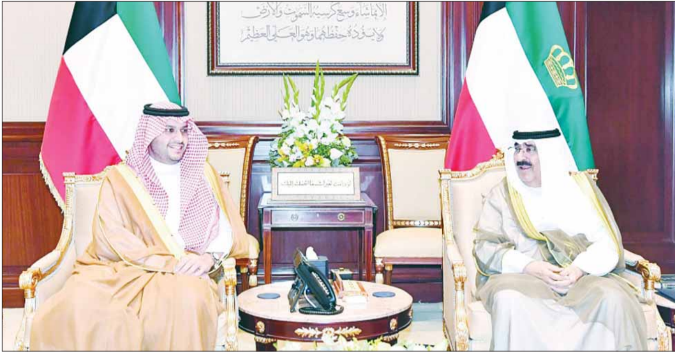
سموه أمير البلاد الشيخ مشعل الأحمد مستقبلاً وزير الدولة السعودي الأمير تركي بن محمد

■ أعرب سمو أمير البلاد الشيخ مشعل الأحمد عن تمنياته للمملكة العربية السعودية وشعبها الشقيق بمزيد من الرقي والازدهار تحت ظل القيادة الحكيمة لأخيه خادم الحرمين الشريفين الملك سلمان بن عبدالعزيز. جاء ذلك خلال استقبال سمو الأمير أمس بقصر بيان وزير الدولة عضو مجلس الوزراء بالمملكة العربية السعودية الأمير تركي بن محمد بن فهد بن عبدالعزيز، بمناسبة زيارته إلى البلاد. ونقل وزير الدولة السعودي إلى سمو الأمير تحيات وتقدير أخيه خادم الحرمين الشريفين الملك سلمان بن عبدالعزيز، وأخيه سمو ولي العهد رئيس مجلس الوزراء الأمير محمد بن سلمان وتمنياتها لسموه بموفق الصحة ودوام العافية ولشعب الكويت المزيد من التقدم والنمو. وقد حمّله سمو أمير البلاد تحياته لأخيه خادم الحرمين الشريفين الملك سلمان بن عبدالعزيز وأخيه سمو ولي العهد رئيس مجلس الوزراء الأمير محمد بن سلمان وتمنياتها لهما بموفق الصحة وتمام العافية، سائلاً المولى - تعالى - أن ينعم على المملكة العربية السعودية وشعبها بمزيد من الرقي والازدهار تحت ظل القيادة الحكيمة لأخيه خادم الحرمين الشريفين.