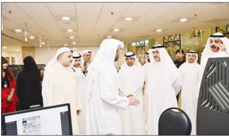
العلي والدكتور عبد الجواد في حديث مع أحد التربويين بالمنطقة

وأشاد المحافظ - على هامش جولته التقديرية - بالجهد الكبير الذي تبذره الكوادر الكويتية في المنطقة التعليمية، بتوجيهات وزيار التعليم العالي والبحث العلمي وزير التربية (بالوكالة) د. نادر الجليل، لافتاً إلى أنه لمس خلال جولته