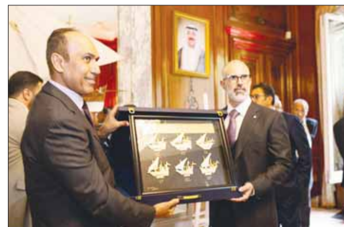
عبدالمحسن الفقهان مكرما نائب وزير الخارجية الشيخ جراح جابر الاحمد الصباح

هذا وتقدم الفقهان بجزيل الشكر ووافر الامتنان لوزارة