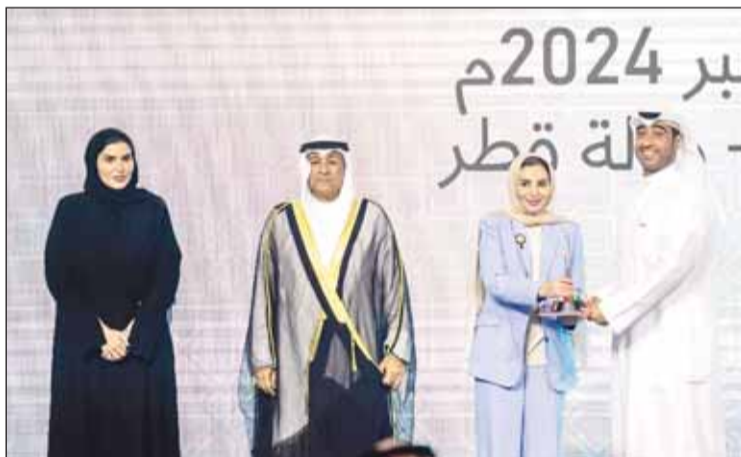
د. أمثال الحويلة تكريم فيصل الدويهي بحضور جاسم البديوي ومريم المسند

تم تكريم زين عن المشروع الرائد في مجالات العمل الاجتماعي على مستوى القطاع الخاص الكويتي عن حملتها الرمضانية السنوية "زين الشهور"، وذلك على هامش الاجتماع العاشر للجنة وزراء الشؤون والتنمية الاجتماعية بدول مجلس التعاون لدول الخليج العربية الذي أقيم مؤخرًا في الدوحة، قطر. وبناءً على التكريم خلال الاحتفال التكريمي الثالث عشر للمشروعات الرائدة في مجال العمل الاجتماعي، بحضور الأمين العام لمجلس التعاون لدول الخليج العربية جاسم البديوي، وزير الشؤون الاجتماعية وشؤون الأسرة والطفولة د. أمثال الحويلة، وزير التنمية الاجتماعية والأسرة في دولة قطر مریم المسند، وقام باستلام التكريم مسؤول العلاقات الموسسية في زين الكويت فيصل الدويهي.