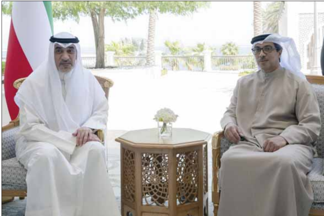
نائب رئيس الإمارات الشيخ منصور بن زايد لدمه لقائه النائب الأول وزير الدفاع والداخلية الشيخ فهد اليوسف