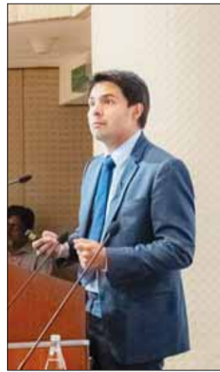
د.ديفيد ريسرتريو أماريليس

■ نظمت مؤسسة الكويت للتقدم العلمي الليلة الماضية ندوة متخصصة عن النقلة النوعية في إمكانات وقدرات الذكاء الاصطناعي التوليدي، سلطت الضوء على التطور الكبير لتكنولوجيا الذكاء الاصطناعي وقدراتها المالية والأخلاقية والقانونية المرتبطة به. شارك في الندوة عدد من القياديين والمعنيين من القطاع الخاص والعام والمجتمع المدني، وقدمها الاستاذ المشارك في الجامعة الفرنسية (HEC Paris)، الخبير المرموق في الذكاء الاصطناعي وتحليل البيانات للاستخدام في الممارسات القانونية د.ديفيد ريسرتريو أماريليس