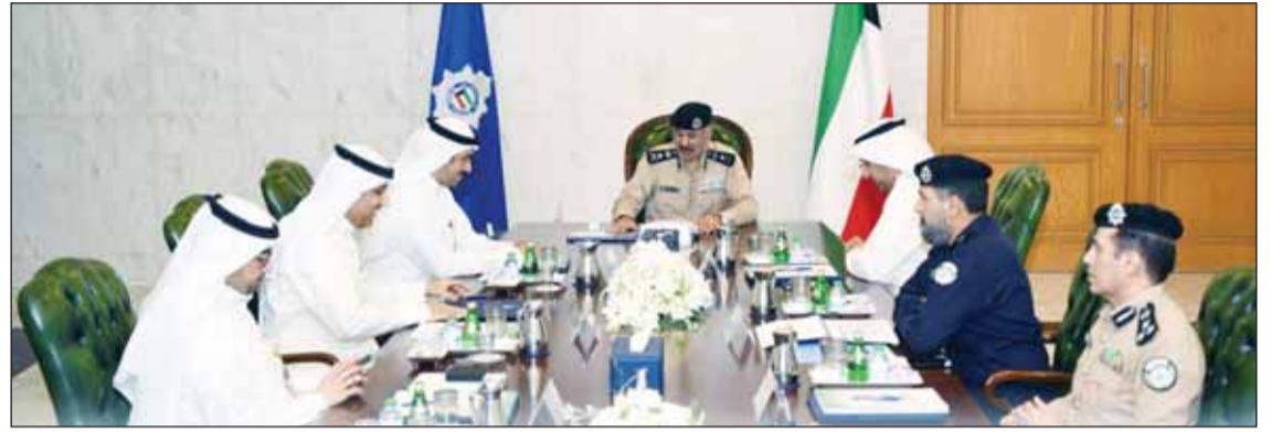
وكيل وزارة الداخلية الفريق الشيخ سالم النواف مترئساً اجتماع المجلس الأعلى للمرور

■ أكد وكيل وزارة الداخلية رئيس المجلس الأعلى للمرور الفريق الشيخ سالم النواف أهمية تصافر الجهود لوضع الحلول العملية والعلمية للمشكلة المرورية وتعزيز التعاون والتنسيق بين مختلف الجهات الحكومية والأهلية من أجل دراسة جميع الاقتراحات التي تسهم في انسيابية الحركة المرورية سواء بالأفكار الهندسية للطرق والتقاطعات أو بالتوعية والتثقيف أو تشديد العقوبات. جاء ذلك خلال تروسة الاجتماع الـ 22 للمجلس الأعلى للمرور أمس، والذي نقل خلاله تحيات وتقدير النائب الأول لرئيس مجلس الوزراء وزير الدفاع وزير الداخلية الشيخ فهد اليوسف وتمنياته لأعضاء المجلس بالتفريق في عملهم ومواصلة إيجاد الحلول العلمية والعملية للازدحامات والمشاكل المرورية خصوصاً خلال فترة دخول العام الدراسي الجديد. وتكررت وزارة الداخلية في بيان صحافي أنه