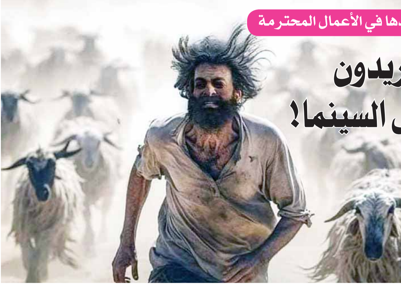
من فيلم "حياة الماعز"