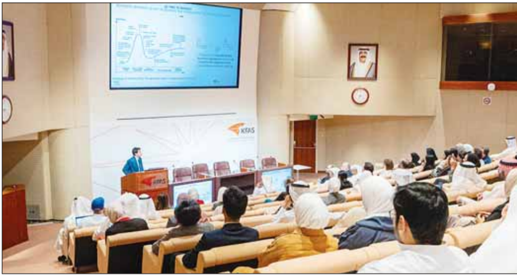
جانب من الندوة التي إقامتها مؤسسة التقدم العلمي