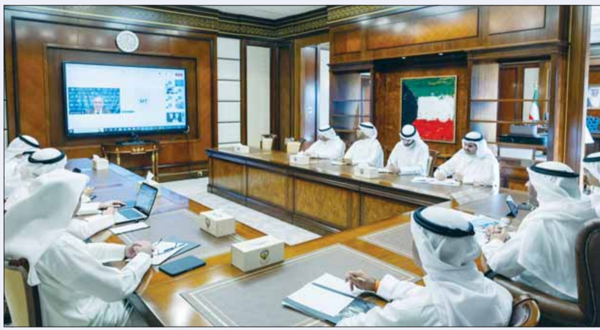
جانب من الاجتماع الافتراضي

■ أعربت وزارة الخارجية الكويتية عن "تضامن دولة الكويت مع جمهورية مصر العربية الشقيقة ورفضها للتصريحات الصادرة عن رئيس حكومة الاحتلال الإسرائيلي في محاولة بائسة لإقحام اسم مصر بهدف تشتيت الانتباه عن الجرائم التي ترتكبها قوات الاحتلال الإسرائيلي بشكل يومي ضد الشعب الفلسطيني وعرقلة جهود الوساطة المشتركة من قبل كل من جمهورية مصر العربية الشقيقة ودولة قطر الشقيقة والولايات المتحدة الأميركية الصديقة والهادفة إلى وقف إطلاق النار في غزة". وأضافت الوزارة في بيان لها أول من أمس، إن "دولة الكويت إذ تؤكد على وقوفها إلى جانب جمهورية مصر العربية في مواجهة أكاذيب الاحتلال الإسرائيلي وتدعو المجتمع الدولي ومجلس الأمن إلى التحرك لوضع حد للتجاوزات والانتهاكات المتواصلة التي يقوم بها الاحتلال الإسرائيلي بحق دول المنطقة".