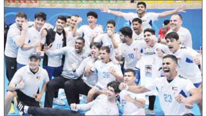
فكرة أزرق الناشئين بالتأهل للدور الرئيسي