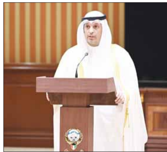
الوزير عبدالرحمن المطيري يُوَدِّعُ اليمين الدستورية

■ بعث سمو رئيس مجلس الوزراء الشيخ أحمد عبدالله ببرقية تعزية إلى خادم الحرمين الشريفين الملك سلمان بن عبدالعزيز آل سعود - ملك المملكة العربية السعودية الشقيقة، ضمنها سموه خالص تعازيه وصادق مواساته بوفاة المغفور لها بإذن الله تعالى الأميرة لطيفة بنت عبدالعزيز آل سعود.