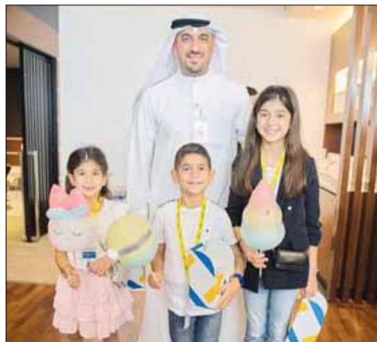
البنك مستقبلاً الأطفال

تنظيمها للموظفين خارج إطار العمل، مثل البطولات الرياضية واليوم المفتوح وورش العمل التوعوية والفعولات الطبية والعروض الحصرية وغيرها، مما يؤدي إلى تعزيز الصداقة بينك وبينهم، ضمن روح التعاون بينهم، ضمن الاحتمام المستمر بتلبية احتياجاتهم في ظل الدور الرئيسي الذي يلعبونه في تحقيق النجاح للبنك على مختلف المستويات. وأشادت الأريش في نهاية تصريحها بالتفاعل الكبير للأطفال مع مختلف الفقرات التي شهدت فعالية "ABK Juniors 2024" سلسة من الفعاليات التي يتم