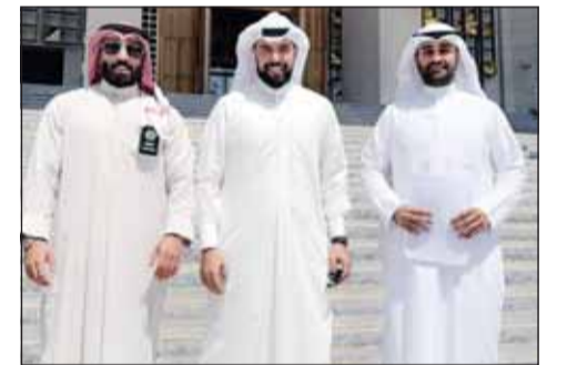
الفريق القانوني بعد التقدم بالبلاغ إلى النائب العام

بتكليف من المكتب القانوني لحركة العمل الشعبي تقدم مهابون بلاغ أمس إلى مكتب النائب العام المستشار سعد الصفران ضد الأكاديمي د.محمد المقاطع بشأن تغريدة دونها عبر حسابه على منصة "أكس" تضمنت - بحسب الحركة - شق صف الوحدة الوطنية.