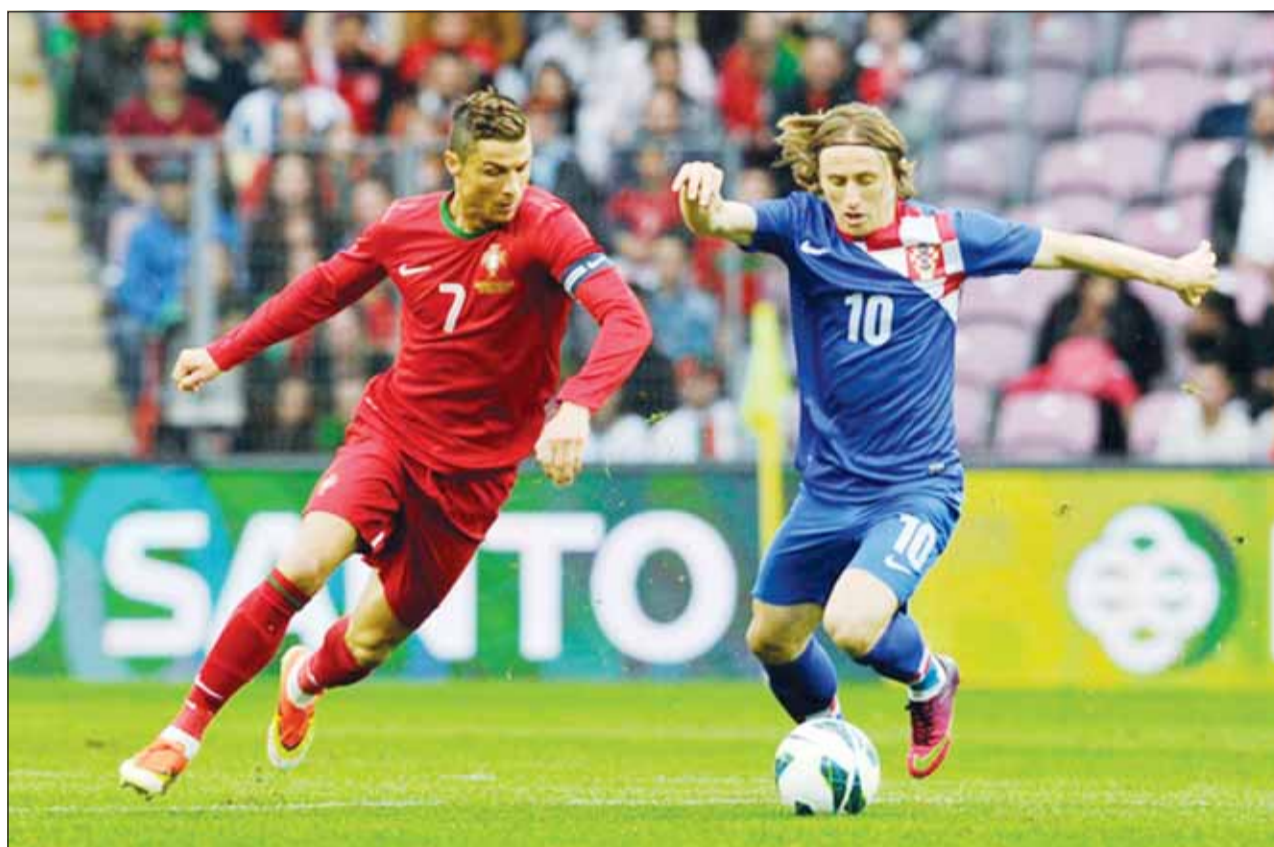
زميلا الأمل في مدريد يتلقان اليوم وجهاً لوجه

بعد الخسارة من إسبانيا صفر-3 والتعادل مع ألبانيا 2-2. ويتسلح المنتخب الكرواتي بخبرات نجمه وقائده لوكا مودريتش، لاعب وسط ريال مدريد الإسباني، والذي قاد الفريق للتأهل لنهائي نسخة 2023.