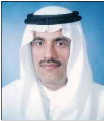
عبد الكريم البابطين

أصدرت مكتبة البابطين المركزية للشعر العربي العدد 25 من سلسلة "نوادر النواذر من الكتب" وهي السلسلة التي تهدف إلى تسليط الضوء على هذه الطائفة من الكتب التي تزخر بها "مكتبة عبد الكريم سعود البابطين"، فتعيد النضج إليها مرة أخرى، من خلال تعريف القارئ بترجمة مختصرة للمؤلف تتناول أبرز معالم حياته، وأهم مؤلفاته وعرض موسع لما يحتويه الكتاب من مادة معرفية تيسر للقارئ إلماماً مركزاً بموضوع الكتاب، وفصوله، وأبرز معالمه، ويختتم ذلك بذكر المواصفات المادية للكتاب تشمل المطبعة ومكانها، وزمن الطباعة، وحجم الكتاب وعدد صفحاته والمصادر التي اعتمد عليها في ترجمة المؤلف، ويرفق ذلك بعدد من الصور لغلاف الكتاب وبعض صفحاته، وبذلك يتمكن القارئ من الإطاحة بما يمثلها هذا الكتاب من أهمية، ليمثل كل جزء من هذه السلسلة وجبة فكرية وأدبية وثقافية تقدمها مكتبة البابطين إلى القارئ العربي.