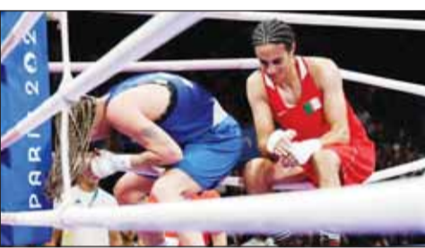
بوتين ينتقد الملكة إيمان خليف

■ عادت الملكة الجزائرية، إيمان خليف للواجهة مجدداً، والتي حصدت الميدالية الذهبية في فتحها بدورة الألعاب الأولمبية باريس 2024، خلال مقابلة جمعت الرئيس الروسي فلاديمير بوتين وطلاب مدرسة كيزيل، رغم أنه لم يذكر اسمها.