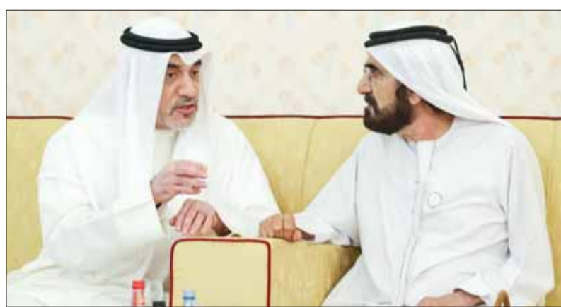
الشيخ محمد بن راشد والشيخ فهد اليوسف

■ أبو ظبي - "كونا"، بحث رئيس دولة الإمارات العربية المتحدة الشيخ محمد بن زايد آل نهيان مع النائب الأول لرئيس مجلس الوزراء وزير الدفاع وزير الداخلية الشيخ فهد اليوسف الروابط الأخوية التاريخية الكويتية- الإماراتية ومستوى تطور التعاون والعمل المشترك بينهما في جميع الجوانب التي تخدم مصالح البلدين وتسهم في تحقيق تطورات شعبيهما الشقيقتين نمو التنمية والازدهار.