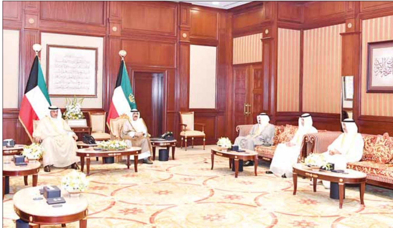
سمو أمير البلاد مستقبلاً بحضور سمو ولي العهد الشيخ صباح الخالد سمو الشيخ أحمد عبدالله وزير الإعلام وزير الدولة لشؤون الشباب عبدالرحمن المطيري