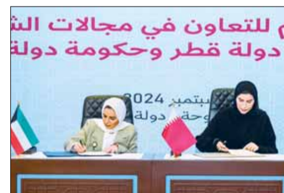
الوزيرتان د.أمثال الحوية ومريم المسند توفعان مذكرتي التفاهم

بمناسبة رئاستها وفد دولة الكويت المشاركة في الاجتماع العاشر للجنة وزراء الشؤون والتنمية الاجتماعية بدول مجلس التعاون في العاصمة القطرية الدوحة.