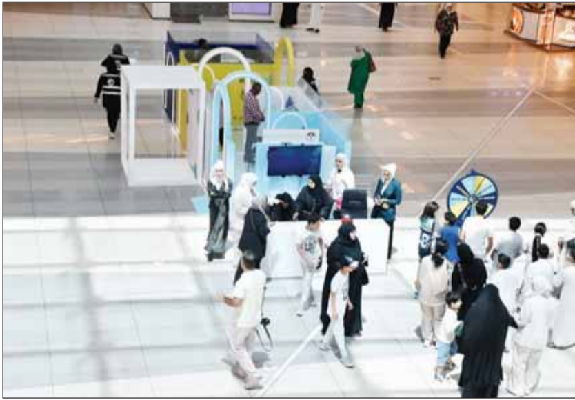
جانب من فعالية "العودة للمدارس"