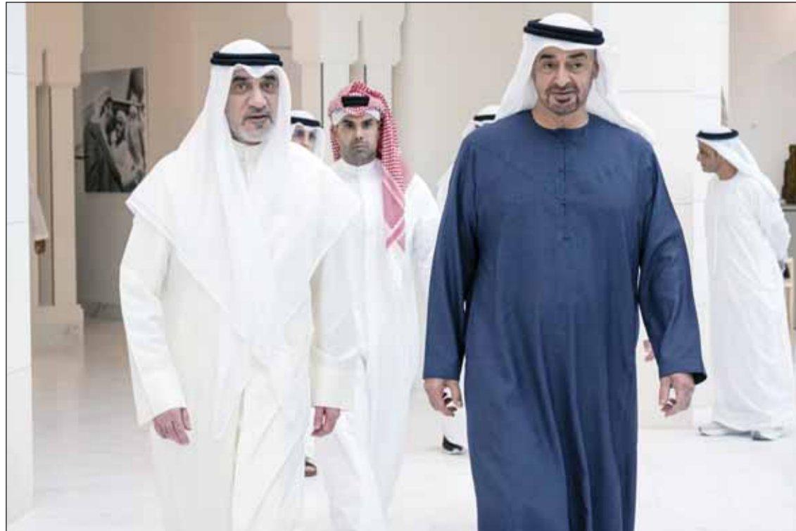
رئيس الإمارات الشيخ محمد بن زايد مستقبلاً النائب الأول لرئيس الوزراء وزير الدفاع وزير الداخلية الشيخ فهد اليوسف