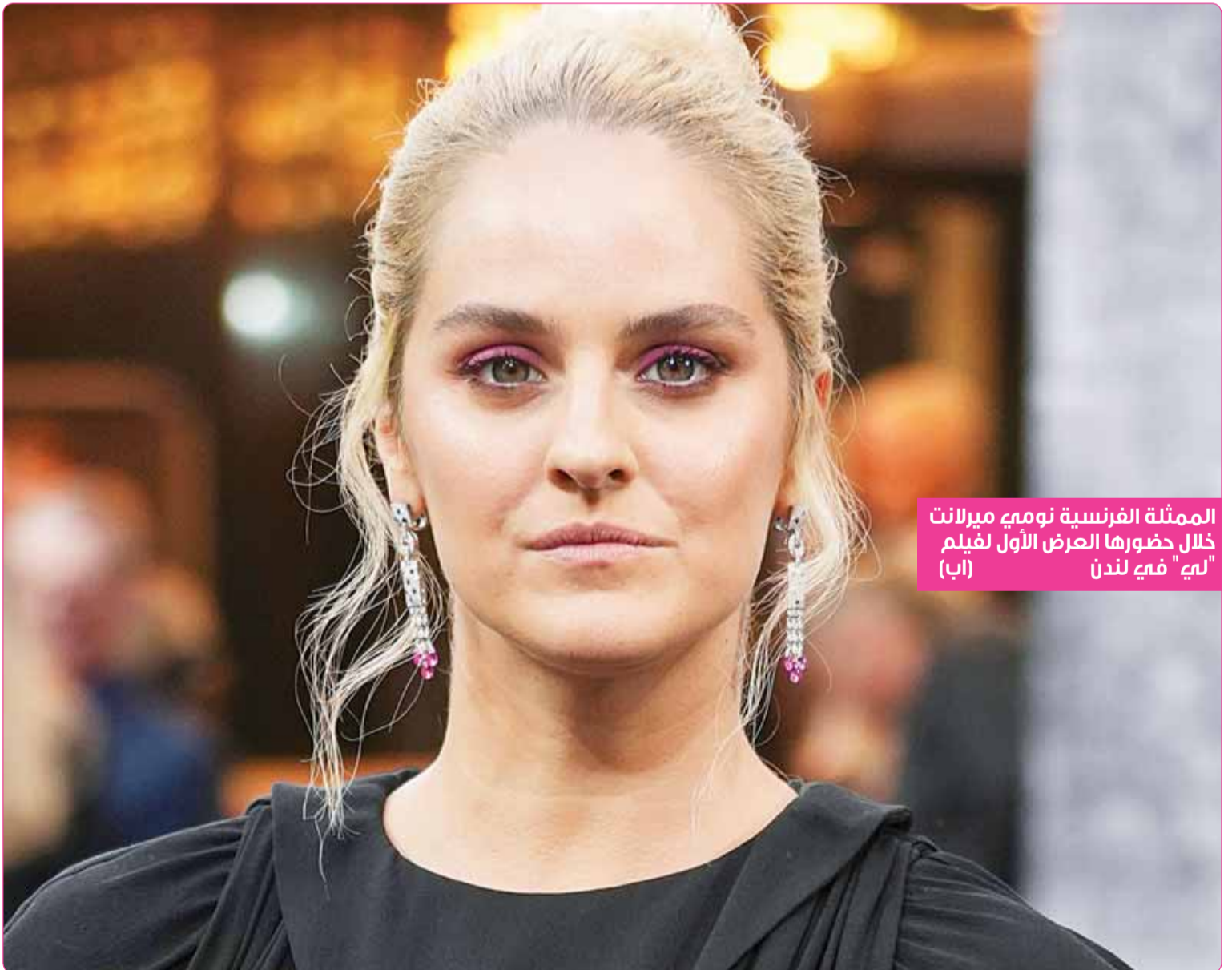
الممثلة الفرنسية نومي ميرالانت خلال حضورها العرض الأول لفيلم "ليه" في لندن

ويعد تداول الخبر بشكل واسع، سخر رواد مواقع التواصل الاجتماعي من تصريحاته، عبر نشر العديد من التعليقات والصور الطريفة.