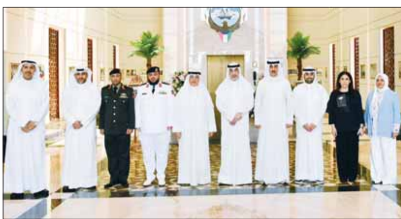
الشيخ فهد اليوسف مع أركان السفارة الكويتية فيم "أبو ظبي"

سبل تعزيز التعاون الثنائي في شتى المجالات وبما يقدم مصالح الشعبين ويسهم في دفع مسيرة العمل الخليجي المشترك. وبينت انهما تطرقا إلى مجمل المستجدات على السامتين الإقليمية والدولية والتحديات التي تشهدها المنطقة والعالم ومخططات دفع العمل الخليجي المشترك قديما من أجل ضمان الأمن والاستقرار الإقليمي. وأشارت إلى تأكيد الجانبين أهمية زيادة تبادل الخبرات والأفكار والتجارب الناجمة بما يقدم تضافر الجهود من أجل تعزيز مسيرة التنمية الشاملة والمستدامة على المستويين الثنائي والخليجي.