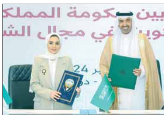
د.الحوية وهوير الموارد البشرية السعودي خلال مراسم توقيع المذكرة