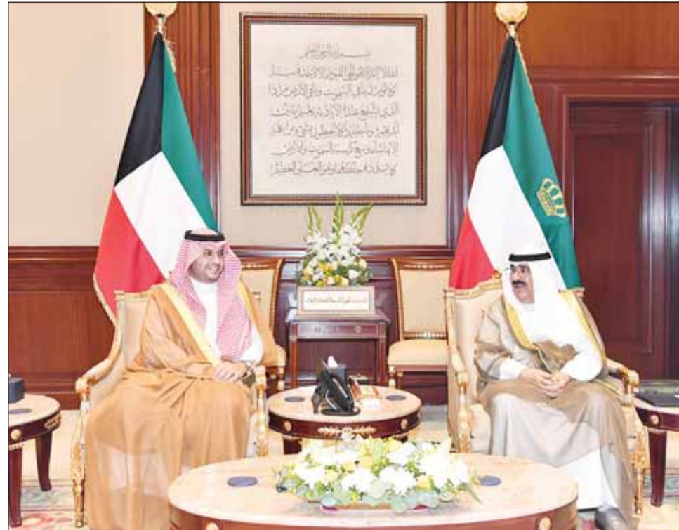
سمو أمير البلاد الشيخ مشعل الأحمد مستقبلاً وزير الدولة السعودي الأمير تركي بن محمد