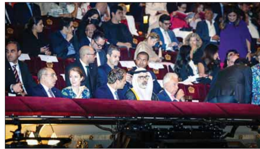
الشيخ جراح الجابر وكبار الشخصيات والمسؤولين في المملكة المتحدة وأعضاء السلك الدبلوماسي خلال الحفل

الحفل المميز التي كانت عنصراً أساسياً في إنجاحه. وفي سياق متصل، أكد نائب وزير الخارجية على عمق العلاقات التاريخية وتجديدها بين البلدين الصديقين، مضيفاً في هذه المناسبة: إن الاتفاقية (الانجلو - كويتية) التي وقّع عليها في عام 1899 تعد نقطة انطلاقاً للعلاقات الدبلوماسية بين الكويت والمملكة المتحدة وتدشينها بشكل رسمي. وأضاف، إيماناً من قيادتي البلدين بأهمية إبراز تطور العلاقة الكويتية البريطانية مع مرور قرن وربع عليها وصولاً للشراكة الوثيقة التي تجمعهما اليوم فقد قرر إطلاق مسمى "عام الشراكة الكويتية - البريطانية" على عام 2024 الذي يصادف ذكرى مرور 125 عاماً على توقيع الاتفاقية الانجلو كويتية، بموجب الاتفاقية الموقعة في 29 أغسطس 2023 على هامش زيارة سمو أمير البلاد الشيخ مشعل الأحمد إلى المملكة المتحدة حينما كان سموه ولياً للعهد.