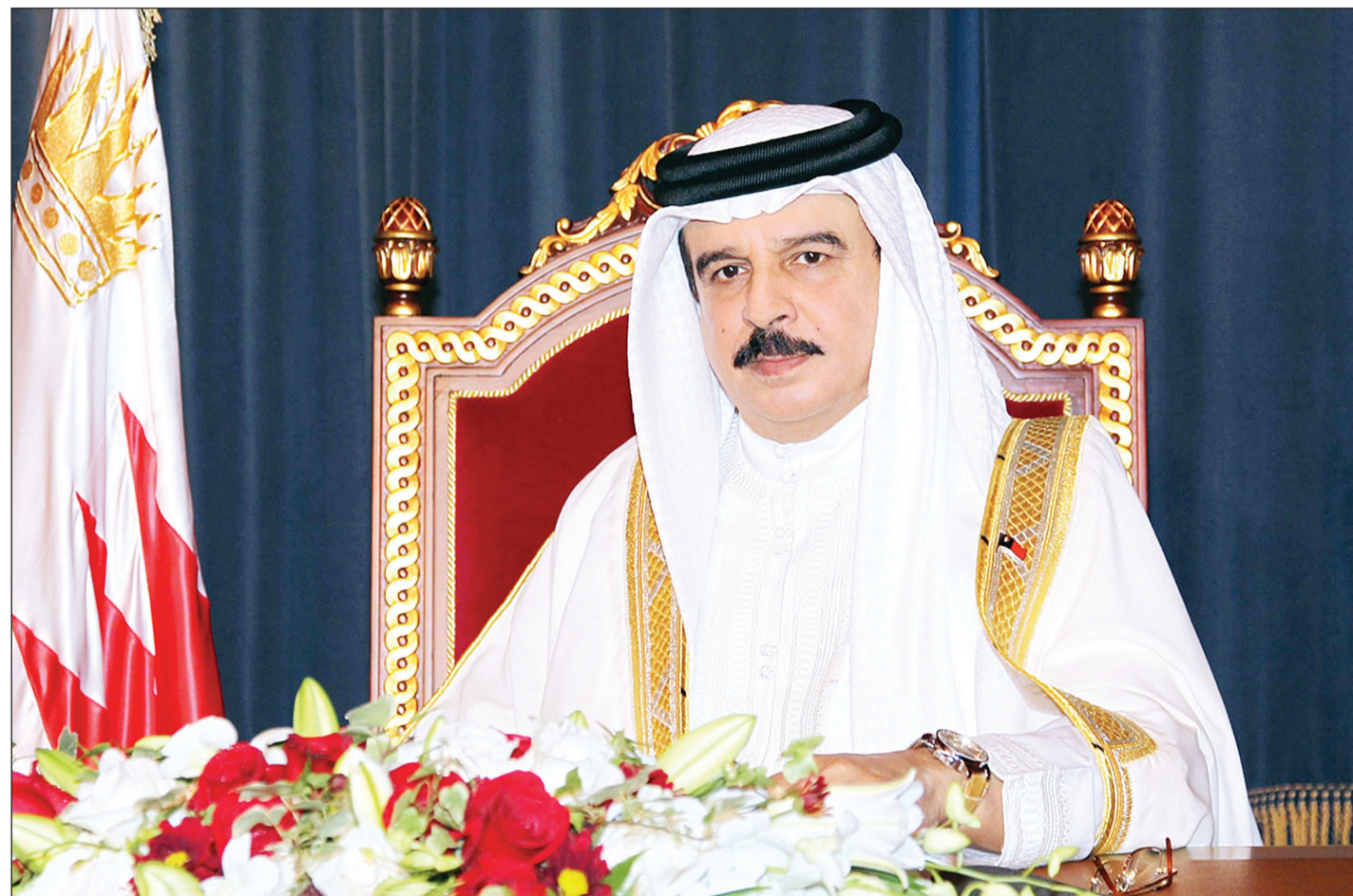
الملك حمد بن عيسى آل خليفة

حظي المرسوم الملكي السامي الذي أصدره ملك مملكة البحرين حمد بن عيسى آل خليفة بالعفو عن 457 محكوما بالتزامن مع الاحتفال باليوبيل الفضي لتولي جلالتهم مقاليد الحكم بإشادات واسعة واهتمام كبير في الأوساط المختلفة. وذكر حقوقيون ونشطاء وفعاليات مختلفة في استطلاع أجرته "السياسة" أن خطوة ملك مملكة البحرين إيجابية وتأتي تكريسا لما يقوم به جلالتهم من إرساء دعائم التسامح والتعايش الإيجابي، مشيرين إلى أن مراسيم العفو التي يصدرها جلالتهم بين الفينة والأخرى لاسيما العفو عن سجناء الرأي برهان على أن مملكة البحرين تسير وفق روى حقوقية مدنية وسياسية وتشهد إصلاحات وإنجازات على مختلف الأصعدة ومن أبرزها الإصلاحات الديمقراطية والاجتماعية والسياسية، وفيما يلي التفاصيل: