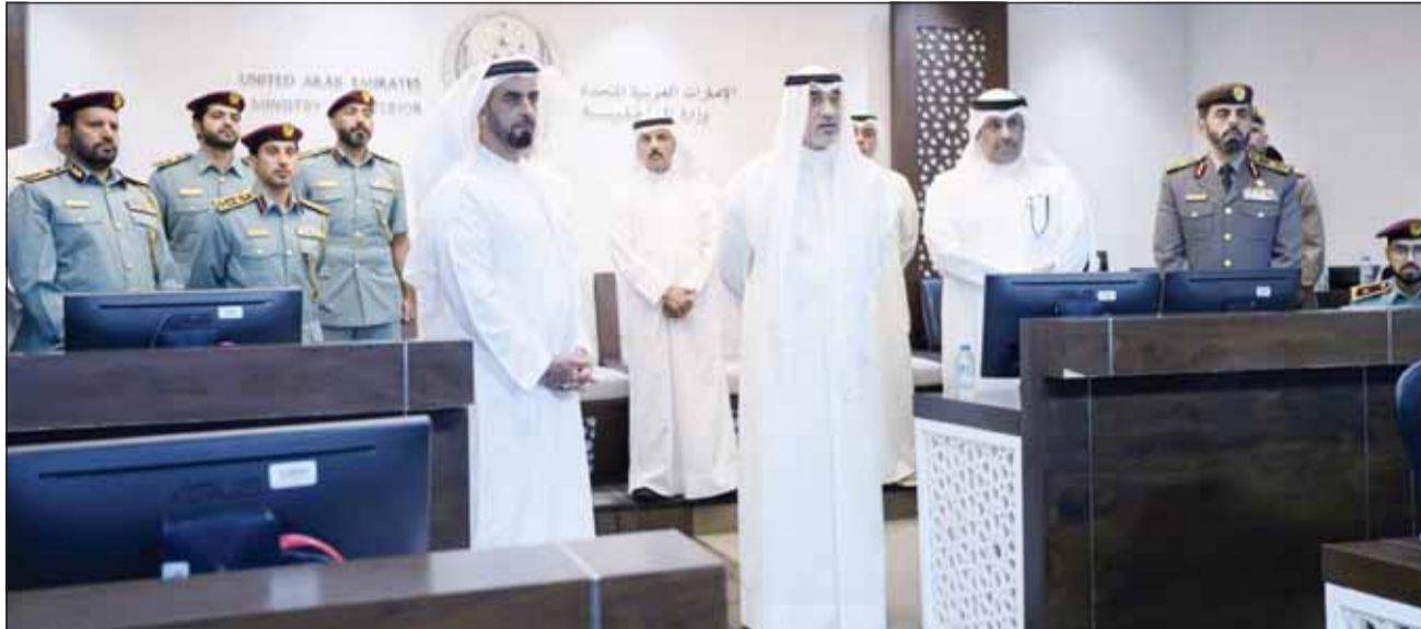
الشيخ فهد اليوسف خلال جولة في مقر وزارة الداخلية الإماراتية بـ "أبوظبي"

النائب الأول: دوام التقدم والرفعة للإمارات والمزيد من التطور والنماء للعلاقات الأخوية