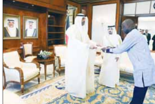
البحيا يتسلم نسخة أوراق اعتماد سفير بوركينا فاسو حسن تامبورا

وقالت (الخارجية) في بيان لها إن الوزير اليحيا تمنى للسفير الجديد التوفيق في مهام عمله وللعلاقات الثنائية الوثيقة التي تجمع البلدين الصديقين المزيد من التقدم والازدهار.