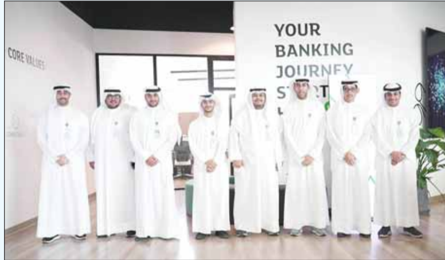
لقطة جماعية لمتدربي PR Academy

استعرض بنك "تم" أول بنك رقمي متوافق مع أحكام الشريعة في الكويت، خدماته والحلول الفريدة التي يقدمها لملائته بشكل عام وللشريحة الشباب بشكل خاص بما يعزز من تجربتهم المصرفية ويبلج تطلعاتهم وطموحاتهم. جاء ذلك خلال ورشة عمل قدمها فريق "تم" لمتدربي برنامج "PR Academy" الذي يقدمه بيت التمويل الكويتي "بيتك" لطلبة المرحلة الجامعية ومدربي العتريز للتعريف على أساسيات ودور مهام أقسام العلاقات العامة والإعلام في "بيتك". وتطرق فريق "تم" إلى مرحلة الأعداد لإطلاق بنك "تم" الرقمي واختيار الاسم، وتصميم الهوية التي تتماشى مع الشباب وتطلعاتهم، إلى الخدمات والحلول التي يقدمها للعملاء، والتفاعل الاجتماعي الذي يتبعه تطبيق البنك، وطريقة فتح الحساب والاستمتاع بعالم من الخدمات المصرفية والمميزات الفريدة في تطبيق واحد عبر الهواتف بل باستخدام التكنولوجيا الحديثة وتطورات الرقمنة. وتم خلال الورشة كذلك استعراض أهمية التحول الرقمي والبنية التحتية المتطورة مع التركيز على شريحة الشباب عبر باقة من الخدمات والحلول والعروض المصرفية. ويوفر بنك "تم" دعماً لأمحدود لفئة الشباب على مختلف الأصعدة، فعلى مستوى الخدمات المصرفية الرقمية يتمتع العملاء ببرنامج نقاط ومكافآت يمكنهم من استبدال نقاطهم إلى مشتريات من أشهر الماركات، كما يوفر "تم" عروضاً حصريّة للعملاء أسبوعياً من مختلف المطاعم والمقاهي الكويتية. ويستطيع كل عميل الاستفادة من جميع مزاي