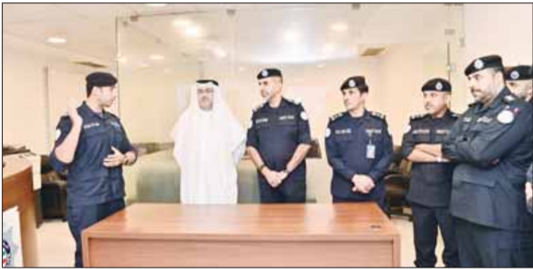
الشيخ عبدالله العلي خلال تفقده مديرية أمن العاصمة

والإجراءات الأمنية والمرورية، وانتشار رجال الأمن في مناطق المحافظة لتوفير الأمن والأمان للمواطنين والمقيمين، لافتا إلى أهمية مواكبة التطور التكنولوجي ورفع مستوى الخدمات، بهدف تحقيق سرعة الإنجاز ومواكبة أحدث التطورات. وأعرب المحافظ العلي عن تقديره للجهود المبذولة من رجال الأمن في مهامهم وواجباتهم، داعيا إياهم إلى مزيد من الانضباط واليقظة في متابعة الحالة الأمنية في جميع مناطق المحافظة.