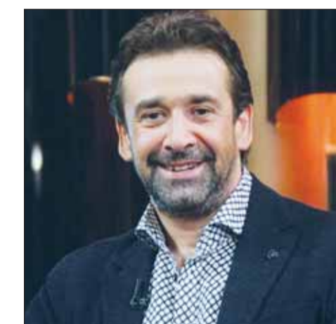
كريم عبد العزيز

وحملت الدورة الرابعة اسم النجم الفنان ماجد الكدواني. ومن المقرر أن يضم المهرجان هذا العام 7 عروض مسرحية، تتنافس على جوائز الدورة الخامسة، وتقام العروض على مسرح قصر ثقافة الأنفوشي، على أن يقيم حفلاً افتتاحياً وقام المهرجان في دار الأوبرا المصرية، أوبرا سيد درويش ويقام على هامش المهرجان عدد من الورش الفنية المميزة.