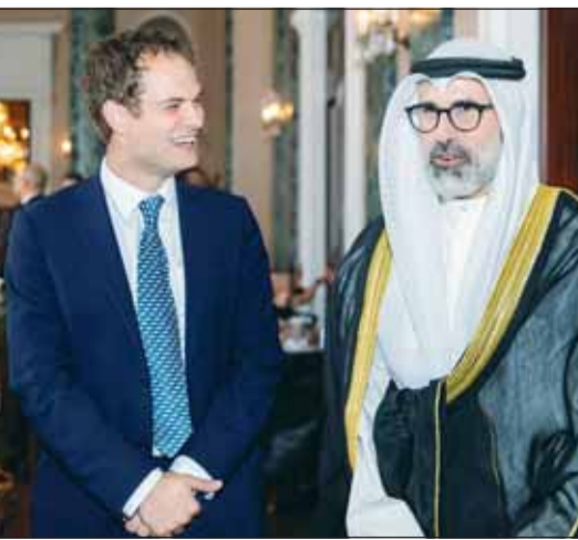
الشيخ جراح الجابر خلال حضوره حفل الكويت الموسيقي