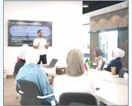
استعراض خدمات وحلول بنك تم الرقمي