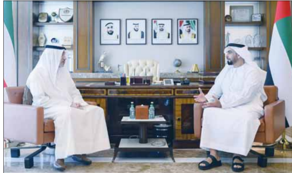
النائب الأول الوزير فهد اليوسف مع وزير الداخلية الإماراتية الفريق الشيخ سيف بن زايد

زيد في مقر وزارة الداخلية الإماراتية بأبوظبي أول من أمس، حيث تناول البحث أيضاً عدداً من الموضوعات ذات الاهتمام المشترك.