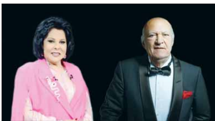
عمر خيرت واسعاد يونس

يحيي الموسيقار الكبير عمر خيرت يوم 19 سبتمبر الجاري، آخر حفلاته الخاصة في صيف 2024، وهو الحفل الأسطوري الجديد الذي يختتم به موسم الحفلات الصيفية، بمدينة الشيخ زايد، حيث من المقرر أن يقدم الموسيقار الكبير عمر خيرت أشهر مقطوعاته التي تعد من العلامات البارزة في الموسيقى، ومنها "العاصفة"، خلي بالك من عقلك، وجه القمر، حبيبة، هويد الليل، مسألة مبدأ 2، تيمة حب، زي الهوا، الداعية، الخواجة عبد القادر، خايف من بكره ليه، الربيع، صابر يا عم صابر، مافيا، عارفة، البخيل وانا، 100 سنة سينما، قضية عم أحمد، فيها حاجة حلوة، وغيرها من المقطوعات المتميزة.