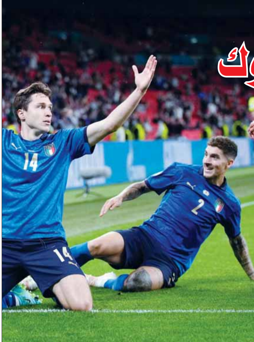
الأزوري يطمح للفوز اليوم

في الجولة الثانية بالمجموعة الأولى في كأس أمم أوروبا (يورو 2024) في ألمانيا، وحقق أصحاب الأرض الفوز 2-0. وأكد المدير الفني للمنتخب الألماني، يولييان ناغلسمان، أن مارك أندريه تير شتيغن سيكون الحارس الأساسي للفريق في المرحلة المقبلة.