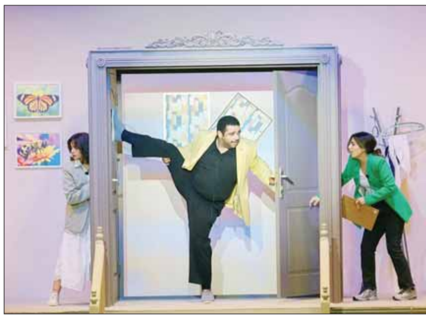
خالد المظفر في مسرحية "الأول من نوعه"