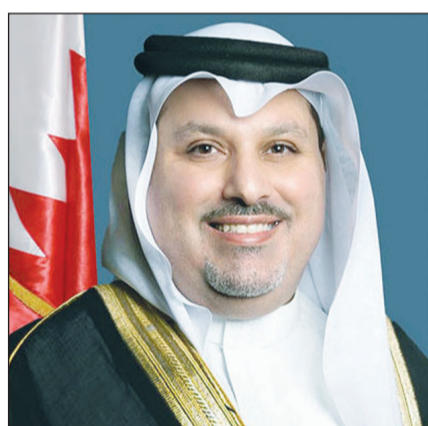
السفير صلاح المالكي

قال سفير مملكة البحرين لدى البلاد صلاح المالكي إن المرسوم الملكي السامي الصادر عن صاحب الجلالة الملك حمد بن عيسى آل خليفة، ملك البلاد المعظم، القائد الأعلى للقوات المسلحة، حفظه الله ورعاه، القاضي بالعفو الشامل عن (457) محكوما، جاء ليؤكد على رسوخ وديمومة النهج الإصلاحي الذي يتميز به العهد الزاهر لجلالة ملك مملكة البحرين المعظم والذي يتزامن مع مناسبات الاحتفالات باليوبيل الفضي لتولي جلالتهم مقاليد الحكم، وهو دليل على الحرص الكريم من لدن جلالتهم على تماسك وصلابة المجتمع البحريني وحمالية نسيجه الاجتماعي ويؤكد على الإنسانية الكبيرة التي يتصف بها جلالتهم تجاه شعبه الذين يبذلونه المحبة والمودة والوفاء حتى أضحت المملكة واحة للتسامح والتعايش ومثالا يشار إليه بين الدول والشعوب قاطبة.