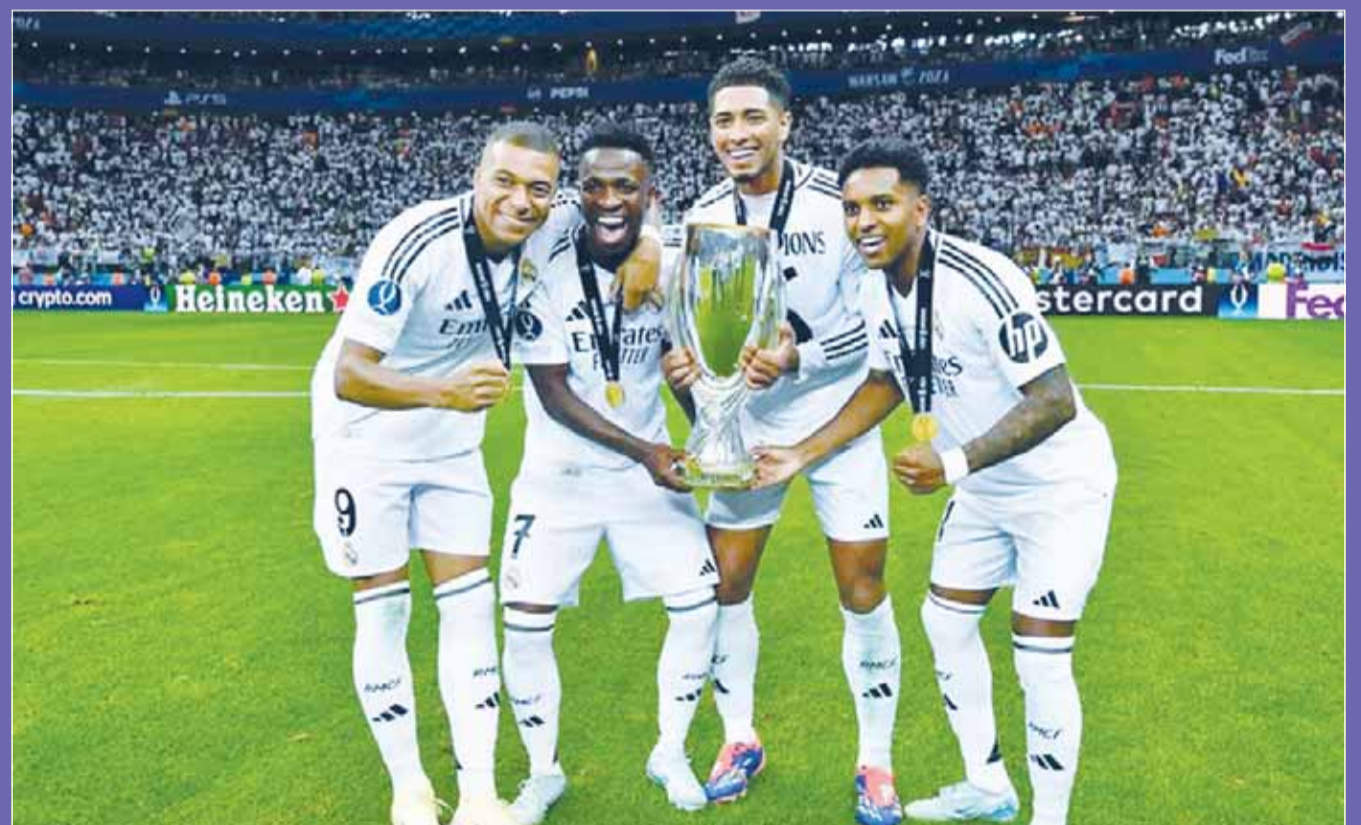
مبابي، بيلنغهام وفينيسيوس ضمن المرشحين للجائزة

كشفت مجلة فرانس فوتبول الفرنسية عن قائمة المرشحين للفوز بجائزة الكرة الذهبية لأفضل لاعب كرة قدم في العالم للعام الجاري 2024 والتي ضمت 7 من لاعبي ريال مدريد يتقدمهم الوافد الجديد كيليان مبابي. وتضم قائمة المرشحين 30 لاعبا، يتصدرهم 7 نجوم من فريق ريال مدريد الإسباني الفائز بثلاثية الدوري والسوبر المحلي ودوري أبطال أوروبا في الموسم الماضي، وهم جود بيلنغهام وفيدريكو كالفيريدي وتوني كروس الذي اعتزل كرة القدم بنهاية مشواره مع منتخب ألمانيا في يورو 2024 وفينيسيوس جونيور وداني كارافخال وأنطونيو روديجير، وكيليان مبابي المنضم من باريس سان جيرمان هذا الصيف.