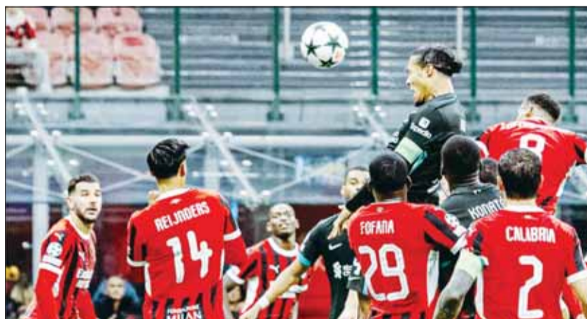
ميلان يطمح للصحة بعد خسارته خارجيا ودخليا

أرضه وبين جماهيره في سان سيرو أمام ليفربول، بنتيجة 3-1. وبدأ واضحا للجميع أن فريق ميلان يعاني من عدة مشاكل داخلية، وأنه غير متماسك وضعيف ذهنيا بعد الأزمات التي عصفت به مؤخرا. فرغم القيادة الجديدة لفونسيتا، إلا أن أبرز لاعبي ميلان رافائيل لياو وثيو هيرنانديز، ظهرا غير متعاونين مع مدريهم، بعد الأزمة التي ضربت الفريق خلال مواجهته لاتسيو. وبعد الخسارة أمام ليفربول، خرجت تقارير صحافية لتؤكد أن لاعبي ميلان استسلموا بدون "شرف الحرب"، وهو بيان على أن الفريق مرتكب وغير ثابت على الأرض. وانهالت الصحف الإيطالية بالهجوم على اللاعبين، وقالت الفريق ظهر بدون قائد، وأن ميلان يمتلك العديد من اللاعبين الجيدين لكن لا أحد قادر على جر الفريق بلحظات الصعبة. كما شنت هجوما على أبرز اللاعبين مثل لياو الذي غادر أول لاعب من أرض الملعب، إلى جانب الثنائي ثيو وماينان، واللذين يطالبان رواتب عالية كبيرة.