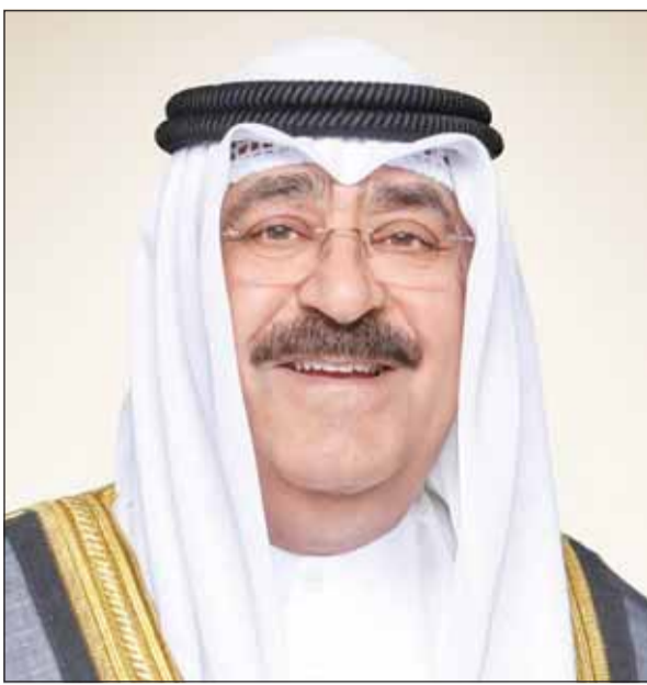
سمو أمير البلاد الشيخ مشعل الأحمد

مالطا الصديقة، عبر فيها سموه عن خالص تهنئته بمناسبة العيد الوطني لبلادها، متمنياً سموه لها موفور الصحة والعافية ولجمهورية مالطا وشعبها الصديق كل التقدم والازدهار. ويعت سموه ببرقية تهنئة إلى السيدة فرويلا تسالام حاكم عام بليز الصديقة، عبر فيها سموه عن خالص تهنئته بمناسبة العيد الوطني لبلادها، متمنياً سموه لها موفور الصحة والعافية ولبلليز وشعبها الصديق كل التقدم والازدهار.