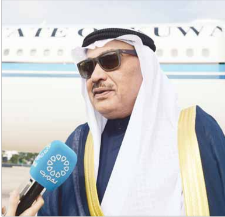
ممثل سمو الأمير سمو ولي العهد الشيخ صباح الخالد يدلّه بتصريحه

وكشف سموه عن خطة قمة المستقبل والتي دعا إليها الأمين العام للأمم المتحدة أنطونيو غوتيريش في بحث السبل الكفيلة بوضع الأسس والمعايير لعمل عالمي أكثر فاعلية لمواجهة التحديات المالية والاستعداد للتحديات المستقبلية، مضيفاً سموه أن قمة المستقبل ستكون فرصة لتجديد الالتزام للدول الأعضاء في مقاصد ومبادئ ميثاق