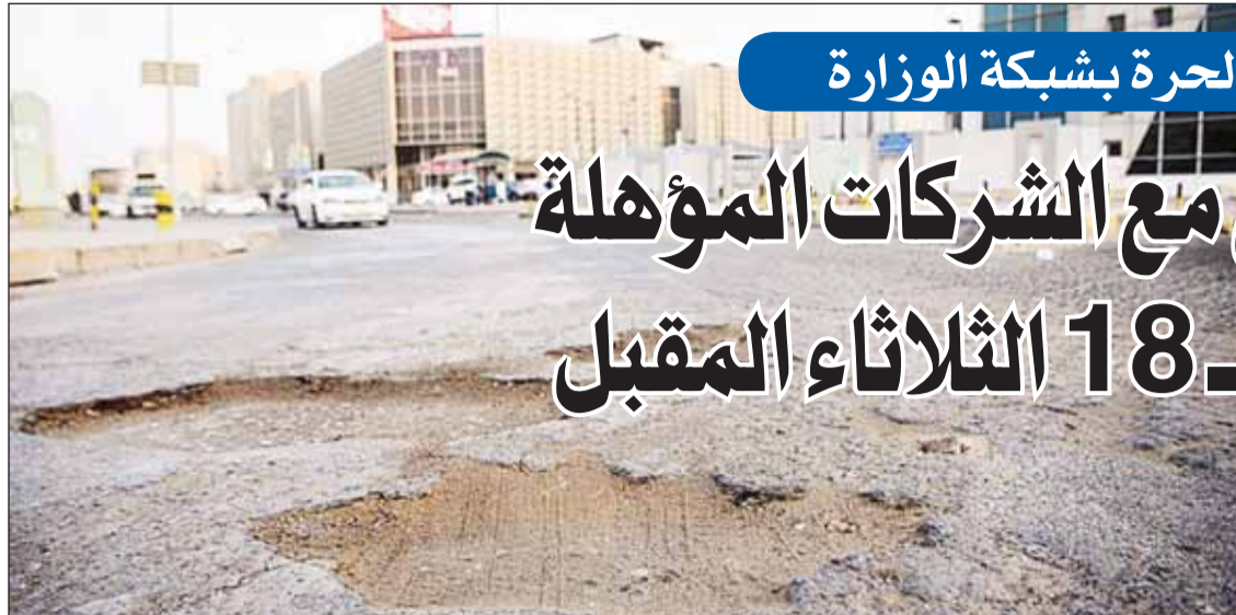
الطرق تنتظر الإصلاح

وافق الجهاز المركزي للمناقصات العامة في اجتماعه الخميس الماضي على طلب وزارة الأشغال العامة تحديد موعد جلسة التفاوض مع اصحاب العطاءات المقبولة لـ 18 ممارسة اصلاح الطرق على أن يكون الموعد الثلاثاء 24 الجاري.