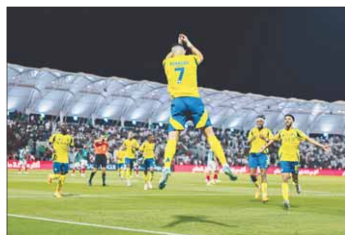
رونالدو يحتفل علم طريقته الخاصة

كشفت وسائل إعلام بريطانية عن سر الاعتفالية التي قام بها النجم كريستيانو رونالدو عقب إرازه هدفاً جديداً في مسيرته.