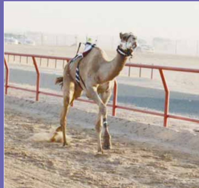
مكلف فاز في الشوط الرئيسي