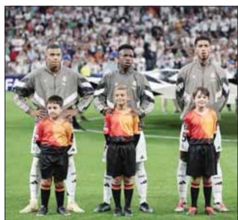
نجوم الريال متساوون

حصل ثنائي ريال مدريد جود بلينغهام وفينيسيوس جونيور على زيادة في راتبهما السنوي ليتساويا مع زميلهما الفرنسي كيليان مبابي، وذلك لمنع وجود أي توتر في الفريق، وفقا لتقارير في إسبانيا. ووصل قائد منتخب فرنسا كلاعب حر بعد رحيله عن باريس سان جيرمان، وتم منحه 15 مليون يورو كراتب سنوي، ما يجعله صاحب أعلى أجر في النادي متقدما على بلينغهام وفينيسيوس. وعلى الرغم من حصوله على مكافأة كبيرة تضاف إلى دخله السنوي، فإن الراتب الذي يتقاضاه مبابي يظل هو الحد الأقصى لريال مدريد، حيث حصل كريستيانو رونالدو وغاريث بيل ولين هازارد سابقا على نفس المبلغ. لكن قبل انضمام المهاجم، كان بلينغهام وفينيسيوس على قمة سلم الأجر في مدريد، حيث كان الثنائي يتقاضى 10 ملايين يورو في الموسم الواحد. ومع ذلك، زعمت صحيفة "أو كيه دياريو" أن الفارق في الراتب البالغ 5 ملايين يورو لصالح مبابي، ربما جعل إدارة ريال مدريد تشعر بعدم الارتياح والتخوف، وهو ما دفع النادي إلى اتخاذ إجراء زيادة الثنائي الإنكليزي والبرازيلي. وقرر فلورنتينو بيريز، رئيس ريال مدريد، جعل رواتب اللاعبين الثلاثة متساوية، بحسب ما ذكرته الصحيفة، وذلك لتجنب أي خلافات محتملة بينهم.