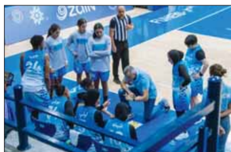
مدرب الفتاة يوجه اللاعبين

بخوض نادي الفتاة الكويتي مواجهة قوية اليوم أمام نادي شباب الفحيص الأردني في نصف نهائي بطولة الأندية العربية للسيدات لكرة السلة، التي تستضيفها الأردن. تأتي هذه المباراة ضمن منافسات الدور نصف النهائي، في ظل أداء متميز للفريق المتأهلة.