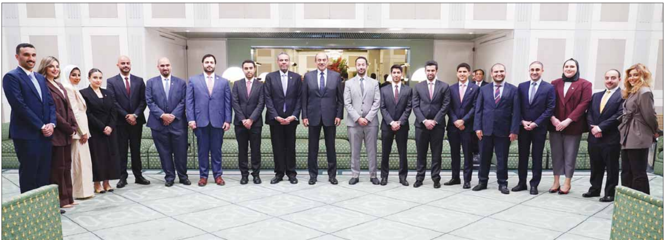
ممثل سمو أمير البلاد سمو ولي العهد لدى استقباله أعضاء وفدي الكويت "الدائم والمساند" في الأمم المتحدة

حضر اللقاء مدير عام هيئة تشجيع الاستثمار المباشر الشيخ الدكتور مشعل الجابر وسفيرة دولة الكويت لدى الولايات المتحدة الأميركية الشيفخة الزين الصباح والمندوب الدائم لدولة الكويت لدى الأمم المتحدة السفير طارق البناي.