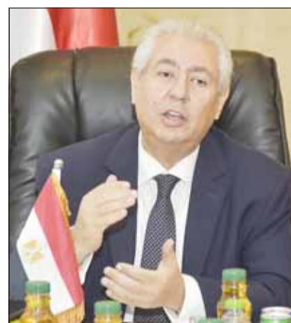
السفير أسامة شلتوت يتحدث خلال المؤتمر

الموهلة والمدرية على المستوى المطلوب، حيث أبدى الجانب الكويتي اهتمامه بالتعرف على تجارب التعاون الناجمة بين مصر والدول الأخرى مثل ألمانيا في مجال العمالة، وبارتفاق اللجنة التجارية المشتركة بين البلدين في هذا الشأن.