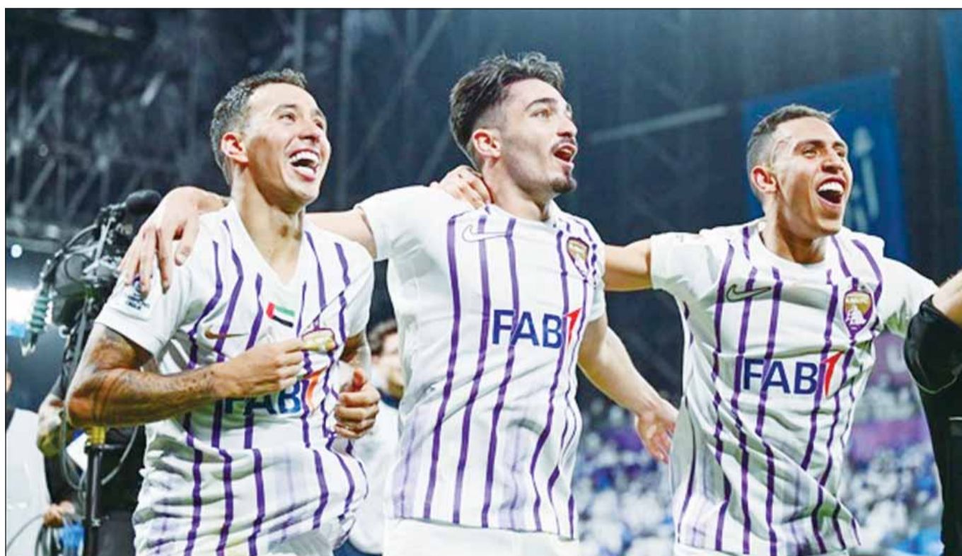
العين يفتتح بطولة القارات بمواجهة أوكلاند سيتي

الدعوة في 18 ديسمبر المقبل فستجمع فريق (ريال مدريد) بطل أوروبا مع الفريق الذي سيتأهل من خلال المباريات السابقة التي ستعقد في الفرق المذكورة أعلاه مع كل من بطل أمريكا الجنوبية وبطل أمريكا الوسطى والكاريبي.