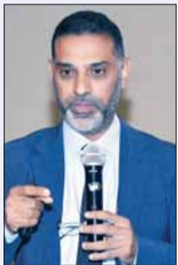
د. علي القطان

استهلت الورشة بكلمة رئيس وحدة أمراض كبار السن في وزارة الصحة الدكتور علي القطان الذي تناول خلالها أحدث المستجدات الطبية والعلمية حول مرض الزهايمر من أعراض أولية وأنواع الأدوية المختلفة التي تساعد في