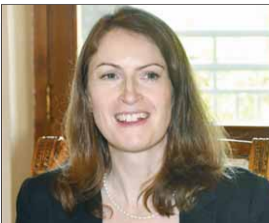
السفيرة البريطانية بليندا لويس

الكويتيون ينخرطون في مجموعة واسعة من الدورات والأمن السيبراني وعلوم الكمبيوتر الأكثر شعبية المجموعة الفرعية للدفاع ناقشت التحديات الأمنية وإنشاء آليات شراء أكثر كفاءة بين البلدين