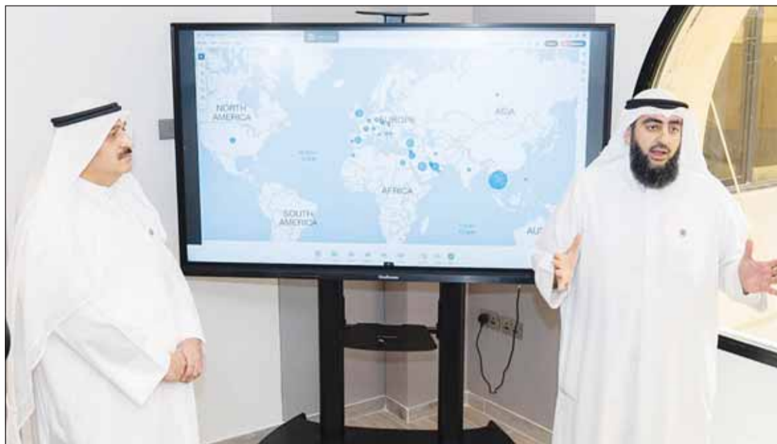
وزير الصحة د. أحمد العوضي يستمع إلى شرح عن المكاتب الصحية الافتراضية للعلاج بالخارج

وأوضح أنه تم التعاون مع سفارات دولة الكويت والبعثات الدائمة لدى المنظمات الدولية لضمان نجاح هذه المبادرة، موضحاً أن المرحلة التجريبية التي انطلقت مطلع العام أسفرت عن تطبيق