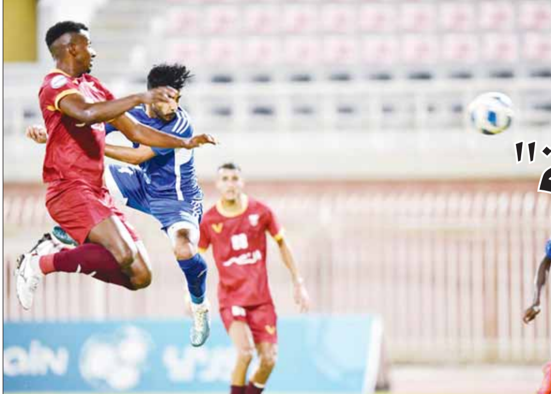
التضامن هزم النصر في "ديربي الفروانية"

في سياق متصل، ذكرت مصادر أن "موقف إدارة العربي من عقد سلطان قانوني. وفي حال غياب اللاعبين فإنهما سيعرضان نفسيهما إلى الإيقاف عن اللعب والخضوع من مستحقتهن المالية".