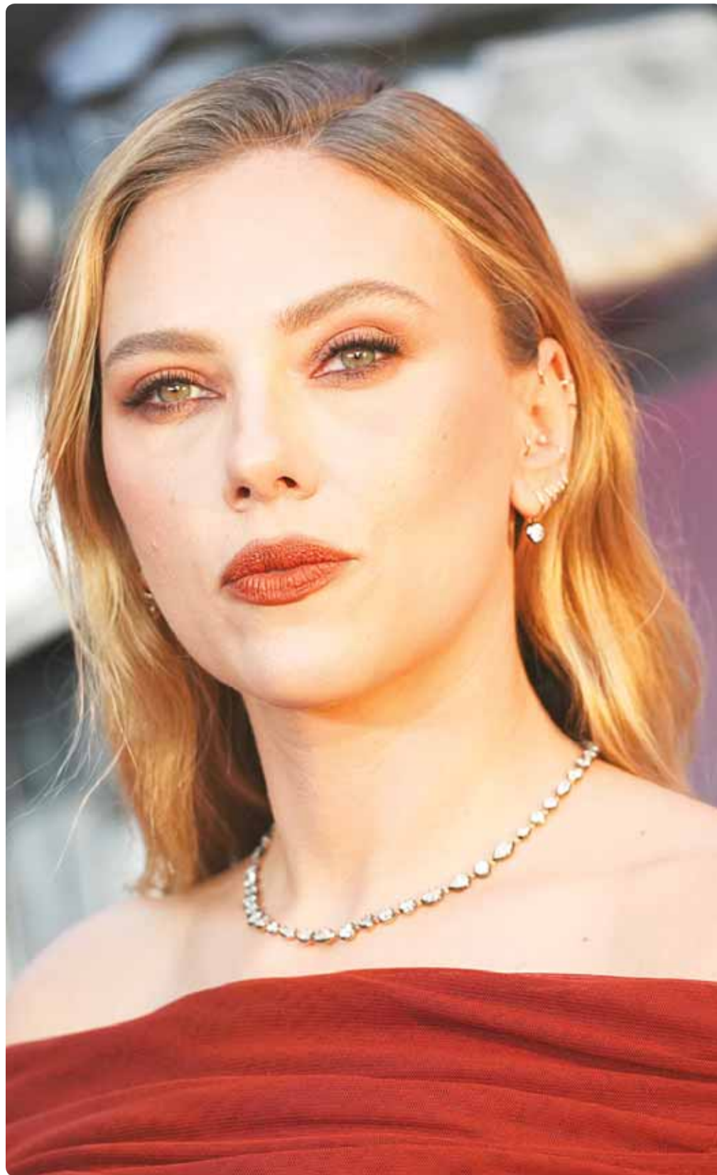
الممثلة الأميركية سكارليت جوهانسون لدى وصولها لحضور العرض الأول لفيلم "Transformers One" في لندن

عكس ما كان عليه مجتمعنا في السابق، حين كان السروق "ما يصب له الفخال"، فكان المراء يخاف الخالق، ثم يخاف الخلق، ويبدري اسمه واسم عائلته. الموسف حقاً أننا تغيرنا، فتغيرت أخلاق الناس، ولم يعد أمد يراعي ذمته، فالمهم أن كم يكون رصيده في البنك، فهو سوف يحترم على هذا الأساس... زين.