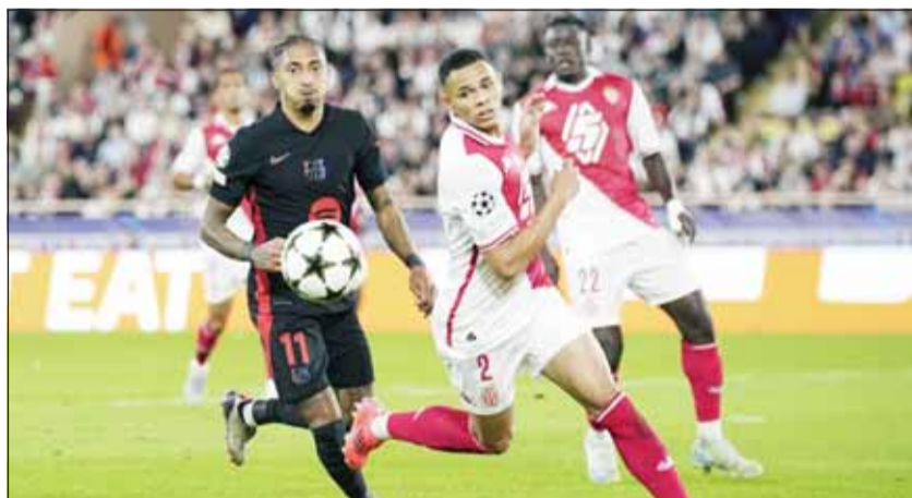
البرشا سقط أمام مونكو في "الأبطال"

جميع الدقائق، وهم، تير شتيجن، وكوندي، وإينجيو مارتينيز، ورافينيا. وأكدت الصحيفة الإسبانية أن فليك أمام فياريال في الجولة السادسة من الليغا سيعتمد على نفس التشكيل التي لعب بها في أوروبا. وذكرت أن فليك سيدأ إيريك جارسيا مرة أخرى في مركز الارتكاز لأن بيدري سيبقي في مركز الوسط المتقدم، بينما فيران توريس ليس لديه فرصة للعب لأنه موقوف. وقالت الصحيفة إن فليك قد يفاجئ الجميع باستخدام بابلو توري أو باو فيكتور، لكن هذا أمر غير متعمل، حيث إن الأول لعب 14 دقيقة والثاني 27 فقط هذا الموسم. وكان لابورتا رئيس برشلونة وديكو المدير الرياضي، اجتمعوا مع فليك مدير البارشا، عقب الخسارة أمام مونكو بدوري الأبطال. ووفقا لصحيفة "موندو ديبورتيفو" الإسبانية، فإن الثقة في مشروع فليك وفي عمل غرفة الملابس ما تزال في أعلى مستوياتها داخل برشلونة، رغم الهزيمة التي تعرض لها الفريق في مونكو (1-2).