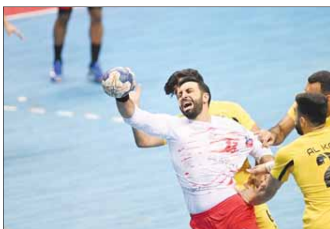
دخام الكرخ يوقف صيوان