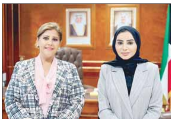
الوزيرة د. أمثال الحويلة والشيخة جواهر الصباح

بحثت وزيرة الشؤون الاجتماعية وشؤون الأسرة والطفولة د. أمثال الحويلة مع مساعد وزير الخارجية لشؤون حقوق الإنسان جواهر الصباح متابعة تنفيذ التوصيات المرتبطة بالأشخاص ذوي الإعاقة لتنفيذ لقرار مجلس الوزراء الخاص بتوصيات لجنة الأمم المتحدة المعنية. ونكرت "الشؤون" في بيان صحفي أمس. إن اللقاء بين الجانبين تطرق إلى تنسيق الجهود بين جهات الدولة المختلفة - بحسب الاختصاصات - نحو متابعة تنفيذ الجهات ذات الصلة لجميع التوصيات الخاصة بالأشخاص ذوي الإعاقة للعمل على تقديم أفضل الخدمات وأوجه الرعاية المتكاملة لهذا المكون الأساسي من المجتمع الكويتي لتمكينهم وتيسير دمهم بالمجتمع ومشاركتهم بجهود التنمية المستدامة بشكل فاعل.