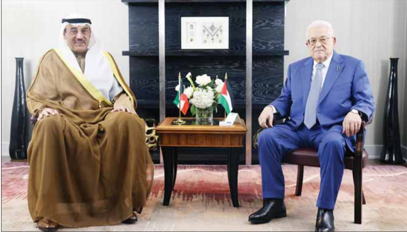
ممثل سمو الأمير سمو ولي العهد الشيخ صباح الخالد لادم لقاؤه الرئيس الفلسطيني محمود عباس

الاثنين 20 ربيع الأول 1446 هـ - الموافق 23 سبتمبر (أيلول) 2024م (السنة 55) العدد (19668)