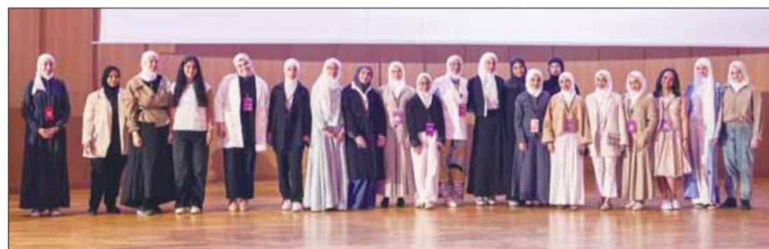
صورة جماعية للخريجات