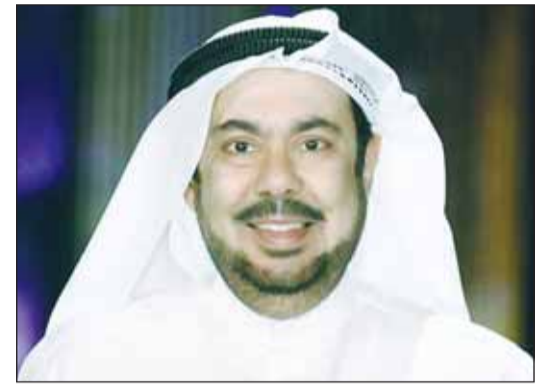
عبد العزيز المسلم

الشقيقين، حيث يشارك في هذه الليلة كوكبة كبيرة من نجوم الفن والإعلام بينهم الفنان عبد العزيز المسلم، طارق العلي، عبد المحسن النمر، وإهام الفضالة، كما ستكون هناك العديد من المداخلات للفنان السعودي علي السبع والفنانة حياة الفهد والفنانة سعاد عبدالله، تركي اليوسف، الدكتور حبيب غلوم، لطيفة المجرن، أميرة محمد، عبد الرحمن العقل، وغيرهم، وهو ما يعكس التقدير الكبير للأشياء في المملكة العربية السعودية، حيث يحاول الجميع مشاركة الأشياء في هذا اليوم الذي يفتخر فيه الجميع بتاريخ وإمجاد المملكة تحت قيادة خادم الحرمين الشريفين وسمو ولي العهد الأمير محمد بن سلمان.