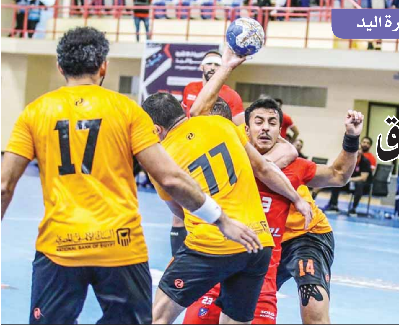
العميد بمواجهة البنك الأهلي بالنسخة الماضية