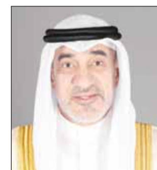
النائب الأول الشيخ فهد الجوسف

بعث النائب الأول لرئيس مجلس الوزراء ووزير الدفاع ووزير الداخلية الشيخ فهد الجوسف ببرقية تهنئة إلى صاحب السمو الملكي الأمير عبدالعزيز بن سعود بن نايف بن عبدالعزيز وزير الداخلية بالمملكة العربية السعودية الشقيقة وذلك بمناسبة ذكرى اليوم الوطني. وأعرب الجوسف في برقيته عن خالص تهنائه بهذه المناسبة العزيزة، وتمنياته الصادقة للمملكة العربية السعودية الشقيقة قيادة وحكومة وشعباً بمواصلة التقدم والنماء والازدهار في ظل القيادة الحكيمة لمقام خادم الحرمين الشريفين الملك سلمان بن عبدالعزيز آل سعود، وصاحب السمو الملكي الأمير محمد بن سلمان بن عبدالعزيز آل سعود ولي العهد رئيس مجلس الوزراء.