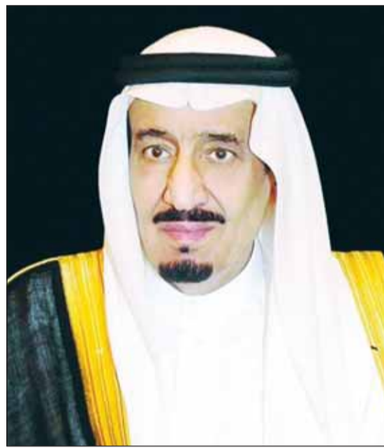
خادم الحرمين الشريفين الملك سلمان بن عبدالعزيز

العلاقات الكويتية - السعودية عميقة ووطيدة وتاريخية على كل الأصعدة