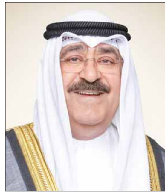
سمو أمير البلاد الشيخ مشعل الأحمد

وبعث سمو الأمير الشيخ مشعل الأحمد ببرقية تهنئة إلى العقيد أسيمي غويتا الرئيس الانتقالي لجمهورية مالي الصديقة عبر فيها عن خالص تهنائه بمناسبة العيد الوطني لبلاده، متمنياً له موفور الصحة والعافية ولجمهورية مالي وشعبها الصديق كل التقدم والازدهار.