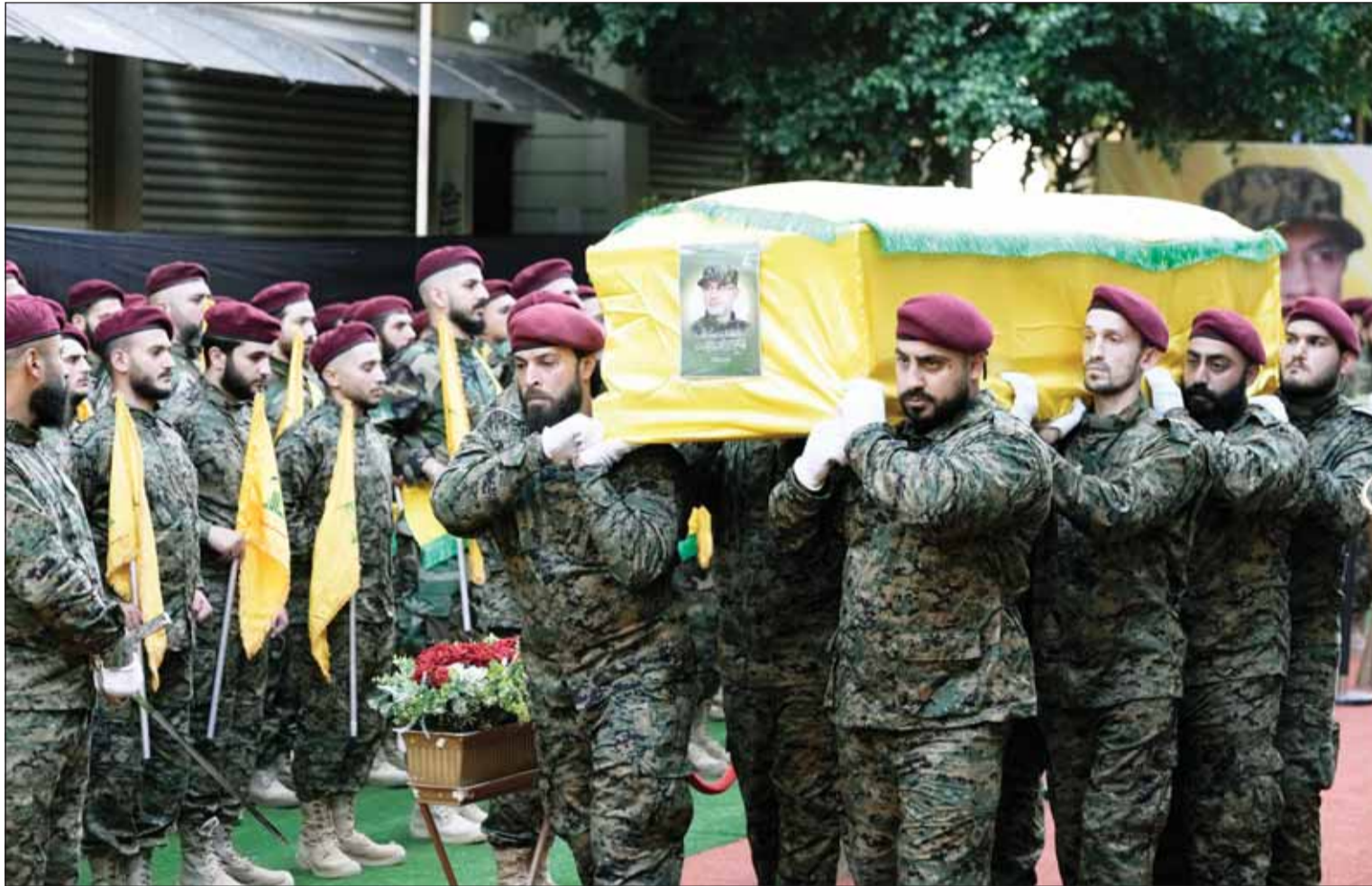
أعضاء "حزب الله" يحملون نعش القائد العسكري في الحزب إبراهيم عقيل خلال موكب جنازته في الضاحية الجنوبية لبيروت أمس

■ بيروت، عواصم - وكالات، بتصعيد هو الأعنف منذ اندلاع المواجهات بين "حزب الله" وجيش الاحتلال الإسرائيلي، بات لبنان قاب قوسين أو أدنى من الحرب الشاملة التي تهدد المنطقة برمتها، حيث تبادل الطرفان موجات من القصف الصاروخي لم توفر مكانا في لبنان أو دولة الاحتلال الإسرائيلي، وامتدت مواجهات ليل أول من أمس وأمس لتعسكر كل القواعد وتضرب كل الخطوط الحمر، وسط ارتفاع وتيرة التحذيرات من الانفراط في حرب شاملة ستقود تمنا إلى صراع إقليمي واسع وفق جميع المراقبين للتطورات الميدانية.