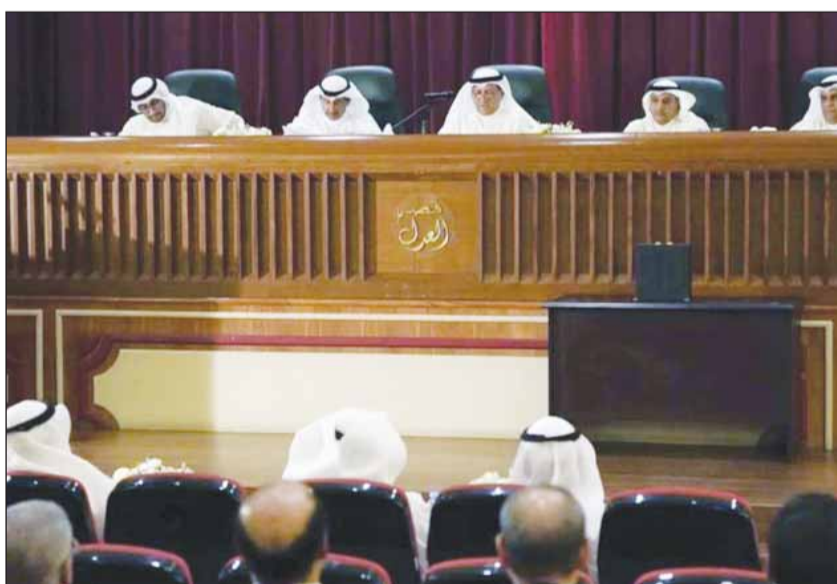
المستشار د. عادل بورسلي مع متحدثاً في اجتماع الجمعية العامة لمحكمة التمييز

وقال بورسلي: "يطيب لي دوماً أن أسجل باسمكم الشكر والتقدير لما تقدمه الدولة من دعم مادي ومعنوي للقضاء وأعضائه تحت رعاية سمو الأمير الشيخ مشعل الأحمد، وسمو ولي عهده الأمين الشيخ صباح الخالد لكويت وشعبها ذفراً وسنداً"، متوجهاً بخلص الشكر لوزارة العدل وعلى رأسها الدكتور محمد الوسمي وزير العدل ووزير الأوقاف والشؤون الإسلامية - على جهوده الطيبة ومساعيه الجادة الرامية إلى دعم مسيرة العدالة متمنين له دوام التوفيق والسداد، والشكر موصول إلى وكيل وزارة العدل والوكلاء المساعدين وكافة العاملين بالوزارة.