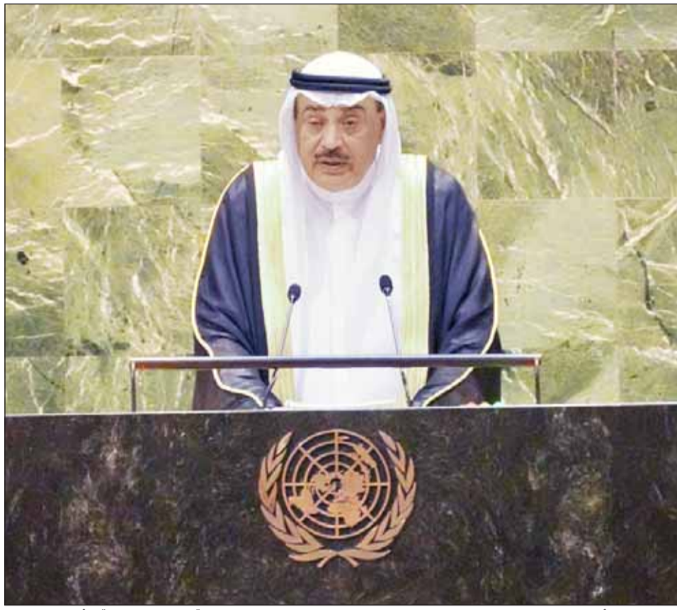
ممثل سمو الأمير سمو ولي العهد الشيخ صباح الخالد لدى إلقائه كلمة الكويت في "قمة المستقبل" بالأمم المتحدة

■ نيويورك - كونا، فيما اعتبر "ما يحدث في فلسطين من إبادة جماعية راح ضحيتها أكثر من 41 ألف فلسطيني غالبية من النساء والأطفال وعجز مجلس الأمن عن إيقاف هذا العدوان مثلاً قاطعاً موسفاً على نهج الكيل بمكيالين في تطبيق القانون الدولي.. الذي يجب ألا يكون له مكان في مستقبلنا حتى لا نزلق إلى عالم تسوده سياسة القاب"، أكد ممثل سمو أمير البلاد الشيخ مشعل الأحمد سمو ولي العهد الشيخ صباح الخالد " أننا مطالبون اليوم بالعمل على إدخال تغييرات جادة وعملية في منظومة الحوكمة الاقتصادية العالمية وشبكات الأمان المالي والتعاون الضريبي الدولي وإصلاح المصارف الإنمائية المتعددة الأطراف ومعالجة مشكلة الديون السيادية". وقال سموه في كلمة دولة الكويت التي القاها أمس خلال أعمال "قمة المستقبل" بمقر منظمة الأمم المتحدة في مدينة نيويورك، "تابعنا جميعاً وبشكل مستمر التحديات التي تواجهها الدول النامية والأقل نمواً ولعل ما يأتي من بين هذه التحديات العابرة للحدود تلك المتعلقة بالتنمية".