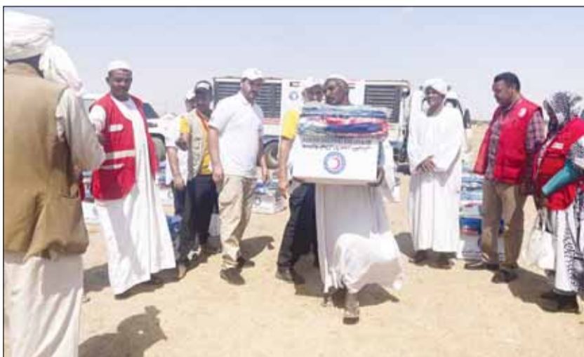
جانب من توزيع المساعدات