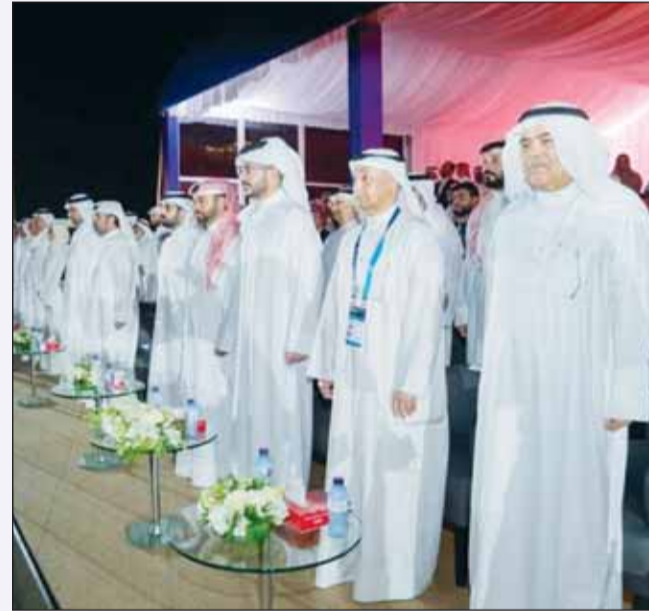
جانب من افتتاح مونديال الغطس

■ افتتحت أول من أمس، بطولة العالم للغطس العالي، والتي تنظمها اللجنة الأولمبية البحرينية بالتعاون مع الاتحاد البحريني للألعاب المائية في البحرين هاربور، وذلك برعاية سمو الشيخ ناصر بن حمد آل خليفة ممثل جلالة ملك مملكة البحرين للأعمال الإنسانية وشؤون الشباب وبحضور سمو الشيخ خالد بن حمد النائب الأول لرئيس المجلس الأعلى للشباب والرياضة ورئيس الهيئة العامة للرياضة رئيس اللجنة الأولمبية البحرينية ورئيس الاتحاد الدولي للألعاب المائية مدير عام المجلس الأولمبي الآسيوي د. حسين المسلم، بدوره، أعرب سمو الشيخ خالد بن حمد عن خالص شكره وامتنانه إلى سمو الشيخ ناصر بن حمد آل خليفة ممثل جلالة الملك للأعمال الإنسانية وشؤون الشباب على رعاية سموه الكريمة لهذا الحدث، كما توجه بالشكر الجزيل للاتحاد البحريني للألعاب المائية برئاسة د. حسين المسلم على تقهّم بمملكة البحرين لاستضافة البطولة لأول مرة.