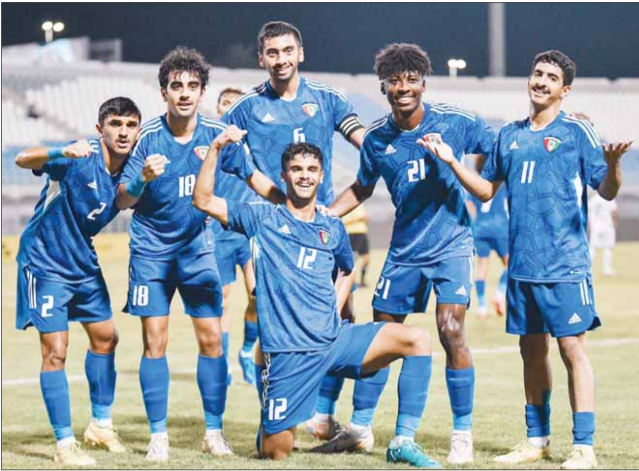
الأزرق يلتقي الشمشون الكوريه فيه مشرف

ويعلم أيضا أن لاعبي الأزرق لديهم القدرة والإمكانات لتحقيق نتيجة ومواصل المنافسة على حيز مقعد للتلألؤ إلى النهائيات، في حال طبقوا ونفذوا جميع التعليمات واتباعوا ما هو مطلوب منهم. وفي المباراة الأخرى، يبحث المنتخب الإماراتي عن