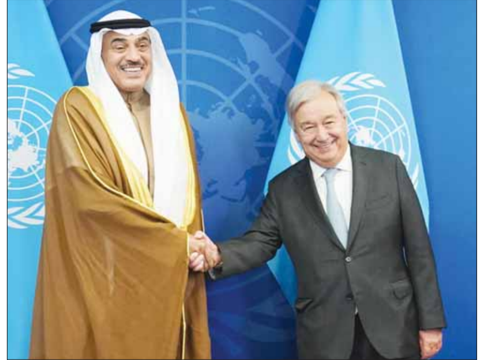
ممثل سمو الأمير سمو ولي العهد الشيخ صباح الخالد لادم لقاؤه الأمين العام للأمم المتحدة أنطونيو غوتيريش

ممثل سموه بحث مع أمينها العام في الشراكة القوية وأكد ضرورة التكاتف لتطوير أعمالها