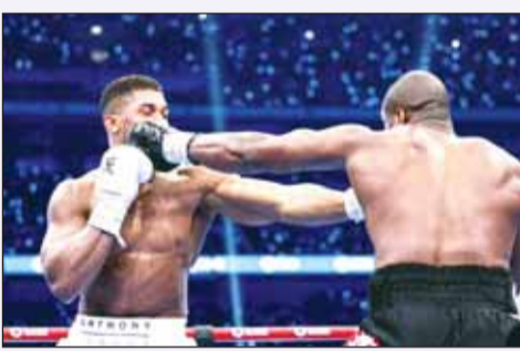
دوبوا تغلب على جوشوا

حافظ الملاكم البريطاني دانييل دوبوا على لقبه في الوزن الثقيل للاتحاد الدولي للملاكمة "IBF"، حينما أسقط منافسه أنتوني جوشوا أكثر من مرة في جولات النزال. أنهى دوبوا النزال بالضربة القاضية في الجولة الخامسة، في الحدث الذي احتضنه ملعب ويمبلي في لندن العاصمة البريطانية، السبت، وسط حضور 96 ألف متفرج.