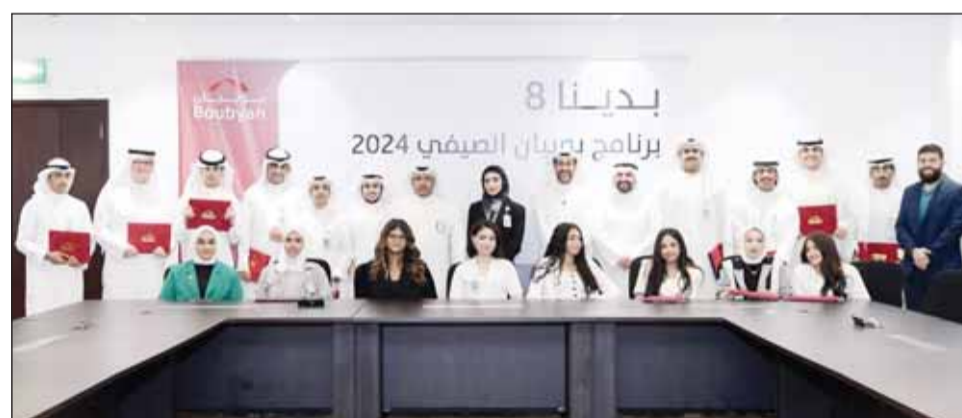
صورة جماعية لخريجي البرنامج التدريبي مع قياديين بوبيان

من استجيبات تأثير التطورات التكنولوجية المتسارعة على فرص النمو واستكشاف الممارس الرئيسية للنمو في ظل التحولات الرقمية. مشيرًا إلى أنه ومع احتفاء البرنامج، يُمكننا القول إننا قدمنا للمشاركين فرصة فريدة لتعزيز مهاراتهم وإطلاق العنان لقدراتهم، تمهيداً لمزيد من النجاحات والتفوق، كما نؤكد التزام بنك بوبيان الدائم بتوفير فرص تعليمية استثنائية تسهم في تأهيل الجيل القادم بالمهارات المستقبلية.