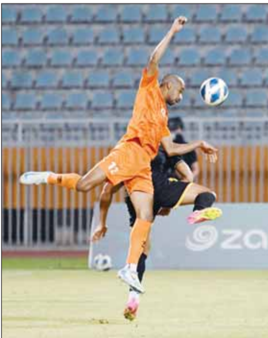
تبادل سلبية بين الأصفر والبرتغالي بدوري زين

تقدم الكرواتي دومينيك ليفاكوفيتش لجالاا سراي (20ق) بتسجيله لهدف بالخطأ في مرماه، قبل أن يضيف البلجيكي ديريس ميريتيز الهدف الثاني للضيوف (28ق) بعدما استقبل الكرة من فيكتور أوسيمين، ثم يستكمل البرازيلي جابريل سارا الثلاثية (60ق) من تمريرة للأوروغواي لوкас توريرا. وبعدها قلص فريقه النتيجة بهدف من ركلة جزاء سجلها اليوسني إدين دجيكو (63ق). وبهذه النتيجة يبعد فريقه بخمس نقاط عن غلطة سراي صاحب الصدارة.