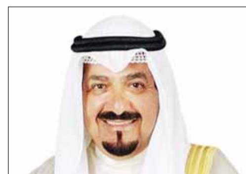
سمو رئيس الوزراء الشيخ أحمد العبدالله

بعث سمو الشيخ أحمد العبدالله رئيس مجلس الوزراء ببرقية تهنئة إلى خادم الحرمين الشريفين الملك سلمان بن عبدالعزيز ملك المملكة العربية السعودية الشقيقة ضمنها سموه خالص تهنائه بمناسبة ذكرى اليوم الوطني للمملكة العربية السعودية الشقيقة. كما بعث سموه ببرقية تهنئة إلى العقيد أسيمي غويتا الرئيس الانتقالي لجمهورية مالي الصديقة بمناسبة العيد الوطني لبلاده.