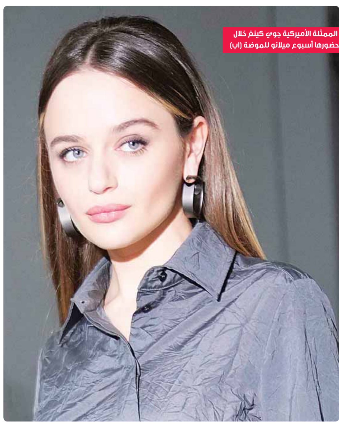
الممثلة الأميركية جوي كينغ خلال حضورها أسبوع ميلانو للموضة

الحق علينا في التقصير مع وزراء، حاليين وسابقين، ومبشرين قادمين!