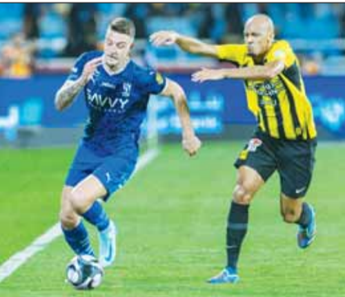
رقم جديد للزعيم بفوزه على الاتحاد

■ تجاوز نادي الهلال عدد المباريات المتتالية التي يتفوق فيها على خصمه في "الكلاسيكو" أندية ريال مدريد وبايرن ميونخ وبايرس سان جيرمان، بعد فوزه على منافسه الاتحاد للمباراة الثامنة تواليًا أول من أمس.