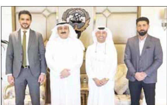
وزير الصحة د. أحمد العوضي مع مجلس إدارة جمعية أطباء الأسنان