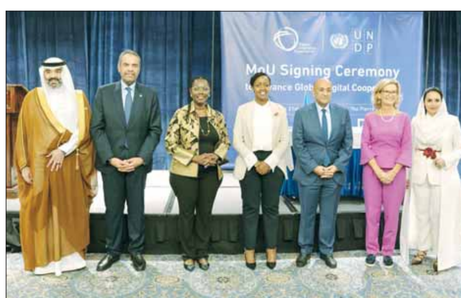
وزير الخارجية عبدالله الجحيا لادم مشاركته في الحفل

شارك وزير الخارجية عبدالله الجحيا في حفل استقبال رفيع المستوى حول تعزيز التعاون الرقمي من أجل الازدهار أقيم مساء السبت على هامش أعمال الأسبوع رفيع المستوى للجمعية العامة للأمم المتحدة في دورتها الـ79 بمدينة نيويورك بدعوة مشتركة من قبل كل من الأمين العام لمنظمة التعاون الرقمي ديمه الجحى ورئيس اللجنة التنفيذية للمنظمة ومحافظ هيئة الحكومة الرقمية في المملكة العربية السعودية أحمد السويان. وقالت وزارة الخارجية في بيان، أمس، إنه تم خلال الحفل مناقشة القضايا المتصلة بالتعاون الرقمي وتعزيز الشراكة بين الدول الأعضاء في المنظمة وبحث أطر دعم تبادل الخبرات وبناء القدرات في مجالات الاقتصادات الرقمية وتوظيف التكنولوجيا والمساعدية المشتركة نحو مستقبل رقمي يخدم أهداف التنمية المستدامة.