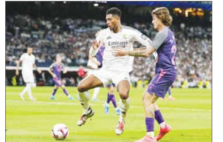
يبلغهام شتم الحكم مونتيرا

■ أثار جود بلنغهام لاعب ريال مدريد الإسباني جدلاً كبيراً بعدما التقطته الكاميرات أثناء سبائه حكم مباراة فريقه أمام إسبانيول أول من أمس، ضمن منافسات الدوري الإسباني.