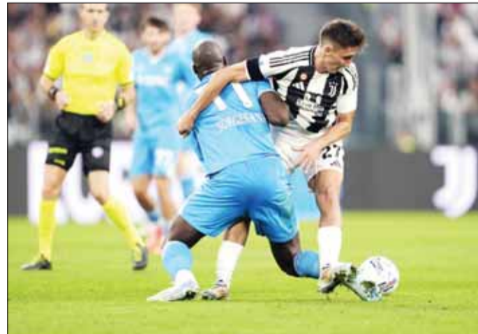
يوفنتوس ونابولي جباب

■ واصل يوفنتوس، نتاجته السلبية في الدوري الإيطالي، بعد التعادل مع نابولي، من دون أهداف أول من أمس، على ملعب أليانز ستادיום، ضمن مباريات الجولة الخامسة للكالتشيو.