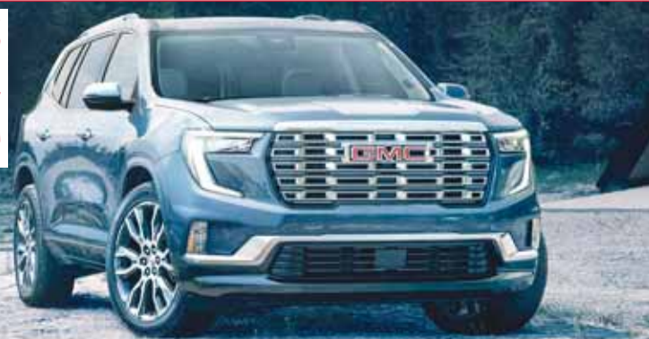
جيه أم سي أكاديا دينالي