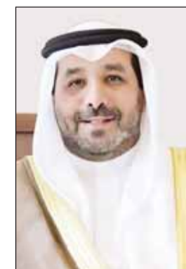
الشيخ صباح الناصر

الرياض - (كونا)، هنا سفير دولة الكويت لدى السعودية الشيخ صباح ناصر الاحمد أمس قيادة المملكة بحلول ذكرى اليوم الوطني الـ94 مؤكداً أنه مناسبة عزيزة وغالية أيضاً على الكويتيين. وقال الشيخ صباح الناصر في تصريح له (كونا) بهذه المناسبة "تهنئ أنفسنا باليوم الوطني السعودي فالكويت والسعودية توأمان لا ينفصلان ويسيران في طريق المجد سوياً بخطوات واحدة وثابتة".