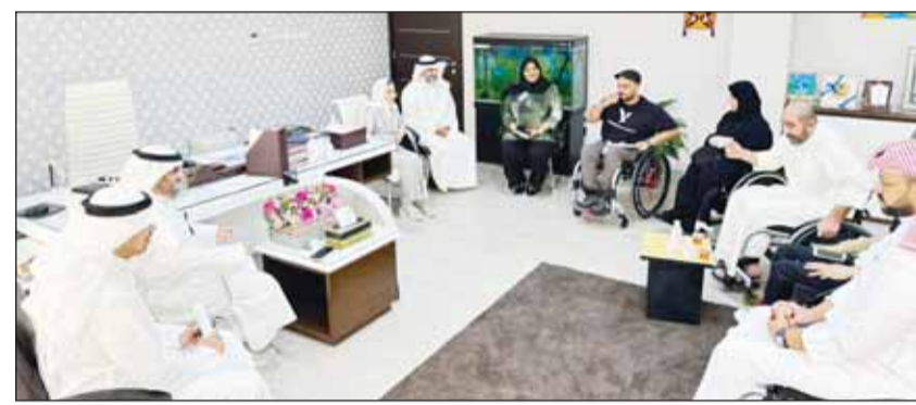
الوزير د. أمثال الدولية لدم لغائها عدد عد من ذوي الاحتياجات الخاصة ونهيمهم

■ استقبل وزير العدل وزير الاوقاف والشؤون الاسلامية د. محمد الوسمي صباح أمس، في مكتبه بمجمع الوزارات، عدداً من المواطنين والموظفين. واستمع الوزير الوسمي الى شكاواهم ومقترحاتهم والمعوقات التي تواجههم. ووجه الى الارتقاء بجودة الخدمات المقدمة للمواطنين والموظفين وتذليل المعوقات كافة.