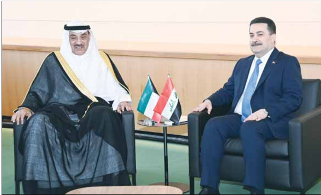
... ورئيس الوزراء العراقي محمد السوداني