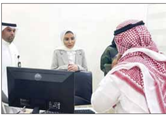
... وتسلمتم إليه وليه أمر خلال اللقاء