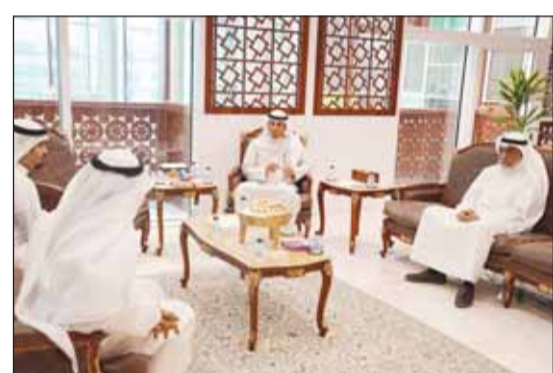
الوزير د. محمد الوسمي لدم استقبله المواطنين والموظفين

■ استقبل وزير العدل وزير الاوقاف والشؤون الاسلامية د. محمد الوسمي صباح أمس، في مكتبه بمجمع الوزارات، عدداً من المواطنين والموظفين. واستمع الوزير الوسمي الى شكاواهم ومقترحاتهم والمعوقات التي تواجههم. ووجه الى الارتقاء بجودة الخدمات المقدمة للمواطنين والموظفين وتذليل المعوقات كافة.