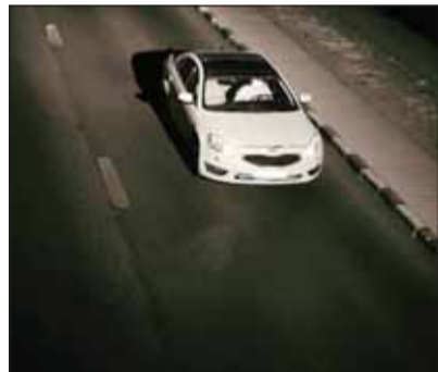
رصد مخالفات حزام الأمان واستخدام الهاتف بدقة

أكد رئيس قسم كاميرات الضبط المروري بالادارة العامة للمرور عبدالرحمن الرشيدي البدء في أعمال تركيب منظومة كاميرات الرصد الآلي لمخالفات عدم ربط حزام الأمان واستخدام الهاتف باليد أثناء القيادة تحت إشراف مباشر من وكيل وزارة الداخلية المساعد لشؤون المرور والعمليات اللواء يوسف الخدة، لافتاً إلى ان العدد الاجمالي 152 كاميرا موزعة على جميع الطرقات. وأوضح ان هذه الخطوة تأتي تنفيذاً لتوجيهات وتعليمات النائب الأول لرئيس مجلس الوزراء وزير الدفاع وزير الداخلية الشيخ فهد اليوسف بمواكبة أحدث التطورات التكنولوجية من خلال توظيف تقنيات الذكاء الاصطناعي والتقنيات الحديثة في عمليات الرصد الآلي للمخالفات للحد من نسبة الحوادث المرورية وزيادة معدلات السلامة والأمان على شبكة الطرق. وقال الرشيدي في لقاء مع "السياسة"، إن الكاميرات الجديدة مزودة ببرنامج ذكاء اصطناعي وتلتقط صوراً عالية الدقة في أي وقت من النهار أو الليل وفي جميع ظروف حركة المرور والطقس، لافتاً إلى ان الكاميرات تعمل باستخدام تقنية الذكاء الاصطناعي لتقنية الصور والكشف عن احتمال استخدام السائق للهاتف المحمول، أو عدم ارتداء حزام الأمان أو جلوس طفل في المقعد الامامي للمركبة وتقوم تلك التقنية تلقائياً بمراجعة الصور التي تلتقطها الكاميرات والتحقق من وجود مخالفة محتملة من عدمه. وكشف الرشيدي عن تركيب 100 كاميرا مرورية جديدة لرصد مخالفتي (حزام الامان) و(استخدام الهاتف) أثناء القيادة قريباً، مشدداً على ضرورة التزام قائدي المركبات بقوانين المرور حفاظاً على سلامتهم وسلامة مرتادي الطريق. وأشار إلى ان عدد كاميرات السرعة الموزعة على جميع الطرقات يبلغ 243 كاميرا، في حين هناك 250 كاميرا بالاشارات الضوئية، وفيما يلي تفاصيل اللقاء.