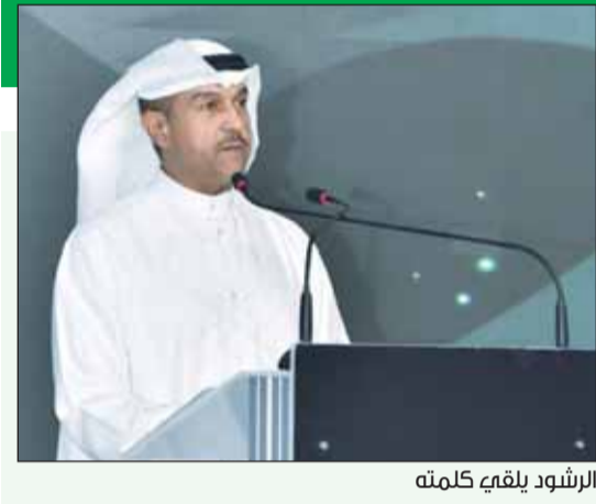
الرشود يلقيه كلمته