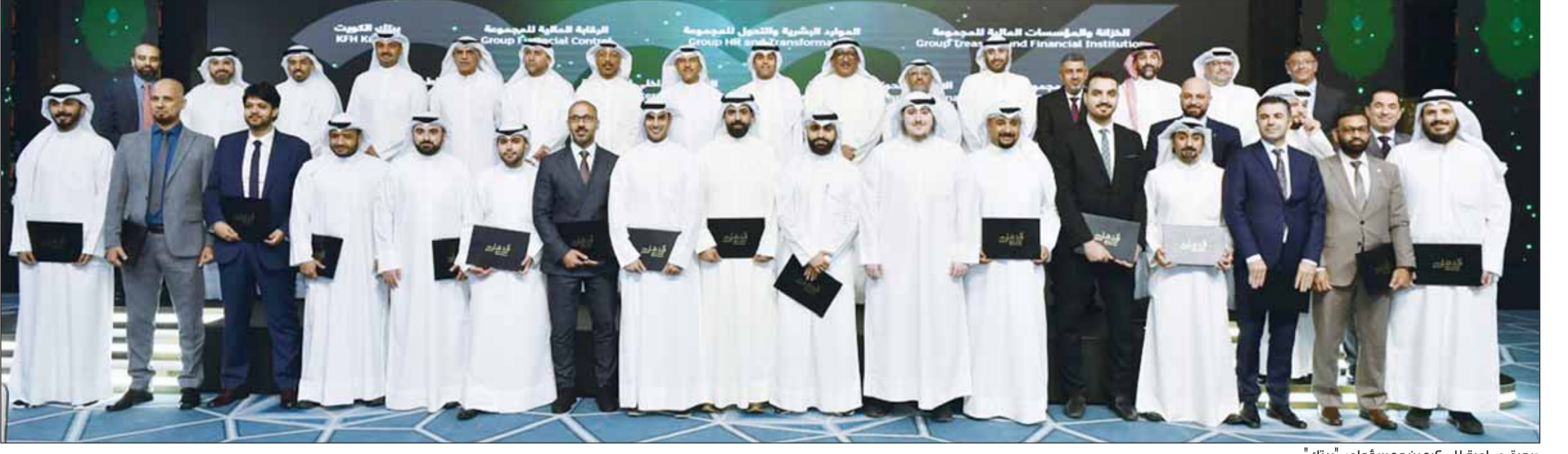
صورة جماعية للمكرمين ومسؤولي "بيتك"