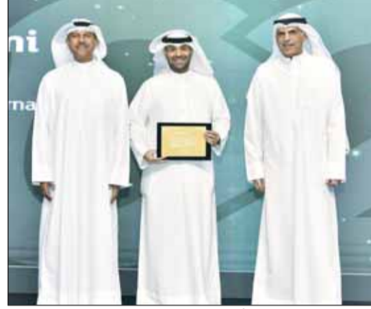
الرشود والشايع يكerman أحد الموظفين