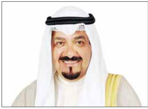
سمو الشيخ أحمد عبدالله

■ بعث سمو أمير البلاد الشيخ مشعل الأحمد ببرقية تهنئة إلى أنورا كومارا ديسانايكي الرئيس المنتخب في جمهورية سريلانكا الديمقراطية الاشتراكية الصديقة، عبر فيها سموه عن خالص تهانیه بمناسبة فوزه بالانتخابات الرئاسية في جمهورية سريلانكا، متمنياً سموه له كل التوفيق والسداد وموفقو الصحة والعافية ولجمهورية سريلانكا الديمقراطية الاشتراكية وشعبها الصديق المزيّد من الرقي والازدهار.