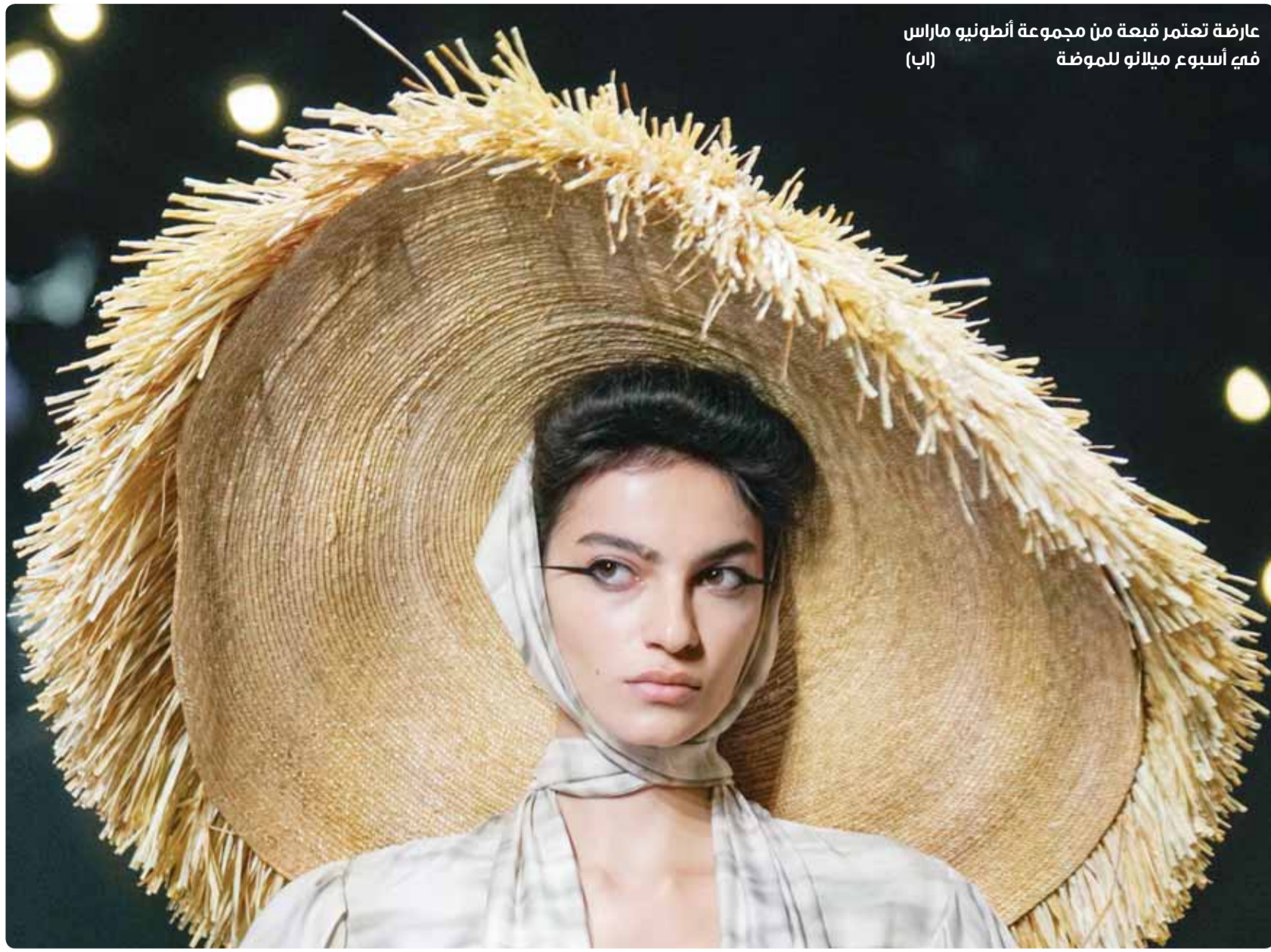
عارضة تتعلم قبعة من مجموعة أنطونيو ماراس في أسبوع ميلانو للموضة

أعلم أن هذا الطرح فيه بعض الجنون، لكن علينا كلنا، إذا كنا نحب لبنان فعلاً، أن نعمل لوقف نزيف الدم والدمار الذي يعيشه منذ خمسين عاماً، ولا بد لأحد أن يقول: كفى، حتى لو عض على جرحه، فحرب بلده أكبر، ومصيره في مهب الريح.