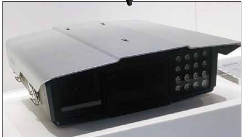
أحد نماذج الكاميرات الجديدة