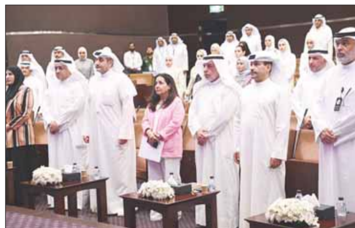
المشاركون في أعمال الملتقى ووقوفاً أثناء السلام الوطني

والتصرفات المالية قبل اتخاذ القرار الخاص بالارتباط وتمتد لتشمل المناقصات والممارسات الخاصة بالتوريد والخدمات والأشغال العامة. وأضاف، نسعى إلى أداء دورنا كرقباء فاعلين ضمن من خلاله نزاهة وكفاءة استخدام المال العام وتعزيز الأداء الحكومي وتحقيق التنمية المستدامة للحد من الهدر بالموارد وزيادة الإيرادات وتنوعها.