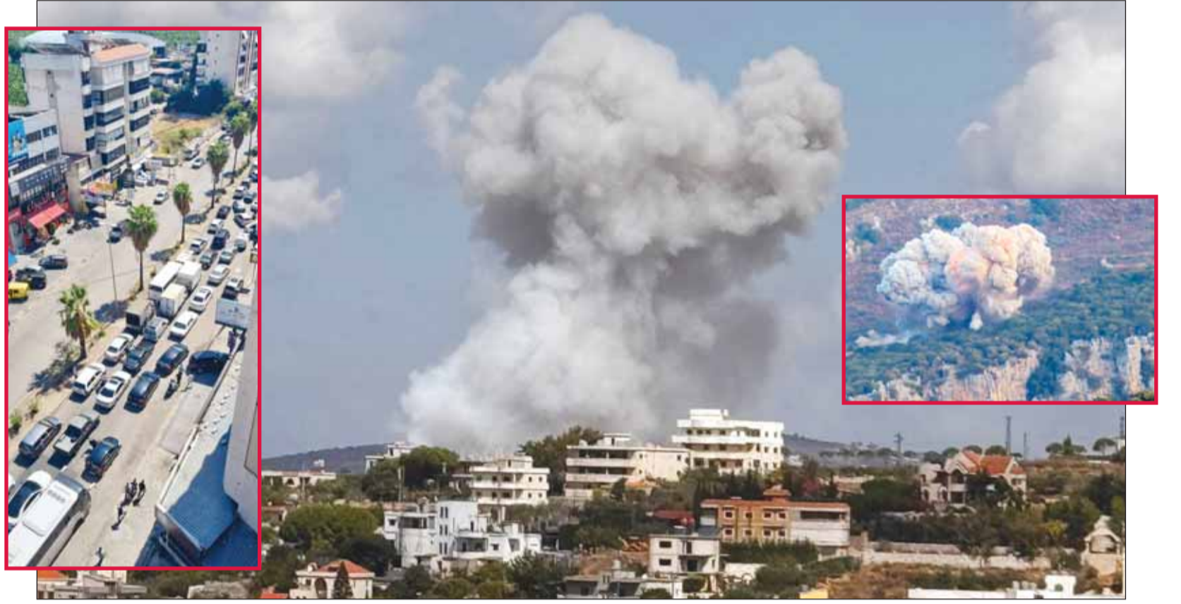
انفجارات بصواريخ إسرائيلية في الجنوب اللبناني وحركة نزوح كثيفة

للتواصل مع رئيس التحرير عبر "فيسبوك" و"إكس" Ahmed aljarallah @Ahmedaljarallah