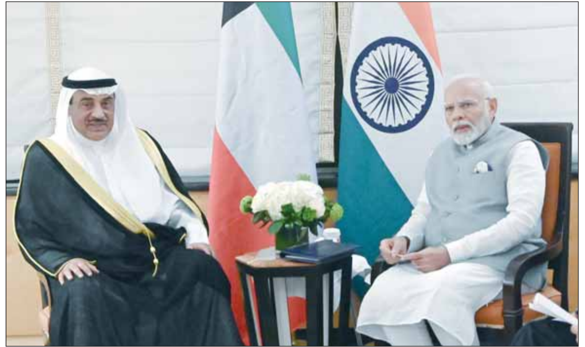
ممثل سمو الأمير سمو ولي العهد الشيخ صباح الخالد خلال لقائه رئيس الوزراء الهندي ناريندرا مودي