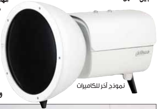
نموذج آخر للكاميرات

■ ادعو جميع مستخدمي الطريق إلى الالتزام بقواعد السير والموافاة على سلامتهم وسلامة الآخرين، والمساهمة في الجهود الكبيرة التي تبذلها وزارة الداخلية، فالسلامة المرورية مسؤولية مشتركة بين الوزارة وأفراد المجتمع.