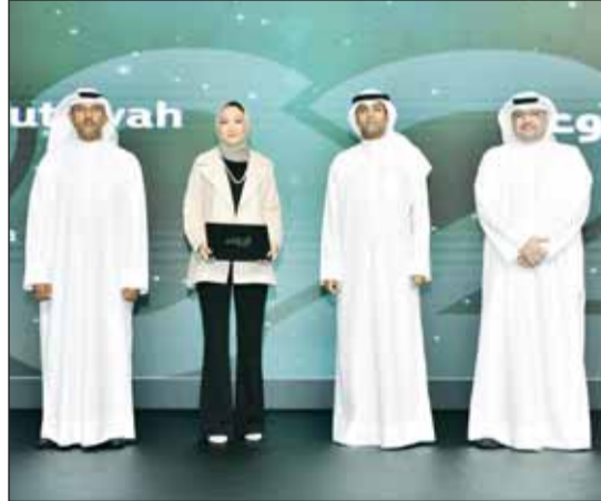
الرشود والشعلان والرويح يكرمون إحد الموظفين