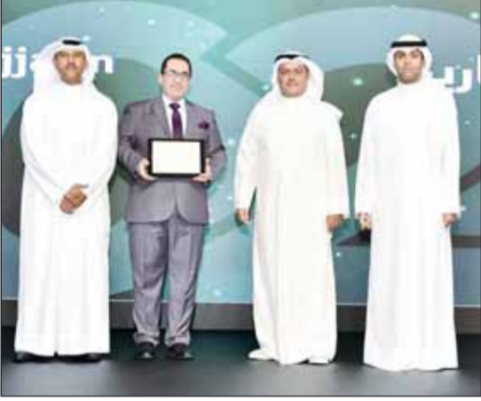
الرشود والشعلان والزعابي يكرمون موظف "بيتك"