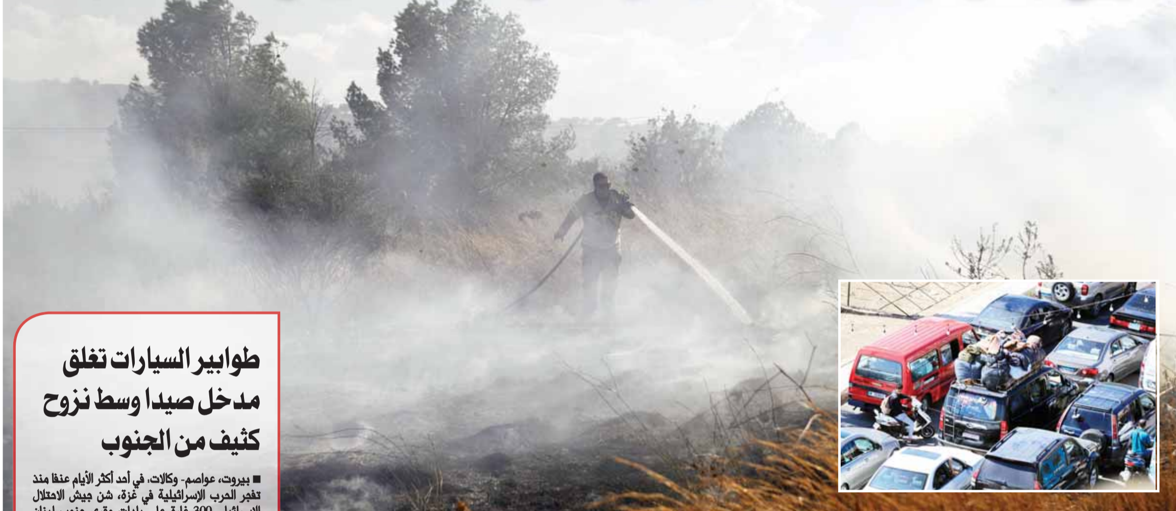
إطفائيون إسرائيليون يعملون على إخماد حريق ناجم عن صاروخ أطلق من لبنان وأصاب بلدة كاحال شمال دولة الاحتلال وفيه الإضرار حامي في مدخل مدينة صيدا اللبنانية بعشرات السيارات لغارن من جحيم الجنوب (أ ب)