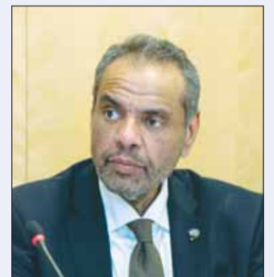
وزير الخارجية عبدالله الجحيا

نيويورك - كونا، شارك وزير الخارجية عبدالله الجحيا في أعمال الاجتماع التنسيقي لوزراء خارجية دول مجلس التعاون لدول الخليج العربي الذي عقد أمس، على هامش أعمال الأسبوع رفيع المستوى للجمعية العامة للأمم المتحدة في دورتها 79 بمدينة نيويورك. وتم خلال الاجتماع مناقشة أطر تعزيز التعاون والتنسيق المشترك بين دول المجلس للتحضير للاجتماعات الوزارية التي ستعقد مع عدد من وزراء خارجية الدول والتكتلات الدولية على هامش اجتماعات الجمعية