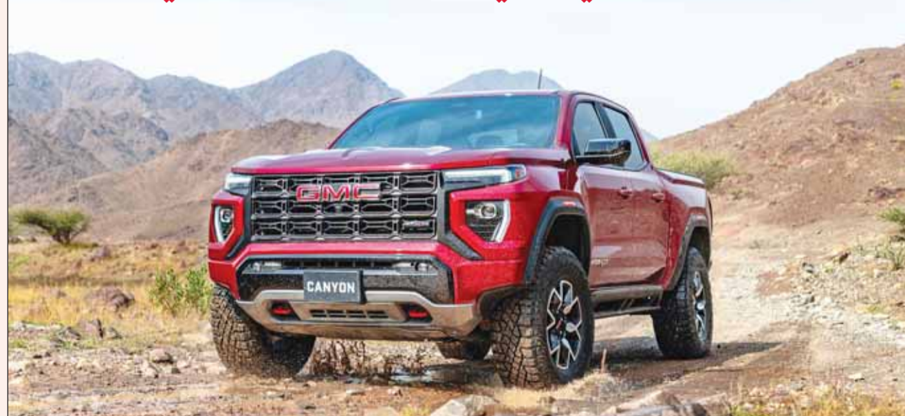
جيه أم سي كانيون