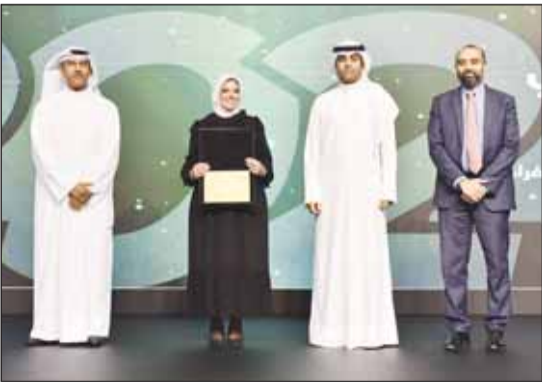
تكريم لإحدى الموظفين