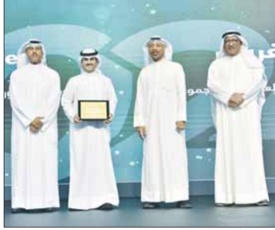
الرشود وأبو الهوس والتركيث مع موظف مكرم