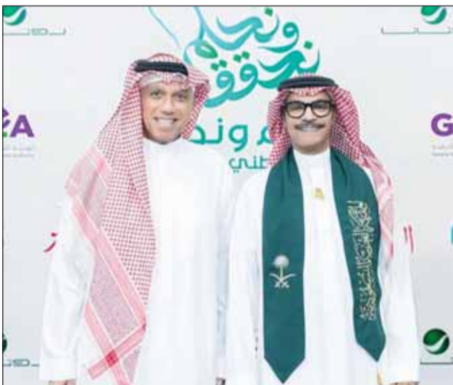
استقبال رابع صقر في الرياض

منها "غربة زمن"، و"غرام أطفال"، وعاش الجمهور لحظات طريفة مع أداء رابع صقر لأغنية "ليلة ما تفرقتنا"، وعاد وأشعل المسرح مجدداً بأغنية "ضعفي محبة"، وتلقى صقر الأغنية الخليجية في تقديم واحدة من أنجح الأغاني التي قدمها في الفترة الماضية أغنية "العباة الرهيبة"، التي تعد من الأعمال التي تحمل ذكريات للجمهور السعودي وشهادة على التنوع الموسيقي في المملكة. كذلك شهدت مدينة شقراء حفلاً غنائياً ضمن احتفالات اليوم الوطني 94، حيث أحيها الفنانان الدكتور عبدالله رشاد والدكتور عبادي الجوهر على مسرح المهندس محمد البواردي، برعاية الهيئة العامة للترفيه GEA وبتنظيم شركة بنش مارك. بدأ الحفل بأداء رافع من الفنان الدكتور عبدالله رشاد، الذي افتتحه بالنشيد الوطني، ما أضفى أجواء من الفخر والاعتزاز بين الحضور. ثم قدم رشاد مجموعة متنوعة من أعماله الغنائية التي نالت إعجاب الجمهور، بما في ذلك أغنية "استاذ عشق" و"ملاك يا غالي". وعبر الفنان عبدالله رشاد "عن سعادته للمشاركة في احتفالات اليوم الوطني 94، وأن هذه المناسبة تعني لنا