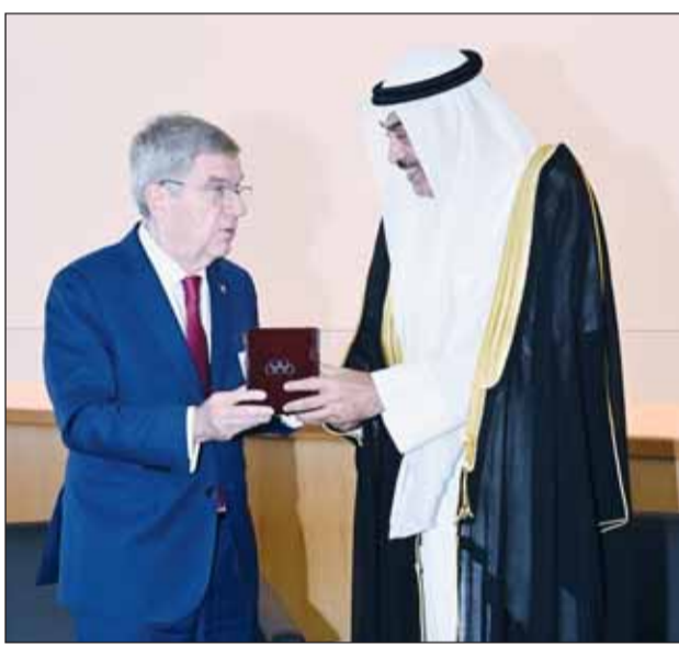
سمو ولي العهد ورئيس اللجنة الأولمبية الدولية توماس باخ

استقبل ممثل سمو أمير البلاد الشيخ مشعل الأحمد، سمو ولي العهد الشيخ صباح الخالد أمس، رئيس اللجنة الأولمبية الدولية توماس باخ، وذلك على هامش قمة المستقبل في مقر منظمة الأمم المتحدة بمدينة نيويورك الأمريكية. وتم خلال اللقاء مناقشة سبل التعاون المشترك وتعزيز الروابط الرياضية المشتركة بالإضافة إلى دعم وتطوير اللجنة الأولمبية الكويتية بكافة المجالات بما يعود بالنفع على الرياضيين في دولة الكويت. حضر اللقاء وزير الخارجية عبدالله الجحيا ومدير عام هيئة تشجيع الاستثمار المباشر الشيخ الدكتور مشعل جابر الأحمد، ووكيل الشؤون الخارجية بديوان سمو ولي العهد مازن العيسى والمندوب الدائم لدولة الكويت لدى الأمم المتحدة السفير طارق البناي.