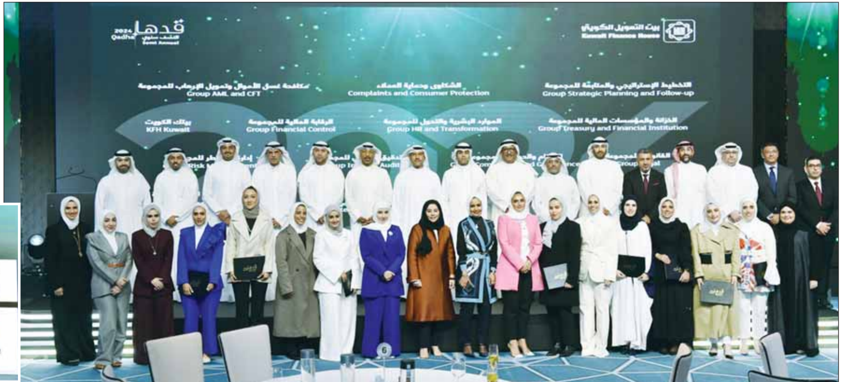
صورة جماعية للمكرمات ومسؤولي "بيتك"