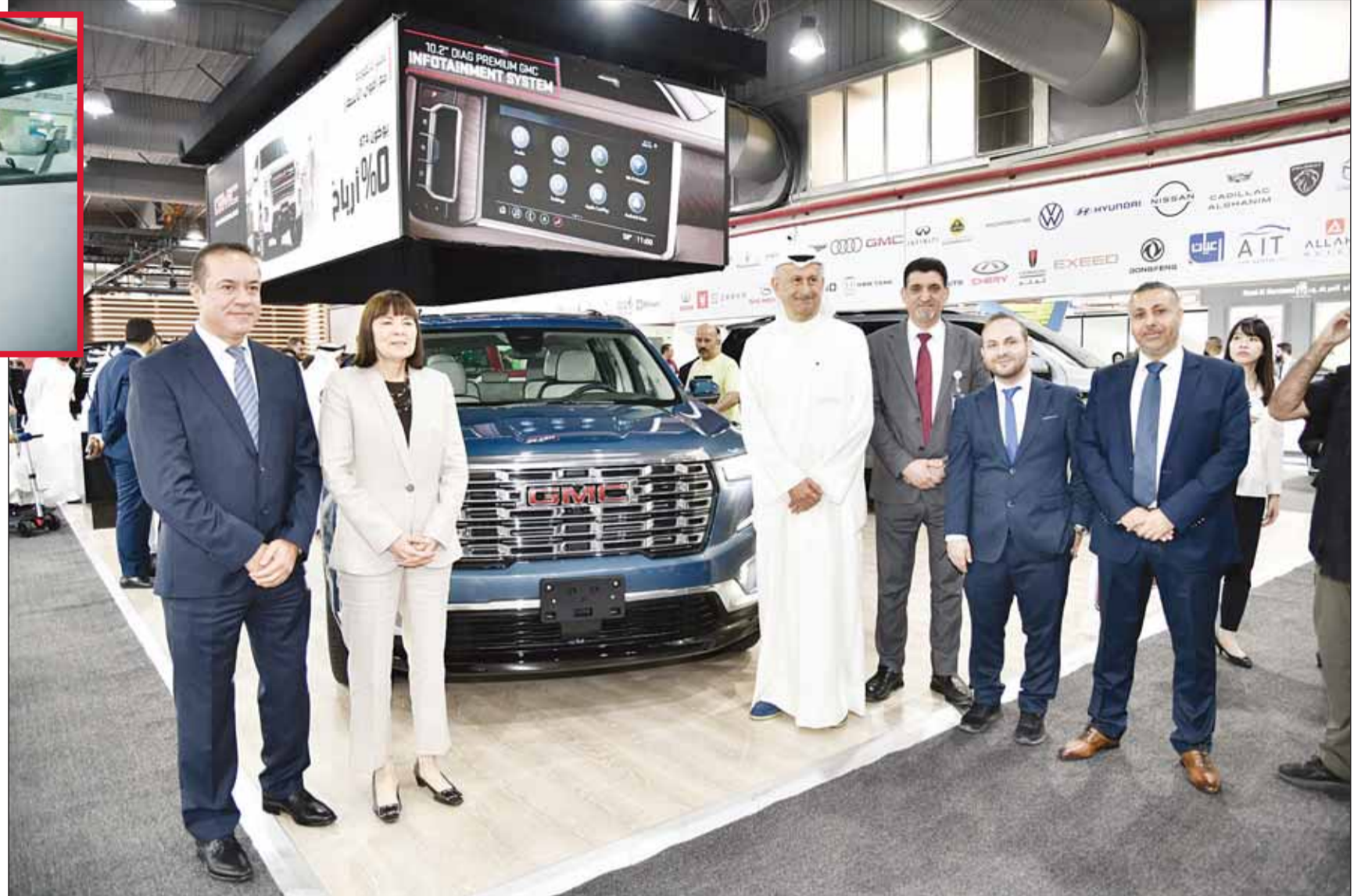
صورة جماعية مع السفيرة الأمريكية