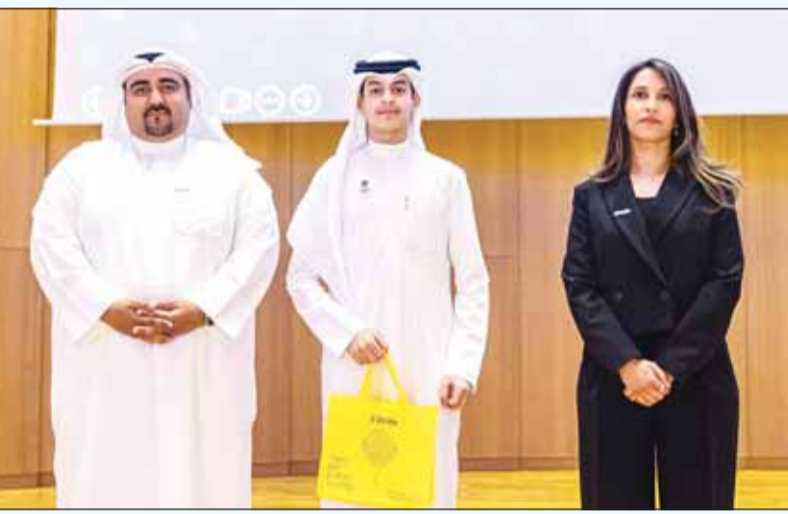
فريق زين مع أحد الطلبة

المهارات التي لا تقل أهمية عن المهارات البرمجية والتقنية التي تشكل جوهر مبادرة "الكويت تبرمج". تعتبر هذه المبادرة الأبرز من نوعها في البلاد، حيث تهدف إلى إنشاء جيل من الشباب الكويتي المتقدم تقنياً من خلال إتاحة الفرصة لطلبة وطالبات المرحلة الثانوية من المدارس الحكومية والخاصة لاكتساب المهارات البرمجية. وتشمل هذه المسارات تطوير المواقع، وتطوير لغة الجافا، وتطوير الألعاب، وتطوير تطبيقات الهواتف الذكية باستخدام لغة Flutter، كما تم إضافة مسارات الأمن السيبراني والدكاء الاصطناعي هذا العام لما لها أهمية في التقنيات المستجدة في عالم التكنولوجيا.