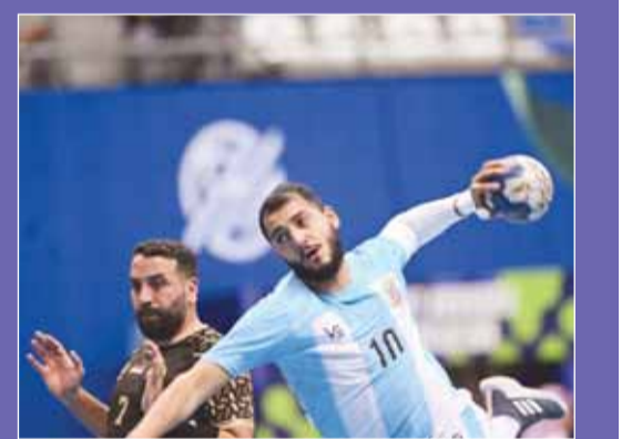
"السماوي" عبر الحشد لنصف النهائي